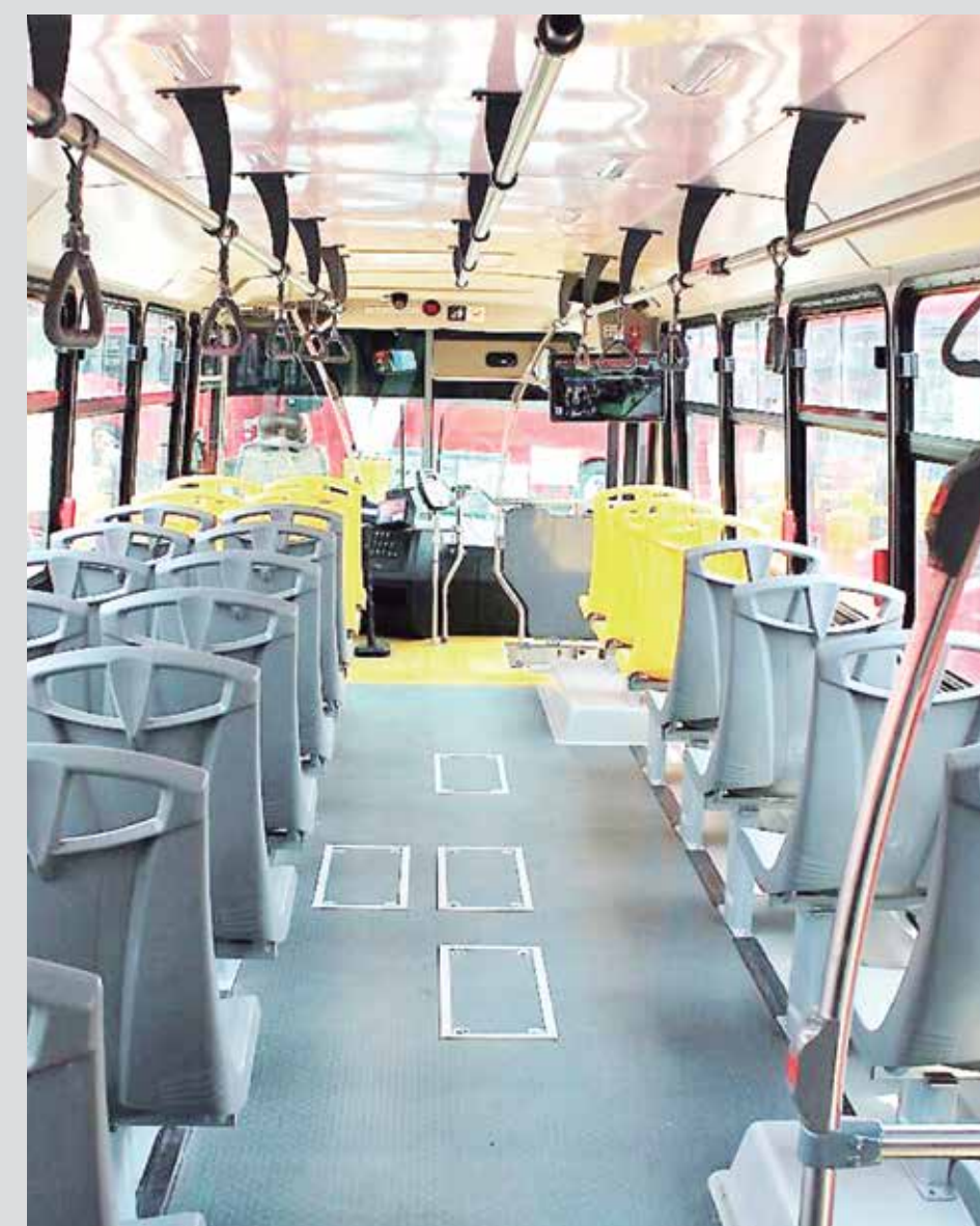
Interior de los nuevos camiones.