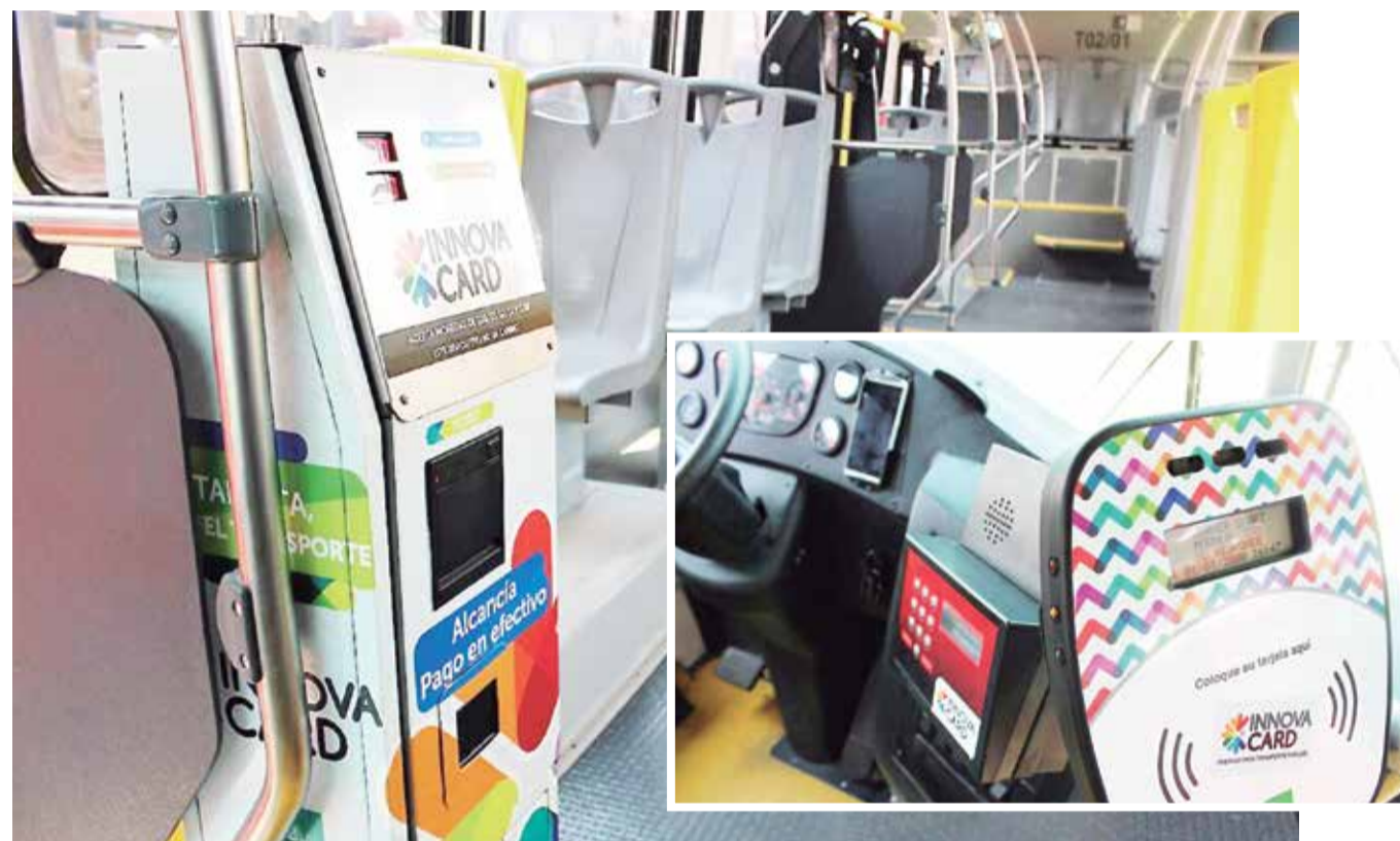
El aparato que recibirá la tarjeta y el pago en efectivo.