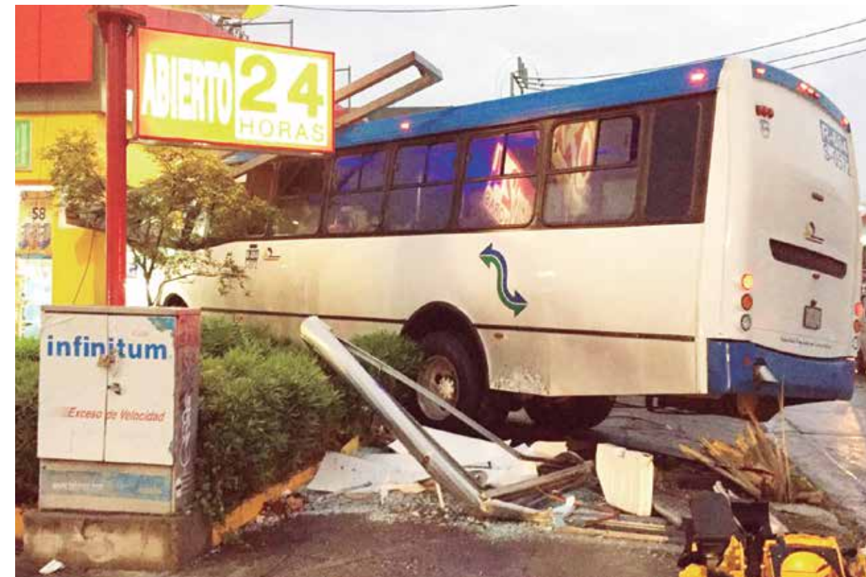
Durante los primeros cuatro años del sexenio que encabeza Aristóteles Sandoval la pérdida de vidas provocado por este transporte público deshumanizado prácticamente no disminuyó en relación a otros sexenios.