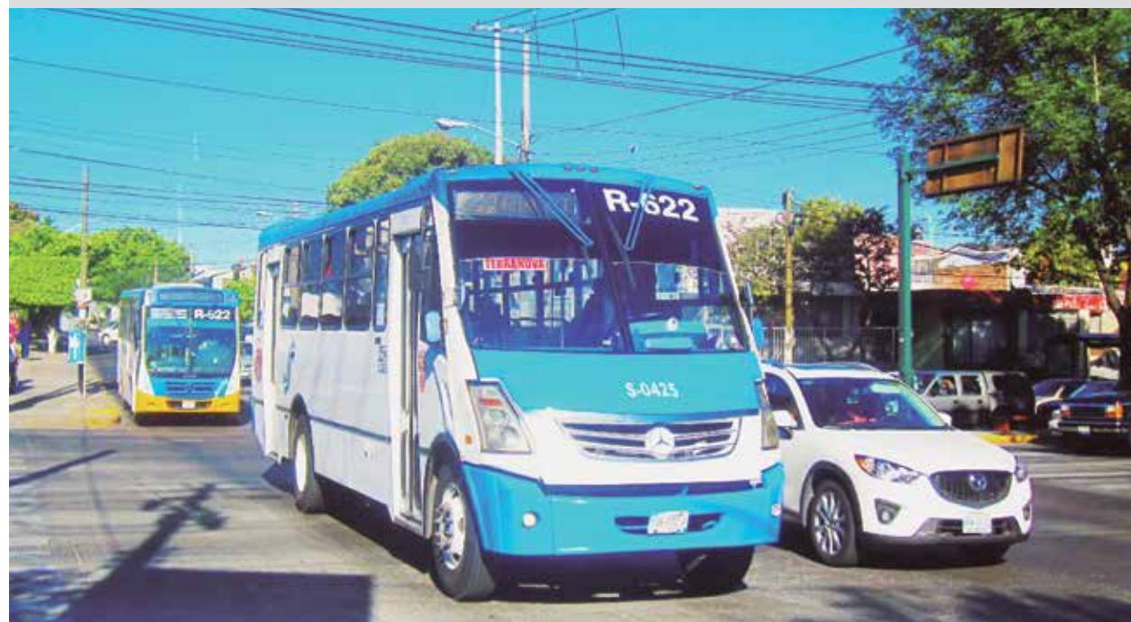
Una decisión fuerte que ha tomado el gobernador Aristóteles Sandoval es la desaparición de Sistecozome, que pertenece al Estado y junto con Servicios y Transportes suman una deuda de dos mil millones de pesos.

Aún no se definió el procedimiento que se seguirá para la desaparición de la paraestatal como Sistecozome, como es la liquidación, la fusión con otra empresa o se realiza una reestructuración de la misma.