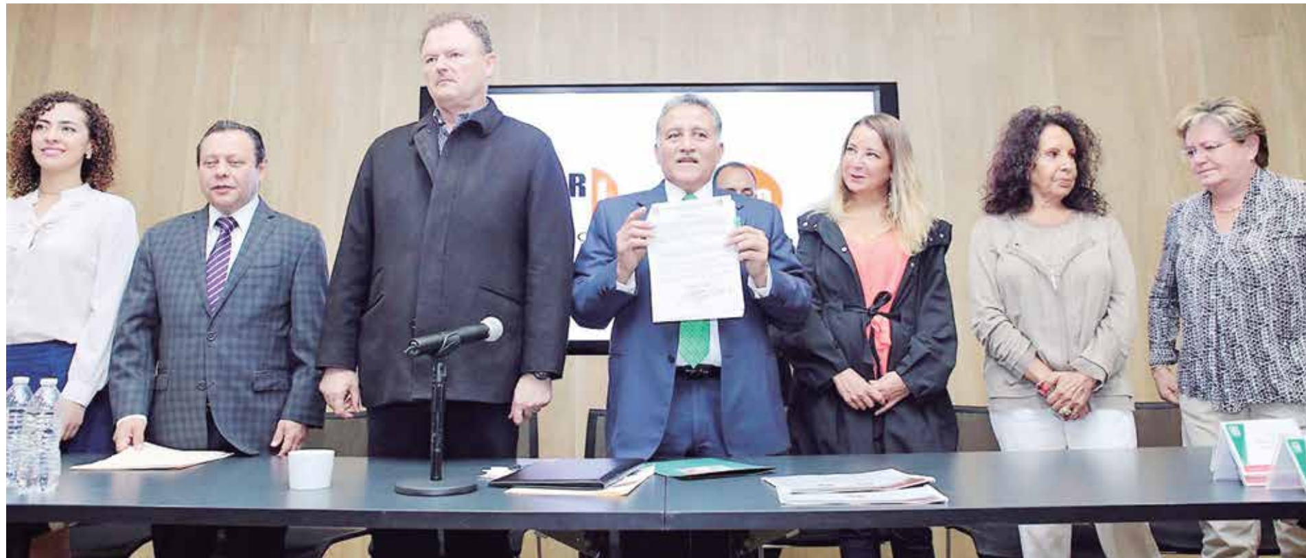
El senador Arturo Zamora, secretario general de la CNOP anunció que propondrá cambios a los documentos básicos del PRI para llamar a cuenta a militantes que como servidores públicos cometen actos de corrupción.

“En el PRI tomamos la decisión primero de limpiar la casa, para tener la calidad moral de denunciar”, afirma