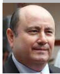
Por | Gabriel Ibarra Bourjac