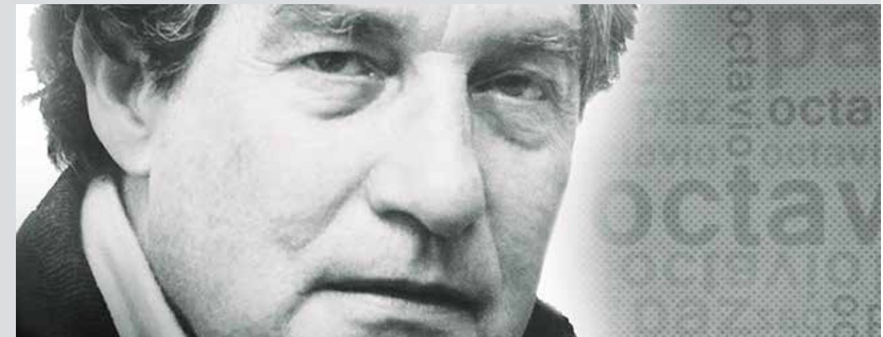
Algunos rasgos de nuestra cultura que describió desde 1950 Octavio Paz, en su exquisita obra El Laberinto de la Soledad (1950), prevalecen y deberían ser modificadas para vencer resistencias y transformar nuestra nación.

imaginación y la gran creatividad de la idiosincrasia mexicana, seguimos creyendo que la política es sólo una agencia de colocaciones, una ocupación de elites, ajena a lo cotidiano, y que el nivel de participación a nuestro alcance es sólo como seguidores, aplaudidores, viviendo de la esperanza, soñando, criticando, envidiando, sin participar activamente en las cosas que repercuten directamente sobre nuestra vida comunitaria, nuestra vida social, nuestra vida familiar. No preocuparnos por que se gobierne mejor, es la principal omisión de nuestro pueblo. El 5% de los mexicanos decide. Otro 15% aspira a decidir y se pone en agitación intentando desbanca y sustituir a los caídos del primer 5%. El resto, viaja a la deriva. Respaldada verdades mediáticas, consignas mercadológicas. Se come todas las cabezas de los diarios sin indagar ni explorar fuentes, datos ni hechos veraces.