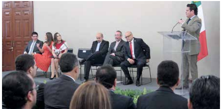
JALISCO TIENE EL PRIMER LUGAR en carga de información en Plataforma Nacional de Transparencia (PNT), destacó el gobernador Aristóteles Sandoval en evento realizado en Casa Jalisco Ciudad de México.