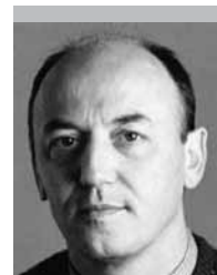
Por | Ricardo Trotti