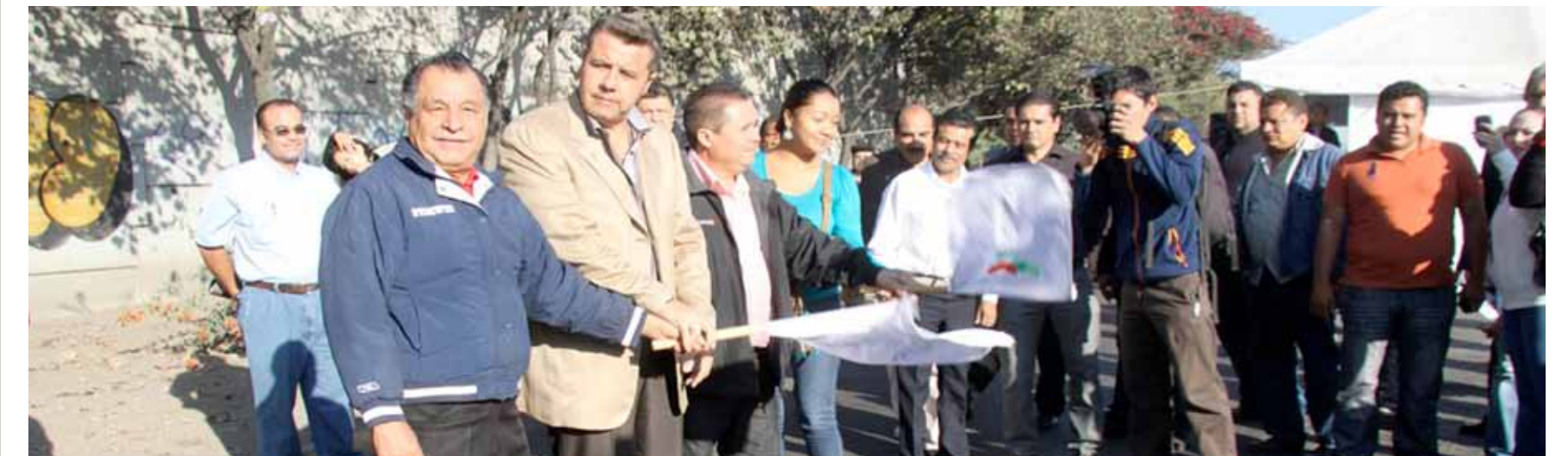
EL 4 DE DICIEMBRE de 2012. Ponen en marcha los trabajos.