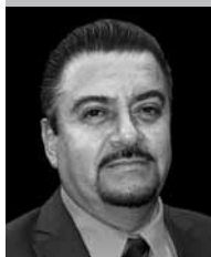
Por | Luis Fermin Anaya