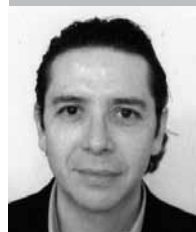
Por | Alberto Gómez*