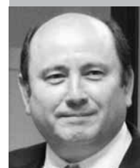
Por | Gabriel Ibarra Bourjac