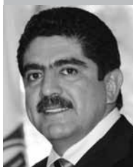
Por | Manuel Espino