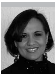
Por | Irma Adriana Luna Cruz *