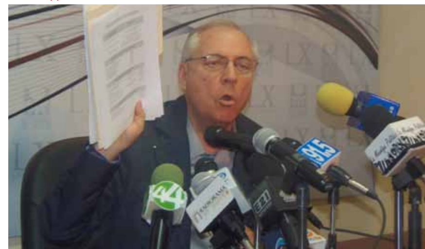
EL DIPUTADO Guillermo Martínez Mora, presidente de la Comisión Investigadora da a conocer los primeros resultados del trabajo que realizan sobre "los aviadores" que hay en el Congreso del Estado y donde aparece la huella de una ex diputada.