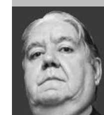
Por | Modesto Barros González