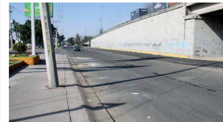
EL 22 DE ENERO de 2013. Los trabajos avanzan, las laterales de Lázaro Cárdenas a punto de volver a recuperar su utilidad para los automovilistas y transporte pesado que circula por la zona.