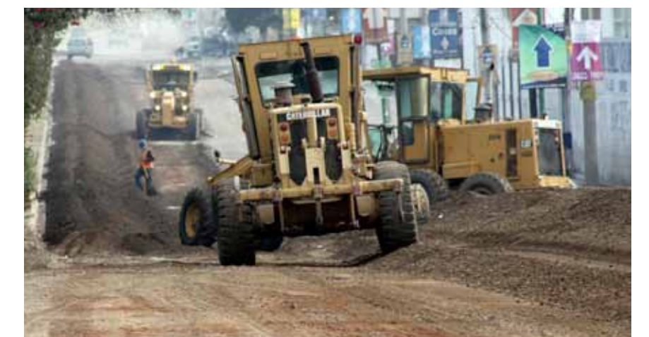
EL 18 DE DICIEMBRE de 2012. El avance en los trabajos laterales de Lázaro Cárdenas.