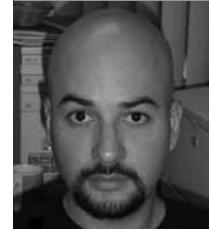
Por | Oscar Constantino