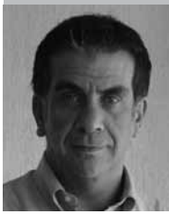
Por | Leonardo Schwebel