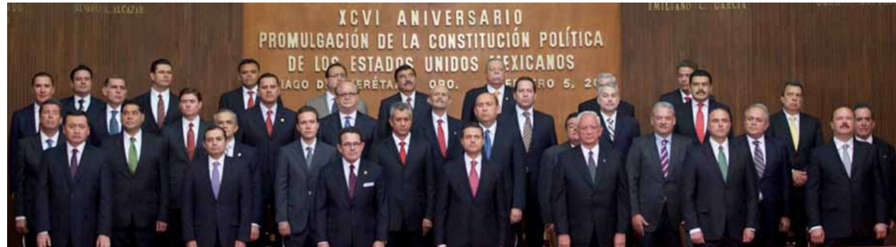
EL GOBERNADOR electo del Estado de Jalisco, Aristóteles Sandoval, participó en el evento conmemorativo del 96 aniversario de la Promulgación de la Constitución Política de los Estados Unidos Mexicanos, en Querétaro, Querétaro. En este acto, el Presidente de la República, Enrique Peña Nieto, inició los preparativos para conmemorar el Centenario de la Carta Magna, acompañado de los gobernadores de los Estados y titulares de los Poderes de la Unión.