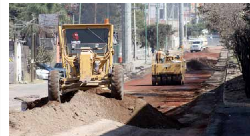
EL 12 DE DICIEMBRE de 2012. Empiezan por quitar completamente lo que quedaba de carpeta en las laterales de la Lázaro Cárdenas.