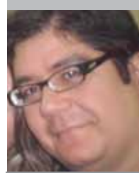
Por | José Modesto Barros Romo

La clave del ingenio de Amazon con su nuevo modelo, estará en crear un modelo de compraventa entre consumidores. No se concreta, aunque se da por entendido, que Amazon se llevaría una parte de la transacción.