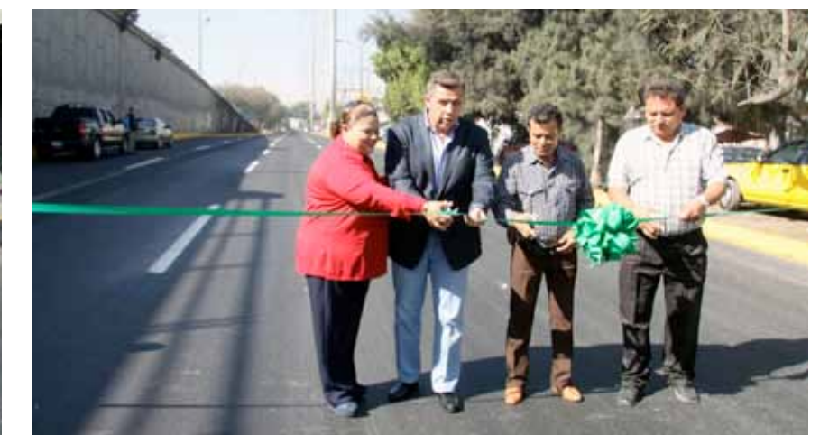
EL 7 DE FEBRERO de 2013. Entrega a los ciudadanos las laterales de Lázaro Cárdenas. "Contribuimos a mejorar la movilidad urbana municipal y aportamos a una mejor imagen de la entrada de la Zona Metropolitana de Guadalajara", subraya el alcalde de San Pedro Tlaquepaque ante los medios de comunicación.