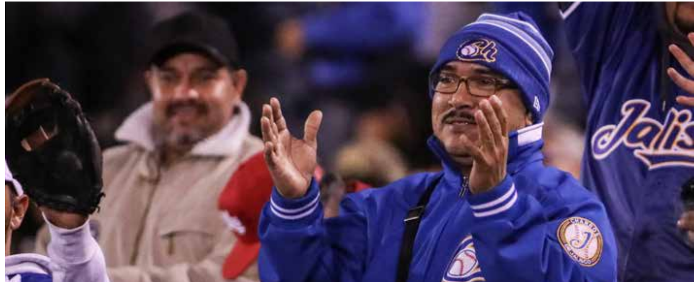
El apoyo de la afición Charros siempre tuvo durante la temporada que se quedó con las ganas de que su equipo lograra el bicampeonato.

Ahora bien, de la serie que cumplieron los Charros de Jalisco y Cañeros de Los Mochis, no podemos dejar de advertir que fue la más equilibrada conforme a los otros enfrentamientos que se registraron en la etapa de cuartos de cierre, siendo favorable el resultado para el conjunto sinaloense que logró en el último de los siete cotejos disputados el anhelado triunfo número cuatro que le redituó