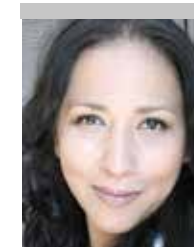
Por | Mónica Ortiz