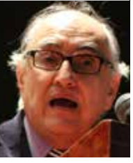
Por | Alfredo Jalife-Rahme