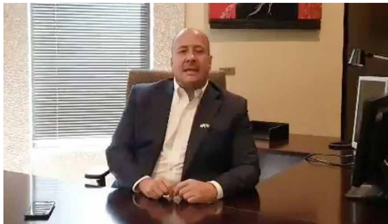
El gobernador Enrique Alfaro y la defensa que hace de los resultados “positivos” que se han obtenido en la lucha por recuperar la paz y tranquilidad de Jalisco.

“Quiero decirles cuáles fueron los resultados en materia de seguridad en este primer año de gobierno. Porque es muy curioso cómo lo que vemos permanentemente es una descalificación sistemática al trabajo del gobierno, como si nada hubiéramos. Trabajamos todo el año, todos los días, estamos atendiendo la agenda de seguridad y para mí es motivo de orgullo poder decir que en el primer año de gobierno, en los promedios mensuales que tenemos en enero y a los que tuvimos en diciembre, la reducción de la incidencia total de los delitos fue del 28 por ciento. Más de una cuarta parte de