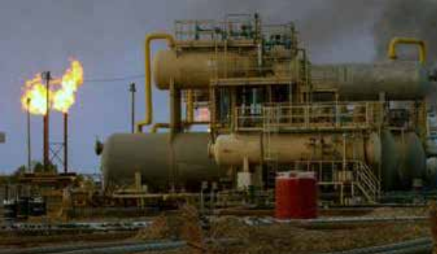
Petróleo, armas y comercio, elementos de la disputa geopolítica entre las grandes potencias mundiales.