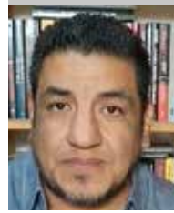
Por | Daniel Emilio Pacheco