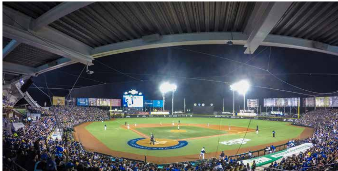
Los seguidores de Charros estuvieron a tres outs de festejar que su equipo pasara a la semifinal por el campeonato de la temporada de la LMP 2019-2020.

¿Por qué no cerró el cerrador? ¿Fue la estrategia correcta? El resultado del séptimo partido parece que da las