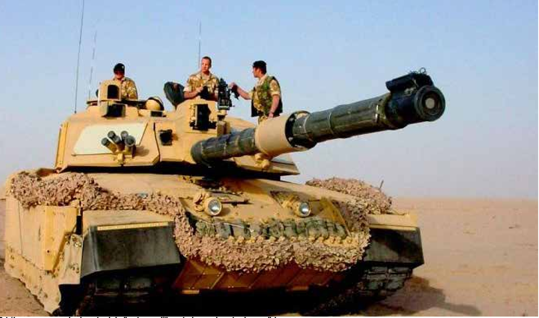
Petróleo, armas y comercio, elementos de la disputa geopolítica entre las grandes potencias mundiales.