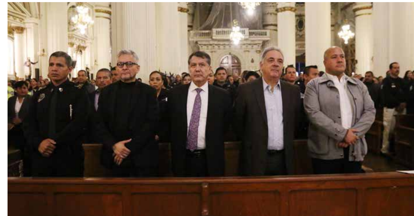
Con motivo del Día de la Policía, que se conmemora cada 2 de enero, el Gobernador de Jalisco, Enrique Alfaro Ramírez, asistió la mañana de este sábado a la tradicional eucaristía en la Catedral de Guadalajara a la que asistieron alrededor de mil elementos policiacos.

“No estamos diciendo que sea un tema menor la cuestión de las desapariciones, pero alguien necesita que le expliquemos que detrás de estas desapariciones, en muchísimos casos está la delincuencia organizada. Yo creo que todos lo entendemos, se necesita simplemente sentido común. No están desapareciendo personas para robarles dinero, ni para extorsionarlos, están desapareciendo personas para matarlos. Esa es la realidad y la pregunta es, y el gobierno