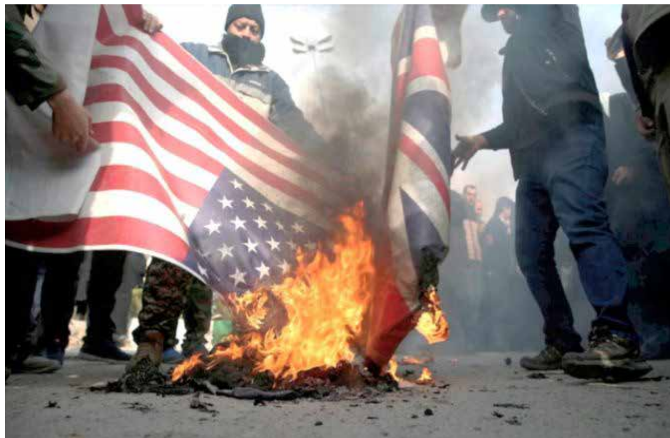
Con el asesinato del General Irán Soleimani se vuelve a prender la mecha en el Medio Oriente.

EUA está presionando a China para lograr mejores condiciones en los temas comerciales, en ese entorno y durante