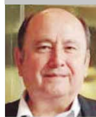
Por | Gabriel Ibarra Bourjac