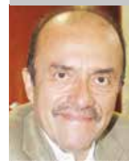
Por | Benjamín Mora Gómez