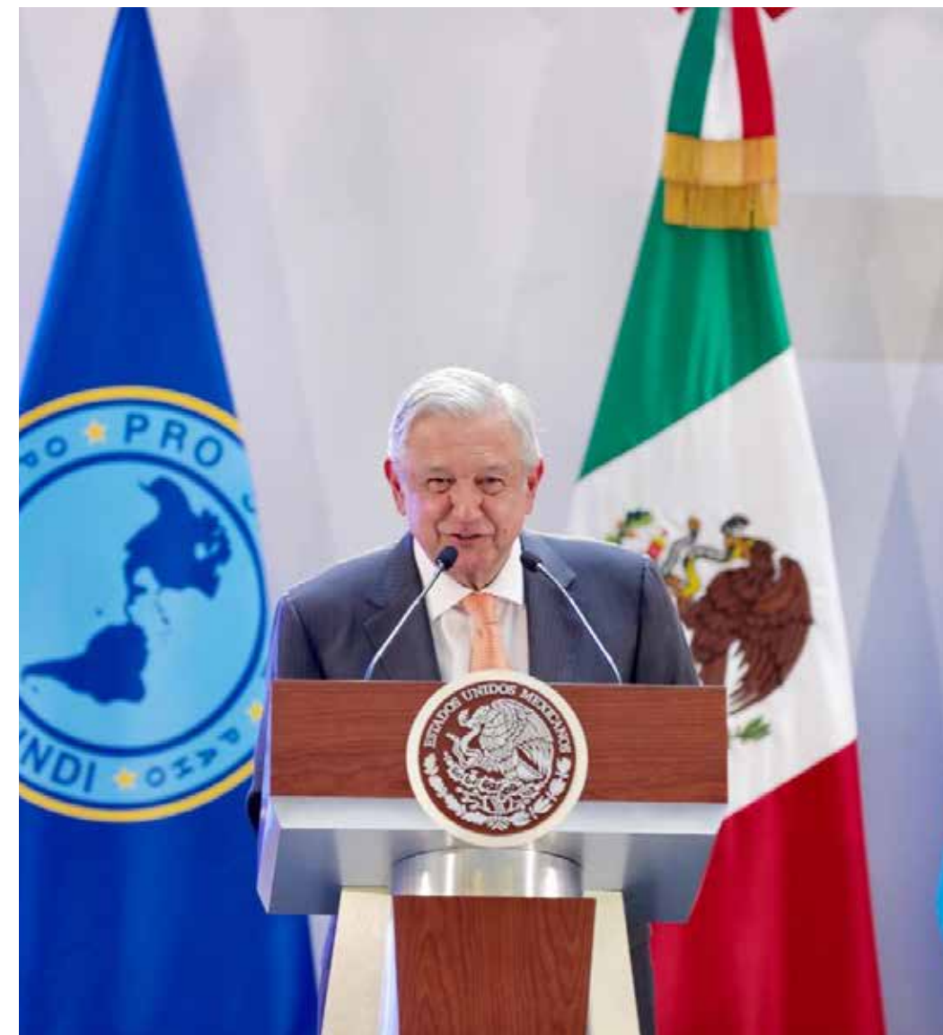
El programa de salud del Presidente Andrés Manuel López Obrador inicia mal y se queda corto.

ANDRÉS MANUEL LÓPEZ OBRADOR/ PRESIDENTE DE MÉXICO