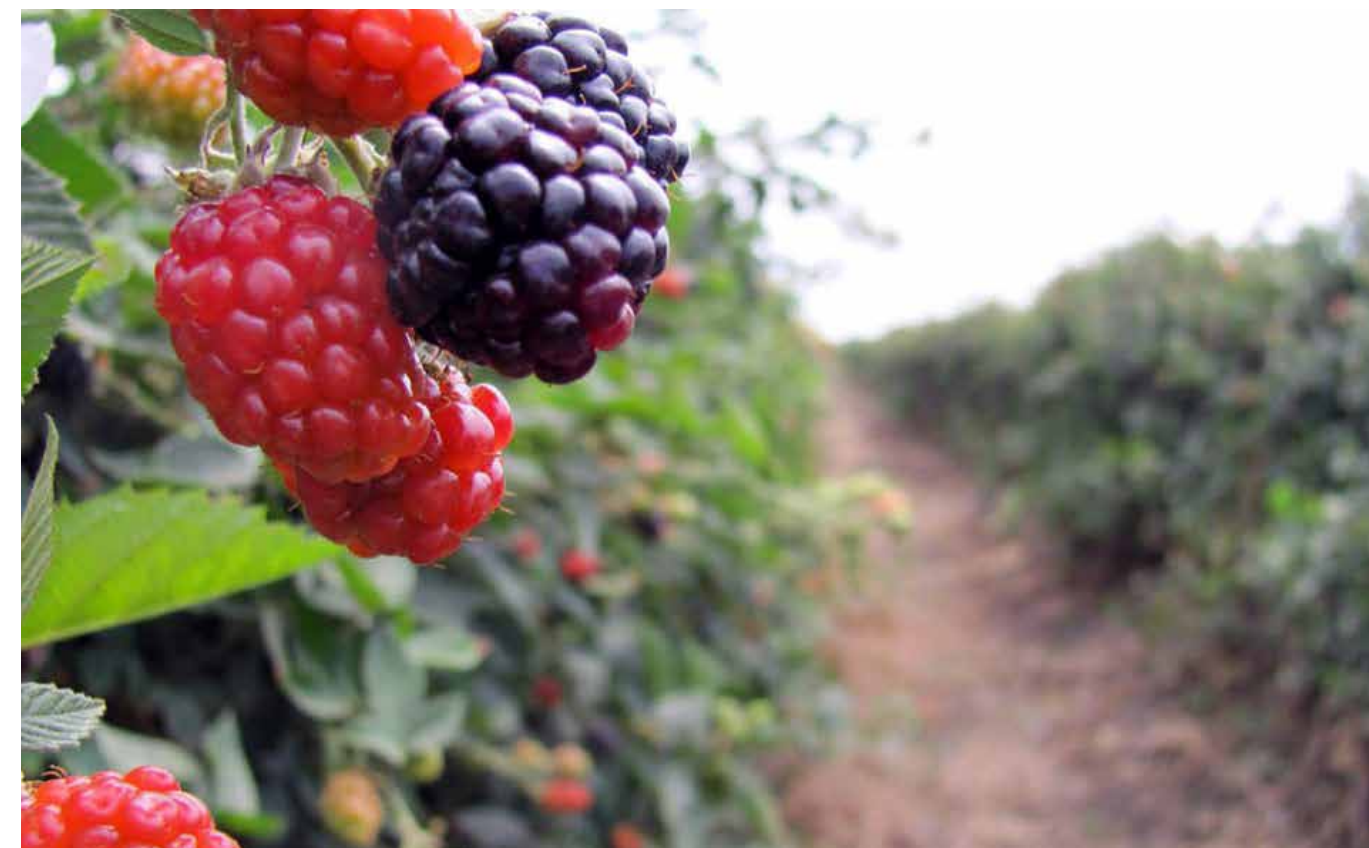
Uno de los rubros donde más destaca Jalisco es en el renglón agropecuario, donde se le considera punta de lanza a nivel nacional.

Uno de los rubros donde más destaca Jalisco es en el renglón agropecuario, donde se le considera punta de lanza a nivel nacional. En este tema, el estado cuenta con un