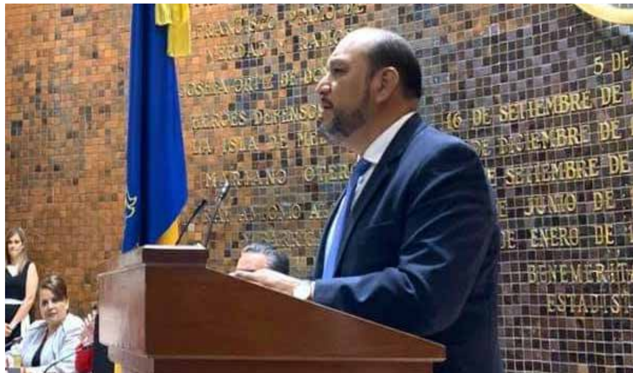
El ombudsman de Jalisco, Alfonso Hernández Barrón, expresó su preocupación por la postura asumida por algunos servidores públicos ante las recomendaciones o informes emitidos.

“Replantear la relación con el Poder Ejecutivo y desde luego con los gobiernos municipales. Les ruego que nos demos la oportunidad para comprender el papel de las defensorías de derechos humanos, que quienes estamos al frente de las instituciones hagamos el mayor esfuerzo por coordinarnos y articular esfuerzos. Es motivo de preocupación la resistencia de algunos servidores públicos para aceptar y cumplir recomendaciones