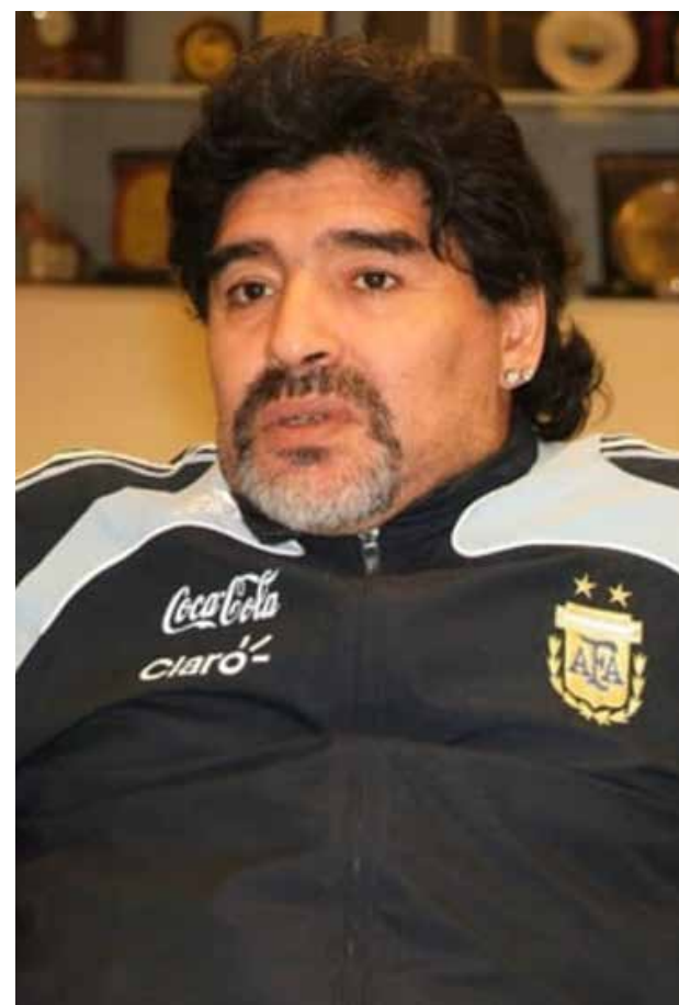
Diego Armando Maradona, su comportamiento negativo dentro y fuera de la cancha de fútbol.

Este fenómeno las mujeres lo han adoptado en sus