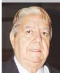
Por | Modesto Barros González