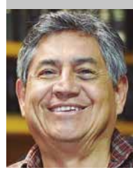
Por | Héctor Romero Fierro