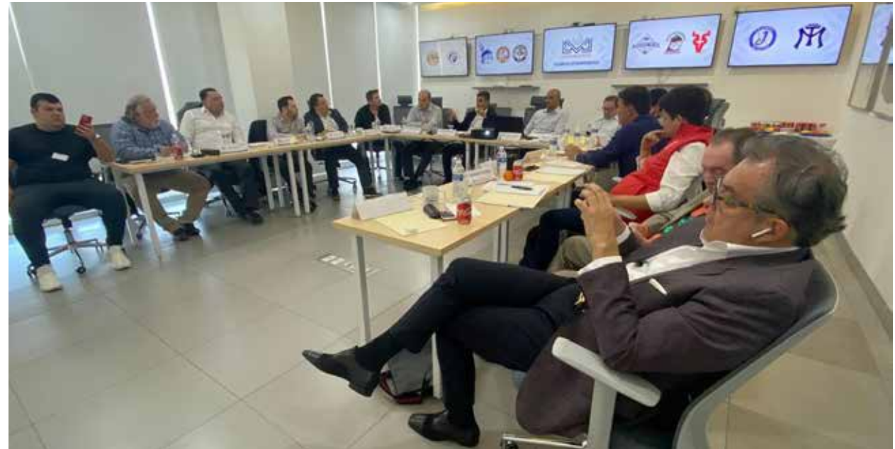
Primera reunión del año de dueños de equipos de la LMP en la que se tomó la decisión de firmar nuevo contrato de transmisión de los juegos de la temporada por TV con la empresa de cable Sky.

Como ya mencionaba, era esperado que al terminar la