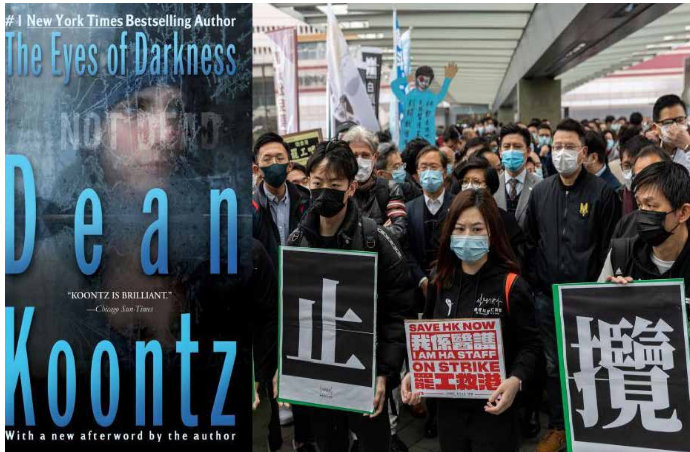
En China ya han muerto más de 2.660 personas y hay más de 77.650 contagiados (el 97% del total mundial), pero también es cierto que 24.700 pacientes han sido dados de alta allí.

China ha logrado un progreso excepcional en la construcción en un tiempo récord —10 días!— de dos hospitales de emergencia en Wuhan, en la provincia de Hubei, epicentro del brote de coronavirus reportado. Según las autoridades chinas, el hospital Huoshenshan, de 1.000 camas, y el hospital Leishenshan, de 1.600 camas, fueron levantados siguiendo el modelo del hospital Xiaotangshan, una instalación temporal construida en Pekín para tratar el brote de otro coronavirus, el SARS, en 2003. A partir del 2 de