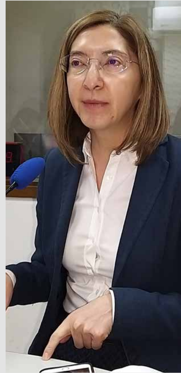
Diputada Mara Robles, presidenta de la Comisión de Educación, Cultura y Deporte del Congreso del Estado entrevistada en el programa Tela de Juicio.

“Son cuatro puntos sencillos, para mejorar el aprendizaje: una cartilla del aprendizaje; dos, mejores maestros empoderando a las