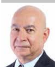
Por | Luis Manuel Robles Naya