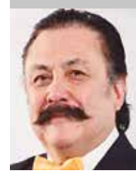
Por | Alfredo Ponce