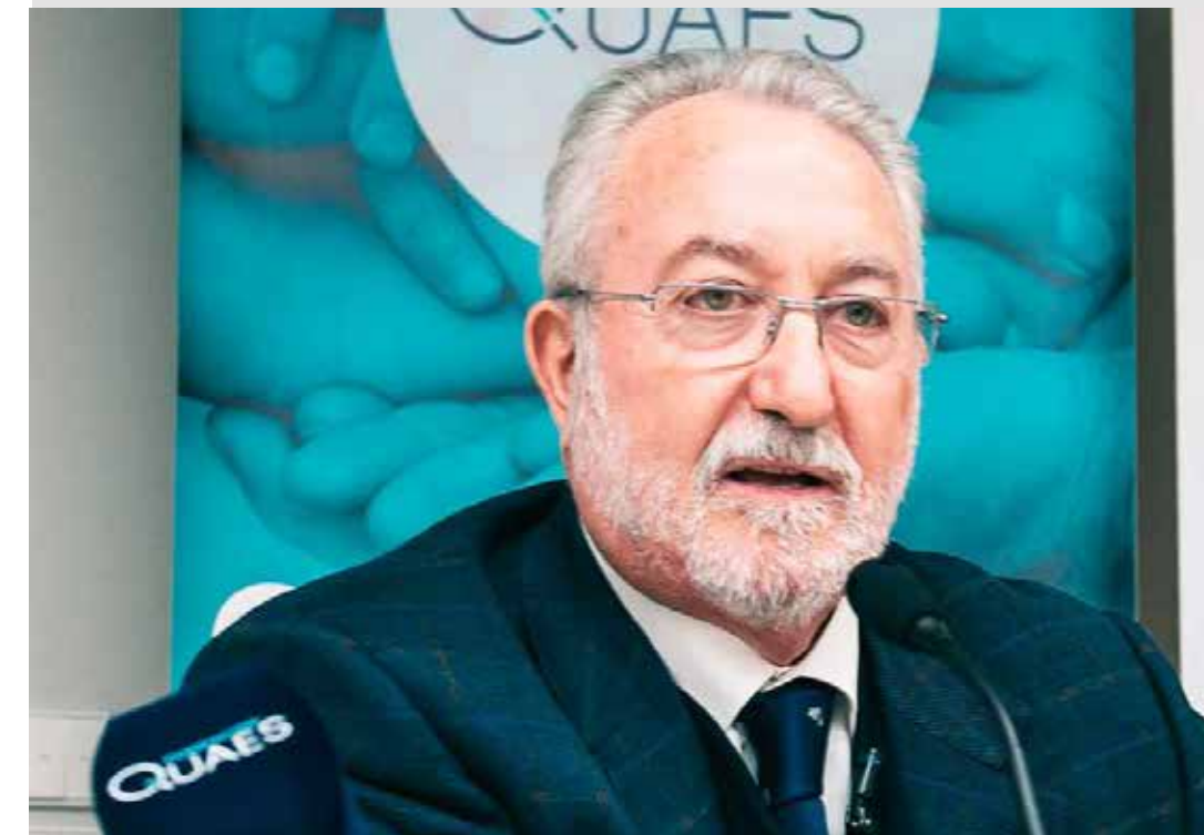
El doctor y científico español Bernat Soria lidera un proyecto en este país para lograr tener un fármaco celular para pacientes graves con Covid-19.

Ahora que tenemos en la puerta a la pandemia que esperamos que nuestros gobiernos logren entender que no va existir ganancia política de esta situación por más esfuerzos que hagan, solo el sentido común y la lógica humanitaria, por lo que se deberá poner especial atención en robustecer el sistema salud público y en alianza con el sector privado de salud se generen estrategias que salven vidas y contengan el contagio evitando la saturación de enfermos.