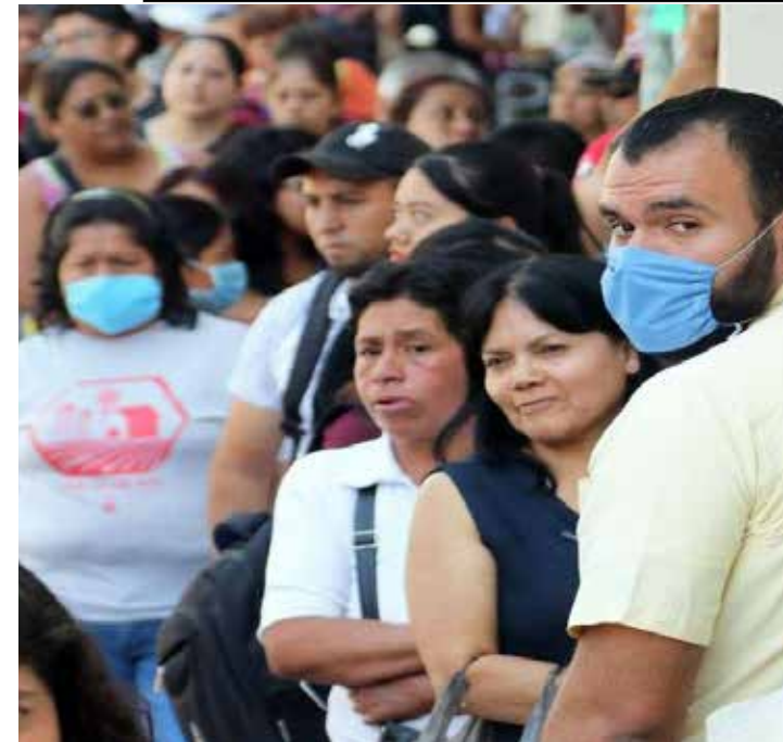
El gran desafío para el sistema de salud mexicano lo representa la atención de la gente que resulte contagiada por el COVID-19 y que llegue al estado crítico.

Uno de los primeros pacientes que dio positivo a las pruebas del Coronavirus y que se encuentra aislado en su domicilio, es un hombre que viajó de Seattle, Washington,