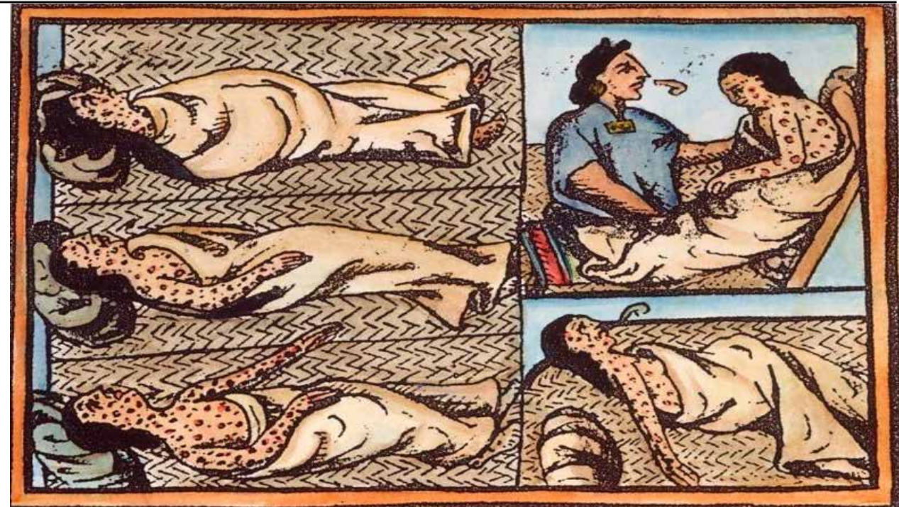
La viruela de las más temidas pestes que durante siglos golpearon a las naciones, lo mismo en Europa que América hasta su erradicación con la vacuna.

Nuestro país fue el epicentro del brote que apareció en el año 2009, la gripe porcina H1N1. Se originó cuando los virus de las gripes aviar, porcina y humana se combinaron con un virus de la gripe porcina euroasiática. Se estima que entre el 11 y el 21 por ciento de la población mundial contrajo la enfermedad, que dejó a su paso alrededor de 200 mil muertes alrededor del planeta.