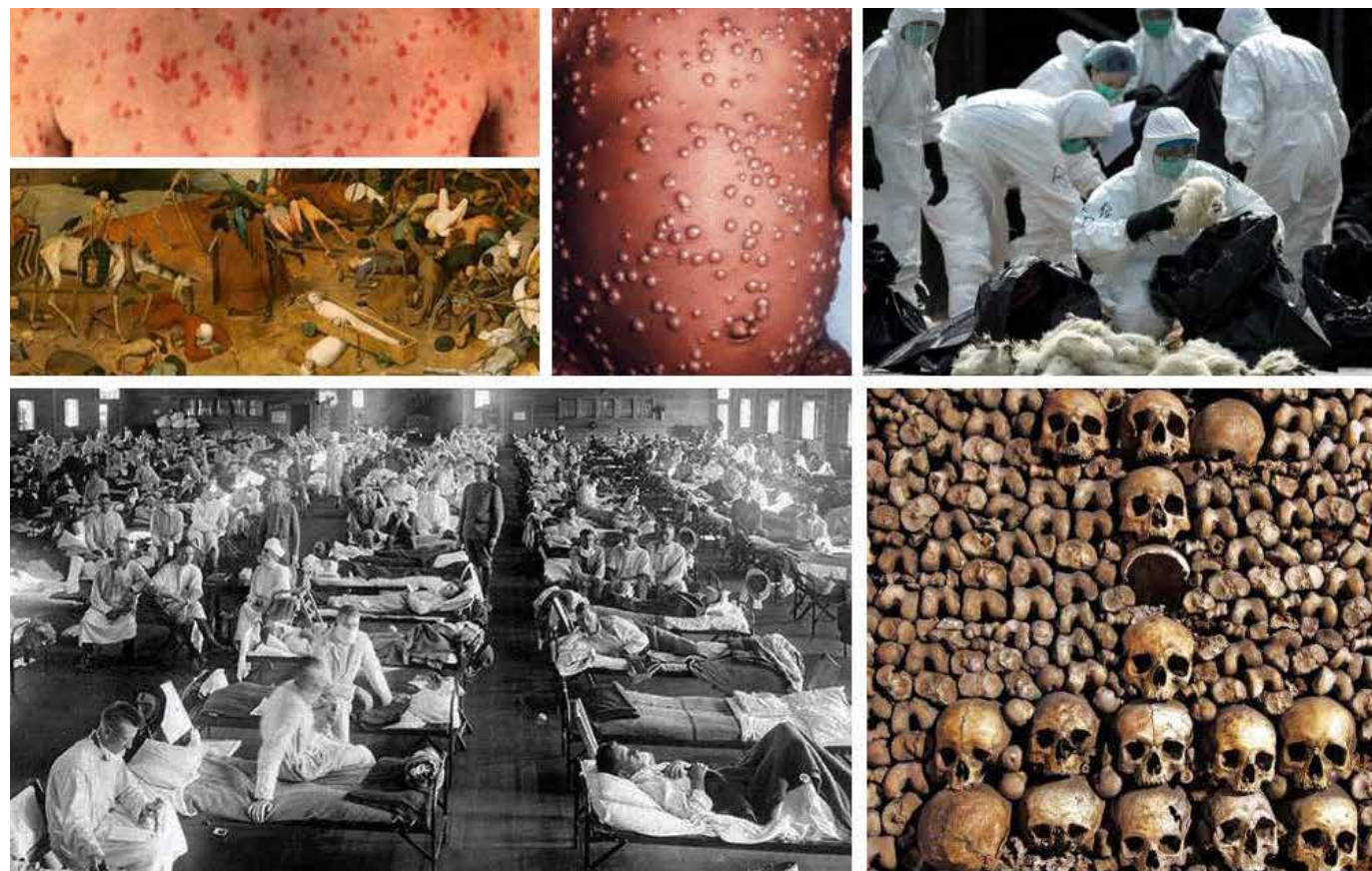
Son las pandemias las que ubican la pequeñez del ser humano y le ponen freno a la soberbia de los poderosos, como está demostrado en el devenir de la humanidad.

Fue introducida en lo que actualmente es México por los españoles, siendo determinante en la caída del imperio azteca, quienes no tenían un cuadro de defensas para combatir este virus. Gracias a los estudios y avances médicos, se consi-