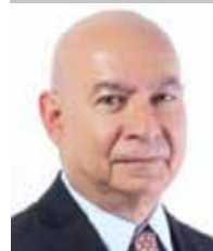
Por | Luis Manuel Robles Naya