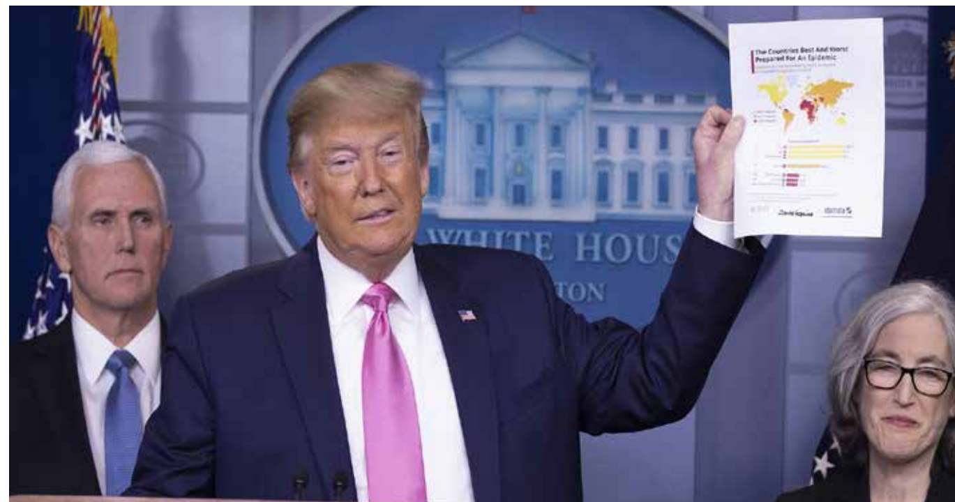
El Presidente de EEUU, Donald Trump fue incapaz de advertir la avalancha que se venía con la epidemia del coronavirus que hoy está fuera de control en el país más poderoso del mundo.

DIFÍCIL SER HOY GOBERNANTE La mayoría de los habitantes y políticos de las zonas urbanas del mundo pierden horas al día en mandar y recibir mensajes por redes sociales, pero casi ninguno de los Jefes de Estado usó esta herramienta para leer el avance del virus en China y de ahí en Italia. Es evidente que mientras la mayoría decidió esperar o ignorar, muy pocos países