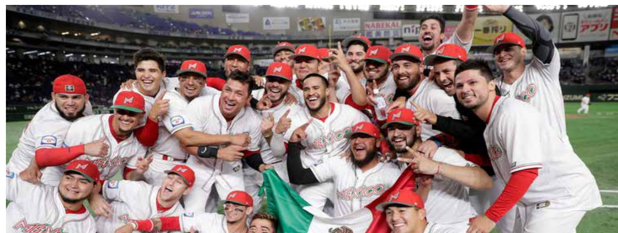
Los directivos de la Liga Mexicana de Beisbol (LMB) desconocen cuándo iniciará la temporada de este año 2020, todo por la epidemia del coronavirus.

Después de la suspensión, se dijo que la fecha de inauguración de la justa mundialista en Tokio se definiría en algunas semanas más, aunque según se adelantaba sería previo al verano, pero de acuerdo a una publicación del New York Times, el comité organizador japonés ha propuesto al COI el 23 de julio de 2021 para el arranque de la celebración, aún quedando por confirmar la veracidad de la información. Lo que sí se dijo con seguridad fue que los máximos dirigentes