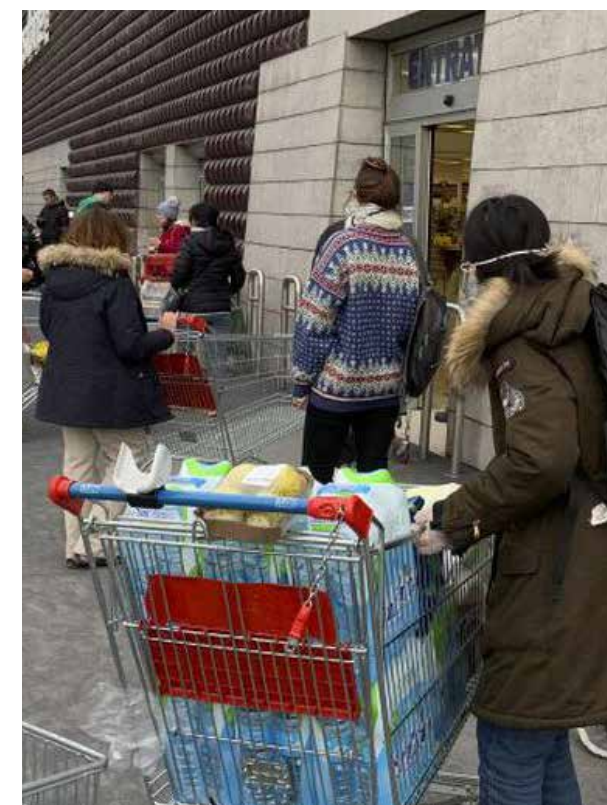
La otra pandemia será la crisis económica, desempleo y bancarrota que sufren ya diversos países del mundo. En la región sur de Italia empezaron a registrarse saqueos de super mercados.

En lo individual debemos analizar nuestras opciones para sobrevivir un par de semanas sin trabajo, un lujo que la mayoría de los mexicanos no se pueden dar pero que con inteligencia podríamos intentar. Cuando uno está nervioso,