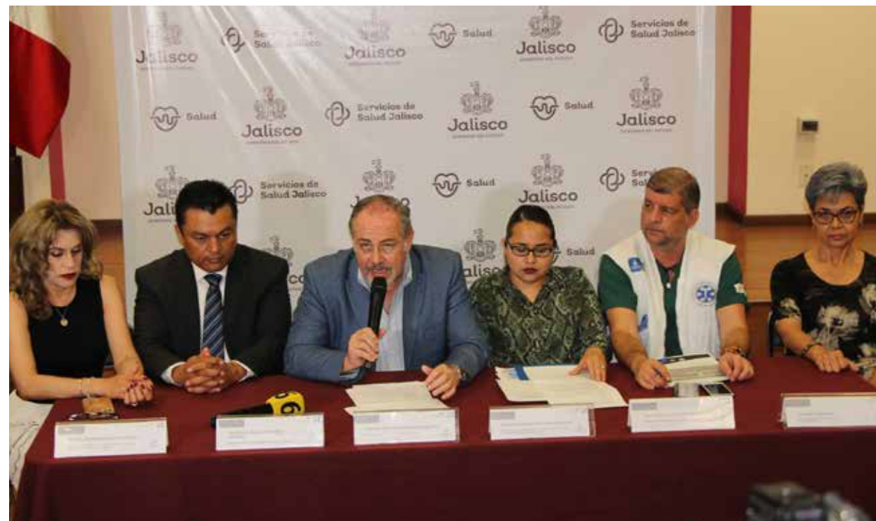
Las autoridades de Salud de Jalisco instrumentan una serie de acciones para contener la expansión del coronavirus en el Estado que hasta este domingo registraba ya la pérdida de tres vidas.

El segundo caso se vio involucrado en un asunto de ilegalidad administrativa, ya que se registró con el nombre de otra persona para ser atendido en el hospital del ISSSTE, sin embargo, cuando su situación de salud era realmente crítica, los familiares confesaron la suplantación y reconocieron que se trataba de un residente de