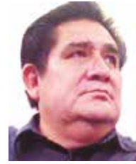
Por | Mario Ávila