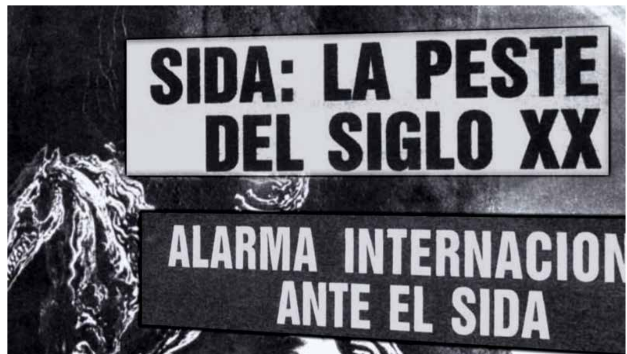
En las últimas dos décadas del siglo XX el SIDA apareció en el mundo y ha sido una epidemia devastadora.

dera una enfermedad erradicada desde 1980, siendo la única formas de prevención la vacunación.