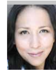
Por | Mónica Ortiz