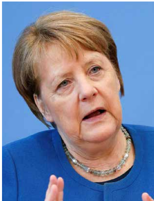
La canciller alemana Ángela Merkel con el reto de mantener la unión en la Comunidad Europea.

La Unión Europea, la Americana, la Mexicana y algunas monarquías constitucionales, están teniendo debates acalorados para decidir cómo atender la crisis, éstas son sanas expresiones de la democracia, lo que nos recuerda que no vivimos en regímenes autoritarios y que nuestros gobernadores y presidentes pueden disentir.