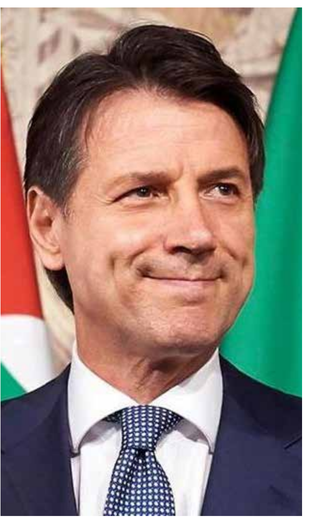
“La existencia de la Unión Europea está en riesgo”, declaró el primer ministro italiano Giuseppe Conte.

quiridos por China hoy o 4. El ser adquiridos mañana por Alemania, principal acreedora de estos créditos. En EUA, increíblemente Trump había logrado mantener más o menos buena relación con los gobernadores demócratas; los ciudadanos habían respondido bien al semi-cierro, pero durante la semana pasada inició una fisura la “tregua” que había mantenido una sola postura nacional al tema del COVID19, la gente en varios estados se empezó a inconformarse por las medidas de cuarentena, en especial en estados con bajo número de infectados. A esto se sumó a la serie de críticas que intercambiaron en Twitter el presidente Trump y el gobernador de Nueva York, lo que podría desatar una nueva ola enfrentamientos entre Republicanos y Demócratas.