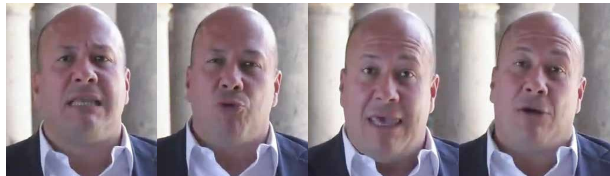
Enrique Alfaro Ramírez enfrenta serios problemas de comunicación con sus gobernados que no le entienden sus mensajes.

En medio de la lucha que Enrique Alfaro Ramírez enfrenta contra el Covid-19, en beneficio de los jaliscienses, esta semana, tuvo que hacer una pausa en su apretada agenda y sacar del error a todos aquellos que no entendieron lo sencillo de la Fase 0 del Plan Jalisco para la Reactivación Económica.