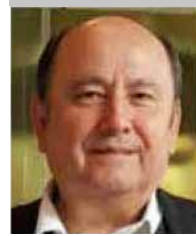
Por | Gabriel Ibarra Bourjac