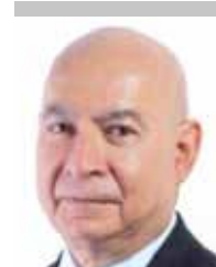
Por | Luis Manuel Robles Naya