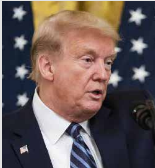
Donald Trump ahora se victimiza.

ALFREDO JALIFE RAHME/ EXPERTO EN GEOPOLÍTICA