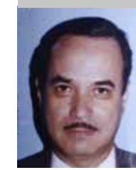
Por | Pedro Vargas Avalos