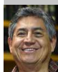
Por | Héctor Romero Fierro