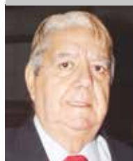
Por | Modesto Barros González