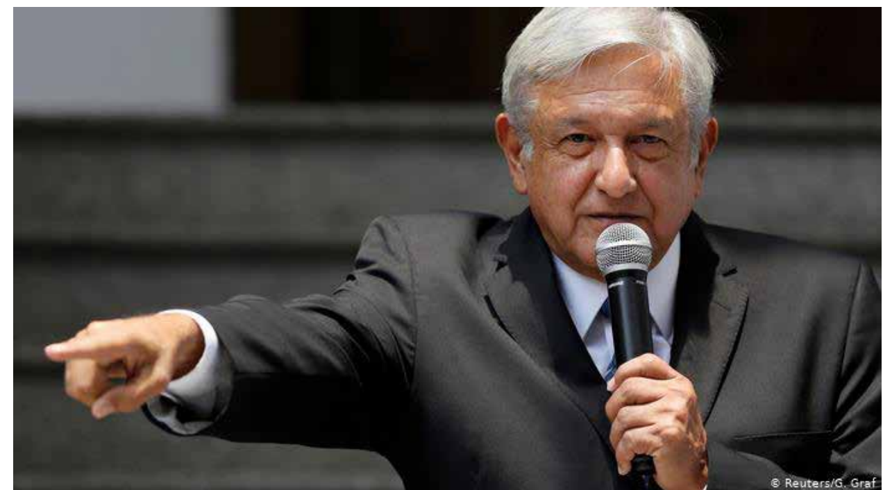
Una promesa más incumplida de López Obrador, los militares a los cuarteles. Ahora hasta publicó un decreto para legalizar el que los militares hagan la tarea de la policía civil.

Desde sus campañas electorales, López Obrador imprimió una connotación negativa a los gobiernos pa-