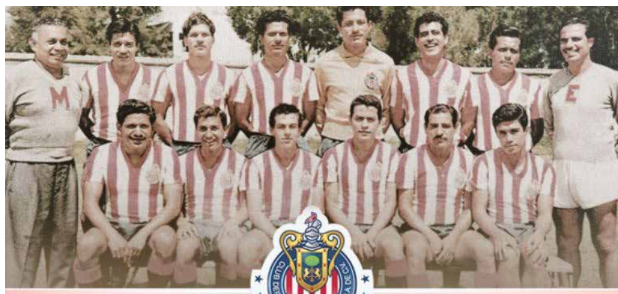
El equipo mexicano de futbol que despierta más pasiones y que trasciende fronteras.