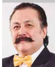
Por | Alfredo Ponce