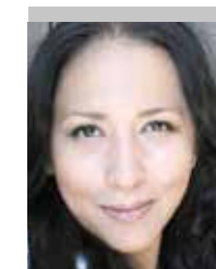
Por | Mónica Ortiz

Después de ver cómo se comportan los diputados, uno se pregunta, con todo respeto...¿Para qué sirven?