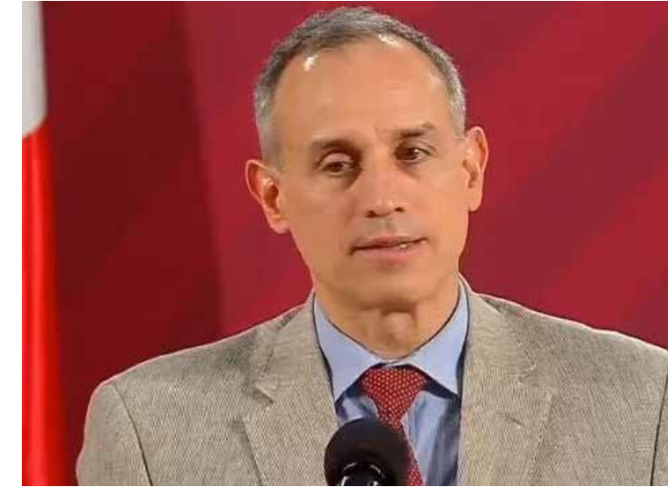
La respuesta misógina del doctor Hugo López Gatell a una senadora en la Cámara Alta.

El doctor López contestó en “función a la capacidad fisiológica superior de la atención”, ahora soy yo la que se pierde entre su mirada... y no me refiero a sus bellos ojos, sino a un conflicto cognitivo que no me deja entender si en realidad era justo el sacar a colación que la senadora debía fortalecer su capacidad de atención y que además no tenía amplios conocimientos en el campo de la salud, sino en el de los medios de comunicación; esto es tanto como que cualquier ciudadano no pueda cuestionar las acciones de un funcionario toda vez que se dedique a reparar autos o a hacer gorditas en el mercado, cuando al mismo tiempo recibe un cúmulo de información que