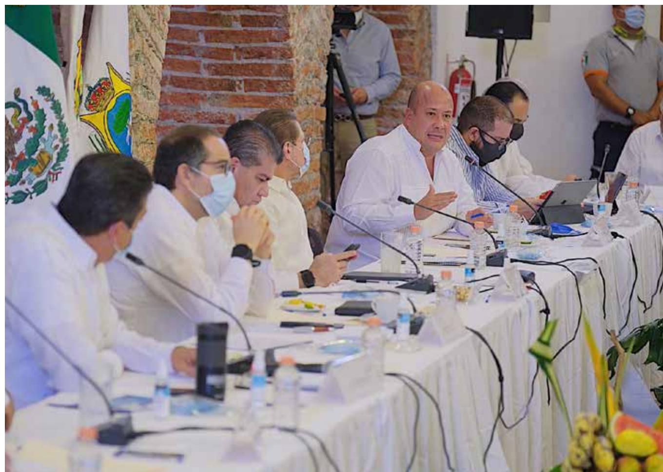
“Los últimos 15 días no hicimos las cosas bien y estamos pagando las consecuencias”, expresó el pasado 30 de mayo el gobernador de Jalisco.

“Hoy estamos todavía en una fase de aceleración que