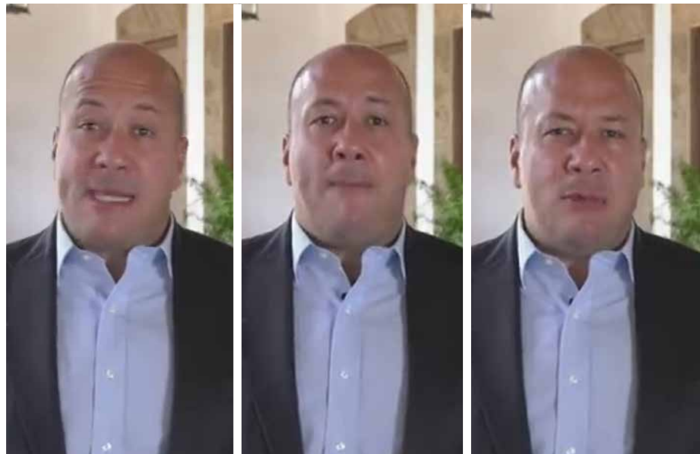
El Gobernador Enrique Alfaro de nuevo descalificó al vocero en el tema de la pandemia Covid19 del Gobierno Federal, doctor Hugo López Gatell al que tildó de cinico porque incluyó a Jalisco en el semáforo rojo para el reinicio de las actividades económicas.

De ellos, 1 mil 564 casos han sido confirmados y registrados ante la plataforma federal del SINAVE; además de 494 personas positivas al SAR-CoV-2 detectadas por los laboratorios del Hospital Civil de Guadalajara y del Centro Universitario de Ciencias de la Salud de la UdeG y 329 casos confirmados por laboratorios de los hospitales privados. Sumados am-