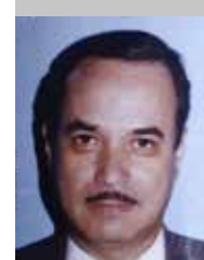
Por | Pedro Vargas Avalos