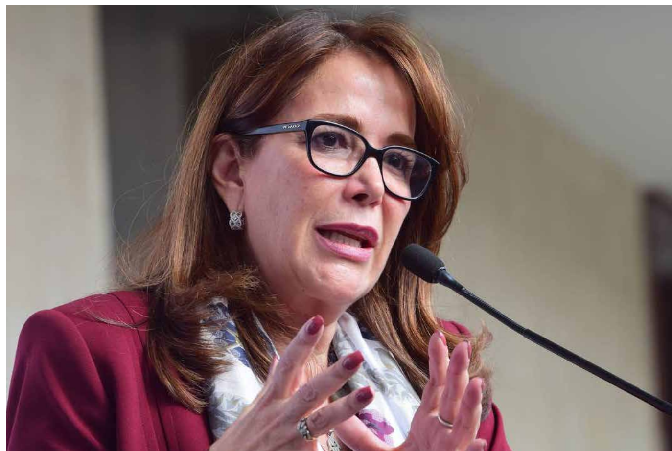
Yeidckol Polevnsky ha sido designada por el CEN organizar a Morena en Jalisco para las elecciones del 2021.

“Yo la veo como lo que es, un titán dentro de MORENA. Ella siempre tiene una gran simpatía no solamente con los jaliscienses, con todos los mexicanos, a donde quiera que va es muy querida, la gente se acerca, la abra-