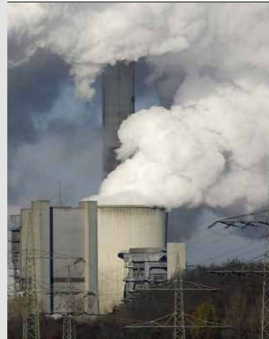
El carbón seguirá constituyendo el principal elemento generador de energía en México, dejando de lado proyectos para producir energía limpia como la solar y eólica.

Durante el gobierno de Peña Nieto, varias empresas europeas y canadienses, de acuerdo a los planes presentados por el gobierno de México en París, que decidió no modificar las plantas de producción de energía de la CFE, ni siquiera se atrevieron a proponer la construcción y creación de plantas propias de energía solar y eólica, razón por la cual los inversionistas privados entraron a participar.