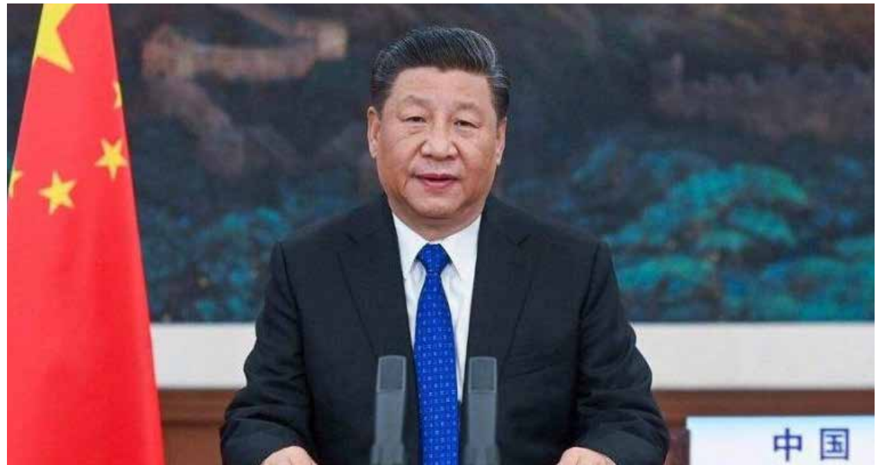
China se ha puesto a la ofensiva para contrarrestar los ataques que han surgido en el mundo, culpándolo algunos gobiernos de haber elaborado en laboratorio el virus de Covid19 o no haber hecho lo suficiente para evitar su expansión global.