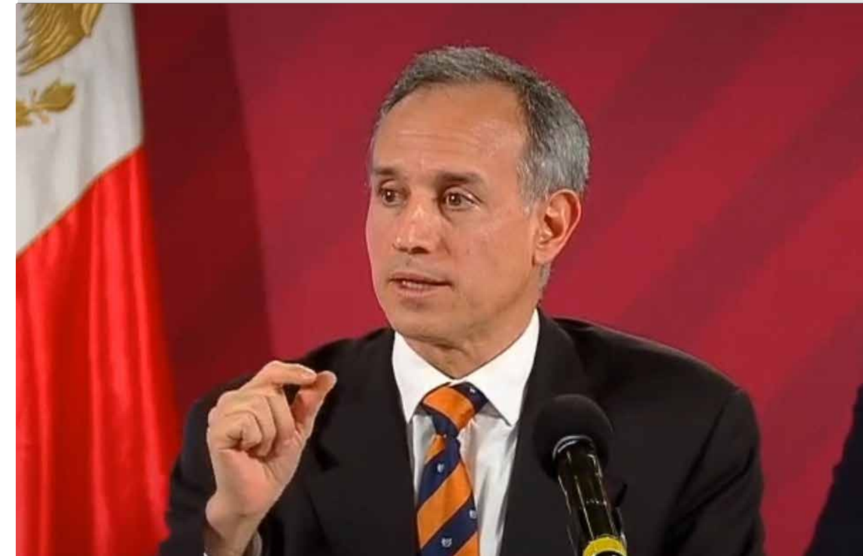
Por segunda ocasión el gobernador Enrique Alfaro tiene que meter el freno en el regreso a la "nueva normalidad" en Jalisco. Ahora fue la Mesa de Salud la que le dio el frenón, después de que había declarado que no aceptaría el semáforo rojo de Hugo López Gatell.

HUGO LÓPEZ GATELL/ SUBSECRETARIO DE SALUD FEDERAL