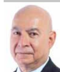
Por | Luis Manuel Robles Naya