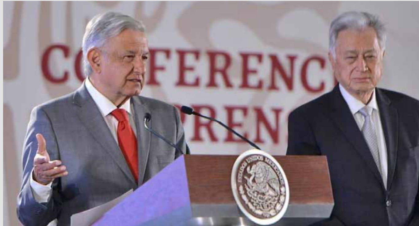
El Presidente Andrés Manuel López Obrador no entiende o no quiere entender lo que representan las energías limpias que no contaminan.