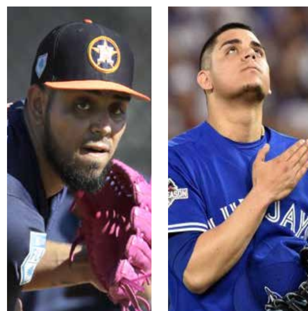
La afición de Charros podría disfrutar a los lanzadores mexicanos Roberto Osuna y Sergio Romo.