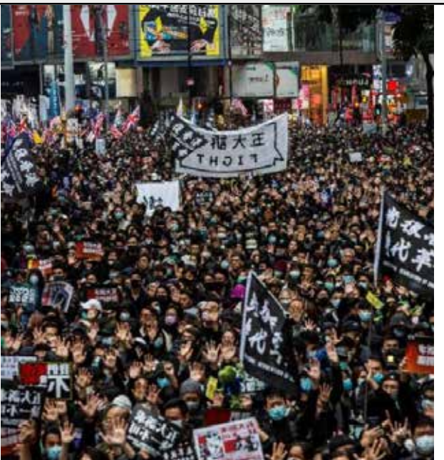
Un frente abierto del Gobierno de China son las manifestaciones que se registran en Hong Kong en los que se exige imperen reglas de la democracia.

Este avance ideológico político del Partido Comunista en China sobre las libertades en HK se da en medio de una pandemia que distrae al mundo quien se debate entre hacer caso a la OMS que ahora informa que las mascarillas sólo son necesarias cuando uno está enfermo o cuando uno está atendiendo a personas vulnerables en contradicción con lo que muchos países mandatan incluido el nuestro, como el uso obligatorio de mascarillas al salir a la calle sin impor-