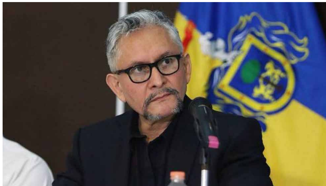
El Fiscal General de Jalisco, Gerardo Octavio Solís, entregó expediente de abusos policiacos del 5 de junio a la Fiscalía General de la República para que atraiga el caso.

GERARDO OCTAVIO SOLÍS/ FISCAL GENERAL DEL ESTADO