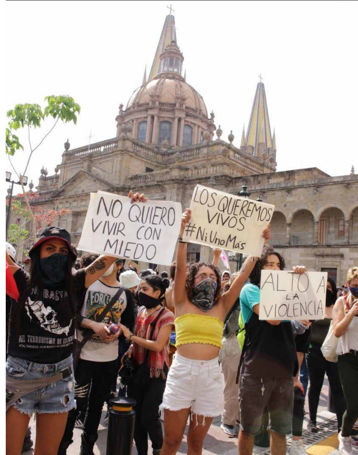
Los jóvenes estudiantes fueron reprimidos por personal de la Fiscalía General de Jalisco el pasado viernes 5 de junio, con levantones que son consideradas desapariciones forzadas.

“El fabricar chivos expiatorios, tiene como origen cuando se acostumbraba sacrificar un animal para que un noble no pagara sus culpas, entonces hablamos de inocentes, en este caso, gozan de la presunción de inocentes, sí, pero lo que ellos han mencionado y lo que se dice en los pasillos es que fueron órdenes superiores, puede ser que un mando superior les de una instrucción, pero eso no los hace chivos expiatorios”.