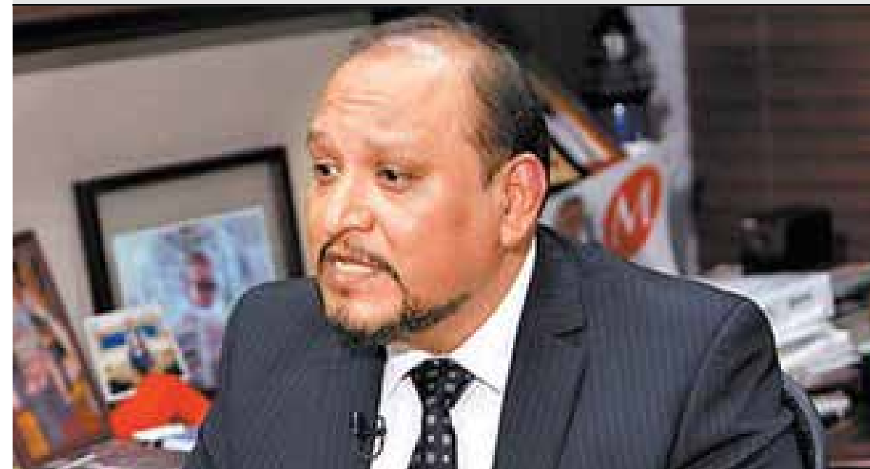
El Presidente de Derechos Humanos en Jalisco, Alfonso Barrón, garantizó que la prioridad en todo momento será la reparación de daños a las víctimas, misma que deberá contener por lo menos los siguientes cinco puntos esenciales: Restitución, Compensación, Rehabilitación, Satisfacción y Garantía de no repetición de los hechos.

“La plana mayor de la 4T (utilizó asesinato de Giovanni en Ixtlahuacán) participó en la estrategia para generar tensión y un clima de desestabilización para Jalisco: infiltró funcionarios federales en manifestaciones genuinas; utilizó las redes sociales y plataformas digitales para mentir y manipular información buscando sembrar la idea de un nuevo Ayotzinapa en Jalisco”.