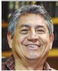
Por | Héctor Romero Fierro