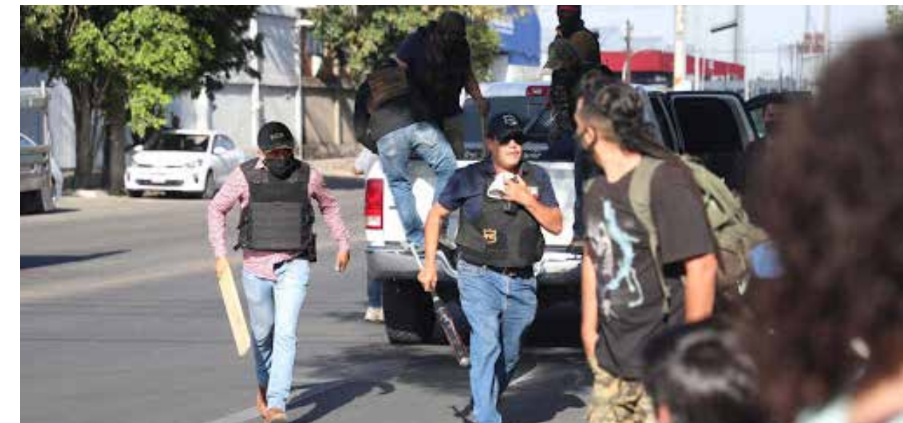
Las imágenes de levantones de estudiantes se dieron alrededor de las oficinas de la Fiscalía en la calle 14.

“Tengo conciencia de lo que significa ser el primer fiscal anticorrupción en la historia de Jalisco. Cuando llegamos, muchos me dijeron, te sacaste la rifa del tigre, yo les contestaba que yo compré el boleto, yo lo busqué, estaba detrás del micrófono criticando y decidí tratar de aportar. Segundo, el fabricar chivos expiatorios, tiene como origen