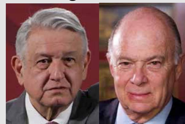
PRESIDENTE ANDRÉS MANUEL LÓPEZ OBRADOR

Es tiempo de definiciones, no es tiempo de simulaciones; o somos conservadores o somos liberales, no hay para dónde hacerse o se está en contra de la transformación del país o se está porque se mantengan los privilegios de unos cuantos".