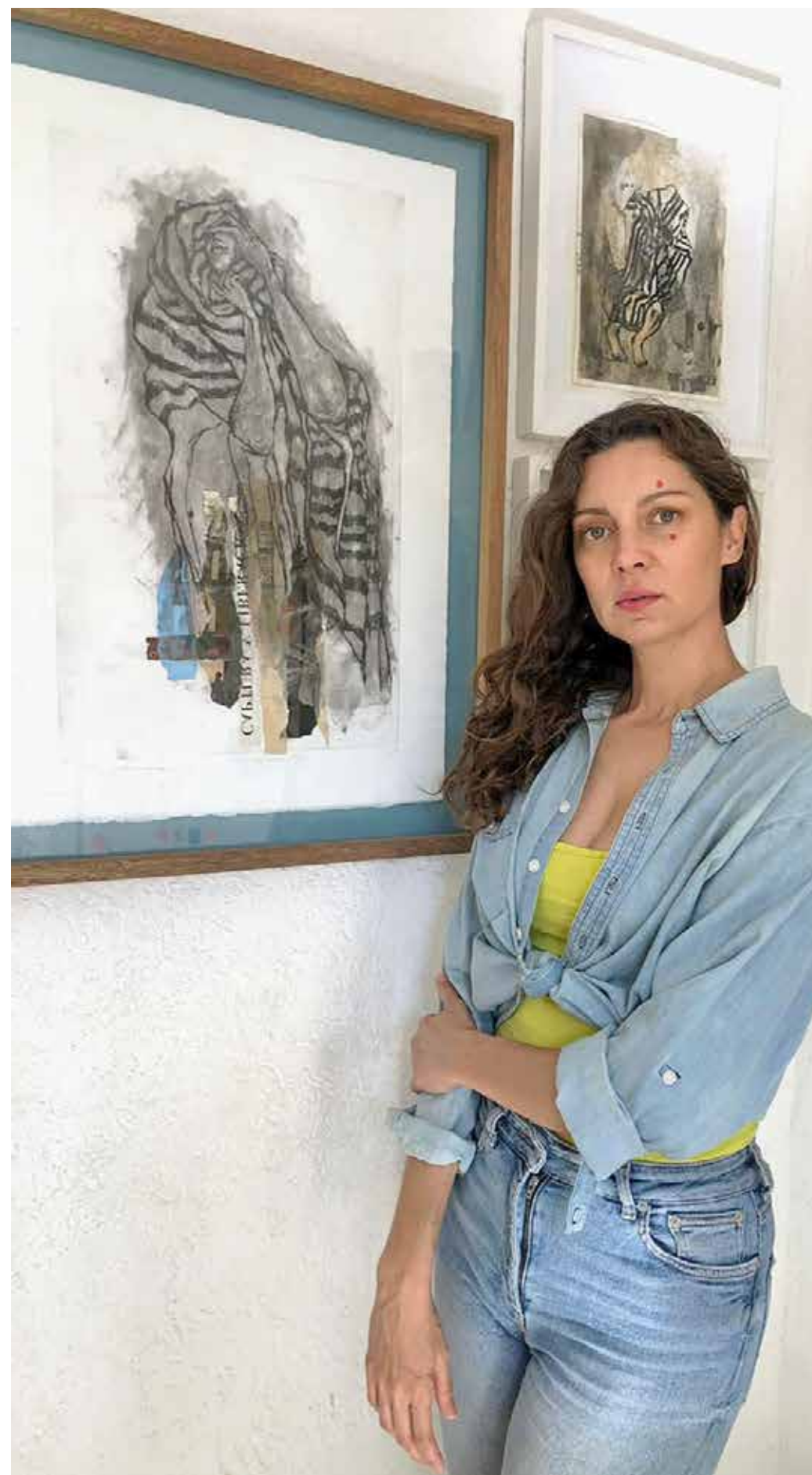
“No estoy tratando en esta vida de caerle bien ni gustarle a nadie en lo particular, estoy cursando la vida para comprenderme yo, para entender qué hago aquí, como una cuestión más interna, de reflexión”.

“Sí, o algo mejor, de la paz, de la tranquilidad, la armonía, la alegría. Mientras más lo practico, más quiero. Además, he intentado otras cosas para sentir algo y no lo he encontrado realmente, ni cuando he tenido mucho dinero, ni posibilidad de gastar, es algo que continúa, que perdura, porque tú puedes hacerlo, es algo controlable, porque tú lo estás ejecutando. Más porque una cosa es cuando estaba pequeña que era calcar algo, que no tenía que ver con la parte interna de expresar algo más personal, y cuando empiezo esa búsqueda, que no he terminado