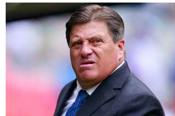
Miguel "Piojo" Herrera, pese a su intensidad como técnico, no logró nada extraordinario como director técnico de la Selección de México en el Mundial Brasil 2014.