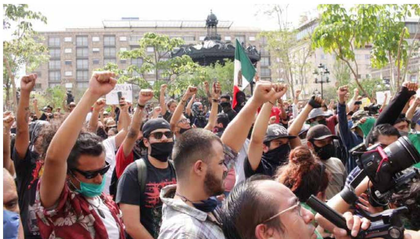
Ante la Comisión Estatal de Derechos Humanos Jalisco (CEDHJ) se han presentado 64 quejas, relacionadas con las manifestaciones efectuadas en Guadalajara el 4, 5, y 6 de junio; 31 quejas están relacionadas con lo ocurrido el pasado jueves, 26 quejas corresponden a los hechos registrados el día viernes y 7 son de sucesos efectuados el sábado. La queja por el asesinato de

“La idea es construir entre todas y todos, un proceso de acceso a la justicia y a la verdad, es un proceso inédito, no hay un guion que nos lleve paso a paso, pero sí tenemos una idea de los horizontes de llegada y en este caso son todas las medidas relacionadas a una reparación del daño. Con este propósito hoy celebramos la disposición que en medio