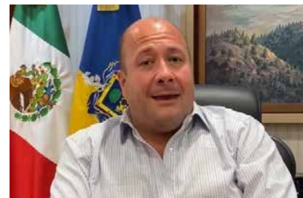
ENRIQUE ALFARO/ GOBERNADOR DE JALISCO

En Jalisco iniciamos muy bien la batalla contra Covid-19, reaccionamos a tiempo y fuimos ejemplo nacional, pero miles bajaron la guardia, la gente salió a la calle y hay consecuencias".