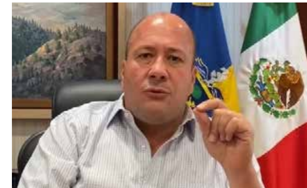
ENRIQUE ALFARO/ GOBERNADOR DE JALISCO

Estamos en un punto donde la conciencia y las acciones individuales cobran la mayor relevancia, hemos dicho que entre menos gente esté en la calle, menos personas habrá en los hospitales. Así de claro: nos vamos a repartir la responsabilidad".