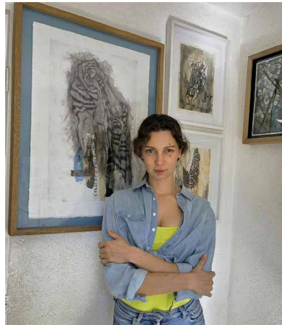
“No siempre estaré pintando lo mismo, con cierta técnica o cierto estilo durante años, es como algo totalmente utópico, aunque en meses o en un año suceden cosas tan distintas en la vida”.

“Siempre desde que empecé bajo esta línea de qué onda con lo que quiero decir, es algo muy personal, siempre es algo muy personal, nunca ha podido ser de otra forma. Todo el tiempo estoy hablando de mí, pero no de un aspecto como egocentrista ni narcisista, sino como mi experiencia en esta vida, mi punto de vista en mi entorno, de mi existencia de esta generación, para algunas personas puede ser algo equis, para otras fuerte, pero eso no me