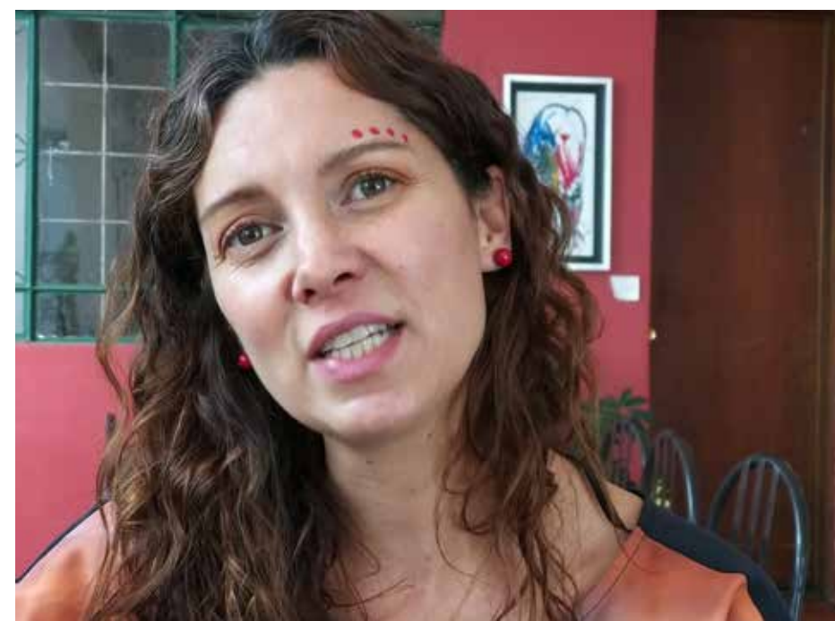
“Fui de esa generación de personas que sus papás no estaban de acuerdo que estudiara artes plásticas, porque te vas a morir de hambre, mejor estudia algo que te de para comer”.

importa, no pretendo ser como una persona muy oscura o muy viva, con muchos colores, a veces hasta mis exposiciones o en mi año he tratado de manejar las exposiciones como colecciones, como si fuera una especie de moda, me doy cuenta que pinto una colección de alguna forma, una serie y la otra ya le cambio mucho el tono, el color, o la textura, sí veo como ciertos cambios, pero tiene que ver con mi estado de ánimo, porque siento mucho placer al ejecutar tanto lo figurativo como encontrar la abstracción, en mis piezas hay mezcla de ambas”.