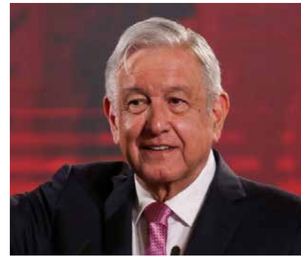
Un Informe que seguro tendrá el aplauso de los incondicionales, pues ahora el sometido y subordinado es patriota, mientras los que critican y cuestionan son los conservadores que desean el pasado corrupto de este país.

En los spot publicitarios oficiales para el segundo informe de gobierno constitucional, el Presidente ha decidido revivir las frases de su eterna campaña electoral, pero ahora financiados por el estado mexicano, todo el aparato del gobierno centrado a levantar la figura central de un mesías, que se ha apoderado de la verdad absoluta, abusando de la pos-verdad. Por ejemplo el primer spot fue en el que culpó a la pandemia de la eventual crisis económica, pero anticipa que se comenzó a rescatar a la "economía popular", sin rescatar a los empresarios y banqueros "como se hacía antes", éste será uno de los ejes rectores de su informe, en el que no se preocupa por informar, por los datos objetivos, por la realidad, sino que va enfocado a las emociones