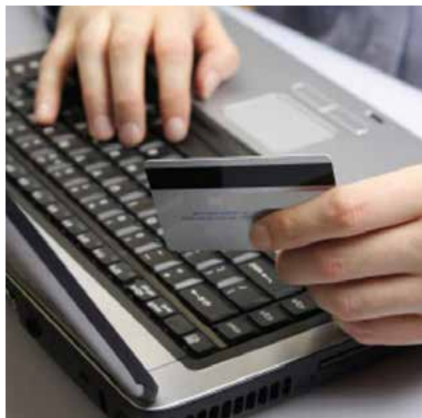
El servicio bancario fue declarado esencial y, por lo tanto, no padeció la interrupción del movimiento de transacciones.

El sector bancario tuvo un papel crítico que cumplir para mitigar el shock macroeconómico y financiero sin precedentes causado por la pandemia dando apoyo a los