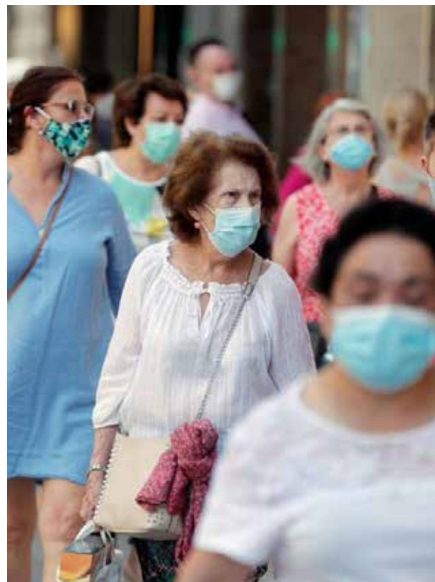
No habrá, pues, confinamiento nacional pero sí nuevas y fuertes restricciones regionales en el caso de que no baje la curva de infectados.

En segundo lugar, a consecuencia de la propia organización territorial del país. El Reino de España es un Estado cuasifederal. Está dividido en 17 comunidades autónomas más dos ciudades autónomas (Ceuta y Melilla). Todas las regiones tienen transferidas las competencias en materia