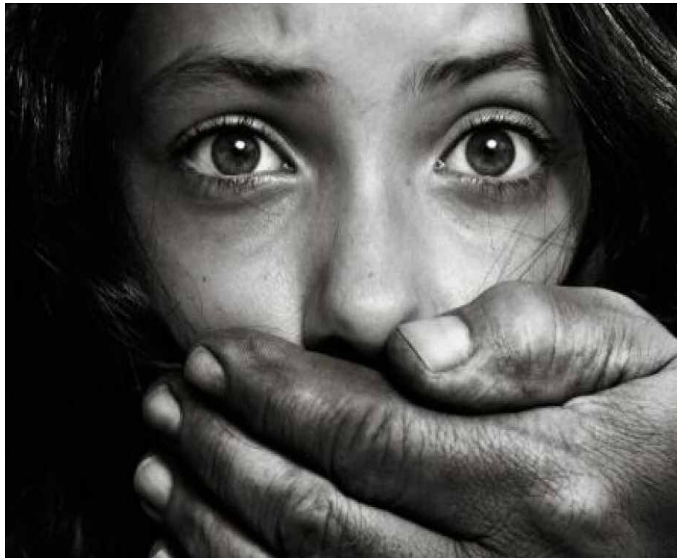
En Puerto Vallarta desde hace años se ha denunciado la existencia de una red de pederastas y explotación sexual infantil en ese destino turístico y los gobiernos poco o nada han hecho para desarticularla y perseguir el delito.

"Hemos solicitado la Unidad de delitos por razón de género y trata de personas. Vallarta es reconocido a nivel internacional con esta problemática y no tenemos esa unidad, es Fiscalía regional quien ve todas las agresiones sexuales en niñas y adolescentes en el municipio, el personal no tiene la sensibilidad, preparación, ni la capacidad de saber cómo abordar a las víctimas, a las familia ni como hacer la