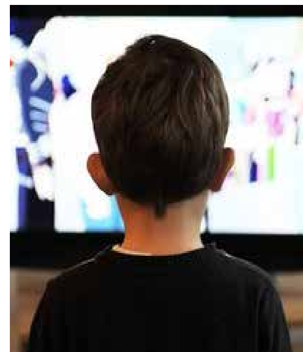
Tanto en la escuela como en la casa se necesita establecer límites, un orden, pero darle lógica y sentido para no atender reglas que bajo estas circunstancias no operan.

Muchos padres de familia aguardan con ansias el momento de que sus hijos regresen a clases, y en ese sentido, apoyan la idea de en tanto eso suceda, se preserven todas las lógicas posibles: los horarios, los mecanismos, que si los cuadernos deben ir forrados o que si le debieron haber cortado el cabello a sus hijos como