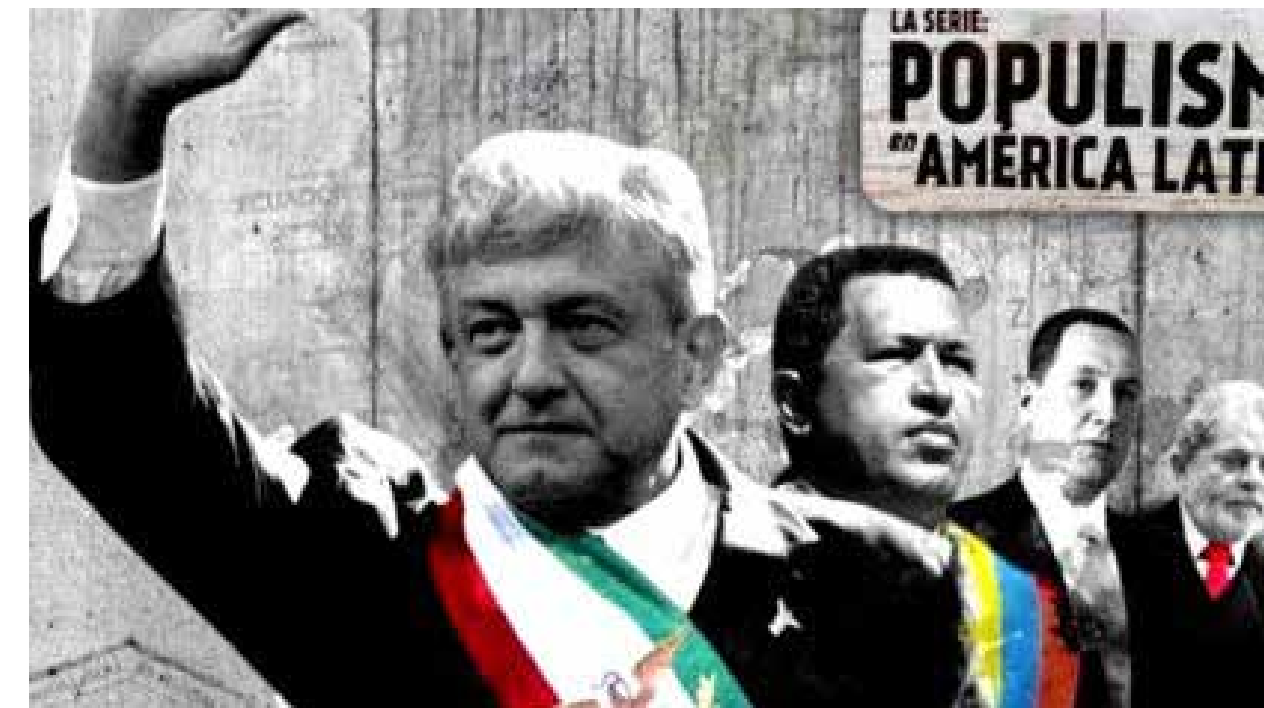
La polarización política de México se agudiza. Los odios entre seguidores y enemigos abiertos de López Obrador al orden del día.

La oposición debe construir una estrategia que le rinda mejores resultados hacia la elección de 2021.