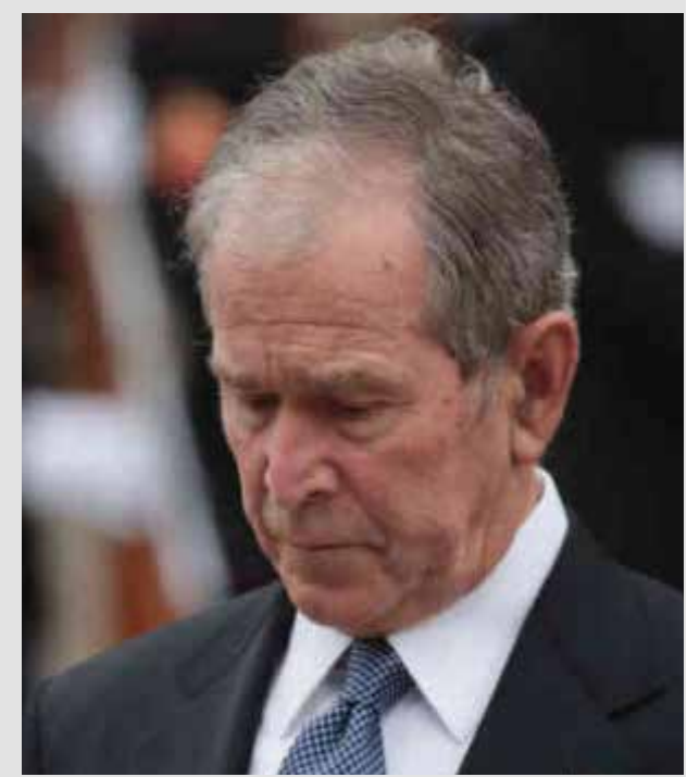
En la convención de los republicanos los grandes ausentes fueron los ex presidentes norteamericanos.

En una programación de mensajes alternados entre videos y mensajes en vivo, los republicanos trataron de contrastar su proyecto con el del Partido Demócrata e iniciaron con el tipo de personas que usaban el estrado y que hablaban al ciudadano común.