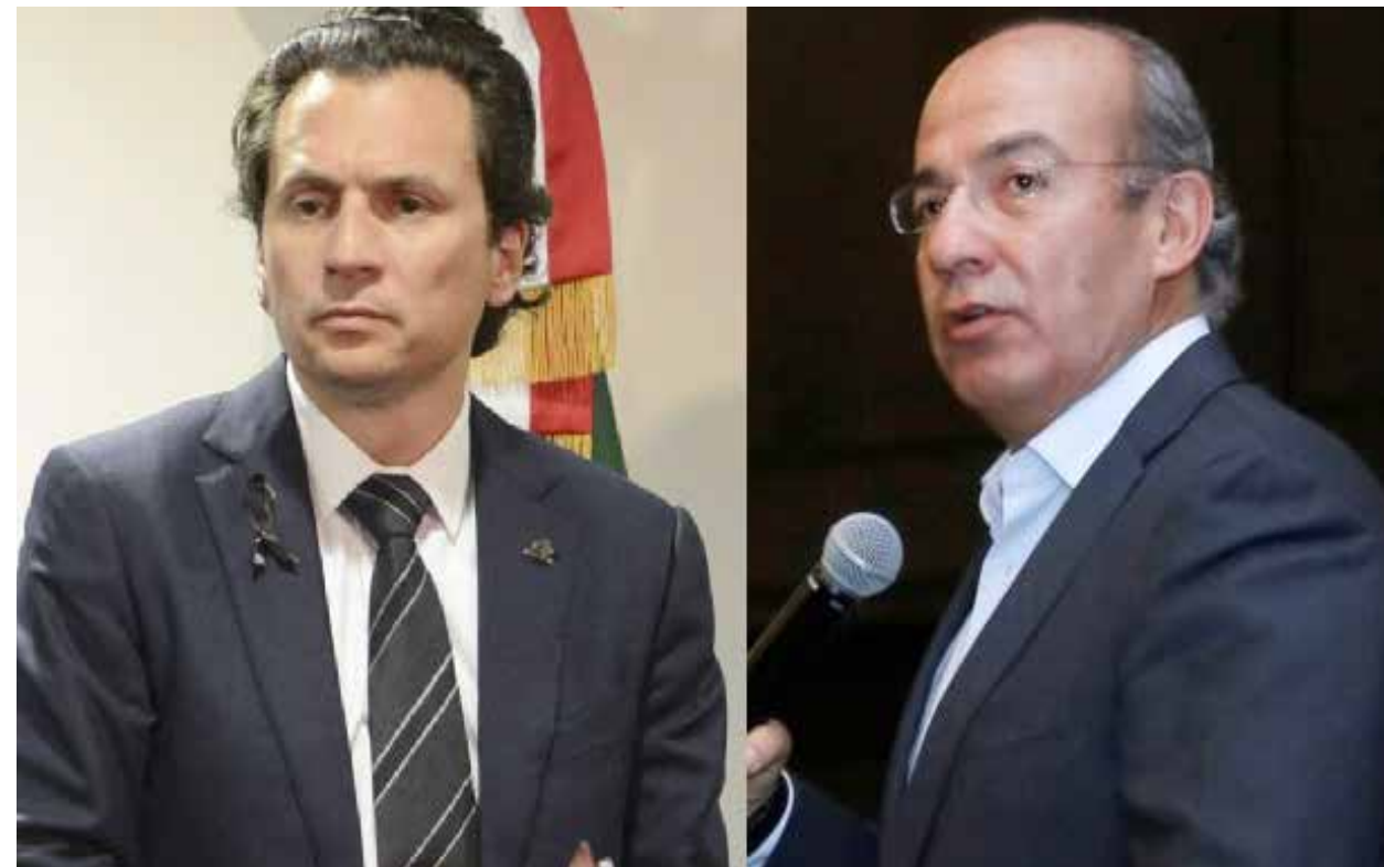
El ex director de Petróleos Mexicanos, Emilio Lozoya, apunta también en sus acusaciones al ex presidente Felipe Calderón.

También en ese sucio asunto, se inmiscuyó el vicepresidente de Peña Nieto, el entonces intocable Luis Videgaray, quien requirió millones y millones para entregarlo ya sea a legisladores cómplices o al mismísimo PRI (páginas 28 a 32 de la Denuncia). También aquí figura el infame Miguel Barbosa, pero éste solo se conformó con un favor laboral para su hermano, y a cambio dice Lozoya, se comprometió a no armar una revuelta de los legisladores perredistas, que él coordinaba, cuando se tratara por el Congreso el tema de la reforma energética.