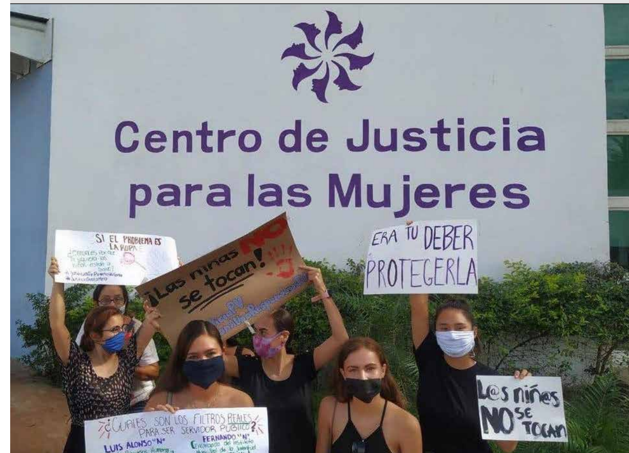
El caso de la niña de diez años abusada en Puerto Vallarta por un funcionario de la Policía Municipal y el mal manejo del caso de la Fiscalía del Estado y del juez que recibió el caso, enardeció a la sociedad y grupos feministas a nivel local y nacional que protestaron con la frase "A las niñas no se les toca".

El proyecto Alumbra, que trabaja para prevenir el abuso sexual infantil en México, señaló que en 2017 Jalisco se encontraba entre los estados con las tasas más elevadas de abuso sexual a nivel nacional con 28.6 casos por cada 100 mil niñas, niños o adolescentes de cero a 17 años.