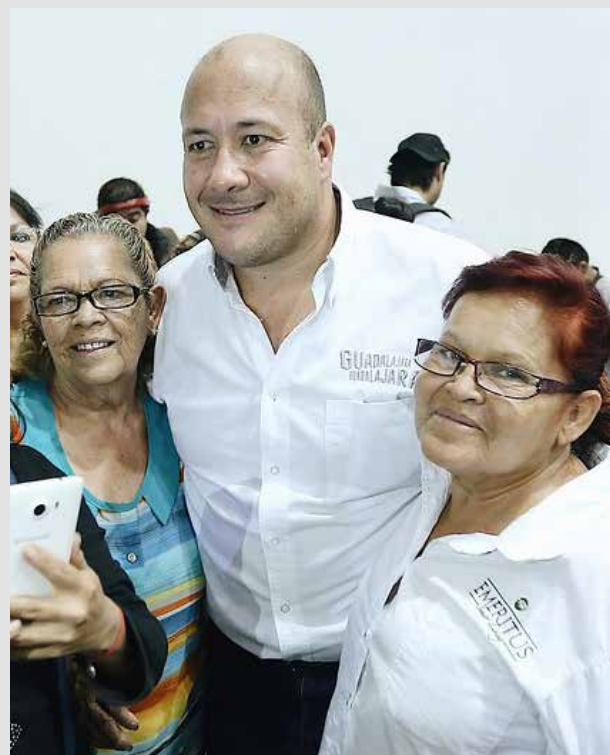
El Gobernador de Jalisco poca atención le ha dado en su gobierno a la población de adultos mayores.

"Las personas Adultas Mayores son aquellas que cuentan con sesenta años o más de edad", así lo define la Ley de los Derechos de las