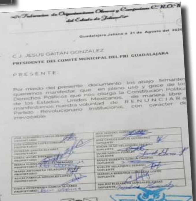
LA DESPEDIDA DE LA CROM