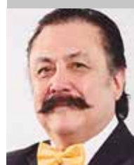
Por | Alfredo Ponce