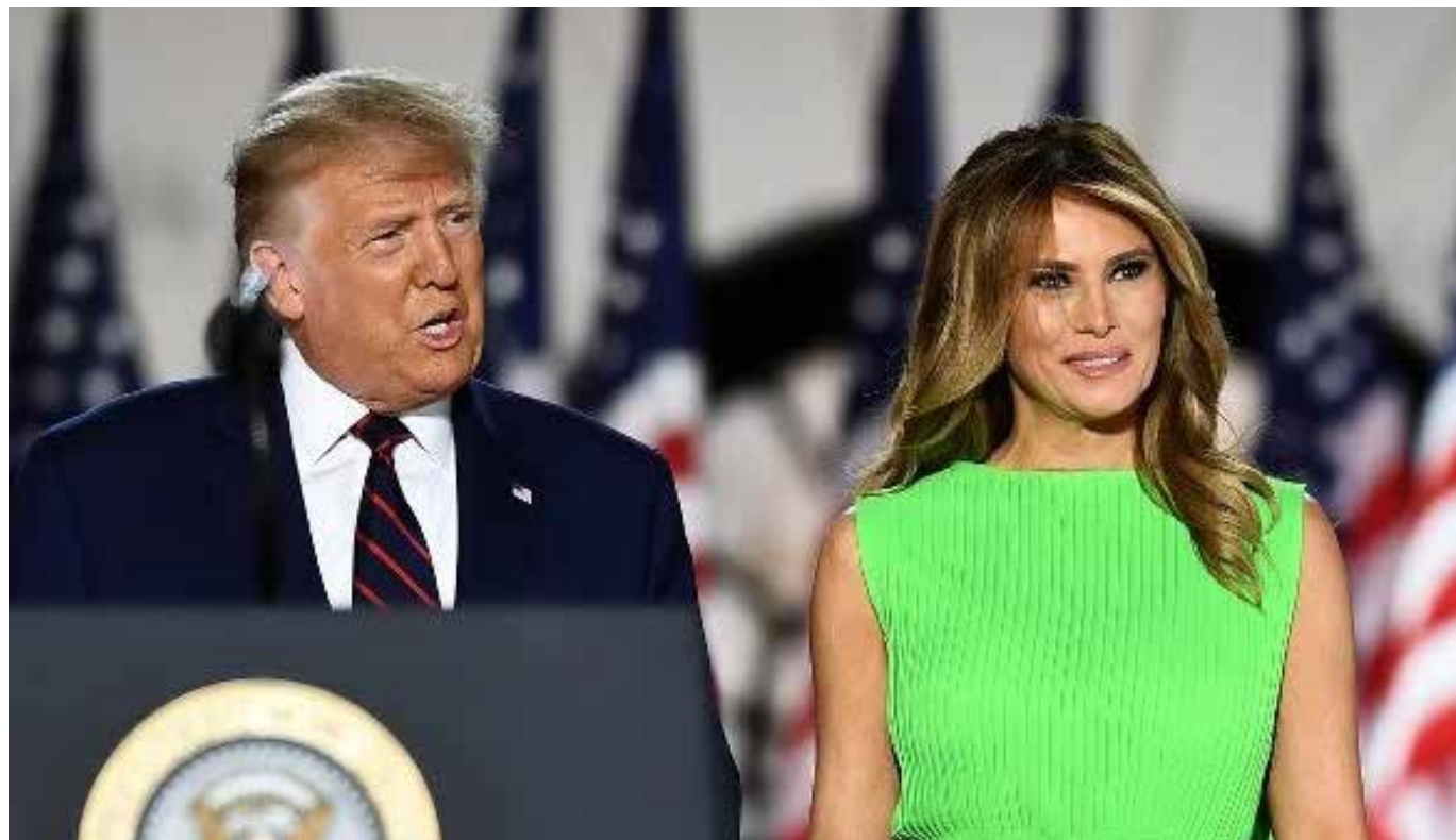
Donald Trump y su esposa Melania en la convención del Partido Republicano.

¿Por qué hay un representante Republicano en México?