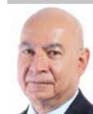
Por | Luis Manuel Robles Naya