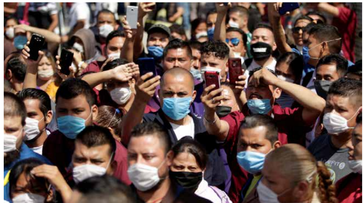
En el nuevo milenio México ha sufrido dos pandemias: 2009, epidemia de influenza y 2020, la epidemia de COVID 19.

cano brilla en su ausencia, sobre estos temas, y es donde observamos que el derecho mexicano ha sido rebasado por la ciencia, en donde al abogado, se le da una formación de intérprete de la ley mas no de racionalizarla como tal, y por ende el marco jurídico se convierte en un lienzo mil veces pintado del mismo color, sin aportar algo que favorezca a la sociedad mexicana.