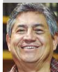
Por | Héctor Romero Fierro