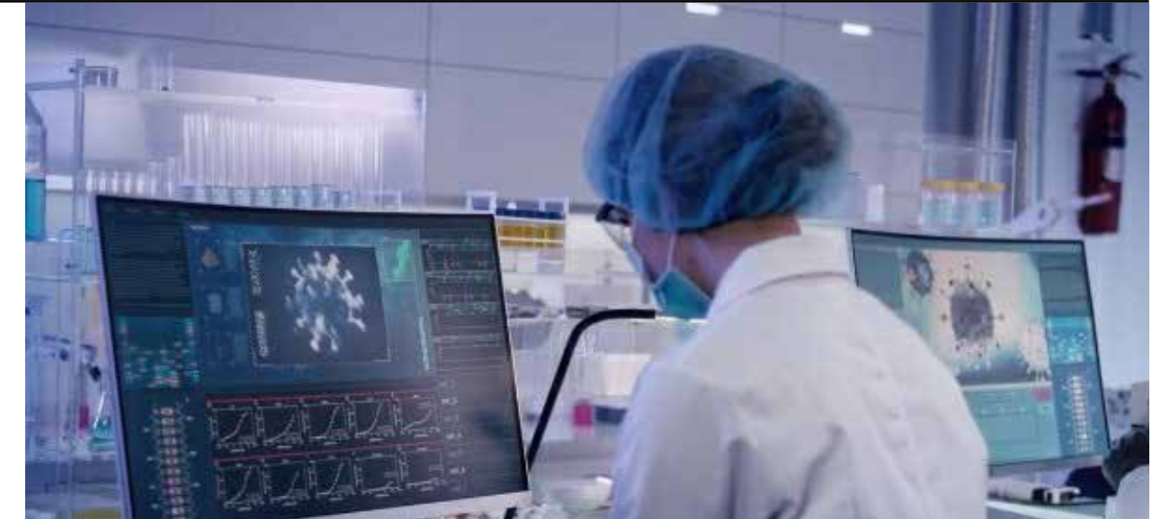
Férrea competencia vive el mundo por la guerra entre las potencias por ser el primero con la vacuna contra el coronavirus en los mercados.

Imagine que el negocio del COVID-19 deja más de