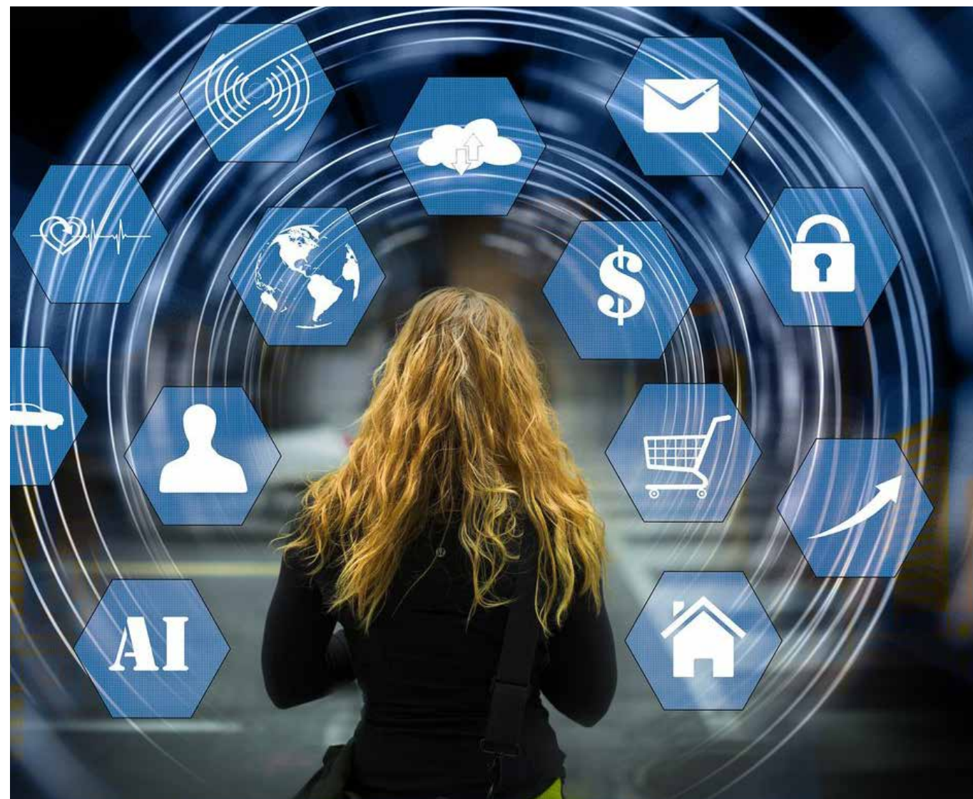
Facebook, Twitter, Instagram, Youtube y ahora, Tik Tok, no solo son centros de interacción, también se han convertido en centros de reconocimiento y de rechazo social, en los que cada like representa aprobación.

Pero las cifras expuestas por Jonathan, se ponen aun peor, ya que el mismo patrón se presenta con los