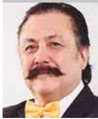
Por | Alfredo Ponce