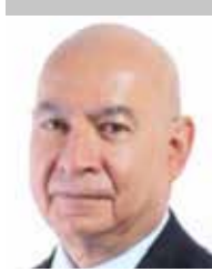
Por | Luis Manuel Robles Naya