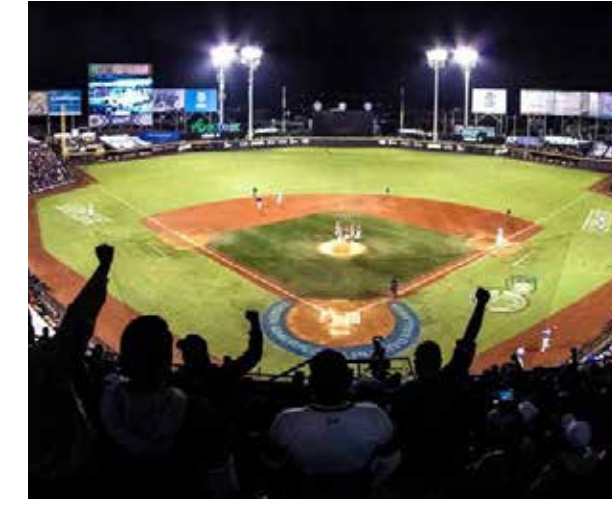
Los cotejos en la Liga Mexicana del Pacífico se jugarán con público presente.

Pero hay que observar que todo puede pasar en las dos semanas que aún restan de cotejos; rachas buenas o de fracasos que puede enfrentar cualquier equipo, podrían