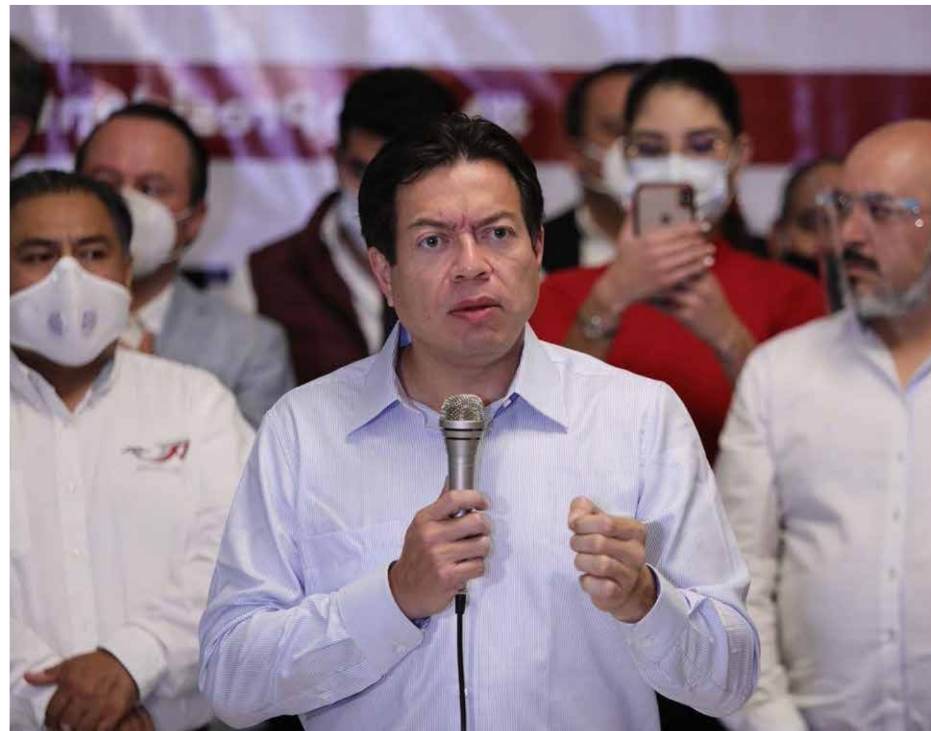
Mario Delgado, candidato a la presidencia de Morena, estuvo en Guadalajara y encontró amplio respaldo de los morenistas locales.

“El Presidente de la República hace más de un año, siendo el que mejor conoce