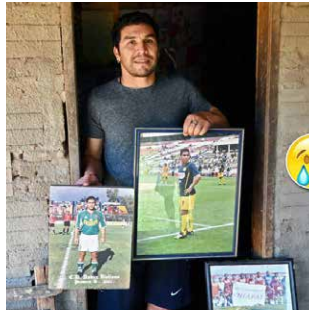
Salvador Cabañas vio truncada su exitosa carrera de futbolista en un bar de la Ciudad de México, donde tuvo un altercado con un supuesto narcotraficante que le dio un balazo en la cabeza.

Como anécdota cabe destacar en un encuentro internacional en la ciudad de Los Angeles, California de carácter amistoso se enfrentaron Chivas de Guadalajara contra el