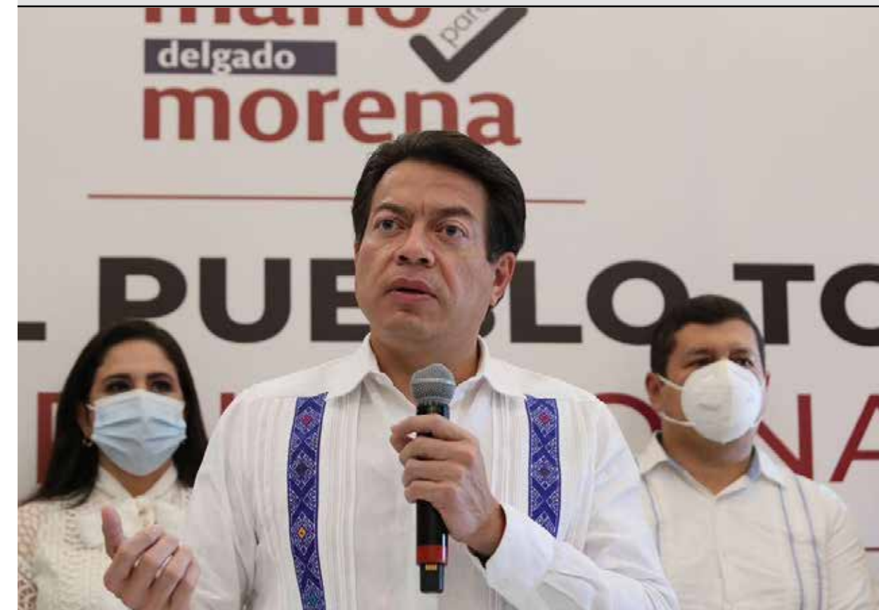
La unidad es fundamental, es el principal compromiso, les precisó Mario Delgado a los morenistas y seguidores de la 4T en Jalisco.

“No queremos representantes que lleguen por MORENA, se les olvide y luego se vayan libres para el monte y hagan lo que quieran. No, tienen que estar apegados, tienen que hacer en cada acto un imperativo ético para que la gente vea por qué somos diferentes”.