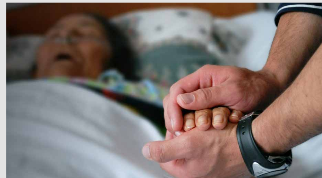
En México la muerte siempre ha sido un tema cultural, mas no terapéutico, desde la tanatología, la biojurídica y la psicología, es decir científico.

ideas, ¿entonces la podemos considerar como un suicidio?