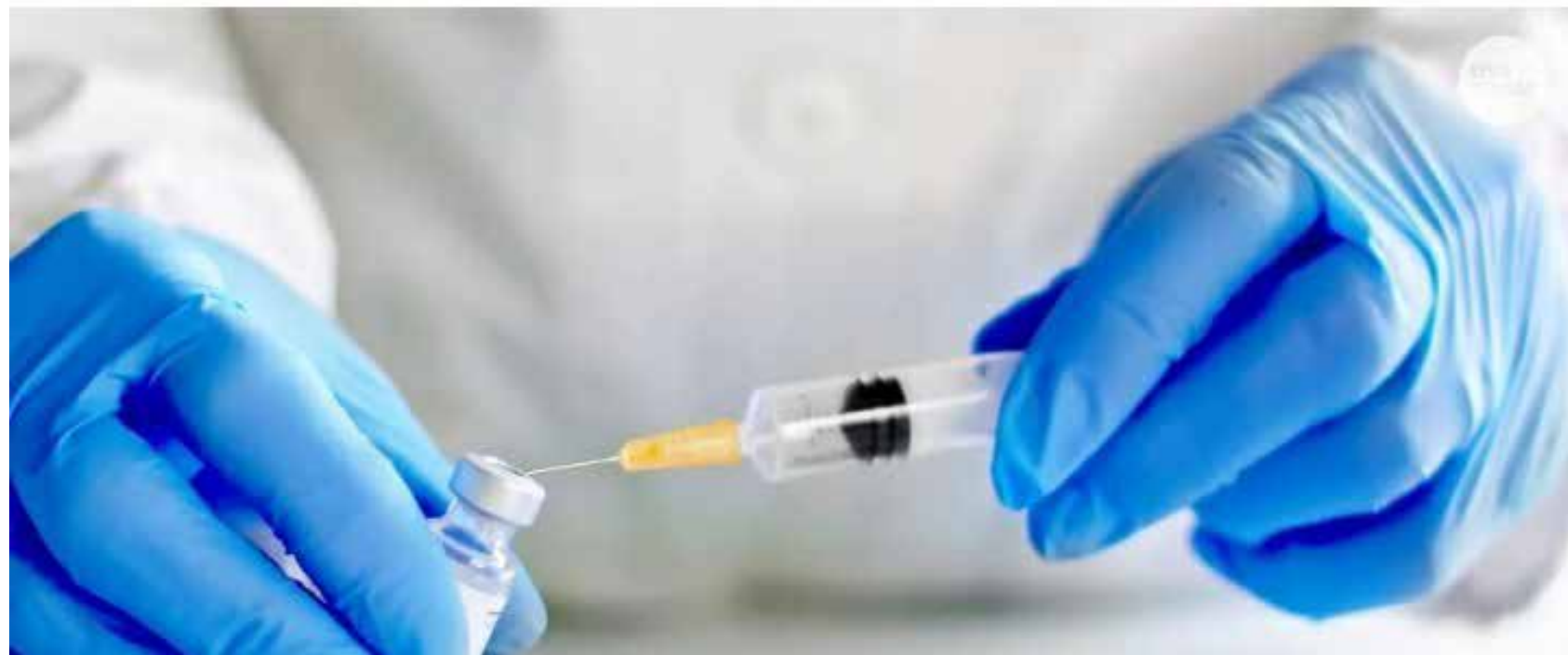
Cuanto esté la vacuna los gobiernos deben levantar las cuarentenas y medidas de restricción ya que si alguien se enferma será por su propio gusto al no tomar la vacuna.