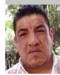
Por | Daniel Emilio Pacheco