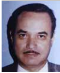
Por | Pedro Vargas Ávalos