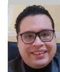
Por Erick Brandon Palacios Sánchez