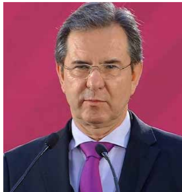
Esteban Moctezuma, Secretario de Educación. La capacitación del maestro carece de valor en el presupuesto del 2021, ya que aproximadamente se destinan para cada maestro $78.66 pesos al año y por mes de $6.50 pesos.

El presupuesto educativo, tiene un oscuro horizonte, hoy que es imperante la inversión en educación para cumplir con las metas del plan sectorial de educación y otros acuerdos internacionales pactados, el Gobierno de México decide limitar y poner freno a la educación en el país, con la eliminación de 13 programas educativos se estaría afectando considerablemente varios sectores sociales, principalmente los más desprotegidos, por ejemplo con el de las Escuelas de Tiempo Completo se afecta a las comunidades indígenas y rurales de alta marginación, así como a padres y madres que trabajan,