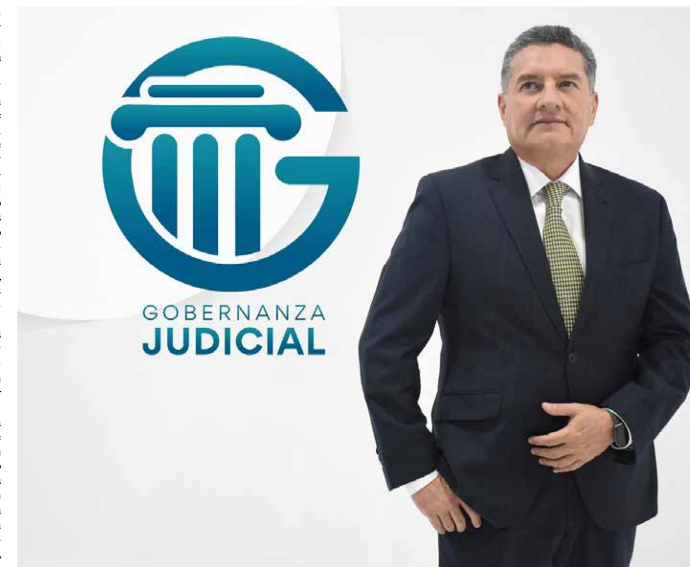
La cultura de la rendición de cuentas con transparencia, oportunidad e integralidad, debe ser considerada como un eje transversal que por tanto requiere su abordaje desde varios ángulos.

La cultura de la rendición de cuentas con transparencia, oportunidad e integralidad, debe ser considerada como un