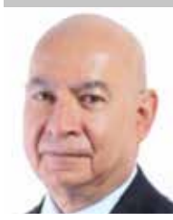
Por | Luis Manuel Robles Naya