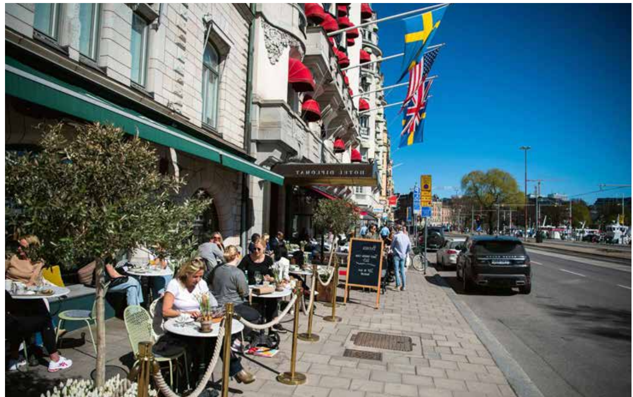
La población en edad productiva está siendo afectada en su salud física y mental por los efectos económicos y sociales de las medidas lo que tendría como las adicciones, efectos permanentes.