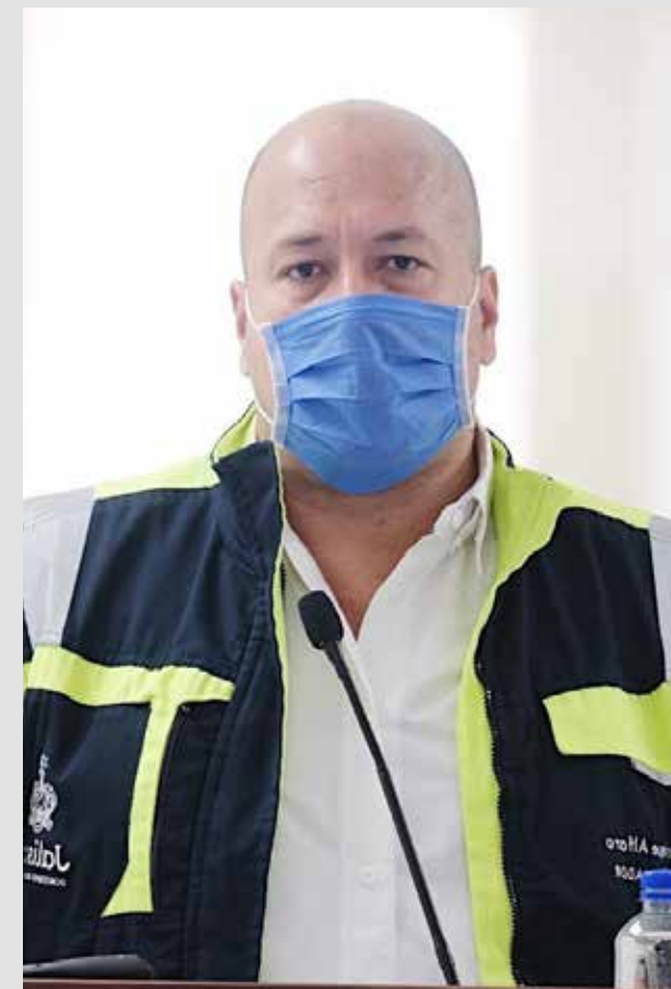
En los primeros diez días se acumularon en el Estado 6,798 casos de personas contagiadas por COVID-19 y extrañamente los casos de enfermos hospitalizados van a la baja, conforme la narrativa del Gobernador Enrique Alfaro.

Según la Secretaría de Salud Jalisco, el 30 de septiembre se reportaban solo 576 hospitalizados por Covid-19