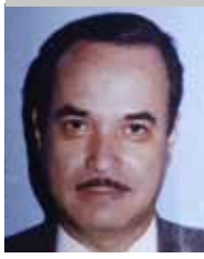
Por | Pedro Vargas Avalos