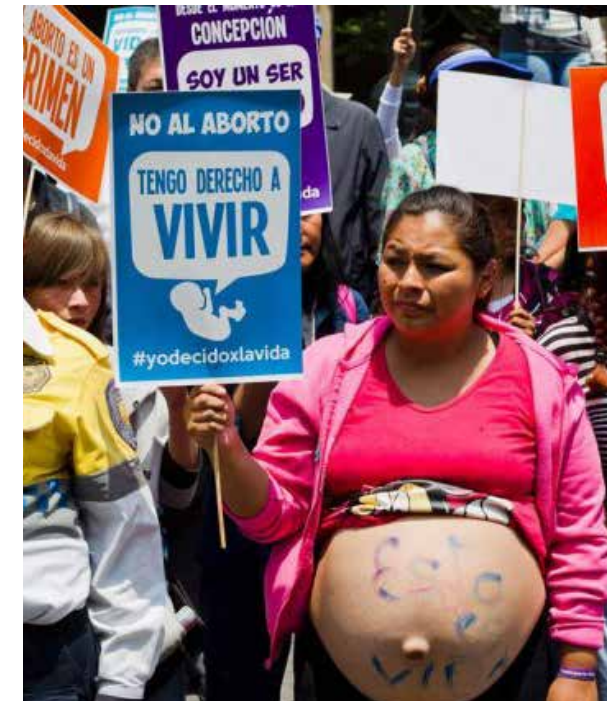
Un tema que controvertido y que divide a los mexicanos, el aborto.

En México, los derechos reproductivos de la mujer están protegidos por el Estado mexicano. Todas y todos tenemos acceso libre y gratuito a pastillas anticonceptivas y preservativos, y a operarnos para no embarazarse ni embarazarnos. Nadie podría negarlo sin mentir ni mentirse. El discurso feminista de ampliar los derechos reproductivos al aborto legal -ya reconocido- me parece que cae en un juego interesante: Presentar una premisa falsa para llegar a una conclusión mentirosa. En México y en casi el resto del mundo, el aborto dejó de ser un crimen punible para convertirse en un crimen legal a partir, insisto,