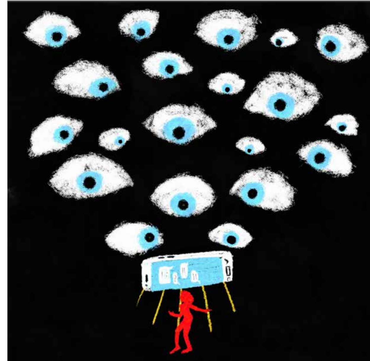
A pesar de las burlas y ofensas realizadas por los habitantes de Huauchinango, la joven intentó acceder a la justicia, y fue cuando su segundo via crucis empezó.

Esta ley también prevé que las autoridades ordenen a las empresas prestadoras de servicios digitales el retiro inmediato de la publicación realizada sin consentimiento de la víctima, así como entregarle una orden de protección a la mujer. Se tipificó el ciberacoso y las penas van desde trabajo comunitario hasta cuatro años de prisión.