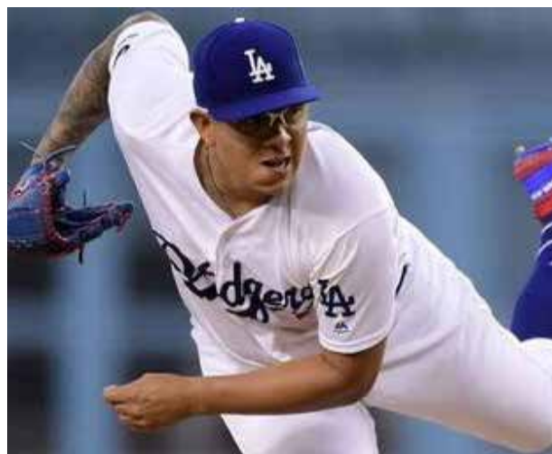
El lanzador zurdo mexicano Julio César Urías lo podremos ver lanzar por Dodgers en esta serie por el campeonato de la Liga Nacional frente a Braves de Atlanta.

En la Liga Americana, Mantarrrayas de Tampa Bay hicieron valer los pronósticos, dado que casi todo el calendario regular fueron el equipo mejor posicionado tanto en su divi-