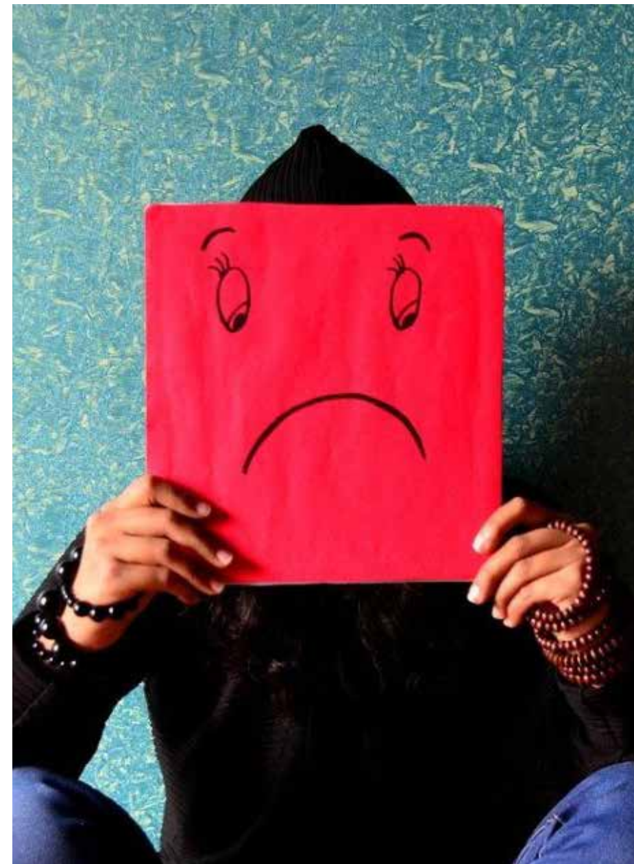
El establecer parámetros especializados dentro de la Carta Magna es fundamental, el concepto de salud en general no es suficiente ya que se deja desprotegido al ciudadano en su integridad a nivel mental.

bir. Esto sólo se exceptuará en el caso de internamiento involuntario, cuando se trate de un caso urgente o cuando se compruebe que el tratamiento es el más indicado para atender las necesidades del paciente.