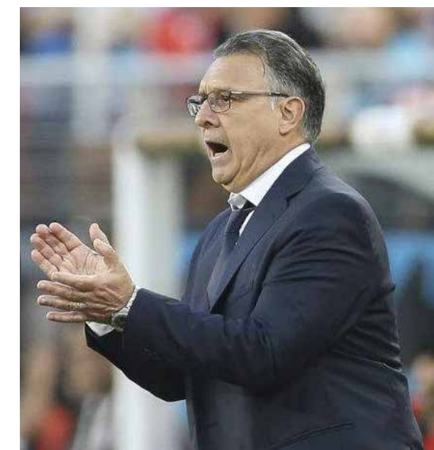
Un director técnico de jerarquía contrataron esta vez los responsables de la Selección Mexicana de Fútbol, como es considerado el argentino Gerardo "Tata" Martino, lo cual aplaudimos.

Las esperanzas que se tienen se basan en fundamentos del