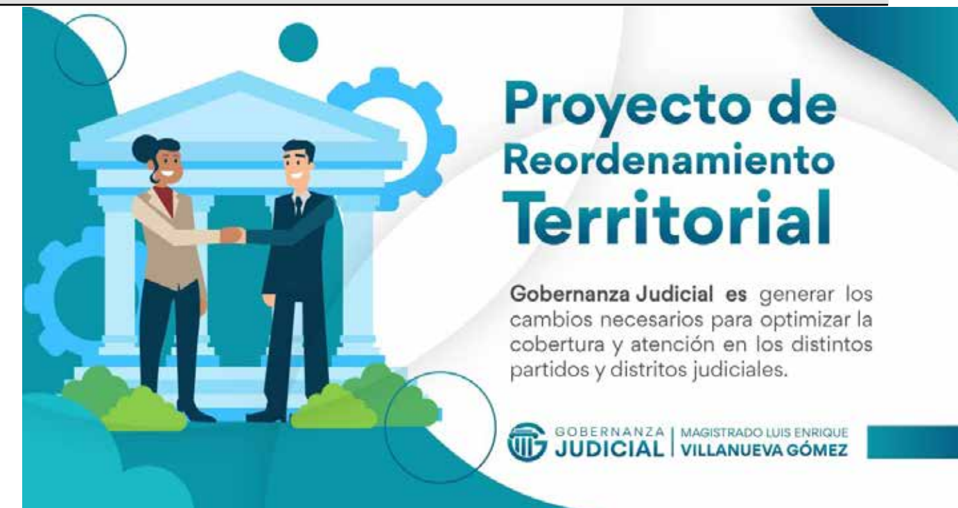
Proyecto de reordenamiento territorial que propone el magistrado Luis Enrique Villanueva.

Lo que es factible a través de la gestión y en su mo-