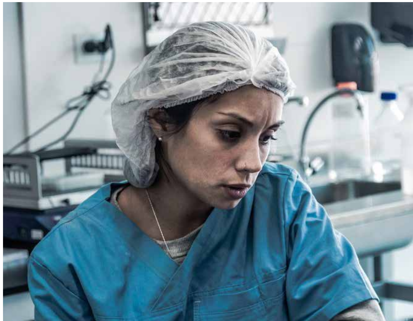
A nuestros gobernantes se les olvidaron los trastornos emocionales y trastornos mentales entre la población que generaría la pandemia en diversas edades, desde niños, adolescentes y adultos en general.

Como propuesta fundamental, sería calificar la salud mental de diversos