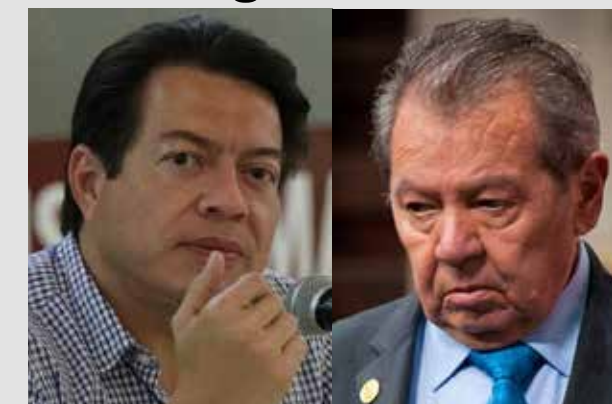
MARIO DELGADO/ CANDIDATO A LA PRESIDENCIA NACIONAL DE MORENA

“Nunca es tarde para madurar, Porfirio... ¿Cómo quieres ser recordado? Se puede llegar a la vejez con templanza y sabiduría, o se puede llegar, como dice Andrés Manuel López Obrador, como un ambicioso vulgar”.