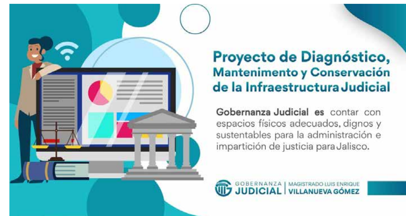
Proyecto de diagnóstico, mantenimiento y construcción de infraestructura del Poder Judicial.

mento la aprobación de un presupuesto plurianual que gradualmente le permita hacerse de sus propios inmuebles y dejar de pagar millonarias cantidades por renta de oficinas disminuyendo al mismo tiempo la posibilidad de injerencias insanas.