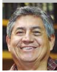
Por | Héctor Romero Fierro