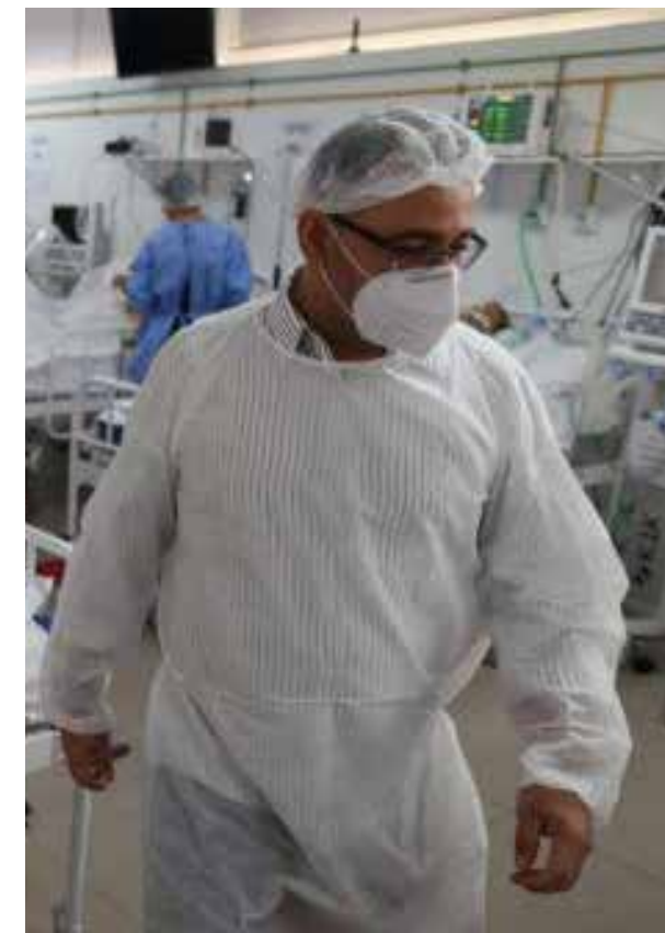
En verano los hospitales en Estocolmo estaban saturados, hoy están casi vacíos y las casas de ancianos, reabren poco a poco las visitas a familiares y amigos que sí limitaron durante el inicio de la pandemia.

EUA tiene una tasa de 23,718 enfermos por millón de habitantes con 658 muertos por millón de habitantes. Pero en las localidades de ese país hay grandes diferencias tanto en el porcentaje de enfermos como en el enfoque que se da a la pandemia, ya que cada entidad federativa es casi independiente en la mayoría de sus decisiones en contra de lo que vemos en otros países del mundo incluido el nuestro. Por ejemplo NY tiene un porcentaje de infección de 26,042 con mortandad de 1,715, California 21,405 infectados y 416 fallecimientos por millón de habitantes respectivamente, ambos estados son gobernados por el Partido Demócrata; Florida Estado gobernado por los Republicanos tiene 33,938 infecciones y 707 muertes por millón de habitantes,