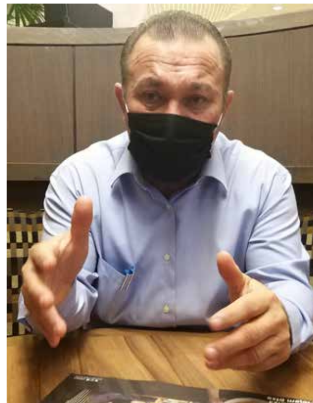
El Presidente López Obrador quiere desaparecer a los pequeños productores lecheros, critica el diputado Jesús Hurtado Torres.

Recuerda el legislador local de Acción Nacional que al paso de los años el programa ha evolucionado y no solamente ha sido SEDESOL quien participa, sino la propia SAGARPA, unidas vinieron a complementar el programa y ha-