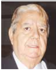
Por | Modesto Barros González