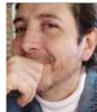
Por: Alberto Gómez-R.

El modelo económico del neoliberalismo global en realidad sólo benefició a las economías más poderosas; basado en el libre mercado, abrió la posibilidad de expandirse hacia los mercados de otras latitudes y culturas que lo adoptaron con la esperanza de que sería la mejor solución a las crecientes desigualdades sociales (¿?).