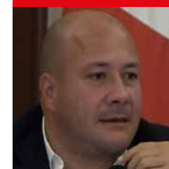
> ENRIQUE ALFARO/ Le piden intervenga como árbitro.