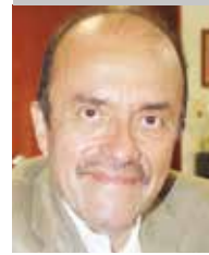
Por | Benjamín Mora Gómez