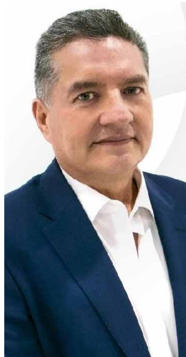
El magistrado Luis Enrique Villanueva propone un amplio proyecto de remodelación y adecuación de espacios para el Poder Judicial que le permita estar a la vanguardia en la impartición de justicia y facilitar la labor del Poder Judicial.

La premura con la que fueron construidas y adaptadas las salas de enjuiciamiento dejó algunas deficiencias que no han podido ser resueltas, no solo de instalaciones con filtraciones y fallas eléctricas, también de sistemas de registro audiovisual, además de resultar ya insuficientes para el número de audiencias que con el nuevo sistema penal en marcha se han venido incrementando al grado de