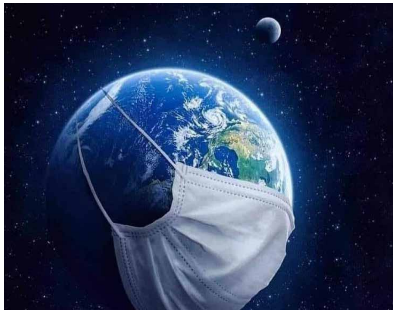
En estos tiempos de pandemia, con los cierres obligados de los sectores productivos -a excepción del primario- es posible distinguir algunos factores que están generando las condiciones para un verdadero cataclismo económico.

En el contexto de conflictos internacionales, es posible distinguir -incluso afirmar- que la Tercera Guerra Mundial se está sucediendo ya, con la diferencia de que comenzó no siendo bélica, sino económico-financiera. La confrontación comercial de China con los Estados Unidos y sus aliados está siendo el nuevo escenario de tal guerra; la globalización ocasiona que, aunque se trate de dos naciones en una abierta lucha por el poder mundial, los impactos socio-económicos se manifiestan en muchos otros países con los que ambas