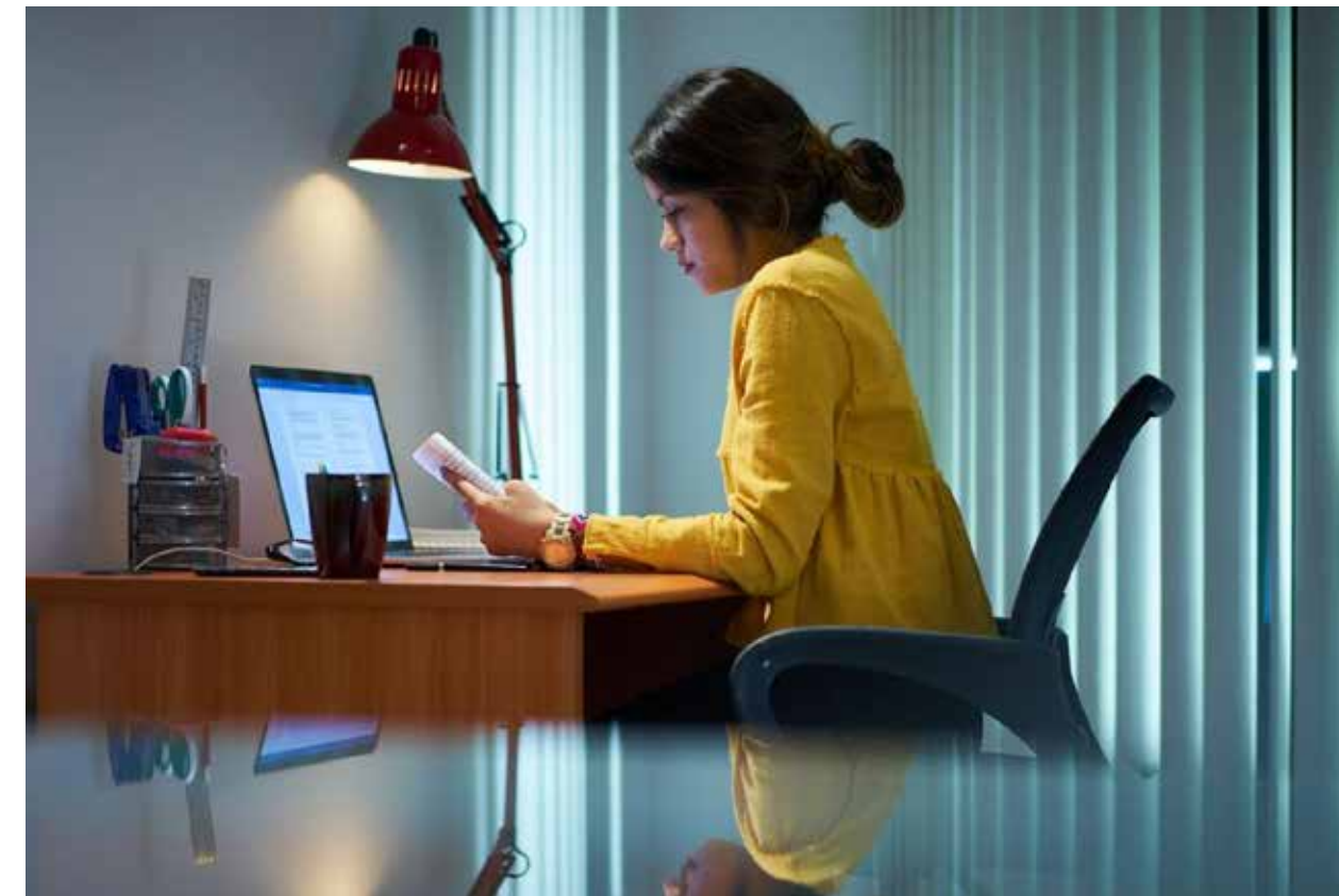
Hay muchas interrogantes sobre el impacto que tendrá la educación a distancia que ha obligado la epidemia de Covid al sector educativo.

Cuando se hicieron encuestas rápidas para ver si los estudiantes contaban con computadora, internet y celular, o en todo caso televisión para seguir los programas de "Aprende en Casa" los resultados vaticinaban un éxito en el programa, resultado que está lejos de la realidad, y que hoy (como suele suceder) busca en la figura de los profesores, al culpable responsable de no estar encontrando los medios que superen esta y otras situaciones igual de graves.