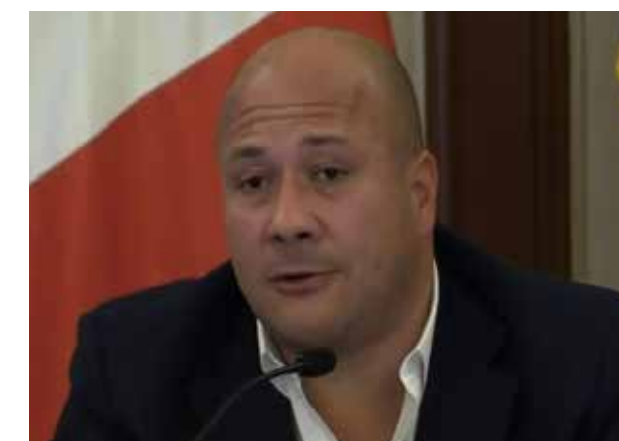
ENRIQUE ALFARO/ GOBERNADOR DE JALISCO

“Libramos una semana más. En los indicadores COVID19 Jalisco de esta semana, la tasa de casos estimados por millón de habitantes bajó de 360 a 348, pero seguimos al límite de los 400, y aunque la ocupación hospitalaria se mantiene estable, subimos del 19.3% al 21%”.