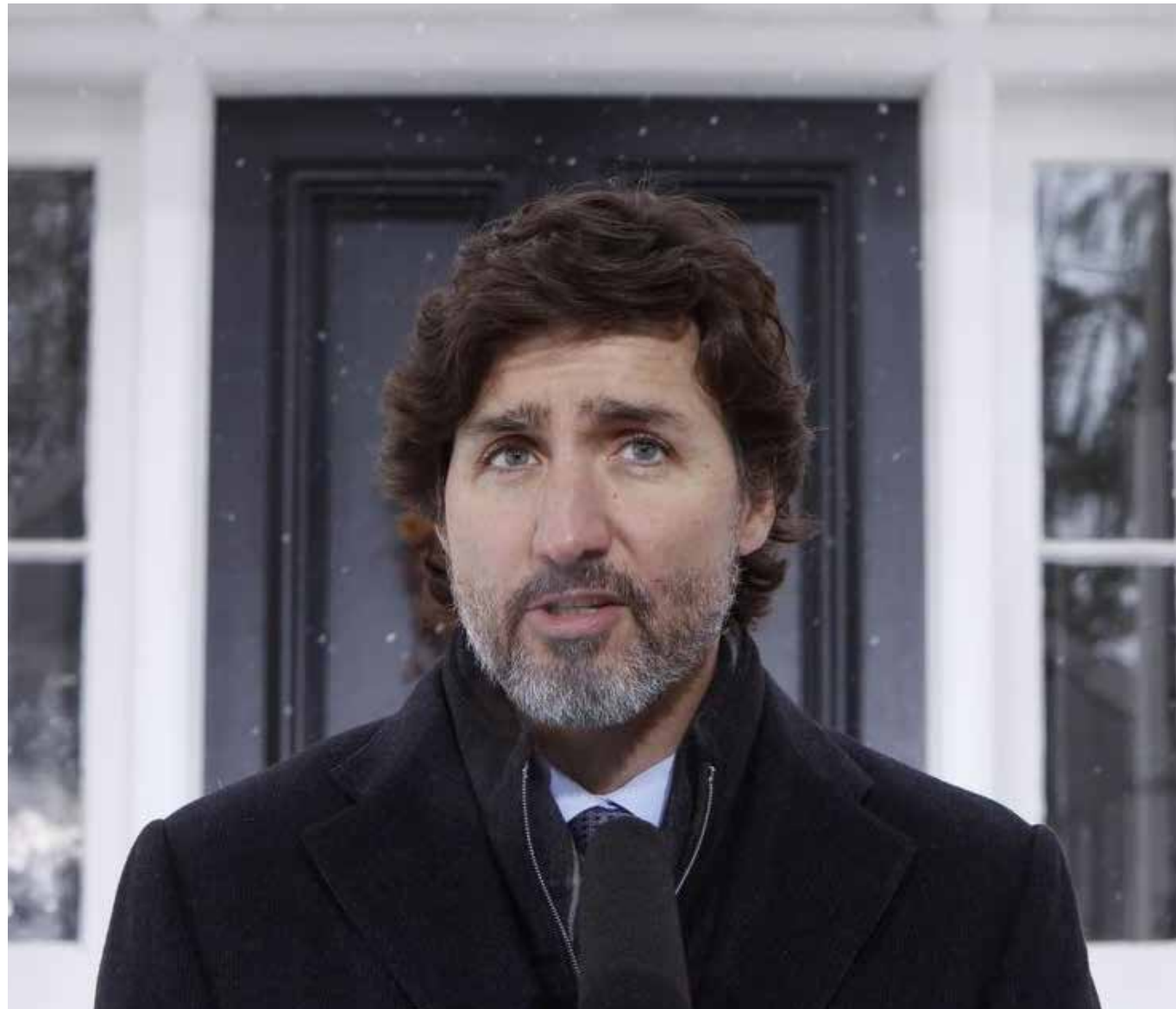
El Primer Ministro de Canadá, Justin Trudeau, incumplió su compromiso con el proyecto Covax en el que la OMS distribuirá 330 millones de vacunas contra Covid-19.

bre de ese mismo año, dicha postura puso presión a todos los competidores y dio referencia al entonces Presidente de EUA –Trump– para decir en público que dichos fármacos estarían listos en otoño del año pasado. Naturalmente los funcionarios médicos de casi todo el mundo, incluidos la OMS y el famoso Dr. Fauci de EUA, pensaron y declararon que eso era imposible, pero los empresarios y científicos de Pfizer, Moderna y Astra demostraron que sí lo era. De hecho, los “expertos” altos médicos burócratas decían que lo menos serían dos o tres años, pero ya vemos que hasta Rusia, China y la India han desarrollado sus propias vacunas en menos de 12 meses. DE LA MUERTE A LA ESPERANZA Según el diario “Jewish Journal”, el Primer Ministro Benjamín Netanyahu estuvo muy en contacto con el doctor Bourla para asegurar las dosis necesarias y tempranas de la vacuna vs el Covid19 a favor del pueblo israelí. El Gobierno israelí ha tenido una historia de éxito con su programa de vacunación siendo ejemplo para el mundo. Pero poco se podría haber hecho si no se contase con el