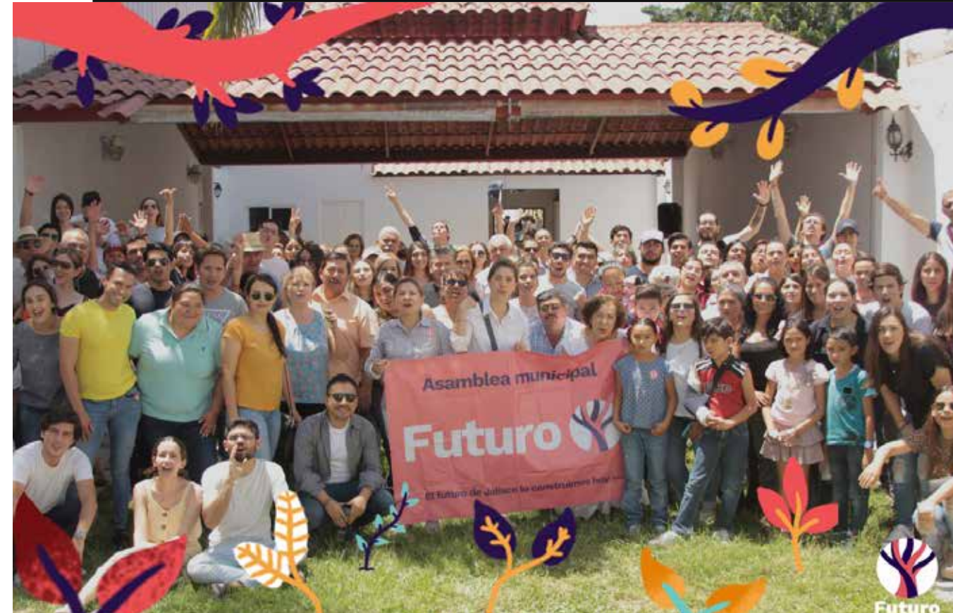
Futuro, la esperanza de los jóvenes y un espacio importante de participación política en Jalisco.

“Creo que la misma fortaleza de Futuro en el pleno de su vinculación con los jóvenes es algo que va a tener que irse decantando, porque así en el lenguaje coloquial a Pedro Kumamoto y a lo que fue Wikipolítica, se le conocía un tanto vinculado con el ITESO, eso es algo que hay que ir trabajando para que se entienda que Futuro sí representa una opción diferente, auténtica, que no tiene compromisos con un grupo de poder local”.