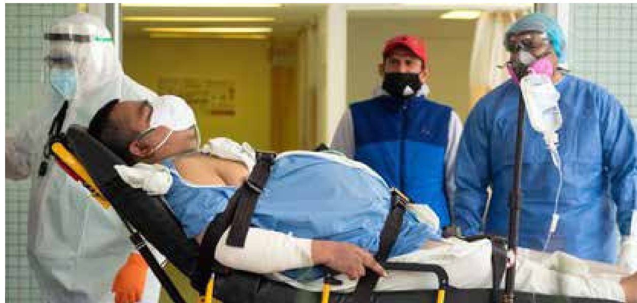
El Bioderecho debería regular, entre otras, el proceso jurídico médico de la pandemia del COVID 19 en México.

Cabe señalar que el concepto de Bioderecho no existe en México dentro de la doctrina, y que los colegios de juristas, no se han preocupado por adoptarlos y por ende su alcance en el país deja mucho que desear.