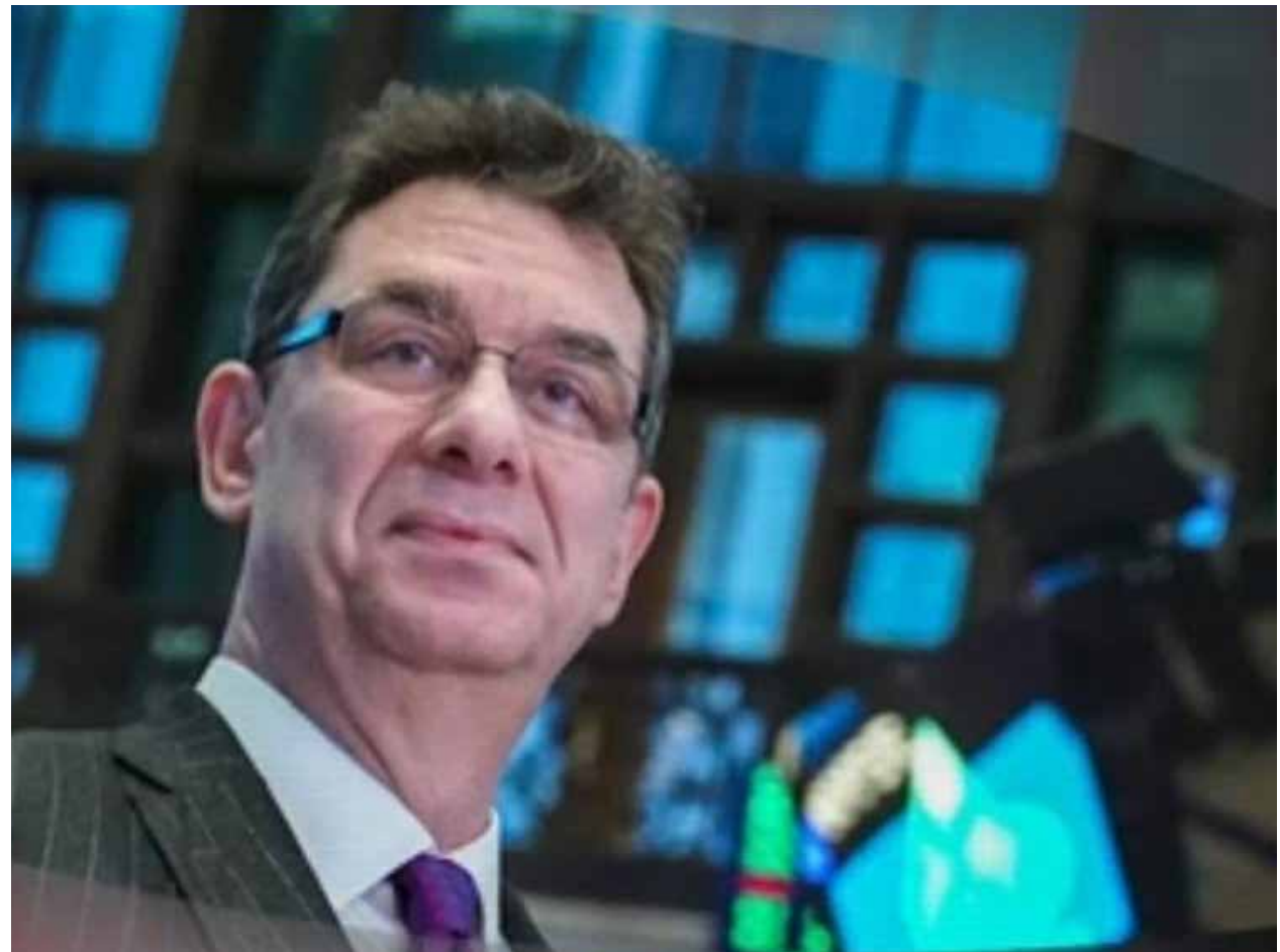
Albert Bourla es director de la empresa Pfizer y responsable de la vacuna contra el Covid19 elaborada por dicha empresa.