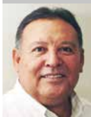
Por Jesús Alberto Rubio