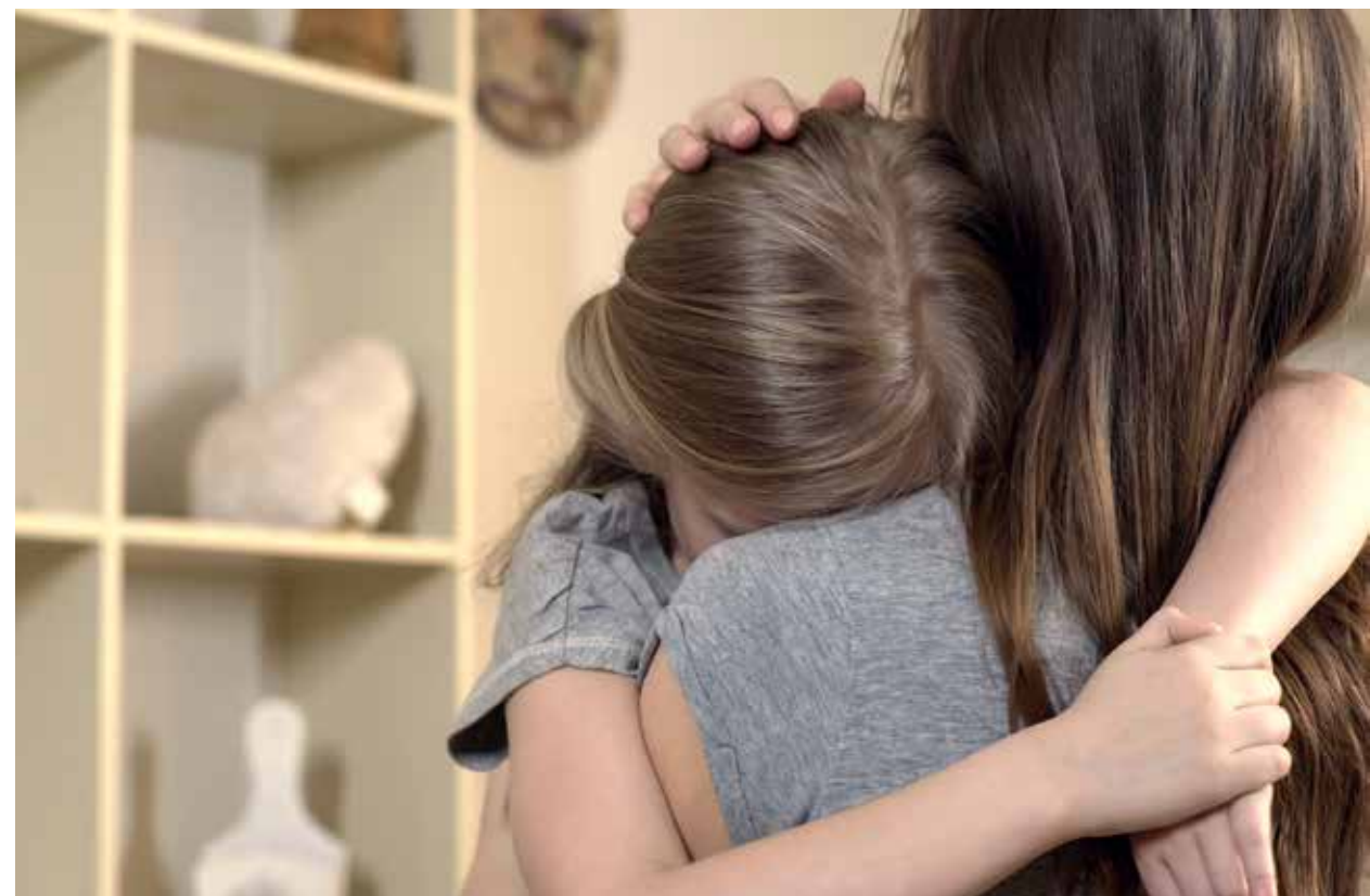
Un aspecto importante a considerar dentro de este momento de crisis es, ¿cómo estamos acompañando a nuestros niños a procesar el dolor ante la partida de un ser querido?

La educación es el acompañamiento que potencia las capacidades del ser humano de forma integral; el desarrollo físico, psicológico, intelectual y emocional se dan generalmente en la escuela, y son los profesores y tutores, quienes tienen la encomienda de guiar a los pequeños estudiantes en su proceso de crecimiento y elaboración de herramientas suficientes que les permitan enfrentar un mundo lleno de retos y adversidades; sin embargo, hoy el confinamiento demanda a los padres de familia ejercer un papel protagónico en el proceso de los menores, al mismo tiempo que vemos cómo los contenidos curriculares han quedado rebasados por una serie de eventos que no dejan de generar procesos de enseñanza-aprendizaje diferentes.