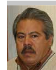
Por | Cayetano Frías Frías

El Bioderecho en México es visto como algo muy lejano, como una historia de ciencia ficción, siendo que ya la realidad rebasó el ámbito legal y, por ende, no se está dando solución a los casos que se presentan día a día. Para México, el Bioderecho se podría definir como la respuesta jurídica que reciben las preguntas formuladas por la Bioética personalista y utilitarista.