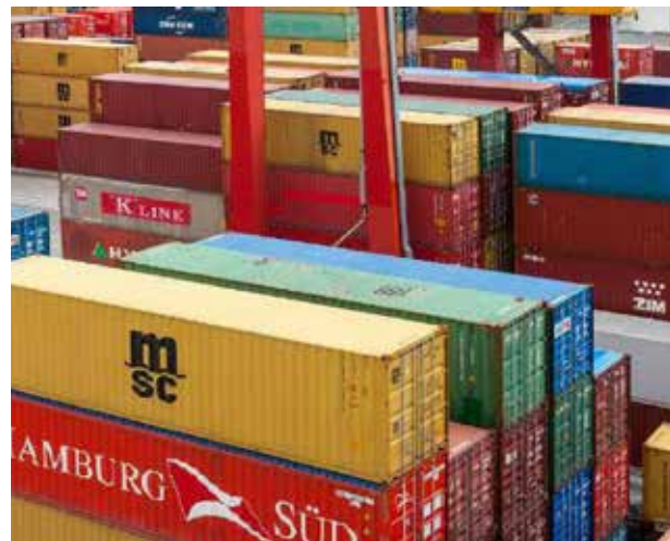
La recuperación de la economía mundial está sujeta al control y disminución de la pandemia de Covid-19 en el mundo, lo que hoy no se advierte que esté cerca con todo y el descubrimiento de vacunas.

Las restricciones aprobadas en noviembre, durante la segunda ola, provocaron una recaída del empleo y las ven-