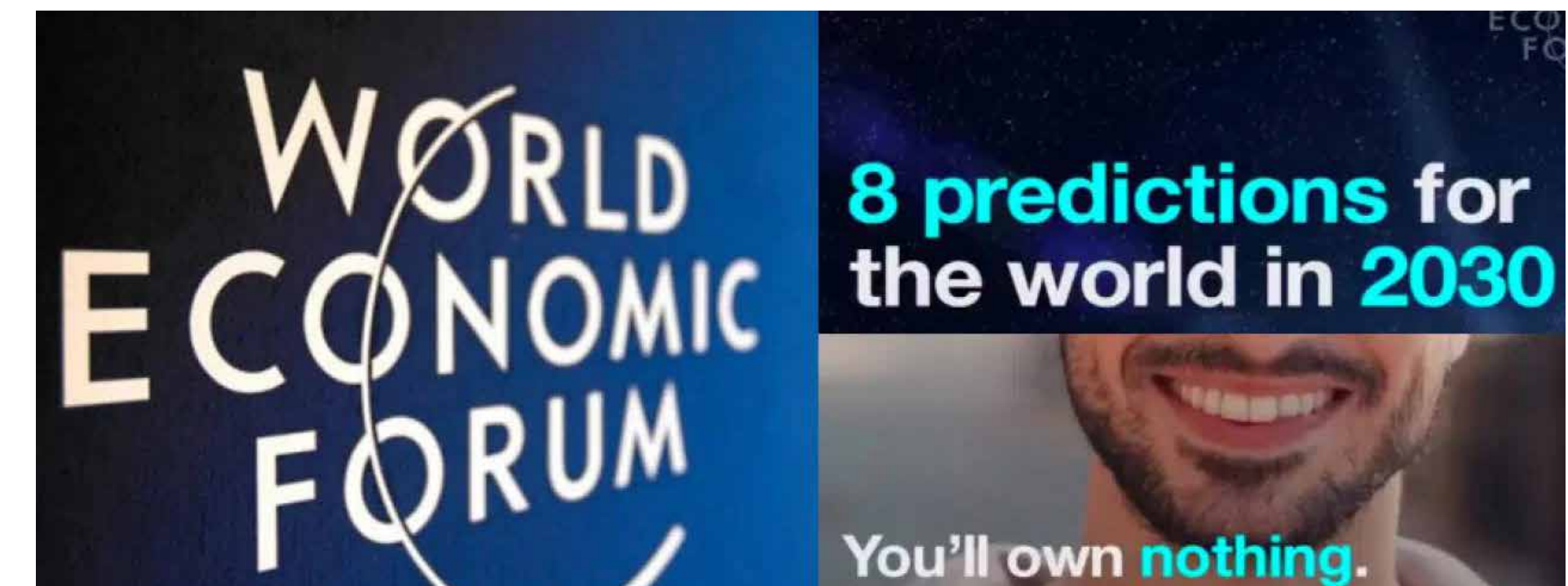
¿Qué es el nuevo capitalismo globalizado? ¿Es más humanitario o es el ropaje que utilizan un sector del gran poder para acrecentar sus controles?