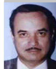
Por | Pedro Vargas Ávalos