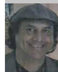
Por Esteban Trelles