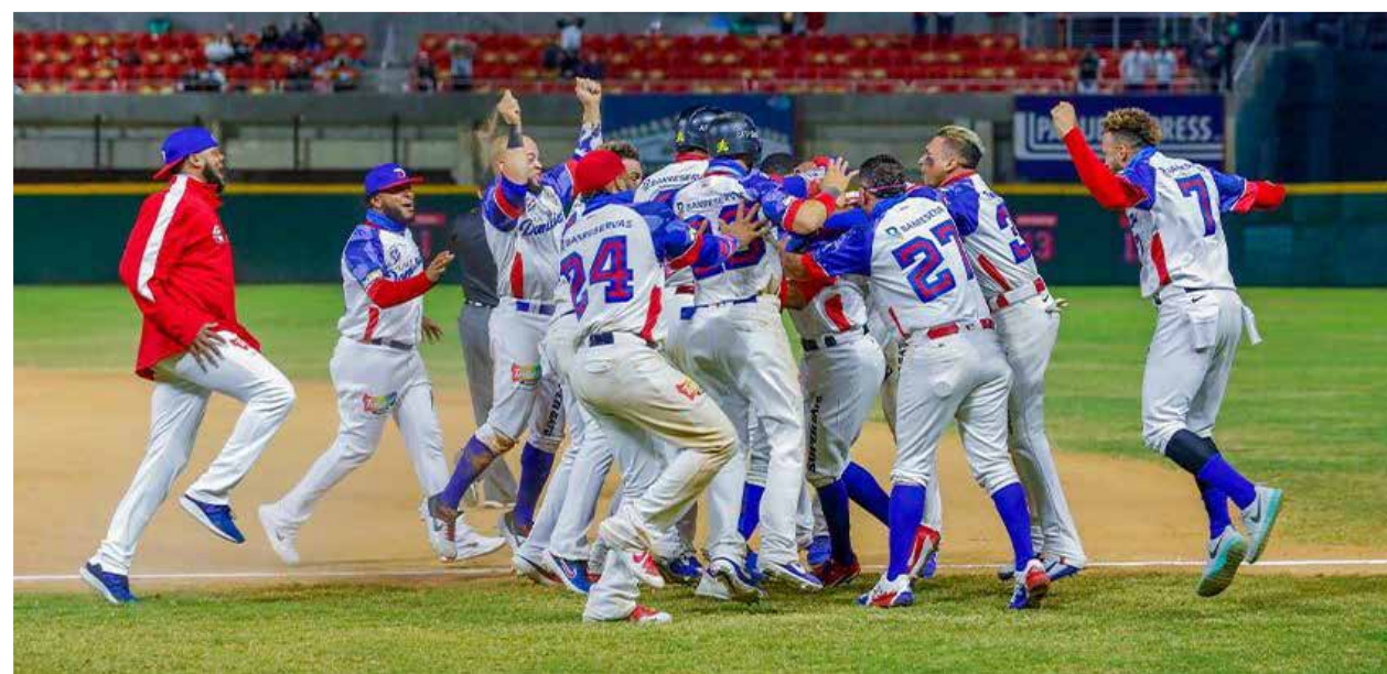
Las Águilas Cibaenas conquistaron en gran forma la corona caribeña y con ello le dieron a República Dominicana su No. 21 en la historia de la Serie del Caribe, el gran líder en ese rubro.

tación mexicana peleó y las derrotas fueron muy cerradas. No se diga ante Puerto Rico.