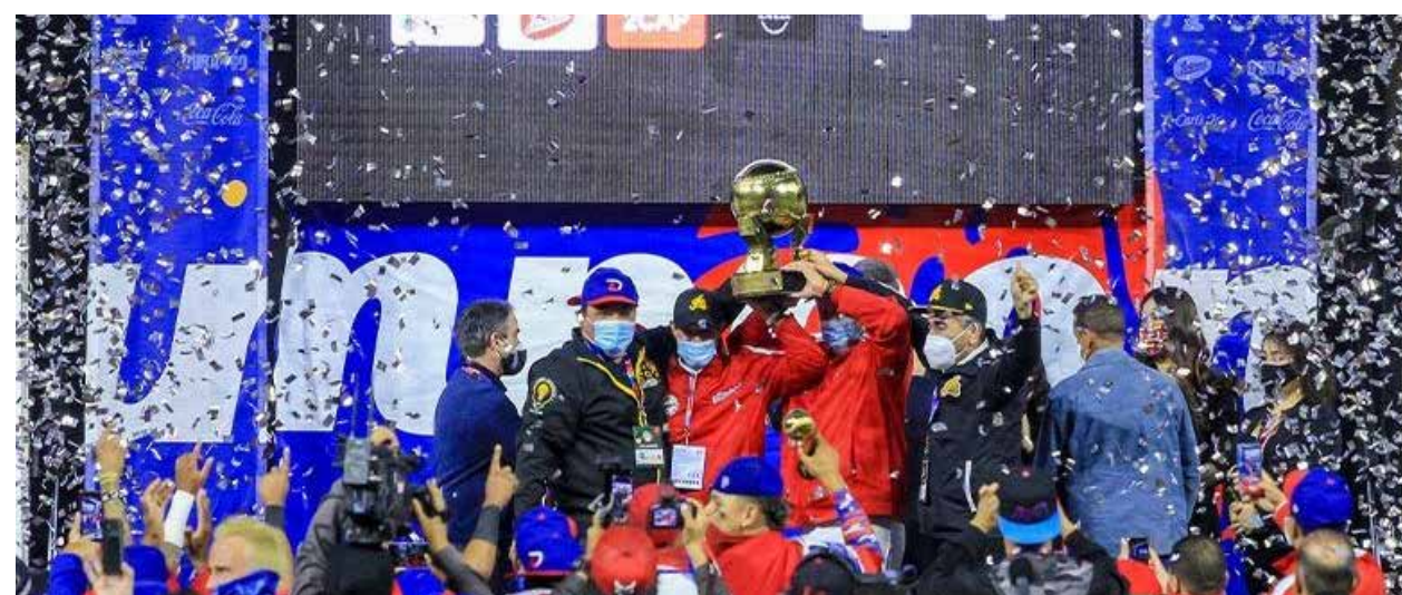
Águilas Cibaenas trasciende ahora por ser el primer equipo de la historia en ganar la Serie del Caribe con un invicto de 7-0.