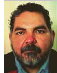
Por | Simón Macías Páez (*)