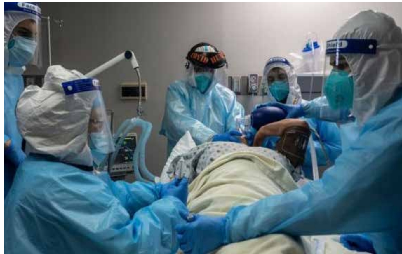
A la fecha, han fallecido más de 530 mil habitantes estadounidenses, con más de 29 millones de personas contagiadas en ese país desde el inicio de la pandemia.

Esta recesión y la creciente pérdida de valor del dinero —dólares estadounidenses para mayor precisión— se fue acumulando hasta encontrar un nuevo punto de fuga