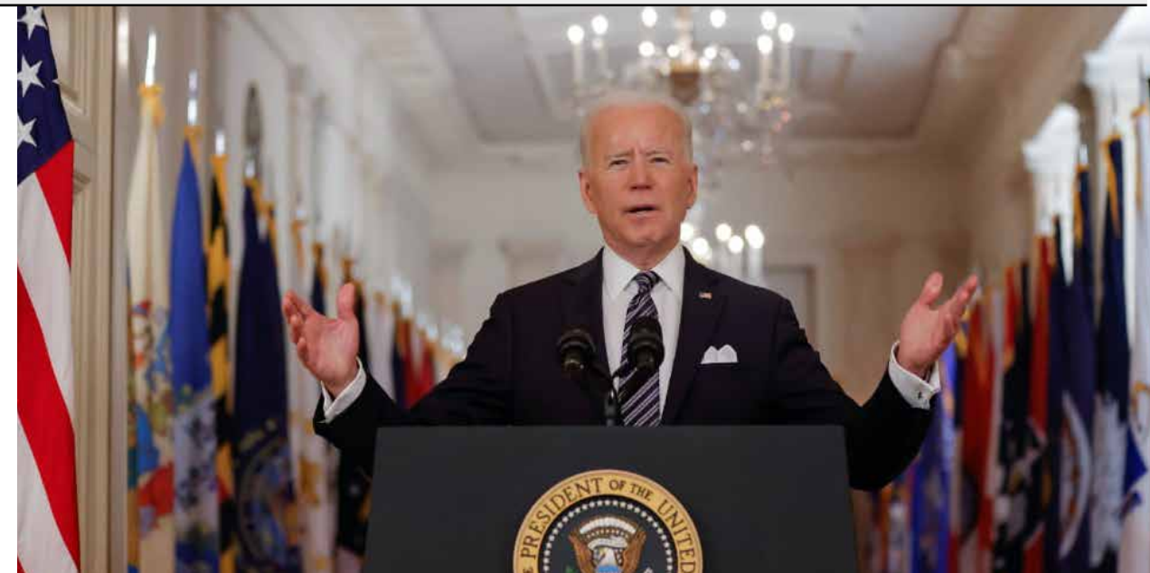
“El Presidente de la migración”, llamó a Biden Andrés Manuel López Obrador.

De los 100,440 migrantes detenidos durante febrero, 10 mil eran menores de edad, 71 mil eran adultos sin compañía y casi 20 mil eran familias. Esto indica que el 20% de esta emigración se da con todo y la familia en un solo acto. Pero alguien organiza la ruta y esos son los cárteles que son de facto los dueños de dichas rutas que van desde el sur de México hasta el interior de los EUA. ¿Quién organizó la fabricación y distribución de las playeras tipo campaña electoral entregadas y portadas por cientos de migrantes que se supone vienen de manera espontánea?