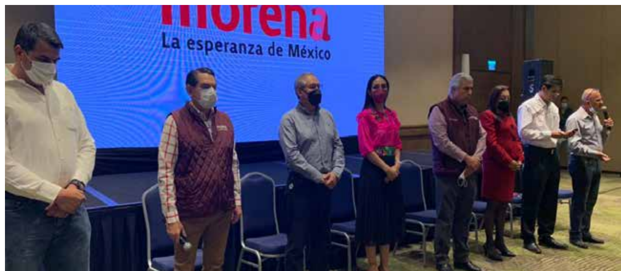
Se esperaba que José Narro diera a conocer la lista de candidatos a diputados locales que postulará Morena, pero nada, no salió humo blanco, dejando de nuevo la incógnita.