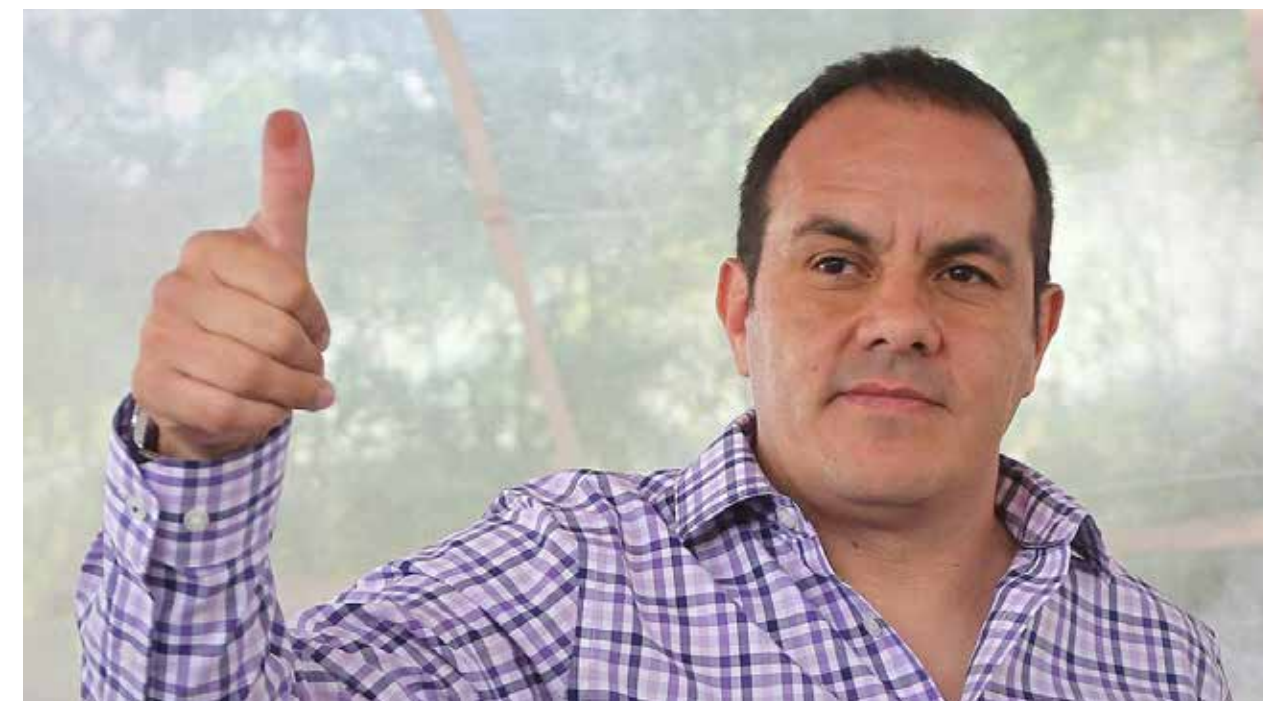
Los partidos buscan votos y postulan a gente famosa, como deportistas y artistas, pero que suelen hacer papeles desastrosos, porque no tienen la preparación que esta responsabilidad exige, como es el caso del futbolista Cuauhtémoc Blanco, quien es gobernador de Morelos.