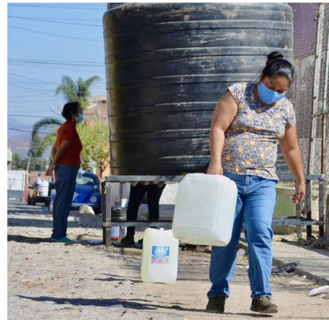
Son cientos de colonias que en estas últimas semanas se han quedado sin agua a las cuales el Siapa les promete abastecer del líquido con pipas, pero no se da abasto con la necesidad tan grande que se ha creado.

Vale la pena mencionar que los dos últimos, han cambiado radicalmente su discurso, su postura estaba en contra cuando eran candidatos y cuando ya llegan al poder, muestran otra cara y se manifiestan a favor de la obra, a sabiendas de que se extingan los pueblos de Temacapulín, Acasico