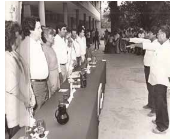
AQUÍ EN UN EVENTO DEL PRI en la década de los 80's. Allí se ven algunos personajes, varios de ellos ya fallecieron. Fue priista por siempre.