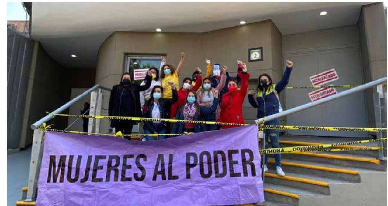
Las paritaristas han encabezado varias luchas y sacuden las estructuras del poder. Es un movimiento que se ve imparable.

Subraya: “Hay un pacto entre candidatas que no habrá agresiones entre ellas. Las Paritaristas haremos una firma donde las candidatas que se sumen firmen ante notario pú-