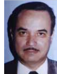
Por | Pedro Vargas Avalos