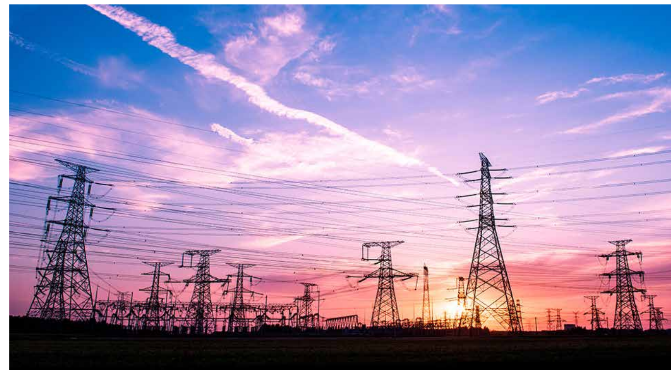
La suspensión esperará a que el 18 de marzo el juez determine si otorga la suspensión definitiva, cuando resuelva el fondo del caso.

Bien decía Alexander Pope: “Una persona terca no tiene opiniones, éstas lo tienen a él”. Andrés Manuel López Obrador cae, un día sí al otro vuelve a tropezar, en la trampa mortal de su testardez. No cambia de opinión, aunque todo demuestre que la razón jamás lo acompaña. Sus cifras y razones son otras y no coinciden con la rea-