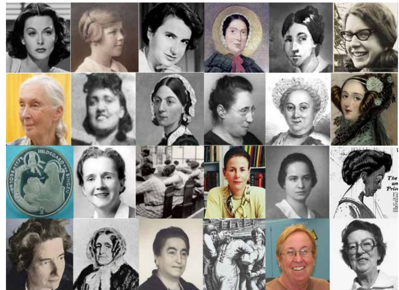
Mujeres iconos de la ciencia son el mejor ejemplo del feminismo que ha hecho grandes aportaciones al desarrollo de la humanidad.