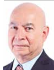
Por | Luis Manuel Robles Naya