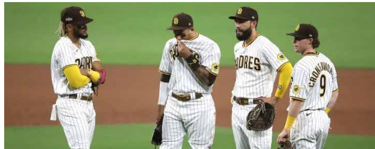
Apuntan a la rotación de Padres como la mejor para la temporada de Grandes Ligas que inicia en abril.

Si bien llegando noticias de MLB en cuanto a que en este 2021 diversas franquicias podrán jugar con determinado porcentaje de asistencias, o bien con el cien por ciento de los aforos de sus estadios.