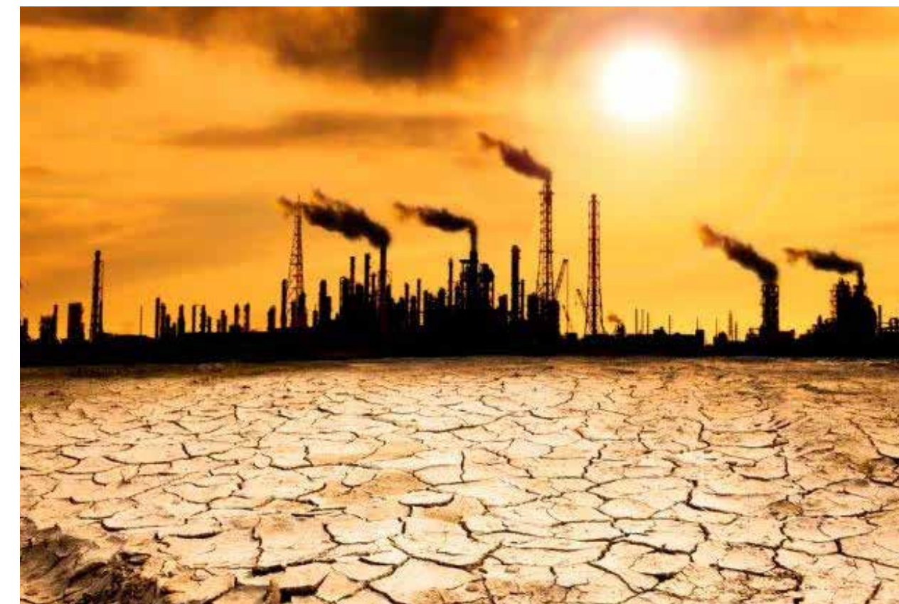
Las altas temperaturas con el calentamiento global provocarán que la escasez del agua deje de ser un simple problema de redistribución y recalibración, para convertirse en un verdadera crisis ambiental y social.

CIERTAMENTE VIVIMOS TIEMPOS DE CRISIS Y ANTE ESTO DEBEMOS ESTAR PREPARADOS POR LOS EXTREMOS, POR ESO, MÁS QUE IMPLEMENTAR ESTRATEGIAS DE REDISTRIBUCIÓN, ES MOMENTO DE REALIZAR ALIANZAS ESTRATÉGICAS PARA QUE A TRAVÉS DE LA COOPERACIÓN SE PUEDA PROMOVER LA GESTIÓN DE MODELOS MÁS EFICACES CUYO PILAR SEA UNA AGENDA DE SEGURIDAD HIDRICA.