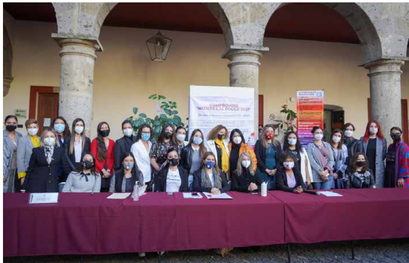
Para Las Paritaristas, es relevante feminizar la política y el primer logro en su lucha será lograr la paridad, que los partidos impulsen a las mujeres en sus candidaturas a pesar de los lineamientos que impongan las autoridades electorales.

“El movimiento nace con las impugnaciones. Los estados estaban obligados a armonizar sus leyes en torno a la paridad, cuando se armoniza la de Jalisco, el congreso falla y manda la pelotita de cómo deben salir los lineamientos al IEPC, que saca unos lineamientos con unas fórmulas súper extrañas, donde no eran parejos, dependiendo el partido político les decían dónde poner mujeres y dónde no. De manera histórica, entran al Tribunal Electoral 35 impugnaciones, entonces decidimos juntarnos y descubrimos que eran mujeres de diferentes partidos