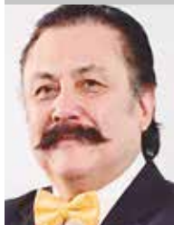
Por | Alfredo Ponce