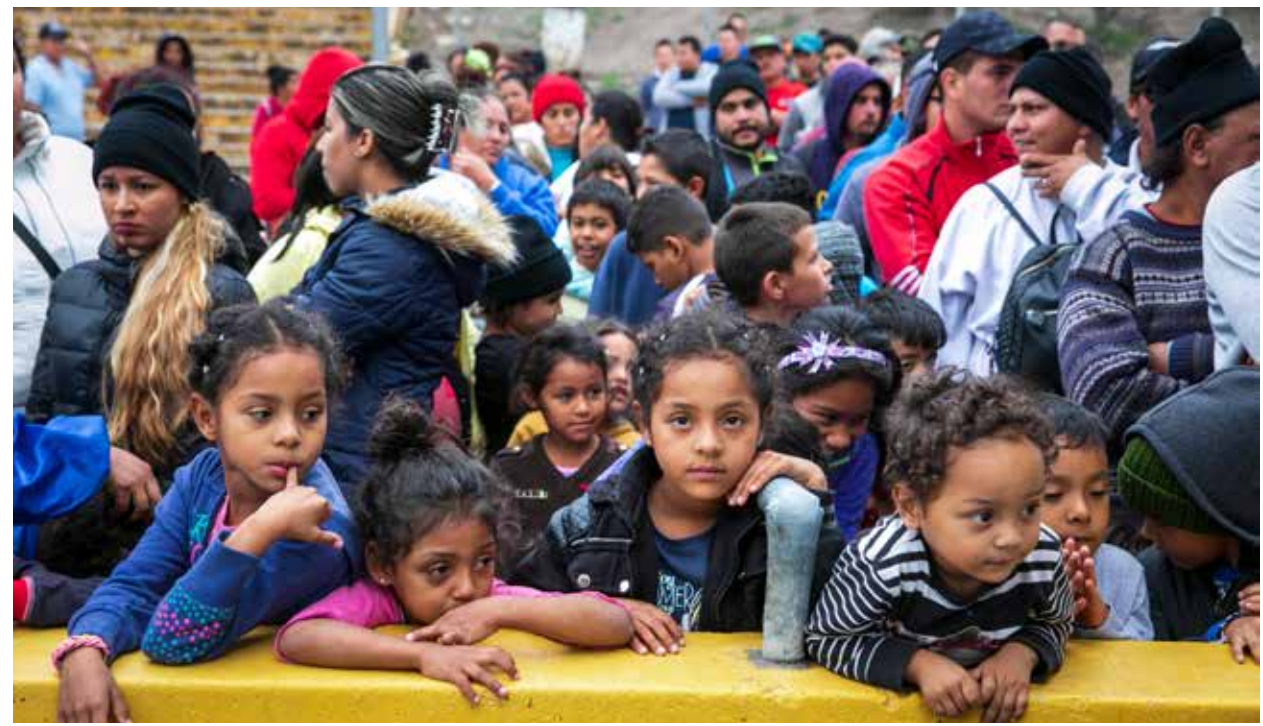
La recuperación económica post-covid será lenta en los países de América Latina, lo que provocará que la migración aumente a los EEUU provocado por la nueva pobreza que la epidemia está dejando.

Además de la tradicional razón económica, la mega migración se está dando por una nueva realidad en EUA. Hace unos días el Presidente Andrés Manuel López Obrador describió a su contraparte