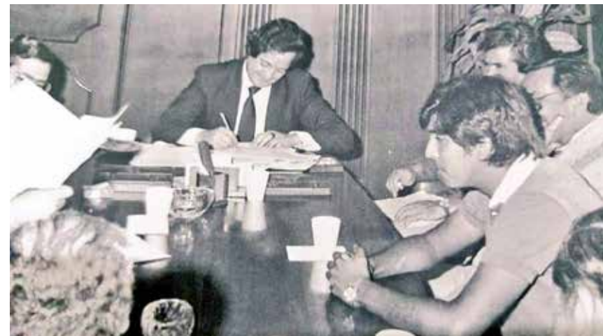
FUE ALCALDE DE ZAPOPAN y diputado en el Congreso del Estado.