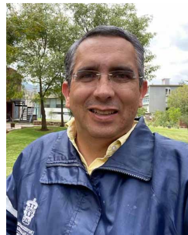
La desinformación es la que prevalece en la crisis del agua que vive hoy Jalisco, lo cual se presta para la especulación, advierte el investigador y especialista en temas hídricos, maestro Arturo Gleason Espíndola.

"Tenemos agua, pero el problema tiene que ver con la capacidad de distribución y esos aspectos se están corrigiendo desde una perspectiva técnica; aquellas zonas en donde el problema es más grave, las vamos a atender de una manera puntual y vamos a mejorar nuestra capacidad de respuesta, ya nos organizamos con los municipios para dar una respuesta más oportuna y evitar que colonias completas se queden varios días sin agua", precisó el Gobernador Enrique Alfaro.