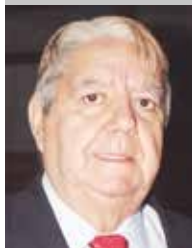
Por | Modesto Barros González