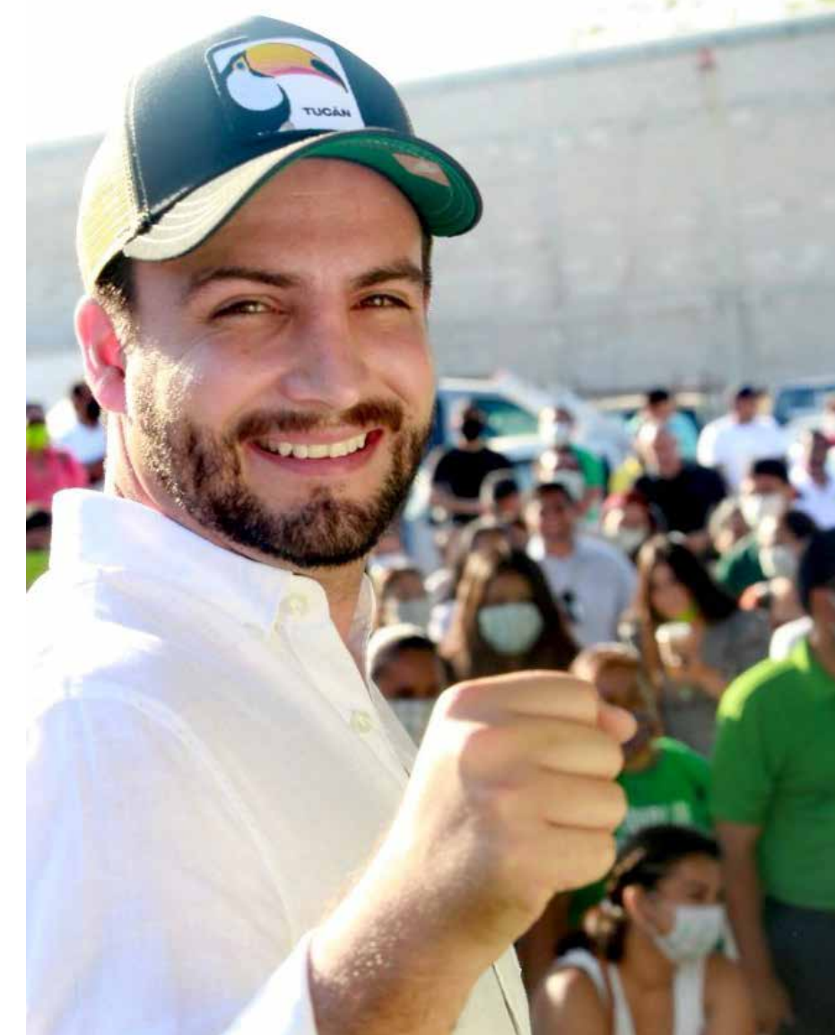
“Es una campaña alegre, yo soy de arranque, energía, con una plataforma política bien estructurada, con cinco ejes, con proyectos de infraestructura turística y social. Bien, nosotros sí nos hemos preparado y salimos con una buena campaña”, comenta en entrevista con Conciencia Pública.

“Nosotros lo que tenemos planteado es más capacitación, más patrullaje, queremos invertir en el fortalecimiento de nuestra seguridad a través de la creación de la agencia de seguridad turística, vamos a implementar un modelo nuevo, que nos permita estar a la altura de las circunstancias de un destino de talla internacional como Puerto Vallarta”.