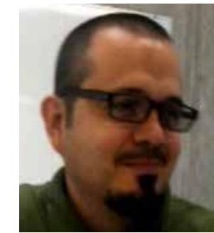
Por Omar Becerra Partida