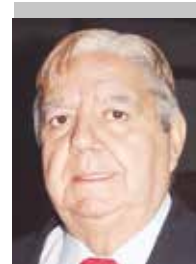
Por | Modesto Barros González