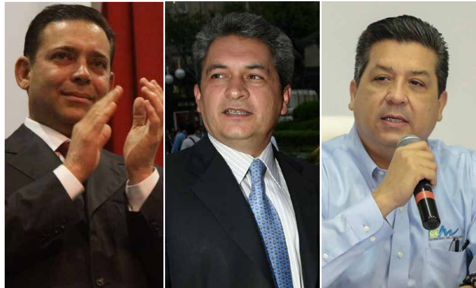
POLÍTICOS CORRUPTOS Los ex gobernadores de Tamaulipas Eugenio Hernández Flores, Tomás Yarrington Ruvalcaba, ambos presos por su apego a quedarse con recursos que no les pertenecían, y casi en igual situación anda el actual mandatario Francisco García Cabeza de Vaca.

De los más recientes titulares del poder ejecutivo federal, mejor no hablamos; ya dictaminará el pueblo, cuando próxi-