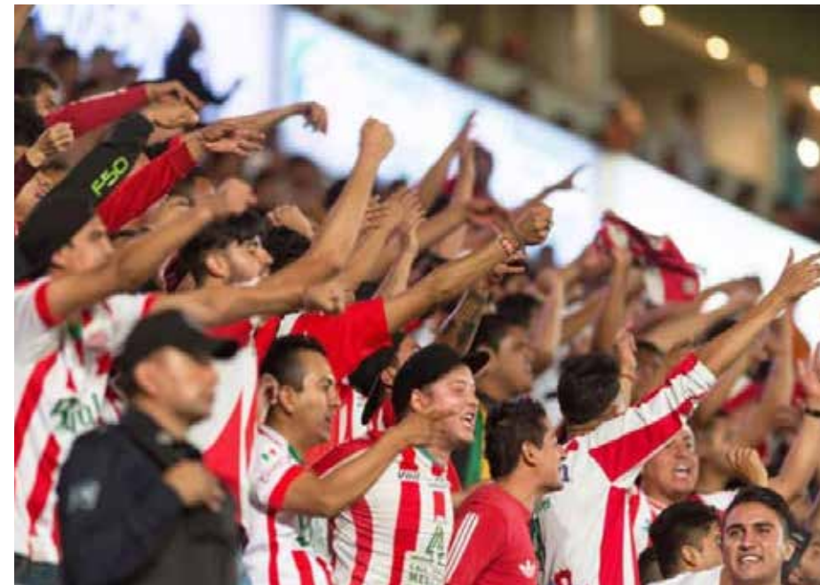
Futbolísticamente el jugador requiere de la motivación por parte de sus aficionados, que les exigen el máximo esfuerzo y cualidades en busca de la victoria que lo hacen dar el extra.

El individuo como espectador grita, apoya, ríe, sufre, se desahoga y se adentra al máximo a su espectáculo favorito que