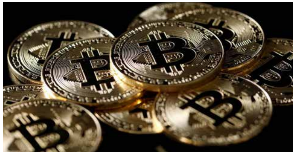
Ni en los mejores sueños de los inversores más optimistas se habría previsto que desde el inicio de 2020 hasta abril de 2021, el valor de capitalización del mercado de criptomonedas pasase de menos de 200 000 millones de dólares a más de 2,2 billones de dólares.

Al iniciarse la pandemia comenzó a subir asombrosamente el precio de las acciones de algunas empresas, sobre todo de tecnología o referentes a la salud, logística