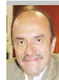
Por | Benjamín Mora Gómez