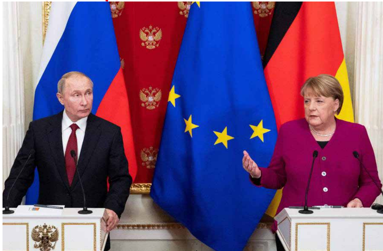
El Presidente de Rusia, Vladimir Putin y su alianza con la Canciller alemana, Angela Merkel.

En abril se decía que las sanciones de Trump-Biden no serían suficientes para frenar al dueto Putin-Merkel por lo que sería necesario que EUA usase presión diplomática para evitar que el gas de Rusia siguiese incrementando la presencia de Putin en el