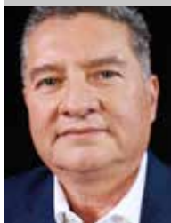
Por | Luis Enrique Villanueva Gómez (*)