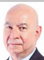
Por | Luis Manuel Robles Naya