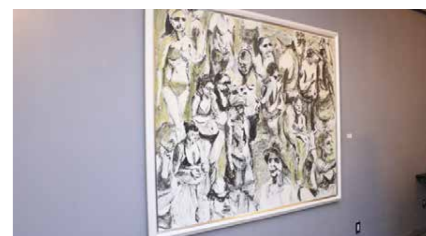
EL QUEHACER CREATIVO se torna en un asunto obsesivo para Erick Fernández durante la acción de pintar y plasmar su propuesta.