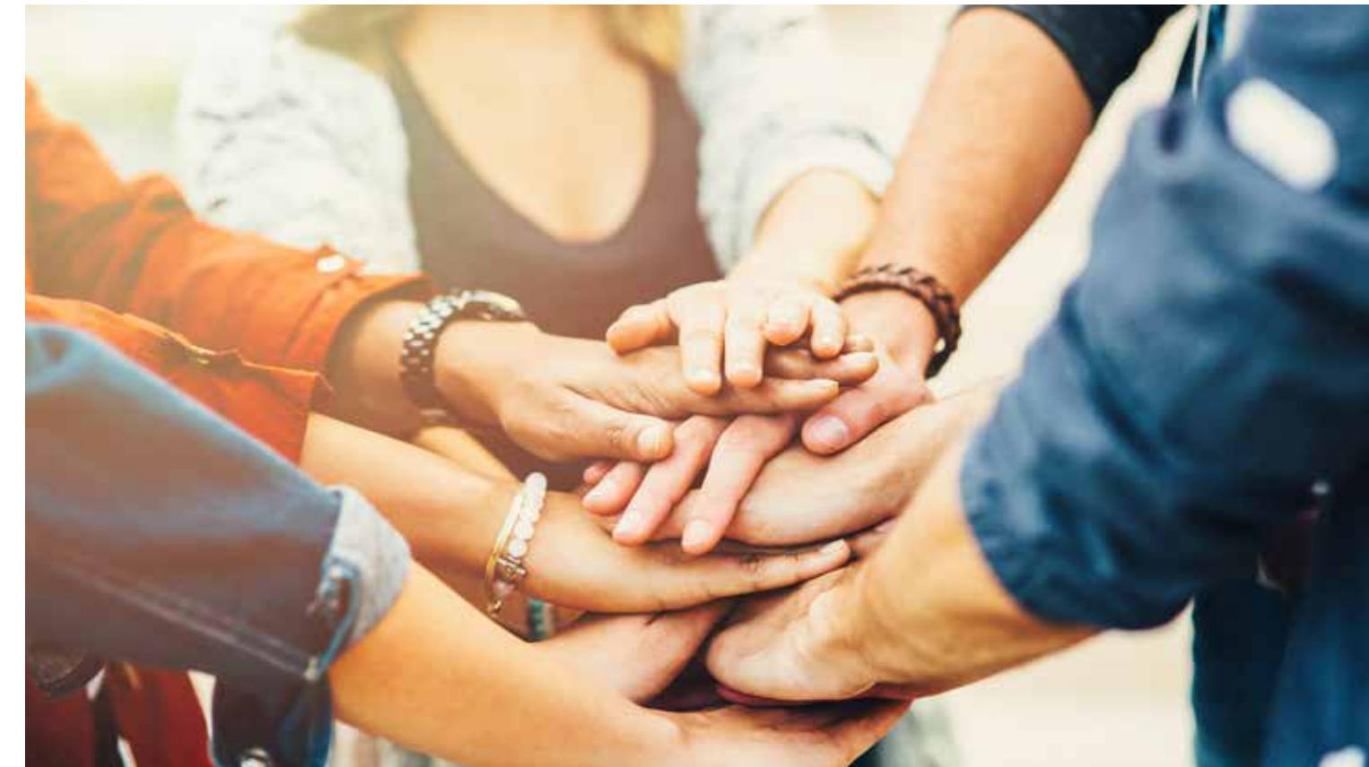
La humanización del capital un sueño de todos los tiempos.

Es necesario implementar un departamento de bioética y de ética dentro de los distintos ámbitos de gobierno que avalaran la congruencia entre el estado y la sociedad para observar tanto las necesidades como