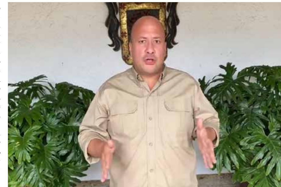
La presión social provocó que haya rectificación.

No se podía, no se puede entender, porque insistían en hacer un basurero sin pla-