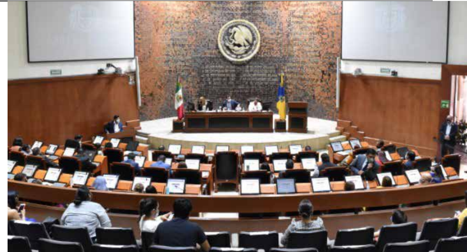
Las llamadas pensiones doradas han sido reducidas en el Congreso del Estado con la reforma a la Ley de Ipejal aprobada en sesión extraordinaria el pasado viernes.

Hay un documento que nosotros recibimos como consejeros donde dice que, en los últimos 5 años, citando el año 2020 ya como cerrado, el incremento de la población activa fue de 0.49%, 0.49% ¿Qué necesitamos nosotros? Necesitamos que la población de afiliados crezca esa es la solución para pensiones del Estado crezca, ¿qué debemos de hacer? Que todos los municipios, que todos los ayuntamientos aporten a Pensiones del Estado, que se inscriban al