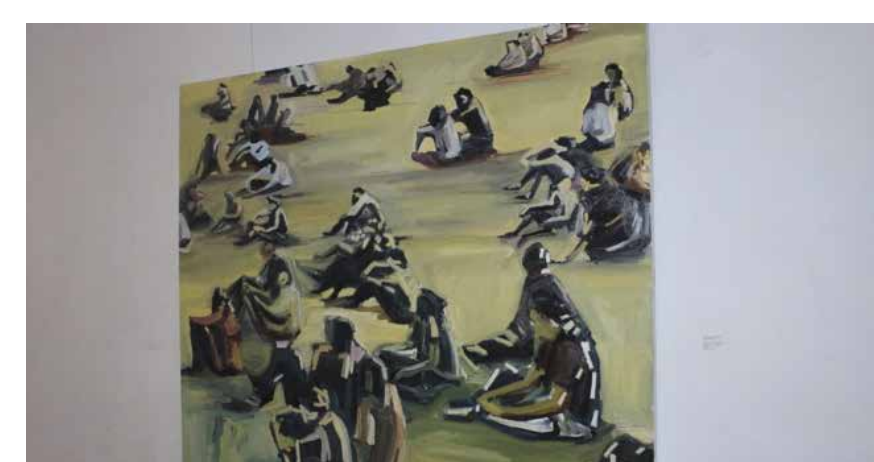
"HAGO PINTURAS hermosas que termino destruyendo, eso le da mucho poder a la imagen", ha expresado Erick.