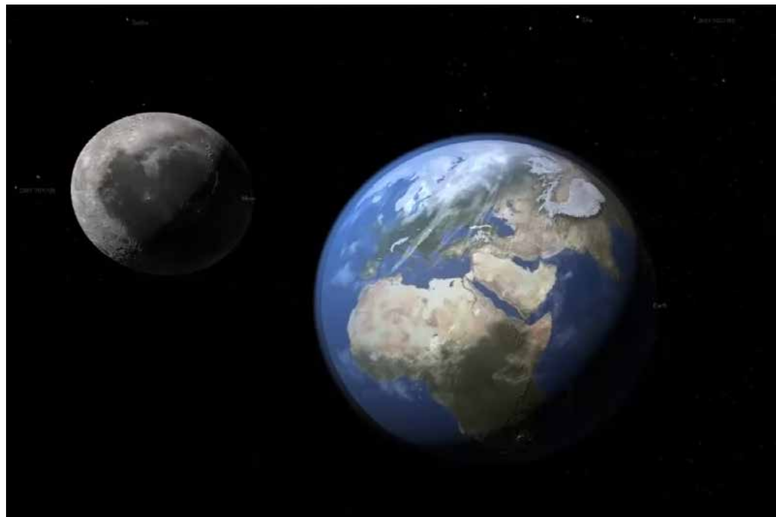
La humanidad cada vez logra dar pasos más grandes para dominar el espacio y acortar las distancias.

La razón parece ser simple, el Covid19 dejó miles de millones de dólares extras en ganancias a Bezos pero el tiempo no tiene precio y el muy sencillo pero genial, Musk le lleva la delantera en los asuntos del espacio. La empresa de satélites de Bezos llamada Kuiper tiene proyectada una flota