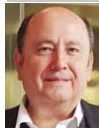
Por | Gabriel Ibarra Bourjac