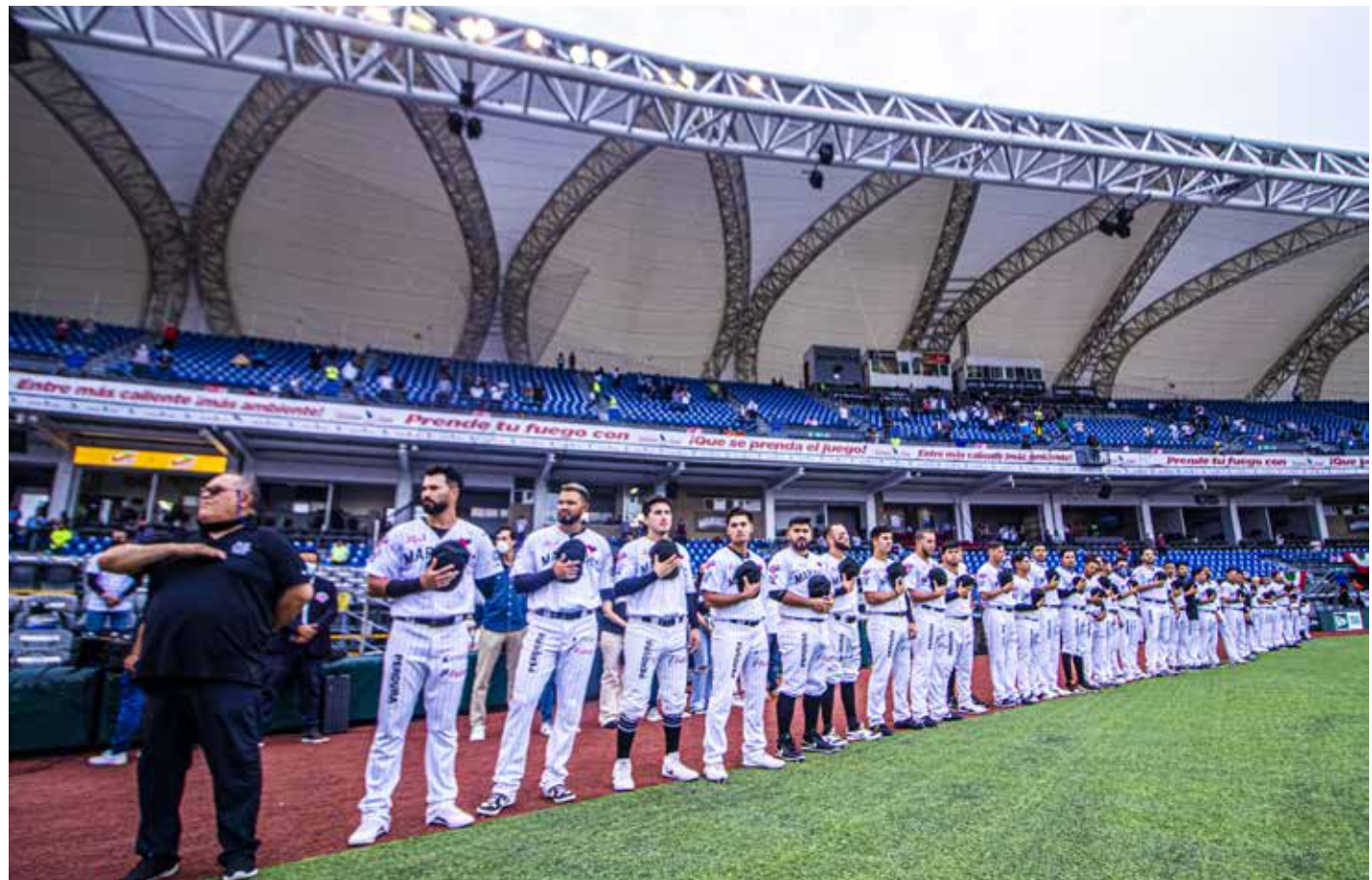
"Gracias muchachos por demostrar categoría, liderazgo, entrega, pero sobre todo humildad toda esta temporada, y repito, siéntanse muy orgullosos por el desempeño realizado".

Gracias afición y desde hoy Guadalajara nos parte de mi historia y mi familia". Va el reconocimiento a quienes armaron