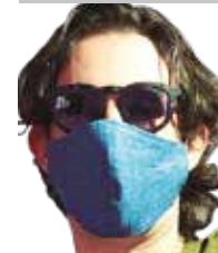
Por | Jorge Zúñiga de la Cueva