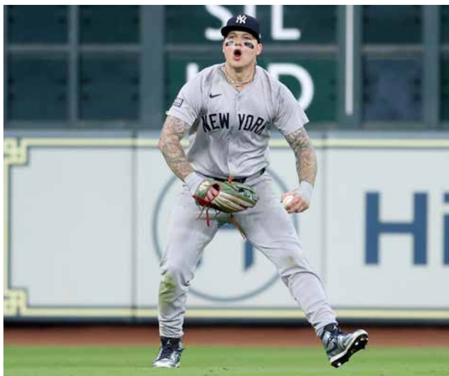
Alex Verdugo, la nueva estrella de los Yankees ha manifestado su amor por México es muchas ocasiones y de diferentes formas.

La música del gran Vicente Fernández se escucha en el Yankee Stadium con su canción, “Volver, Volver” a la hora de qué el mexicanoamericano se para a batear. Además de este guiño a nuestra cultura, Verdugo suele utilizar su guante tricolor, spikes alusivo a la bandera mexicana y otros artículos representando a nuestro país.