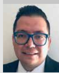
Por | Miguel Ángel Anaya Martínez