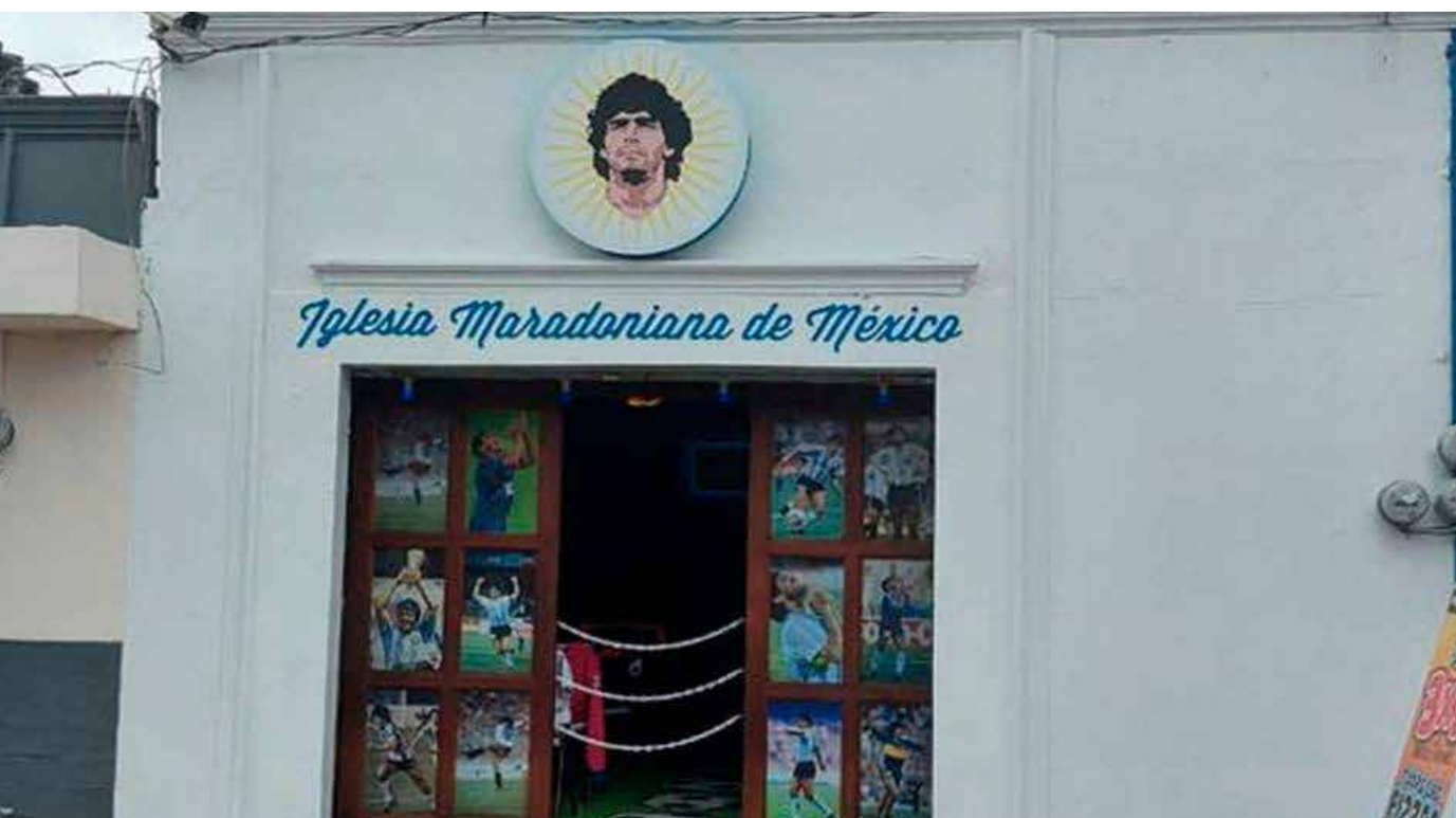
En Cholula, Puebla instalaron un templo de la iglesia maradoniana.

Argentina, potencia futbolística con cientos de jugadores diseminados en el mundo, trovadores bohemios, gitanos que en comparación de los amazónicos están debajo de ellos, que tienen un mejor nivel sus habitantes político-social más claro y definido, que como siempre las masas populares que imperan en el fútbol son fanáticos recalitrantes, apasionados en extremo con sus barras de locos enajenados que brincan y saltan en todo el encuentro.