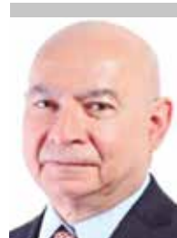
Por | Luis Manuel Robles Naya