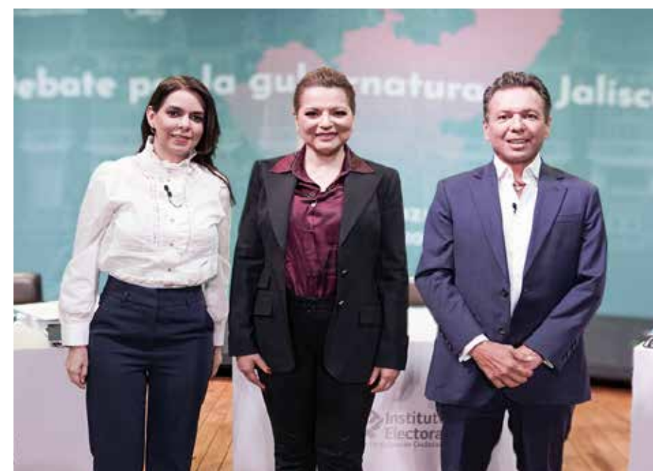
La espectacularización y el personalismo elementos que destacan en este segundo debate.

Lemus también desplegó un discurso sobre la migración de políticas de movilidad de la Ciudad de México hacia Jalisco, criticando el modelo de restricción vehicular que pretende implementar Morena, algo que considera inadecuado para el estado. Por su parte, Delgadillo prometió la expansión