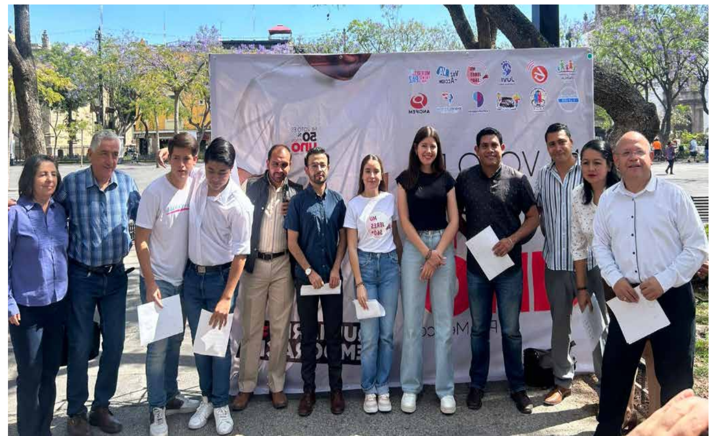
Doce organizaciones de la sociedad civil se han unido para incentivar a otros jóvenes a que voten y buscan que ese 51 por ciento, que se consigue en los congresos para las mayorías simples, sea ocupado por varios partidos para poder consensar las decisiones.

"Recordemos que la historia nos ha ido enseñando que no podemos dejar, precisamente, todo el poder en un solo partido y