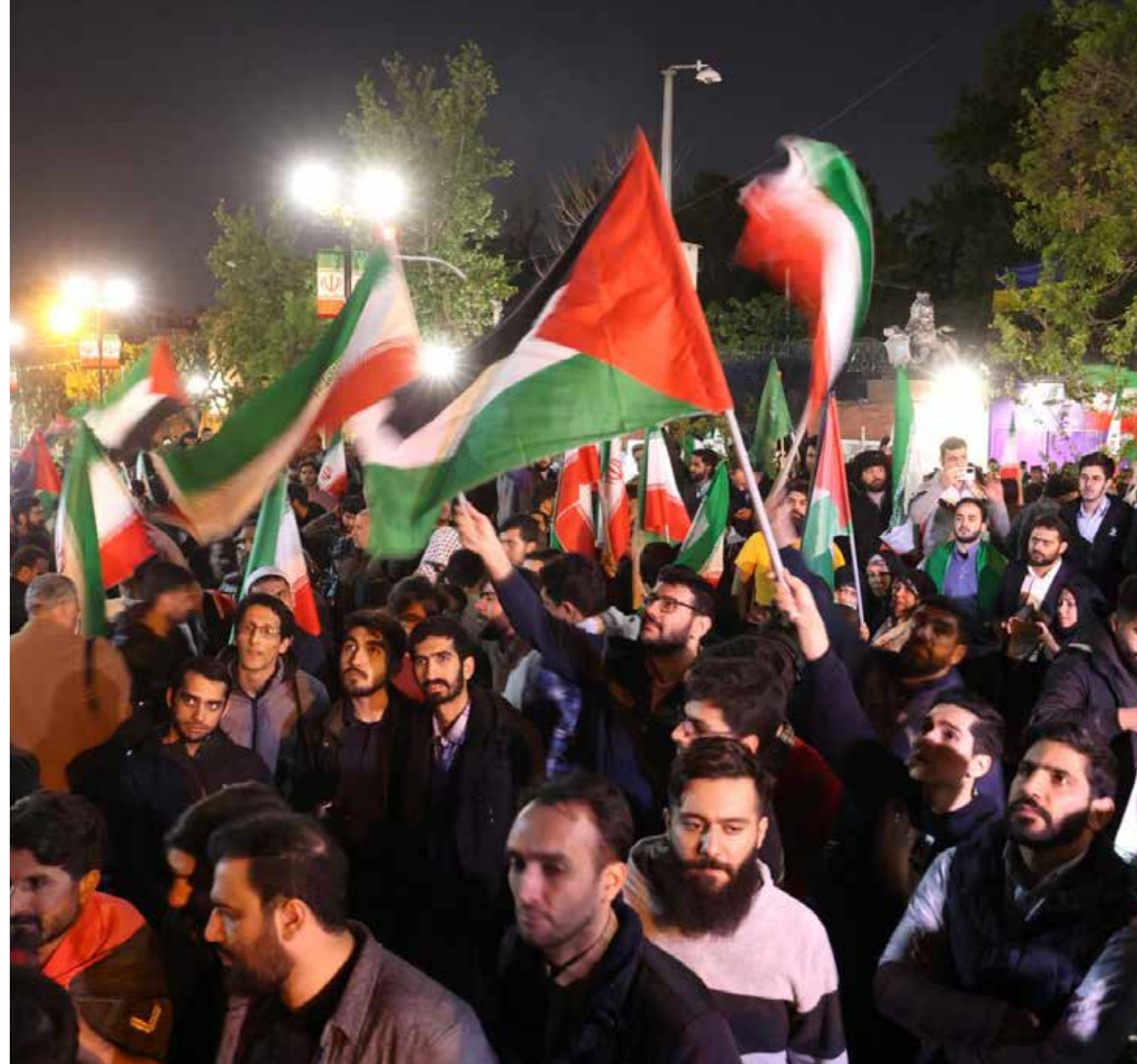
Hay preocupación mundial por la confrontación entre Israel e Irán. ¿Qué participación tendrán los países líderes del mundo?

• Impacto en el comercio internacional: El Medio Oriente es un