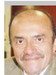
Por | Benjamín Mora Gómez