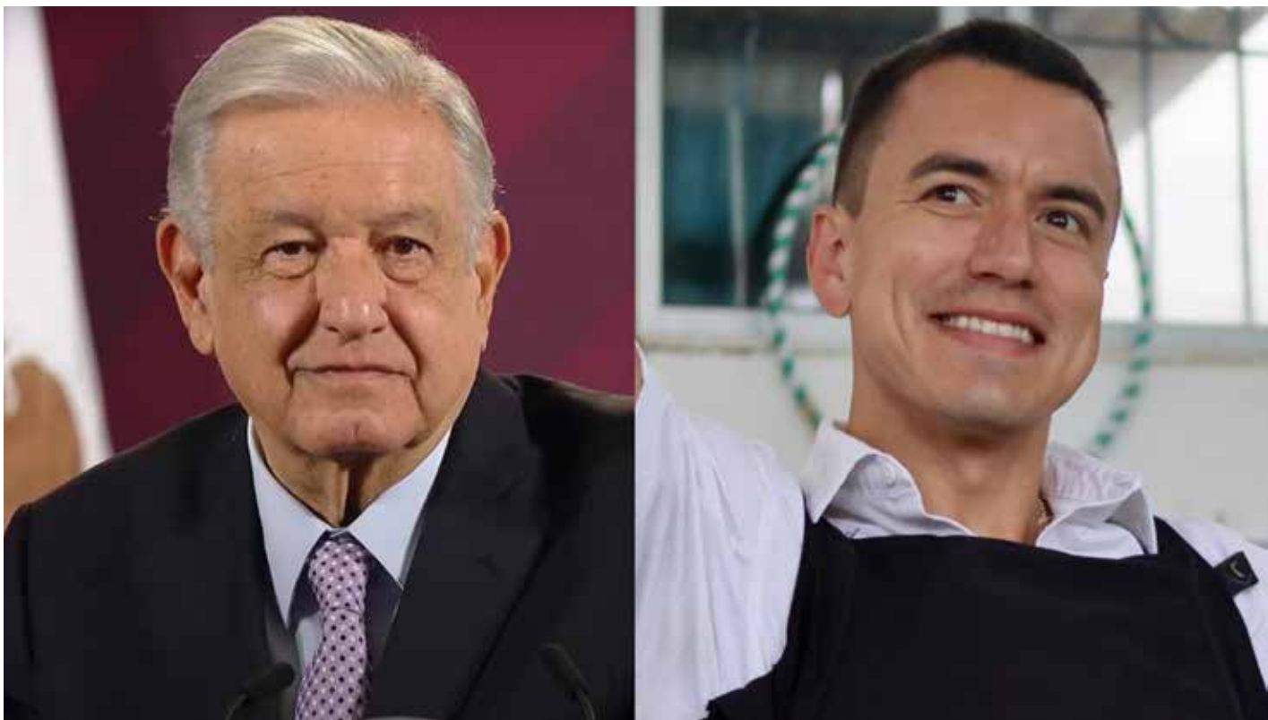
El presidente de Ecuador, Daniel Noboa y el mandatario de México, Andrés Manuel López Obrador.

Todo comenzó cuando el 15 de octubre del año pasado ganó la presidencia ecuatoriana, el estadounidense-ecuatoriano (nacido en Miami y de lengua materna inglesa) Daniel Noboa Azín, hijo del hombre más rico (Álvaro Noboa, archimillonario bananero) de ese país sudamericano -Ecuador- que había intentado cinco veces ser mandatario de dicha nación. Ese joven empresario, publicó El País, "supone una incógnita para un país asolado por la violencia"; tomó posesión el 23 de noviembre y su período