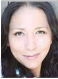
Por | Mónica Ortiz