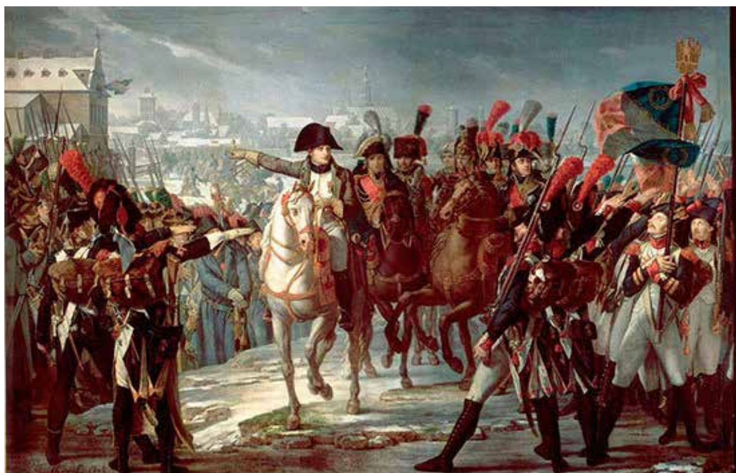
Al igual que Napoleón, los líderes políticos de hoy comprenden la importancia de la estrategia territorial.

En la vasta historia de las guerras y batallas, tanto épicas como estratégicas, encontramos lecciones que trascienden los campos de batalla y se aplican a diversas áreas de la vida. En el complejo mundo de la política, especialmente en el contexto de un proceso electoral, las similitudes con las tácticas militares son evidentes.