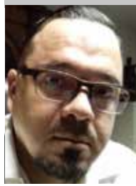
Por | Omar Becerra Partida