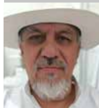
Por | José Carlos Legaspi Iñiguez