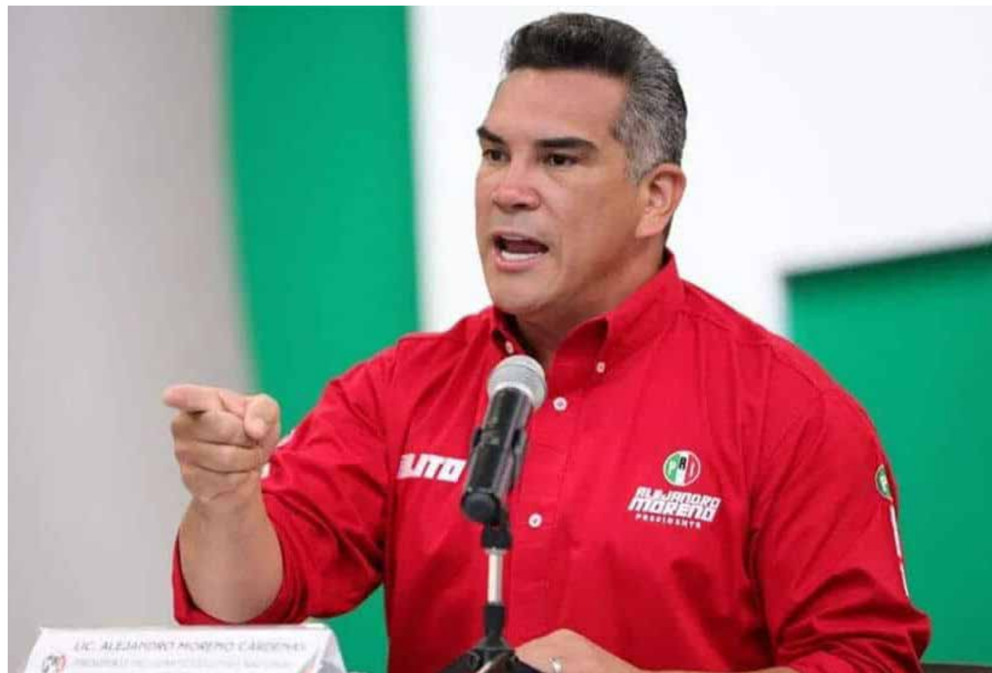
Alejandro Moreno, "Alito", es el político más repudiado de México según diversas encuestas.

"Por traicionar los principios y valores del priismo, por traicionar las causas sociales, por su ambición desmedida, 'Alito' ha sido expulsado del ánimo, la conciencia y la esencia de millones de priistas. Se está quedando solo, abandonado y se ha convertido