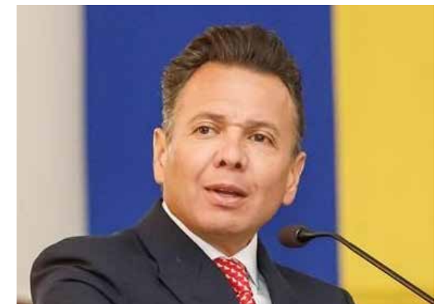
PABLO LEMUS/ GOBERNADOR DE JALISCO

Claro que no. Imaginense entregar la Red de Salud Estatal o los Civiles al IMSS-Bienestar. Sería un error histórico para las y los jaliscienses. Nosotros vamos a trabajar en fortalecer nuestro propio sistema de salud y, muy importante: construir la primera Red Nacional e Internacional de Hospitales-Escuela junto con la Universidad de Guadalajara".