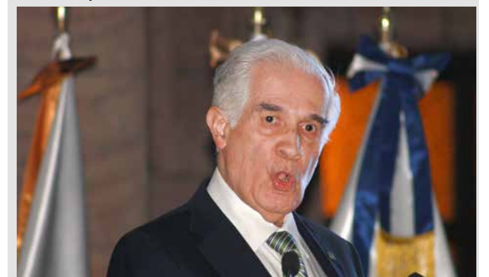
El maestro y jurista Diego Valadés presenta sus apuntes.

Recomienda un análisis profundo en el Congreso para equilibrar agilidad con la esencia protectora del amparo, evitando que se convierta en un instrumento de control político. Sus posturas, basadas en décadas de experiencia, subrayan la necesidad de reformas que fortalezcan, no debiliten, el Estado de derecho.