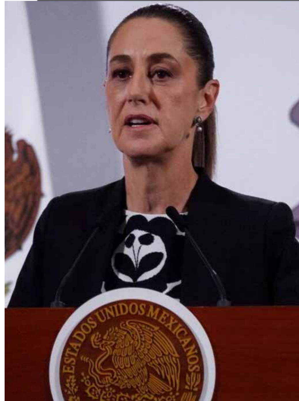
Un amplio debate en el país ha provocado la controvertida iniciativa de reforma a la Ley de Amparo de la Presidenta Claudia Sheinbaum.

El politólogo Javier Hurtado destaca que, a diferencia de la reforma electoral, que incluye una comisión presidencial y consultas hasta febrero, la reforma a la Ley de Amparo es una iniciativa unipersonal de la presidenta Sheinbaum. Aunque reconoce su facultad para presentarla, señala su aprobación expés en el Senado en solo 17 días, reflejando una urgencia notable.