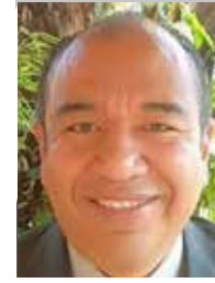
Por | Iván Arrazola