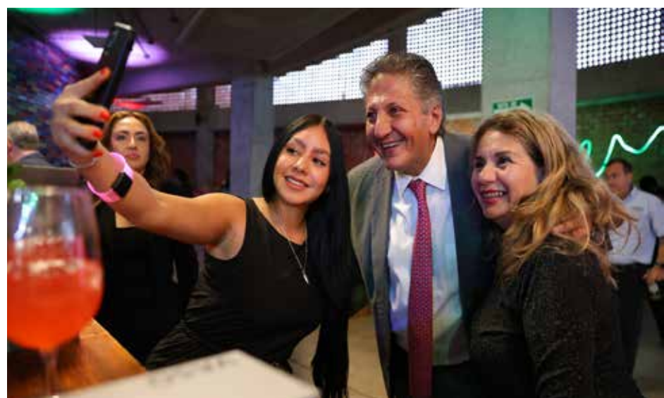
Los proveedores aprovecharon la oportunidad para tomarse la selfie como su presidente municipal y al mismo tiempo tener un diálogo directo en un ambiente de camaradería.

“Estos principios nos han permitido pasar de un municipio con finanzas quebradas