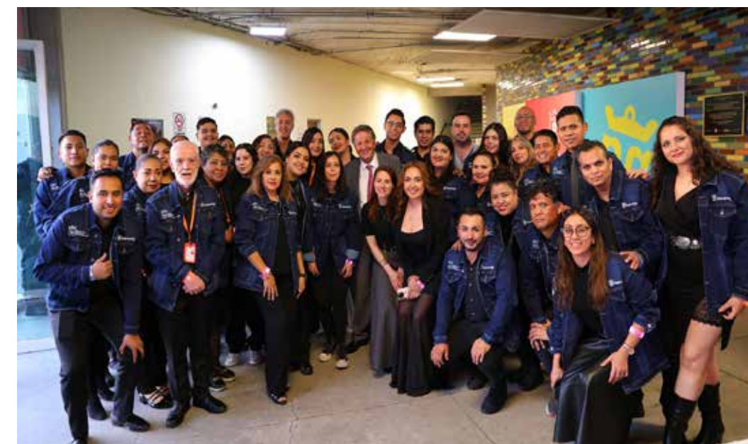
El gobierno de Zapopan es un modelo de eficiencia administrativa, como lo han constatado los proveedores quienes expresaron su satisfacción, ya que los pagos por sus servicios o compra de productos son rápidos.