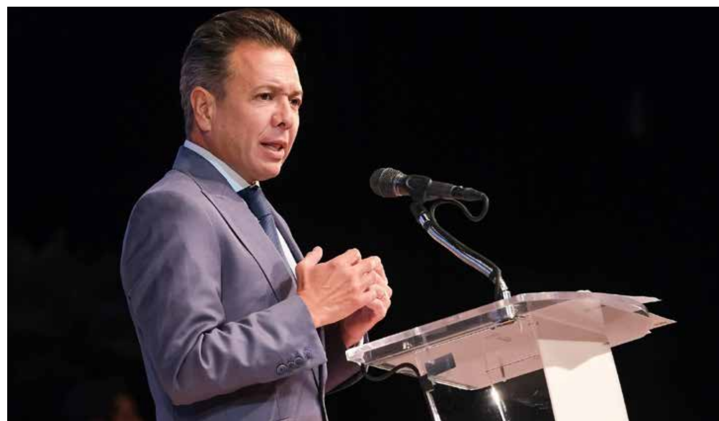
“No gracias, yo a esa fiesta no voy”, es el rechazo que le hizo el gobernador Pablo Lemus al IMSS-Bienestar.

Lemus convirtió la defensa de la soberanía sanitaria en una bandera de orgullo local.