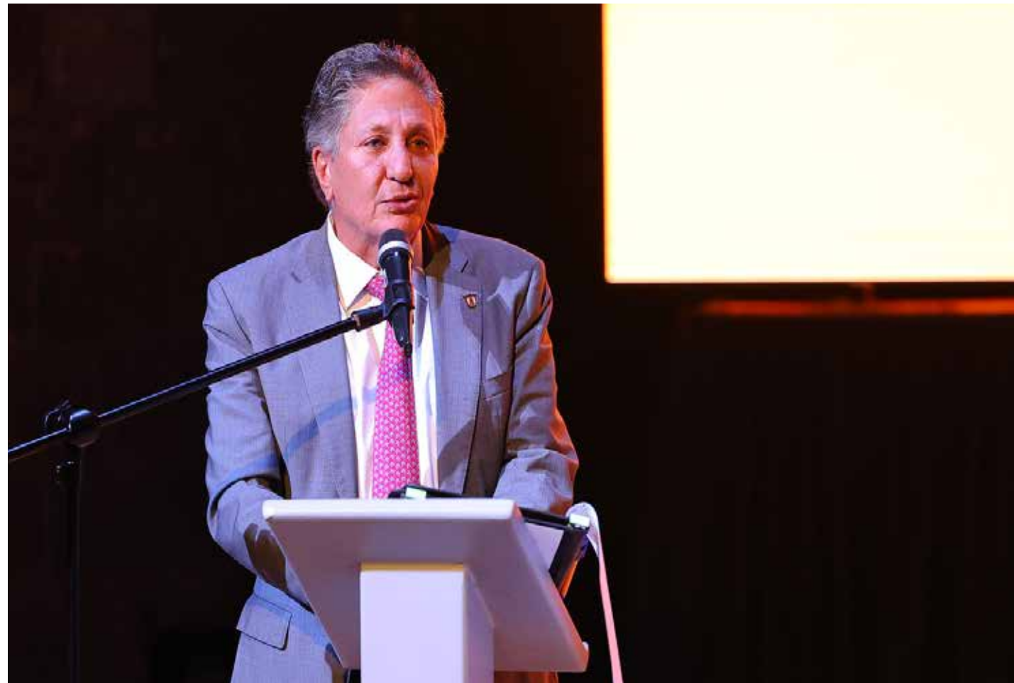
El alcalde de Zapopan, Juan José Frangie hizo un reconocimiento a 300 proveedores del municipio que forman parte del padrón municipal y que participan en las capacitaciones presenciales.

En este sentido, el municipio se ha consolidado como líder nacional en generación de empleo, creando miles de puestos de tra-