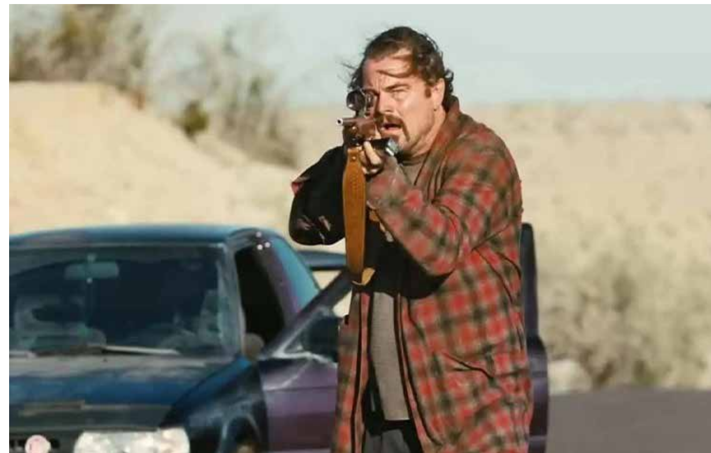
Leonardo DiCaprio interpreta a Bob Ferguson, un exmilitante revolucionario obligado a enfrentar los fantasmas de su pasado.