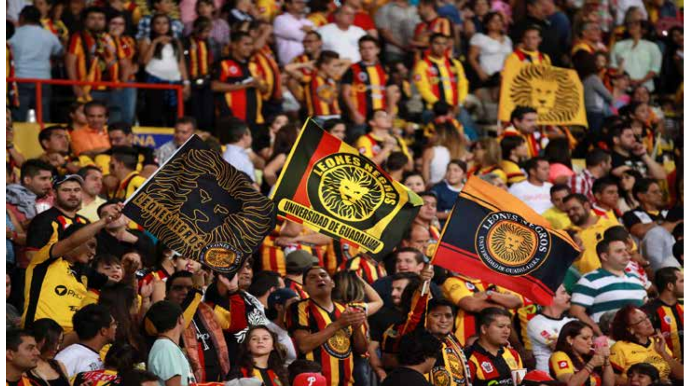
La afición de los Leones Negros de la Universidad de Guadalajara.