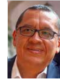
Por | Gerardo Rico