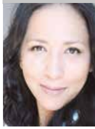
Por | Mónica Ortiz