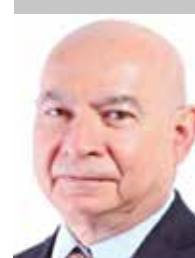
Por | Luis Manuel Robles Naya