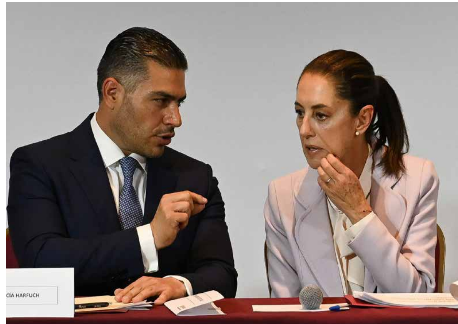
La presidenta Claudia Sheinbaum con Omar García Harfuch, su operador.

Hablemos sin adornos. Seiscientos mil millones equivalen a: 10 refineras Dos Bocas. 30 aeropuertos Felipe Ángeles. 200 líneas de Metro como la Línea 12. La pensión universal para adultos mayores durante un sexenio completo. Ese es el tamaño del desfalco. No es un accidente contable ni un exceso administrativo. Es un saqueo que exige complicidad des-