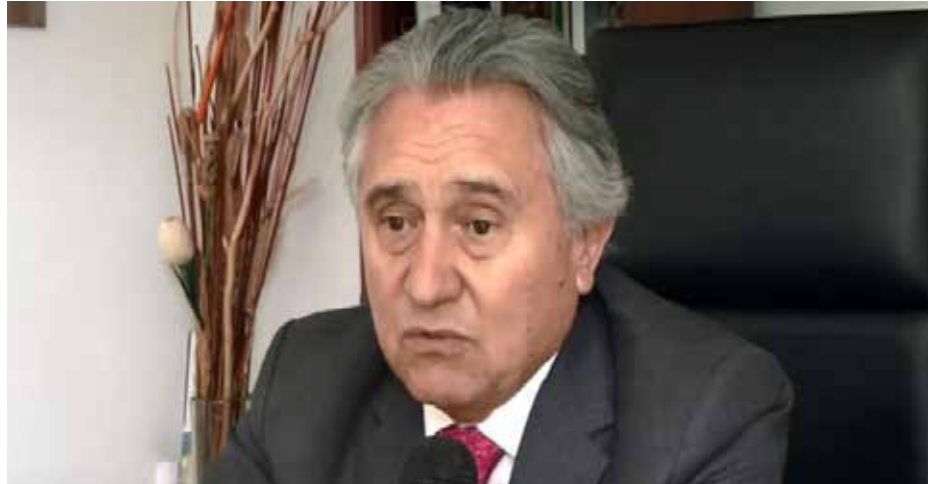
“El juicio de amparo es una gran aportación al mundo, pero esta reforma lo desnaturaliza”, considera el jurista Fernando Espinoza de los Monteros.

Entre los puntos más controvertidos, Espinoza destaca la acotación de la suspensión, “el alma del juicio de amparo”, que permite frenar actos de autoridad mientras se resuelve el fondo del asunto. La reforma restringe esta herramienta, limitando su efectividad.