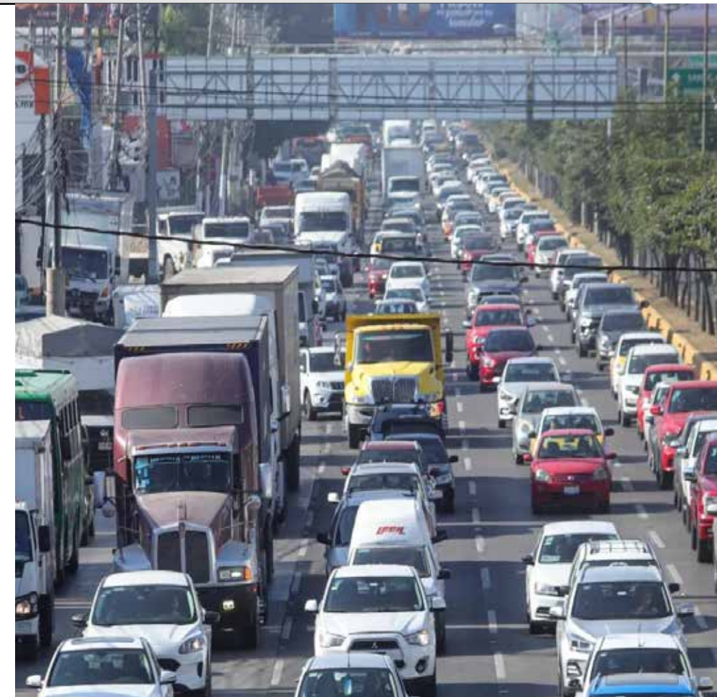
La congestión vial que sufre la Avenida López Mateos es el ejemplo más crudo de lo que es una ciudad colapsada y que lo sufren cada día más de un millón de ciudadanos asentados en el sur de la Metrópoli.