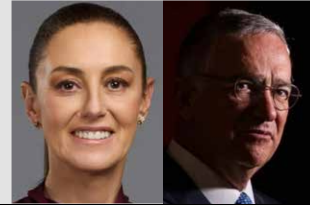
PRESIDENTA CLAUDIA SHEINBAUM

La reforma a la Ley de Amparo busca garantizar pronta actuación frente al lavado de dinero y evitar que el amparo se vuelva el resguardo de por vida de los potentados que no quieren pagar los impuestos".