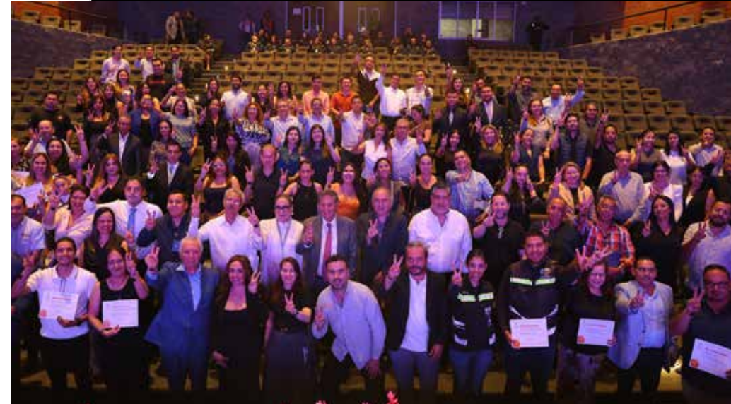
El mensaje de Juan José Frangie no solo fue un balance de números, sino un manifiesto de cómo la colaboración, la transparencia y el compromiso social pueden cambiar la narrativa de un municipio que, al inicio de su gestión, enfrentaba deudas y desconfianza.

Hace diez años al asumir el gobierno de Zapopan Pablo Lemus se encontró un municipio con finanzas colapsadas, un presupuesto de 5 mil millones de pesos y deudas de mil millones a proveedores. Los procesos administrativos eran lentos, con demoras de hasta dos años en pagos, lo que generaba desconfianza en la capacidad del gobierno para cumplir sus compromisos.