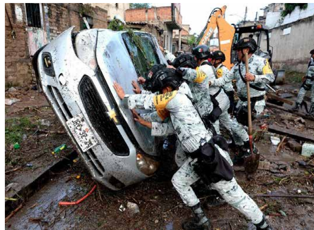
Las inundaciones que se han venido agravando en los últimos temporales de lluvia con decenas de personas fallecidas, es otro indicador de la infraestructura hidráulica-hídrica obsoleta, completamente rebasada por el crecimiento de la metrópoli.

Además, contempla un túnel paralelo con seis carriles para vehículos particulares y dos carriles exclusivos para emergencias (patrullas, bomberos, ambulancias).