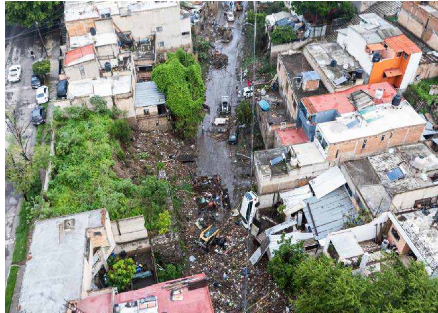
Las inundaciones en las colonias populares de Zapopan, una triste realidad que viven los ciudadanos día con día.

El desarrollo inmobiliario descontrolado es, sin duda, uno de los principales detonantes de esta crisis. En los últimos diez años, Zapopan ha experimentado un auge de construcciones que, lejos de beneficiar a la mayoría,