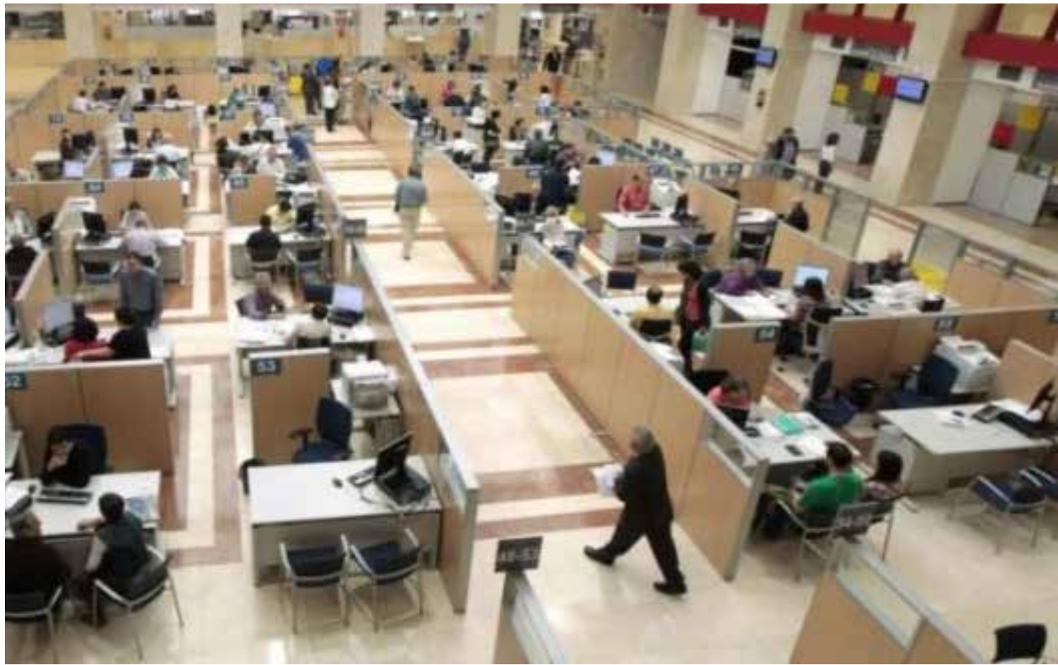
Pasillos largos, archivos, expedientes, funcionarios, el oxidado engrane de la burocracia mexicana.

LA DECADENCIA DEL ESTADO NO SE MANIFIESTA SOLO EN LA CORRUPCIÓN ABIERTA O EN EL ABUSO DE PODER, SINO EN ALGO MÁS COTIDIANO Y PELIGROSO: LA NORMALIZACIÓN DE LA INEFICACIA. CUANDO LA EXCEPCIÓN SE VUELVE REGLA Y EL TRÁMITE SE CONVIERTE EN OBSTÁCULO, EL ESTADO EMPIEZA A PERDER LEGITIMIDAD SIN DARSE CUENTA.