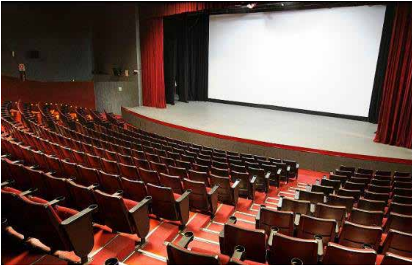
El Festival Internacional de Cine de Autor (FIC Autor) se llevará a cabo en las instalaciones del Cineforo de la Universidad de Guadalajara.

En sus nueve ediciones anteriores, el FIC Autor ha recibido alrededor de 3,500 inscripciones provenientes de 107 paí-