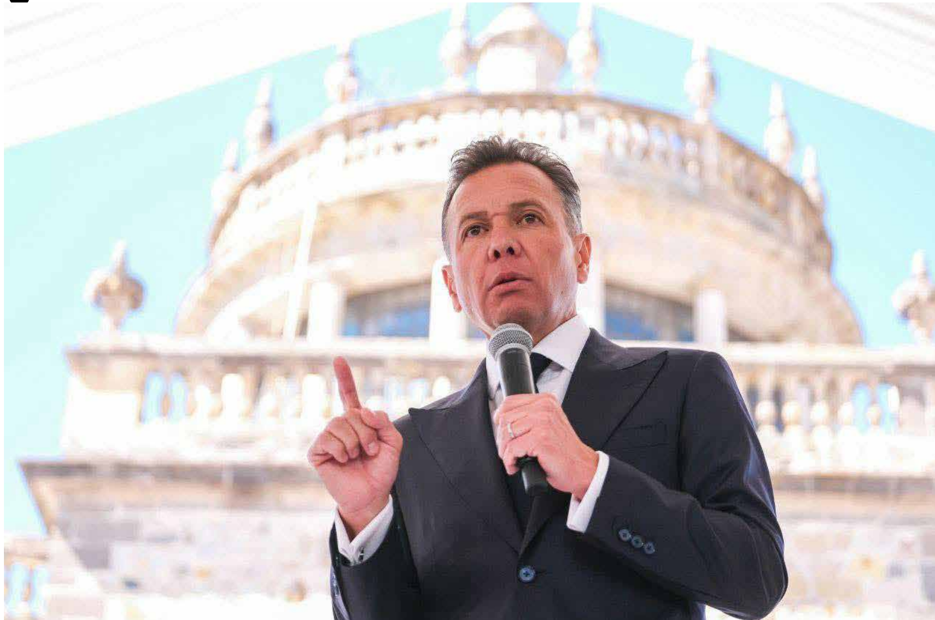
“Al Estilo Jalisco”, el lema que ha adoptado el gobernador Pablo Lemus en su administración.