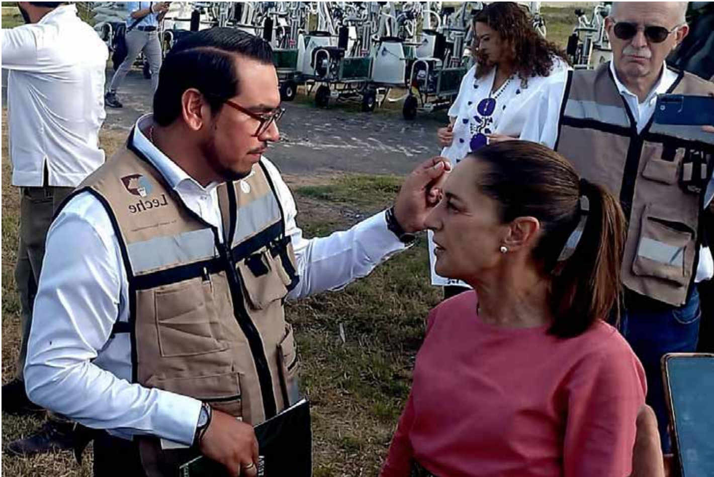
Antonio Talamantes, Director General de Leche para el Bienestar, con la Presidenta Claudia Sheinbaum.

Finalmente, destaca la instalación de una planta pasteurizadora en Campeche con una inversión de casi 140 millones de pesos para una planta que en un inicio procesará 100 mil litros de leche diarios, y se prevé concluya en el mes de enero de este año, así como la incorporación de productores al programa Leche para el Bienestar y la pue-