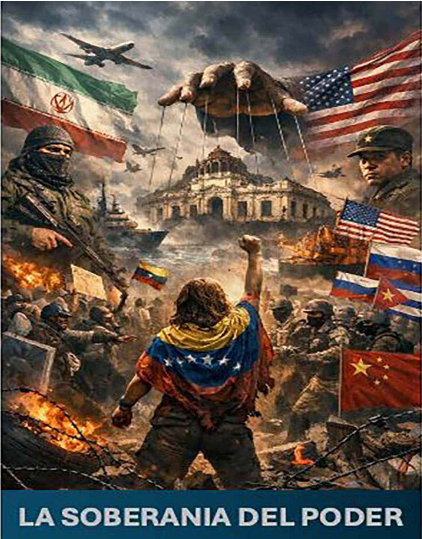
Venezuela: el mito de la soberanía en un mundo que pelea por recursos.

Dicha sea la verdad, Venezuela les dio el pretexto y llevaban años con esa idea, Trump solo la ejecutó. Gobernantes tan recientes como Joe Biden había ofrecido una recompensa pública de decenas de millones de dólares por la captura de Maduro. ¿La razón? Una acusación con orden de arresto emitida por cortes en Nueva York en la que se incluye a Maduro como líder de una or-