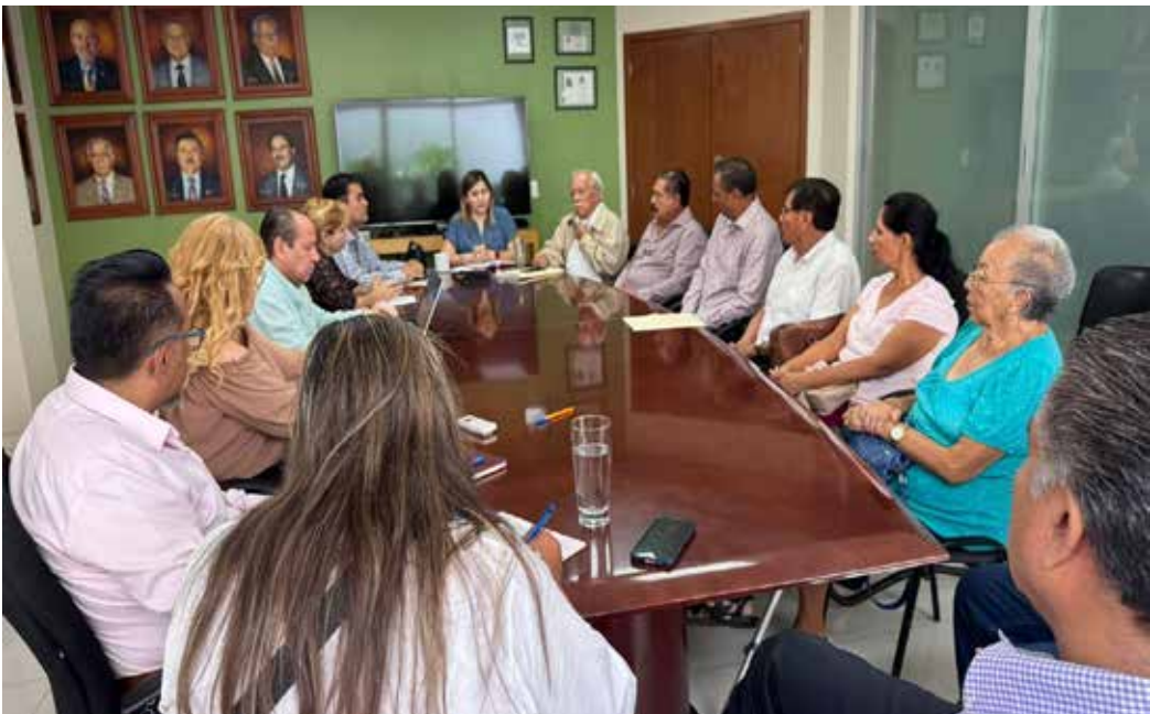
De 2004 a 2026: mas de 21 años de incumplimiento y 170 comuneros fallecidos sin justicia.

van y gobiernos vienen, pero el agravio continúa”, expresan representantes de la comunidad.