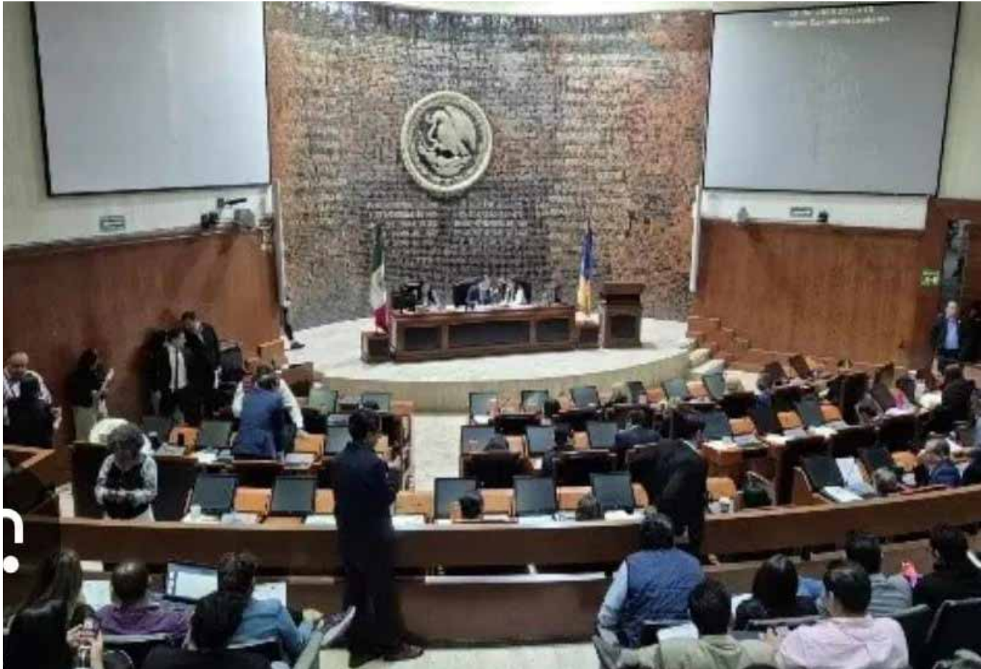
Al cierre del año 2025, el Congreso del Estado de Jalisco dejó una agenda legislativa cargada de pendientes estructurales que definirán el ritmo y la calidad del trabajo parlamentario durante 2026.

atar fue el método de selección de quienes integrarían el Poder Judicial. Morena y sus aliados insistieron en la insaculación (o “tómbola”) como mecanismo para garantizar imparcialidad y reducir cuotas partidistas o influencias de grupos de poder en la designación de jueces y magistrados.