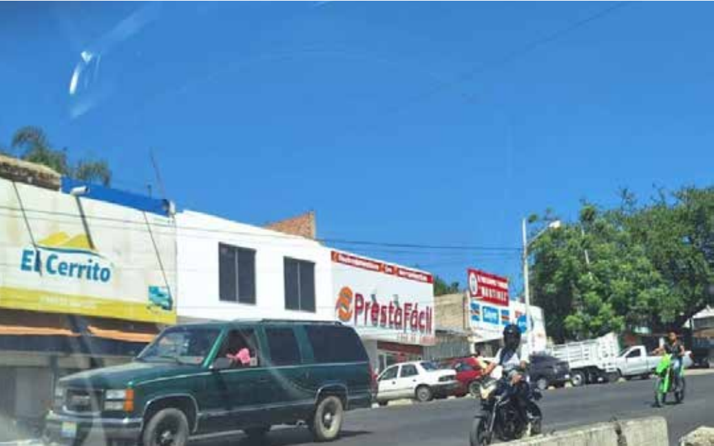
Negocios establecidos sobre las tierras de la Comunidad Indígena de Mezquitán que utilizó la SCT para la carretera Guadalajara-Salttillo de 6,733 metros de longitud y 40 metros de ancho es una zona urbana consolidada.