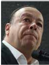
Por | Óscar Ábrego