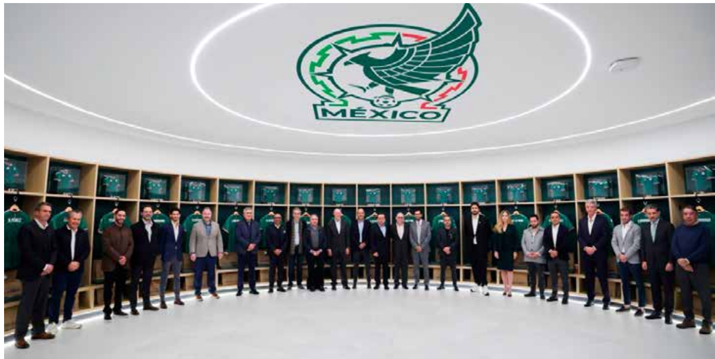
Los dueños del balón del futbol mexicano, en la junta previa al mundial de 2026.

En este sentido, no se trata de medir “grandezas” con campeonatos obtenidos, sino lo que ya establecimos líneas atrás entre otros “pequeños grandes detalles” que tienen que ver con muchos factores, son ellos quienes le dieron vida e identidad a un fútbol que para Ripley su máximo enemigo son los propios dueños de equipos. México debería ser lo que hace España