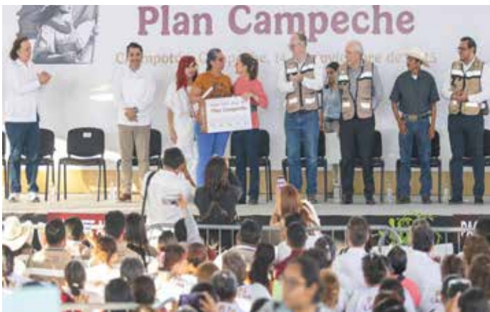
Con el Plan Campeche El gobierno federal presenta la estrategia integral para reactivar la economía y seguridad en el estado, con énfasis en inversión petrolera, turismo y combate al crimen organizado, tras años de rezago en la región sureste.