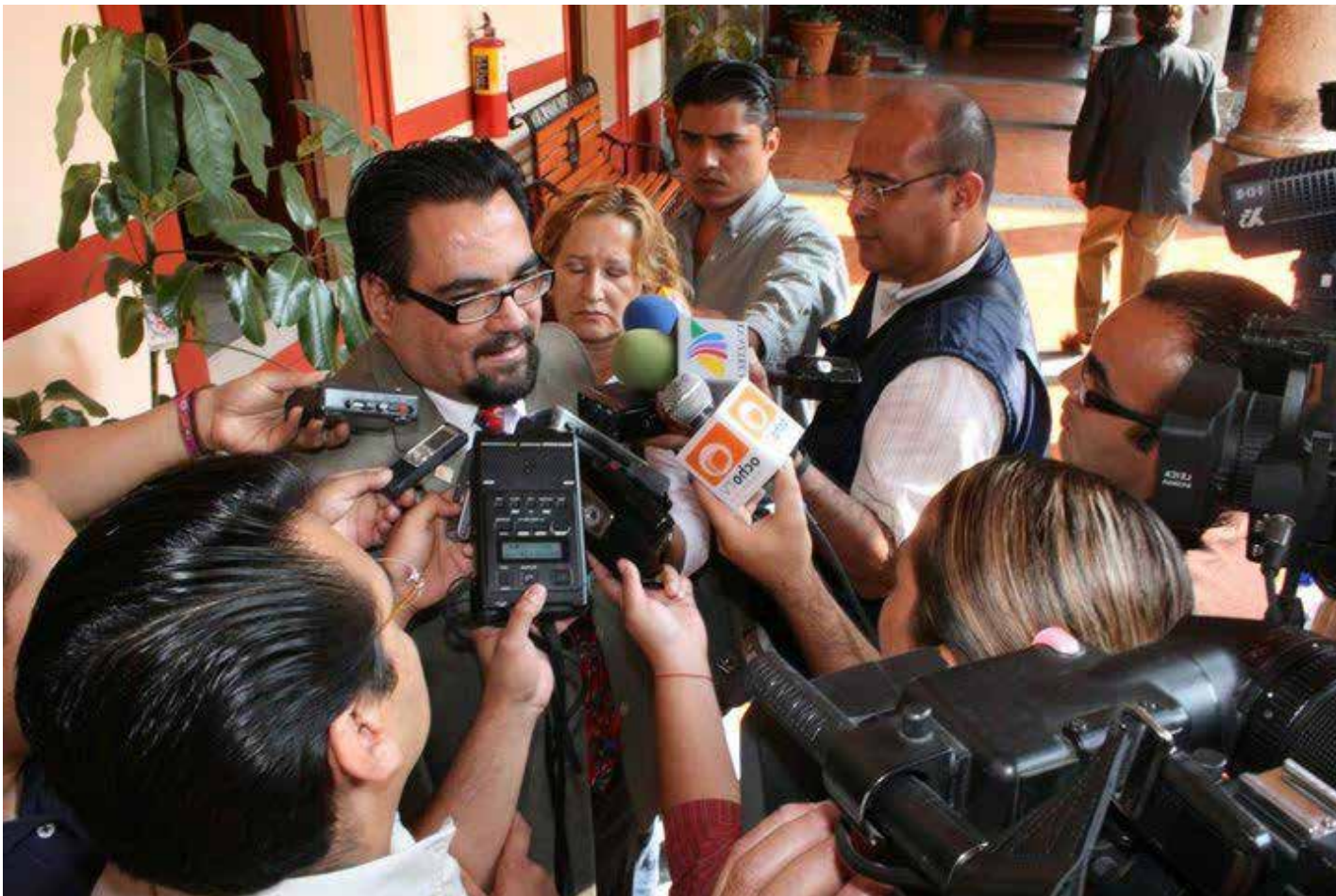
Gustavo González Hernández, es el responsable de la Fiscalía Especial en Delitos por Hechos de Corrupción de Impacto Social en la Fiscalía General de la República y aspira a estar al frente de la Fiscalía Especializada en Combate a la Corrupción en Jalisco.

¿Cómo evalúa el desempeño de la Fiscalía