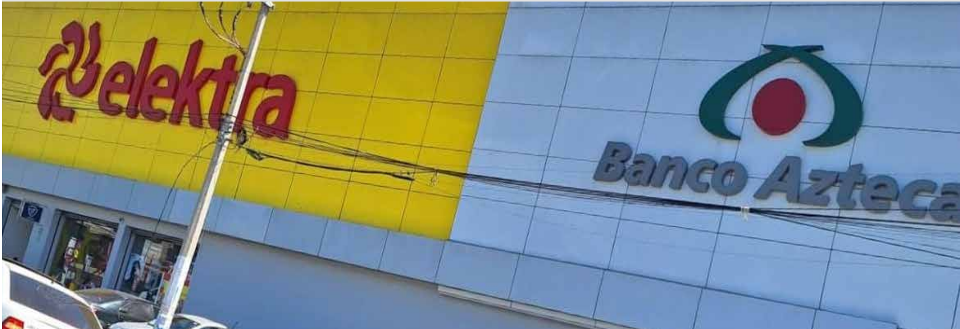
En las tierras de la Comunidad Indígena de Mezquitán que convinió pagarle la SCT hace más de 20 años proliferan hoy comercios y servicios: gasolineras Valero y Pemex, pizzerías Little Caesar's, tiendas Coppel, Elektra, Banco Azteca, Oxxo, Muebles América, entre otras.

El impacto humano es indignante. Desde 2004, más de la mitad de los comuneros, incluso los que firmaron los convenios —alrededor de 170 personas— han fallecido sin ver justicia por el pago de sus tierras, por parte de la SICT. Solo en 2025, nueve integrantes perdieron la vida, la mayoría mujeres, quienes murieron con la esperanza intacta de recibir el pago pendiente.