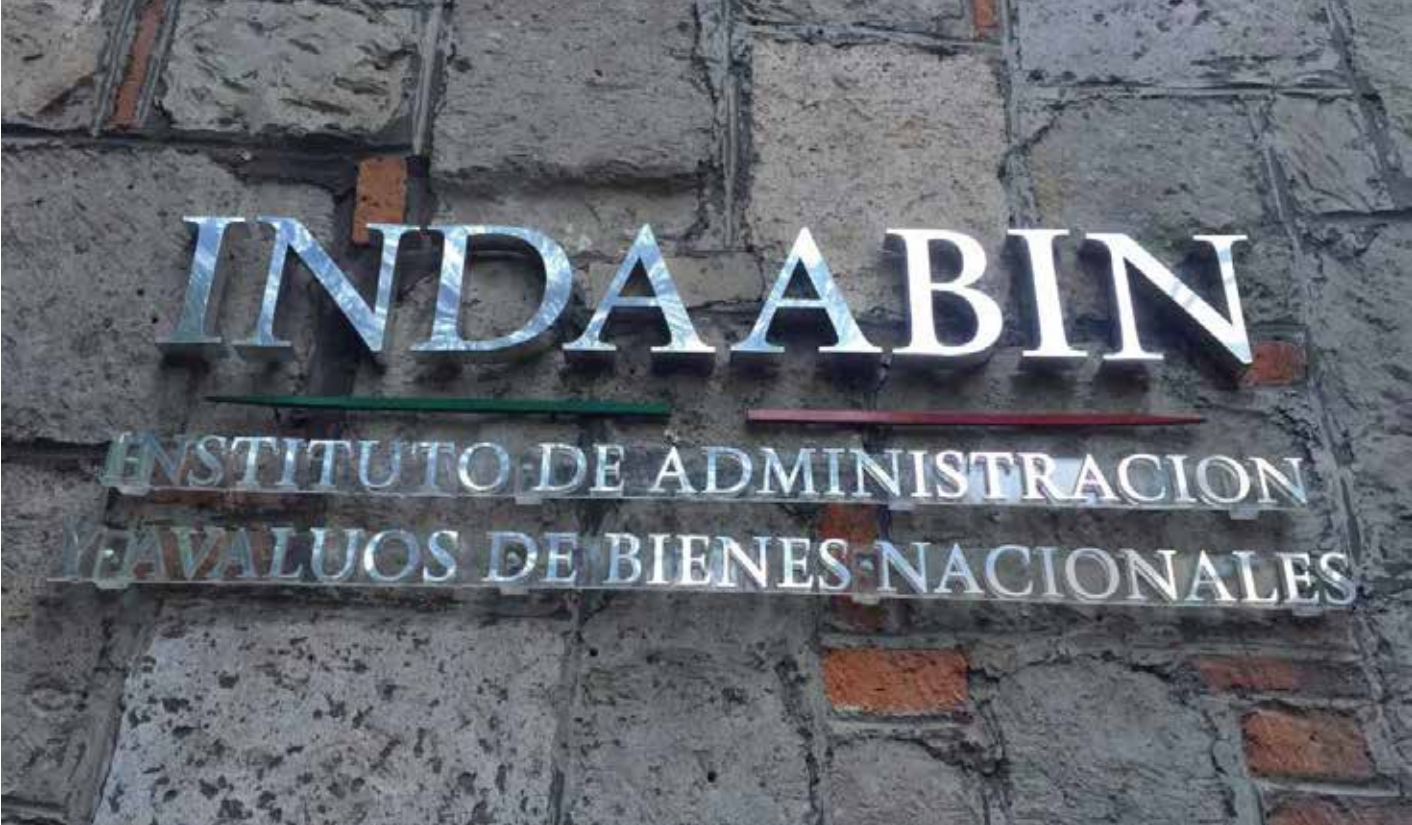
Multa histórica del Tribunal Agrario al INDAABIN por retraso de más de tres meses en la entrega del avalúo de las tierras de Mezquitán.

El Tribunal Agrario emitió un acuerdo que impone una multa al INDAABIN por