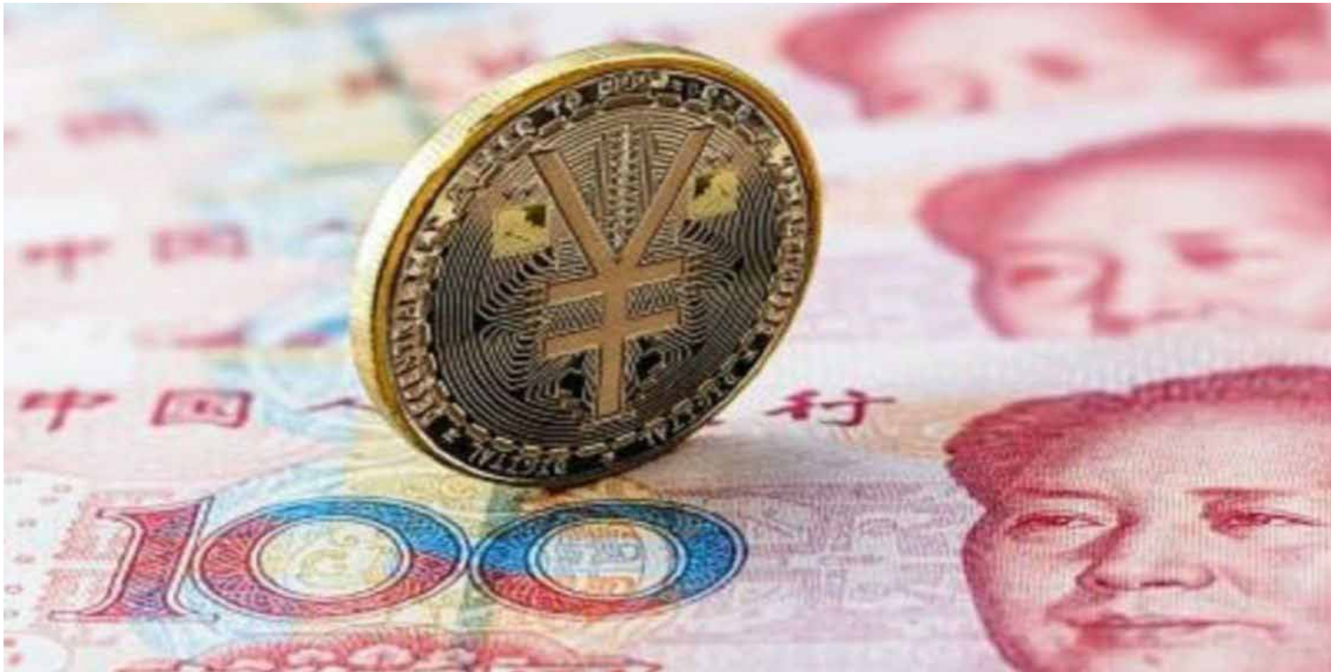
China en 2026: del crecimiento industrial al liderazgo tecnológico global.