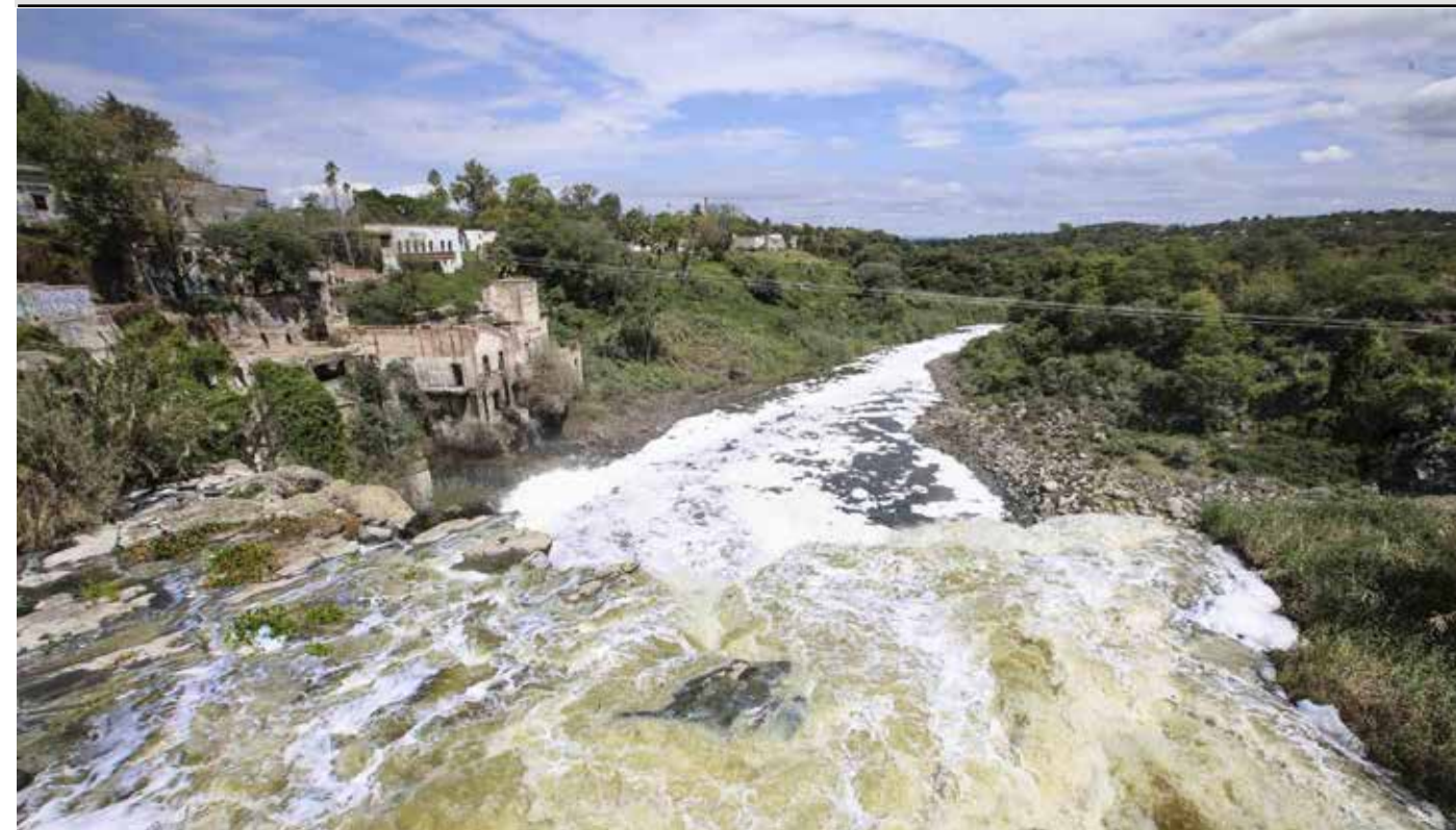
Seis plantas de tratamiento están en marcha: Zula (Ocotlán), Santa Cruz y San Miguel (Poncitlán), Ixtlahuacán, El Salto y Juanacatlán avanzan para sanear descargas de decenas de miles de personas asentadas en el tramo crítico del río Santiago.

Casi la mitad de las plantas de tratamiento establecidas en la región opera a medias o no opera por falta de capacidad municipal. Hay esfuerzo nacional para bajar tarifa eléctrica a agrícola. Alineamos inversiones federales, estatales y locales.