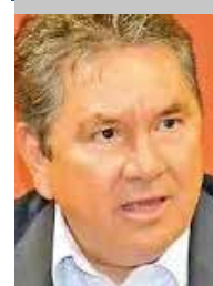
Por Víctor Hugo Celaya