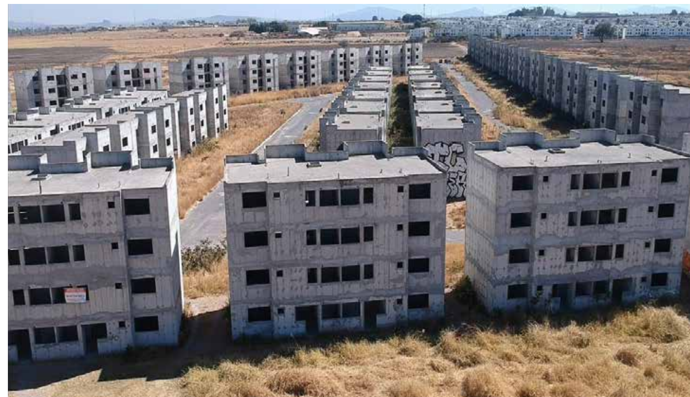
El abandono de miles de viviendas en Tlajomulco evidencia un modelo urbano fallido que ni el cambio de nombre ha logrado corregir.

Miles de familias enviadas a vivir lejos del empleo, los hospitales y las escuelas, atadas a una ruta de camión —la 187— que va tan repleta que la gente invierte dos horas en llegar al centro. Tlajomulco acumula hoy 77 mil 709 viviendas deshabitadas, el mayor número de cualquier municipio en el país. Ese no es un accidente. Es el resul-