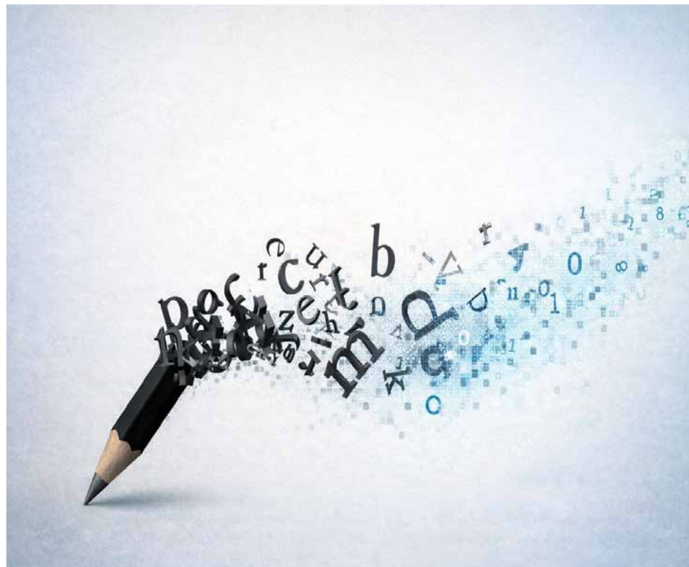
Entre letras y algoritmos, la poesía encuentra nuevas formas de existir en el mundo contemporáneo.

Con las redes sociales la poesía ha experimentado una transformación, no es un