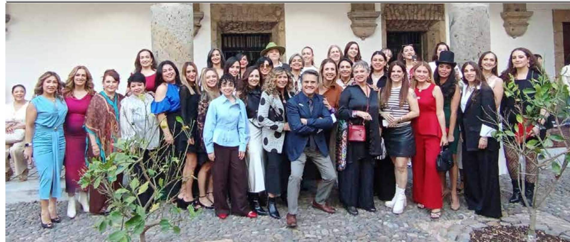
La exposición reunió a 35 mujeres artistas en un espacio que, más allá de la inauguración, se convirtió en un punto de encuentro y reconocimiento colectivo.