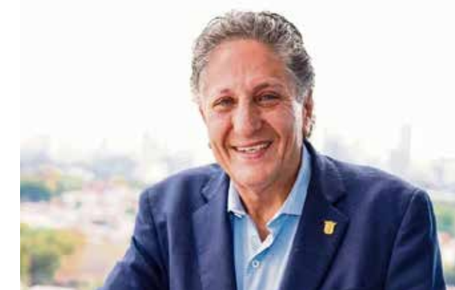
JUAN JOSÉ FRANGIE/ PRESIDENTE MUNICIPAL DE ZAPOPAN (Declaración a Mural)

Creo que existe un abuso del derecho, puesto que al tribunal electoral (TEEJ) sólo le competía o bien darle la razón al promovente o bien confirmar el dictamen del instituto (IEPCJ)".