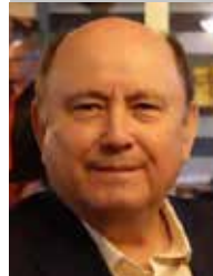
Por | Gabriel Ibarra Bourjac