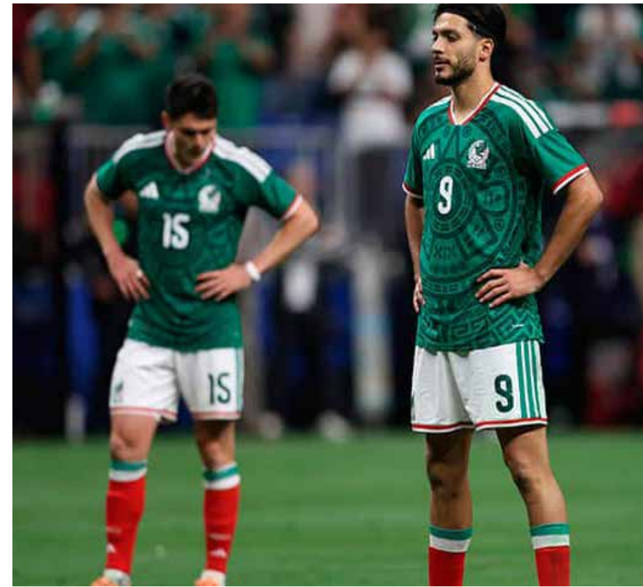
La Selección Mexicana enfrenta dudas en su funcionamiento y resultados, en medio de un entorno marcado por lesiones y presión rumbo al Mundial.