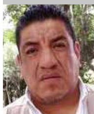
Por | Daniel Emilio Pacheco