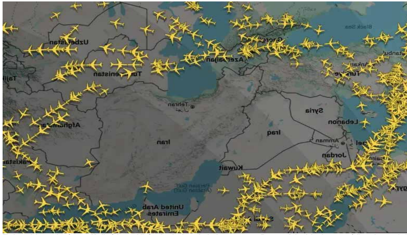
El cierre del espacio aéreo en Medio Oriente obligó a desviar las principales rutas entre Europa y Asia, dejando un “vacío” en el mapa de la aviación global.

El cierre de los cielos sobre Irán, Irak, Kuwait, Israel, Baréin, Catar y los Emiratos Árabes Unidos dejó un vacío en los mapas de seguimiento de vuelos, una imagen que los especialistas de CNN calificaron como