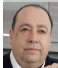
Por | Óscar Ábrego