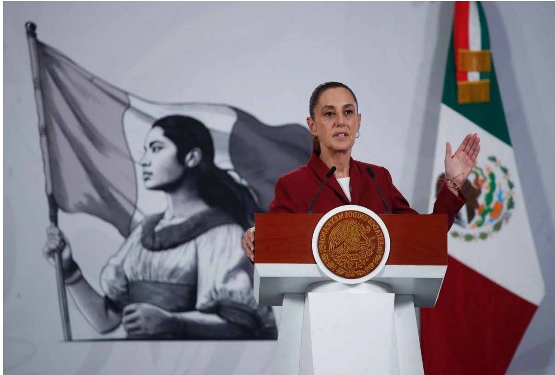
La presidenta Claudia Sheinbaum presentó el llamado Plan B, iniciativa que ha generado diversas posturas sobre su impacto en el sistema electoral.