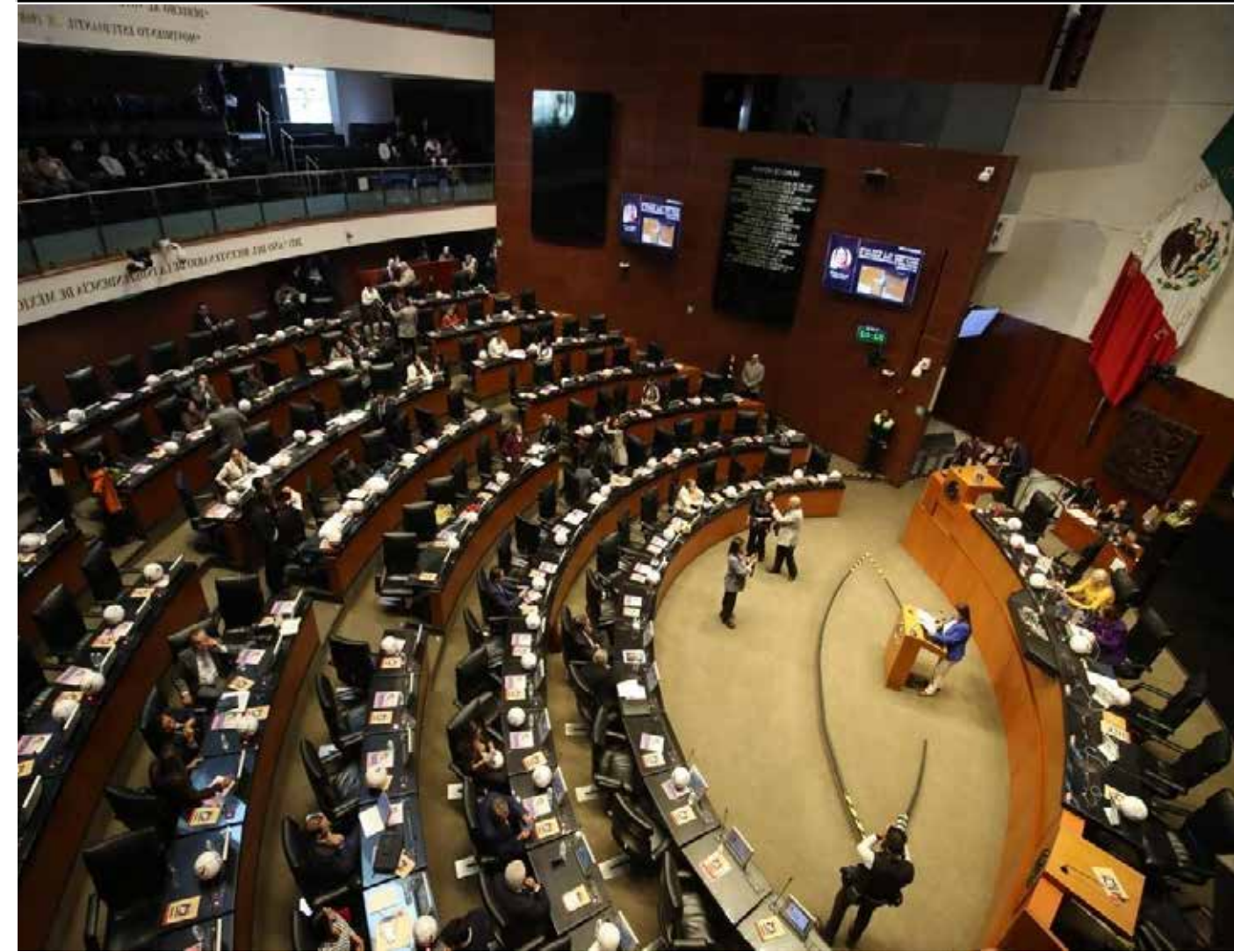
El avance del Plan B en el Senado expuso divisiones políticas y reavivó la disputa por el equilibrio de poder en México.

La revocación debe responder a una falta grave y no utilizarse como instrumento de ratificación o promoción política, lo que modificaría su esencia jurídica y democrática. “Lo que están haciendo es convertir la revocación en un instrumento de legitimación del poder y no en una herramienta para remover malos gobiernos”, afirmó Clemente Castañeda.