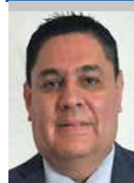
Por | Alejandro Verduzco Mendoza