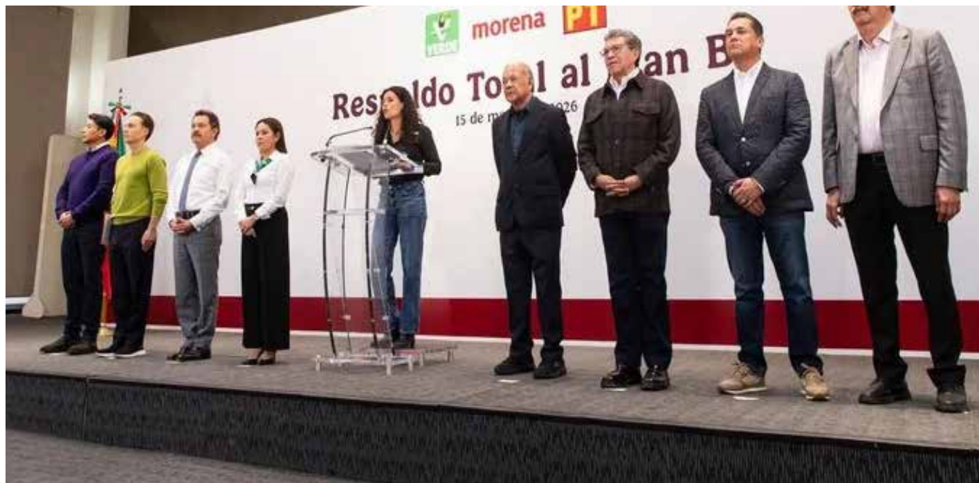
Actores políticos expresan respaldo al Plan B electoral, en un contexto de discusión sobre austeridad y reconfiguración institucional.

En la prohibición para órganos gasteños, quedan incluidos los egresos onerosos del Senado y de los Congresos estatales; de paso también los ajustes llegarán -lo cual es muy necesario- a los ayuntamientos, que suelen ser muy dispendiosos y por tal motivo -o sea,