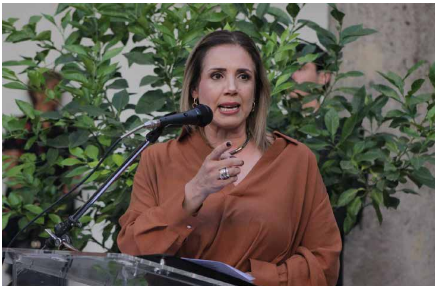
Fabiola Loya, secretaria de Igualdad Sustantiva entre Mujeres y Hombres de Jalisco, durante la inauguración de la exposición “Raíces y Alas” en el Ex Convento del Carmen.

De un lado, quienes han venido a observar, del otro, quienes están a punto de exponerse no sólo en sus obras, sino en sus discursos. Las artistas no ocupan un lugar fijo; se desplazan, se reconocen, se agrupan. Hay una complicidad silenciosa entre ellas, una especie de acuerdo no dicho que se per-