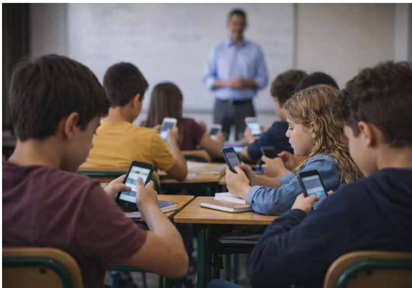
El uso extendido de dispositivos móviles entre estudiantes ha abierto nuevos espacios para la violencia digital dentro y fuera del aula.

Actualmente, la Ley de Educación del Estado establece la obligación de garantizar