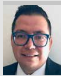
Por | Miguel Anaya