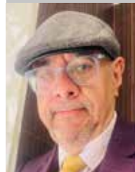
Por | Edgardo Padilla (*)