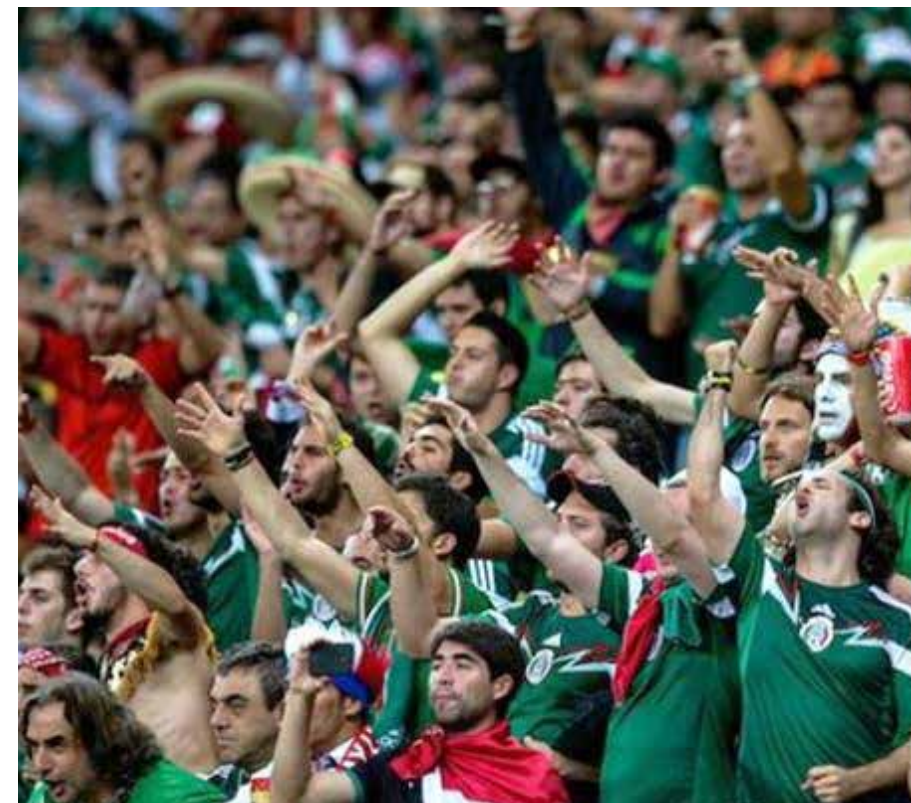
La afición mexicana, capaz de empujar al equipo, también se ha convertido en uno de sus principales cuestionamientos desde la tribuna.

Un excelente encuentro que el "Vasco" Aguirre se vistió de frac contra un técnico