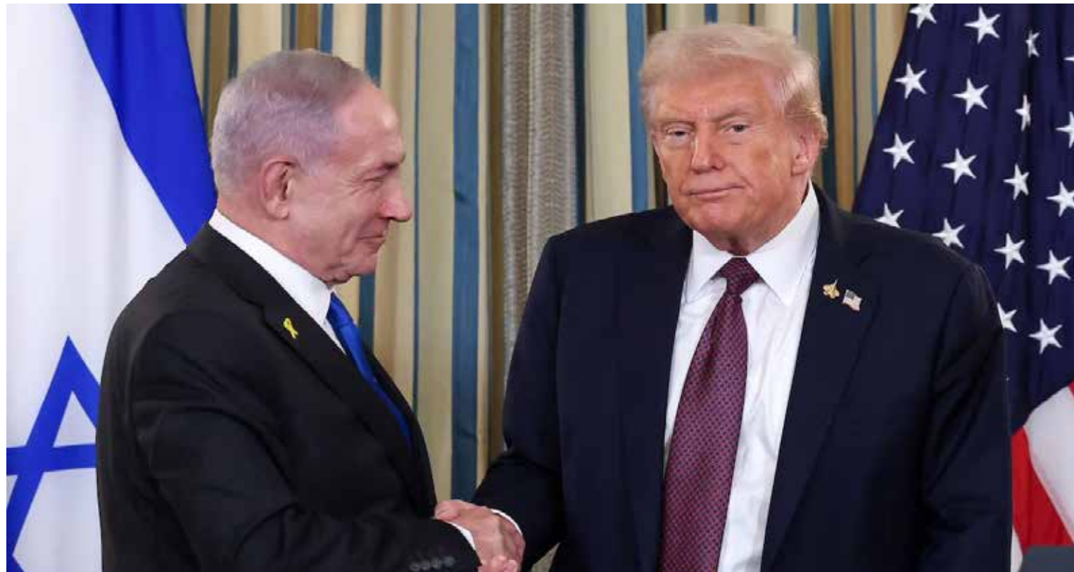
Donald Trump y Benjamin Netanyahu, dos de los principales protagonistas de la tensión geopolítica actual, en un escenario que mantiene al mundo en alerta.

La lucha fue especialmente entre las potencias del llamado Eje (Alemania, Italia, Japón) que se encaron a los países Aliados (Reino Unido, Francia, la Unión Soviética -luego del ataque que el 22 de junio de 1941, el represor alemán Adolfo Hitler le infirió-, y desde diciembre de 1941, los Estados Unidos que fueron agredidos por Japón). Los más relevantes líderes que participaron fueron por parte de Alemania, el