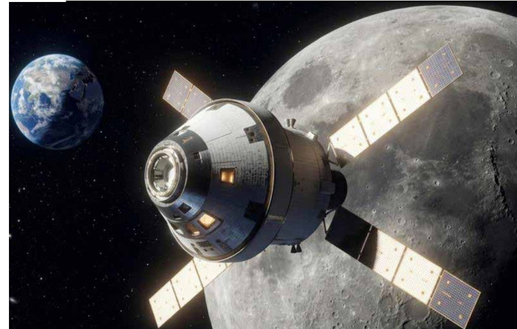
Así se vislumbra la luna en nuevas fotos de la NASA.

Los astronautas de Artemis II recorrieron 406,771 km alrededor de la Luna, rompiendo el récord de distancia de las misiones Apolo. Observaron la superficie lunar como nunca antes. Han pasado 54 años desde que Apolo 17 dejó a los últimos humanos en la Luna en 1972.