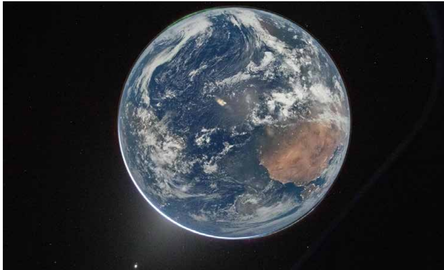
Los astronautas de Orión contemplaron esta espectacular vista completa de la Tierra, con África visible a la izquierda. Foto tomada por Reid Wiseman durante Artemis II. (NASA).

Comencemos abordando los casos que llamaron la atención global en torno a la "publicidad orgánica espacial" de ciertas marcas, como lo fue la mascota del espacio en esta misión, que en la página de "X" de la @NASA hace referencia a este personaje