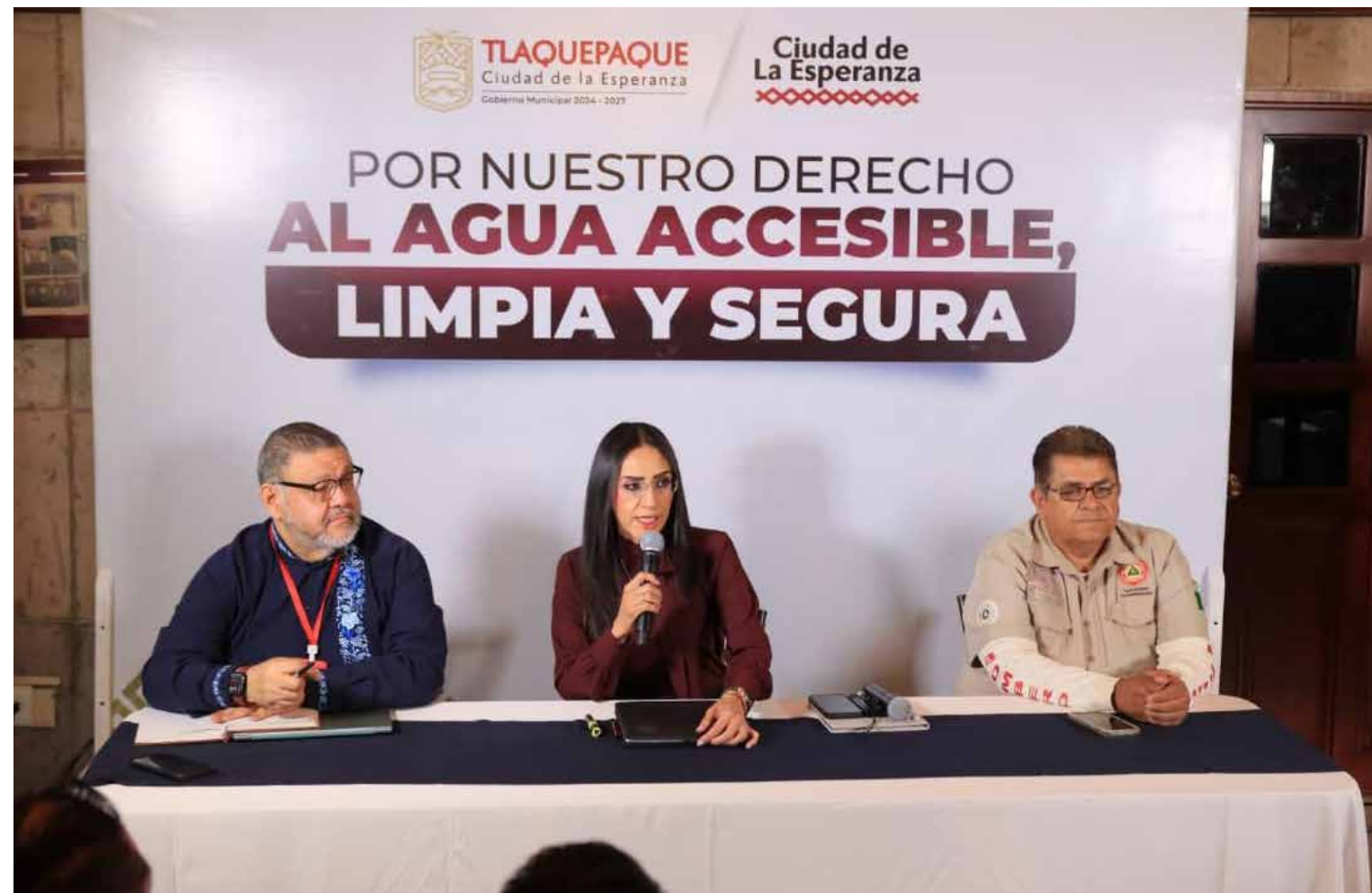
En el municipio de Tlaquepaque, la alcaldesa Laura Imelda Pérez Segura atribuye la crisis hídrica y ambiental en Arroyo Seco por descargas ilegales de aguas residuales y que el SIAPA ha permitido.

Las denuncias interpuestas incluyen señalamientos por delitos ambientales, negligencia y falta de mantenimiento en distintos puntos del sistema, así como posibles