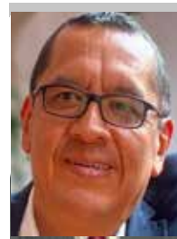
Por | Gerardo Rico