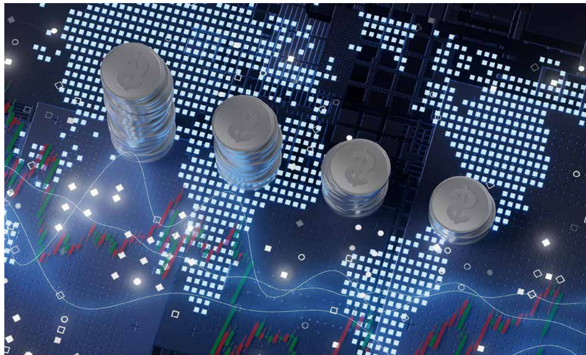
El control del dinero global está en disputa. Nuevos actores y tecnologías desafían el viejo orden financiero.