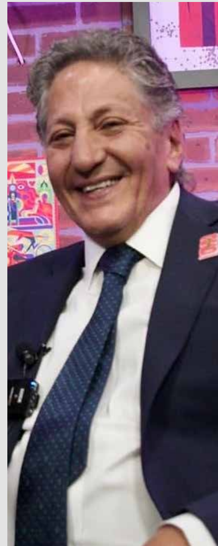
Juan José Frangie, presidente municipal de Zapopan, se pronuncia por una solución integral al problema de la crisis del agua que vive la metrópoli.

¿Qué participación ha tenido en la atención y solución a su problemática que se viene registrando durante las últimas administraciones hasta que el problema los rebasó?