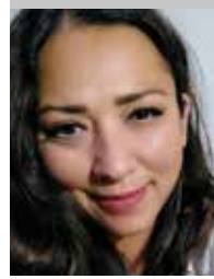
Por | Mónica Ortiz