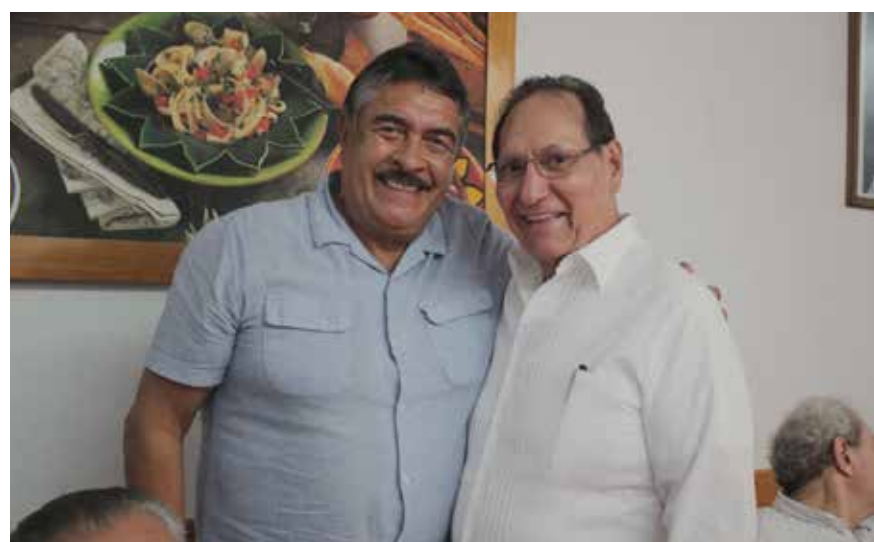
DOS GRANDES AMIGOS DE TODA UNA VIDA. La política los unió y los llevó a vidas trascendentes.