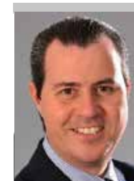
Por | Ramiro Escoto Ratkovich