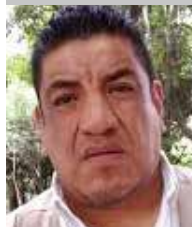
Por | Daniel Emilio Pacheco