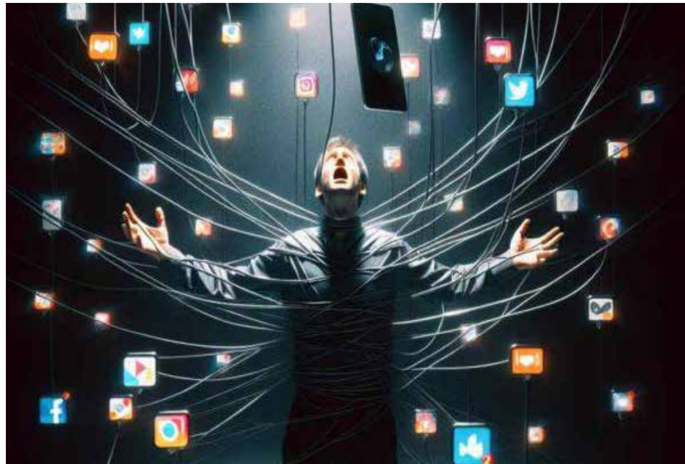
En la era digital, la saturación de voces convierte la opinión en ruido y diluye el análisis.

En el ámbito deportivo, esto se percibe con claridad. La cobertura de grandes eventos ya no está reservada únicamente a quie-