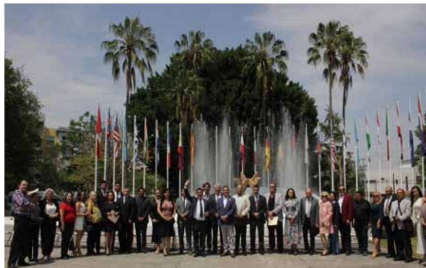
EN EL CENTRO DE LA AMISTAD INTERNACIONAL se realizó el pasado sábado el Primer Encuentro Nacional de Juristas de México con la participación del Instituto Nacional para la Celebración del Día del Abogado (INCEA), de la Confederación de Colegios y Asociaciones de Abogados de México (CONCAAM) y al Frente Nacional Jurídico en Defensa de la Constitución (FNJ).