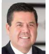
Por | Gabriel Torres Espinoza