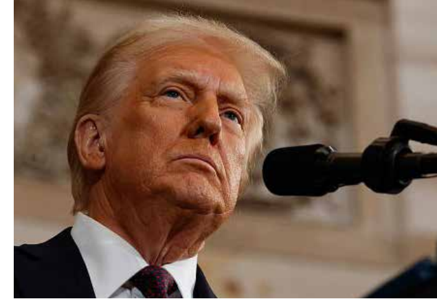
DONALD TRUMP/ PRESIDENTE DE EEUU

“Estamos ofreciendo un acuerdo muy justo y razonable, y espero que lo acepten (Irán) porque, de no hacerlo, Estados Unidos destruirá todas y cada una de las centrales eléctricas, así como todos y cada uno de los puentes de Irán. ¡Se acabó el ser el “tipo bueno”.