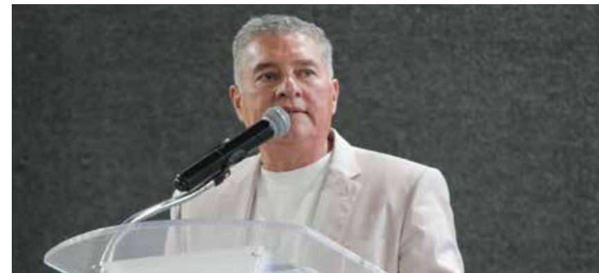
EL MAGISTRADO LUIS ENRIQUE VILLANUEVA fue el encargado de clausurar el Primer Encuentro Nacional de Abogados. En su mensaje final, lanzó una serie de preguntas provocadoras a los asistentes: "¿Están realmente conformes con la reforma judicial federal?" y tuvo como respuesta un no rotundo, expresando los abogados el malestar que prevalece contra dicha reforma.