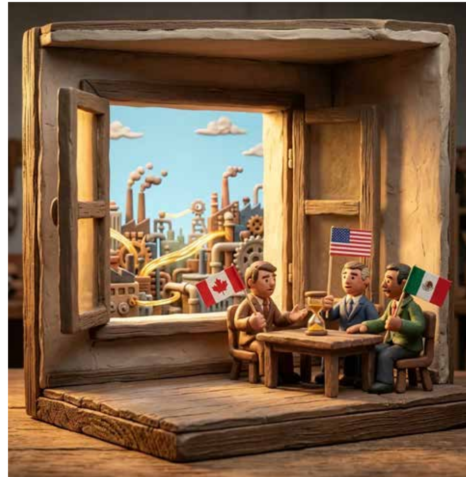
Imagen creada por artogroup.com

La paradoja se extiende a la refinación. La refinería Olmecca, en Dos Bocas, Tabasco, fue anunciada con un presupuesto de 8,000 millones de dólares. Su costo final