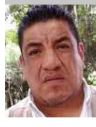
Por | Daniel Emilio Pacheco