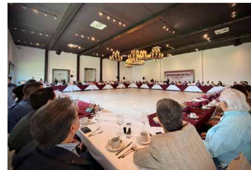
El diputado federal Alfonso Ramírez Cuéllar al anunciar una inversión federal de 6 billones de pesos en infraestructura estratégica, ante empresarios de Tlaquepaque y Jalisco.