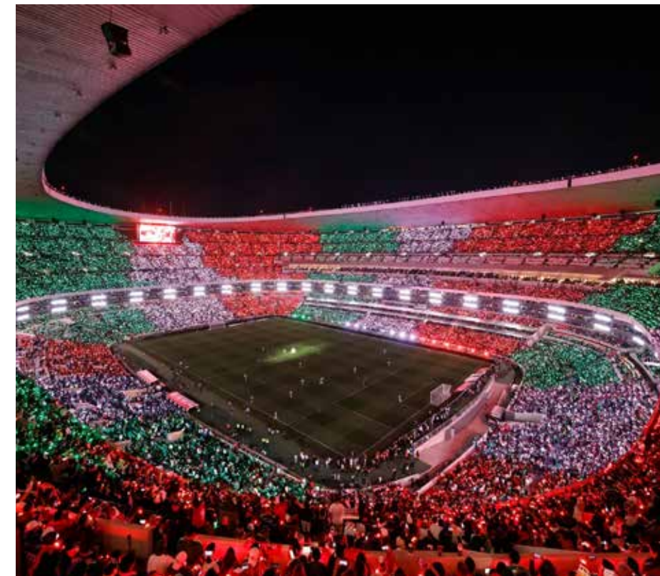
El espectáculo llena los estadios, pero el control del fútbol mexicano se decide lejos de la cancha.

No cabe duda de que el centralismo del fútbol tiene con el equipo de la televisora el liderazgo y el poder eterno que visto esta no existe autoridad alguna que los pueda someter.