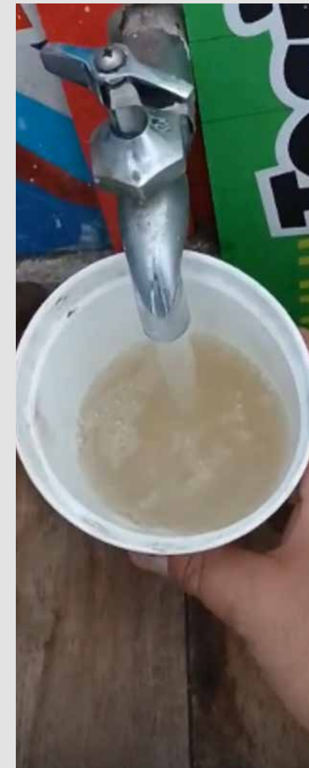
Los colores y los olores ingratos del agua en tuberías de la ciudad.

pesos semanales para bañarse, lavar trastes, atender a cuatro niños pequeños. La aritmética doméstica no falla, el gasto en agua “alternativa” supera con creces el recibo oficial.