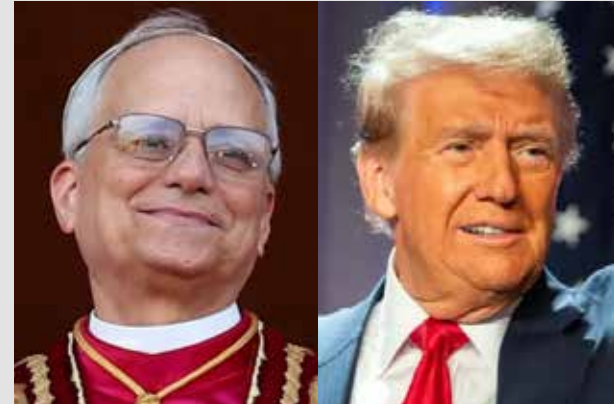
PAPA LEÓN XIV

“No tengo miedo de la Administración Trump, ni de proclamar en voz alta el mensaje del Evangelio, que es para lo que creo que estoy aquí y para lo que existe la Iglesia (...) “Bienaventurados los que trabajan por la paz”.