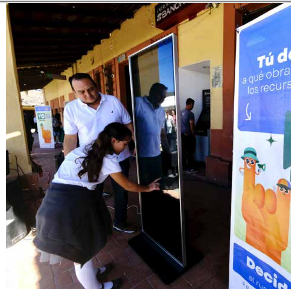
Se registraron más de 157 mil participaciones de niñas, niños y adolescentes, equivalentes al 17.1% del total. Uno de los mayores logros del ejercicio, que marca un paso histórico en la formación de ciudadanía desde edades tempranas en Jalisco.

Conciencia Pública. Algunos análisis señalan que, aunque la participación es alta, el grado de incidencia real de la ciudadanía es limitado porque las opciones ya vienen definidas desde la autoridad. ¿Cómo responde a esta crítica?