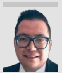
Por | Miguel Anaya