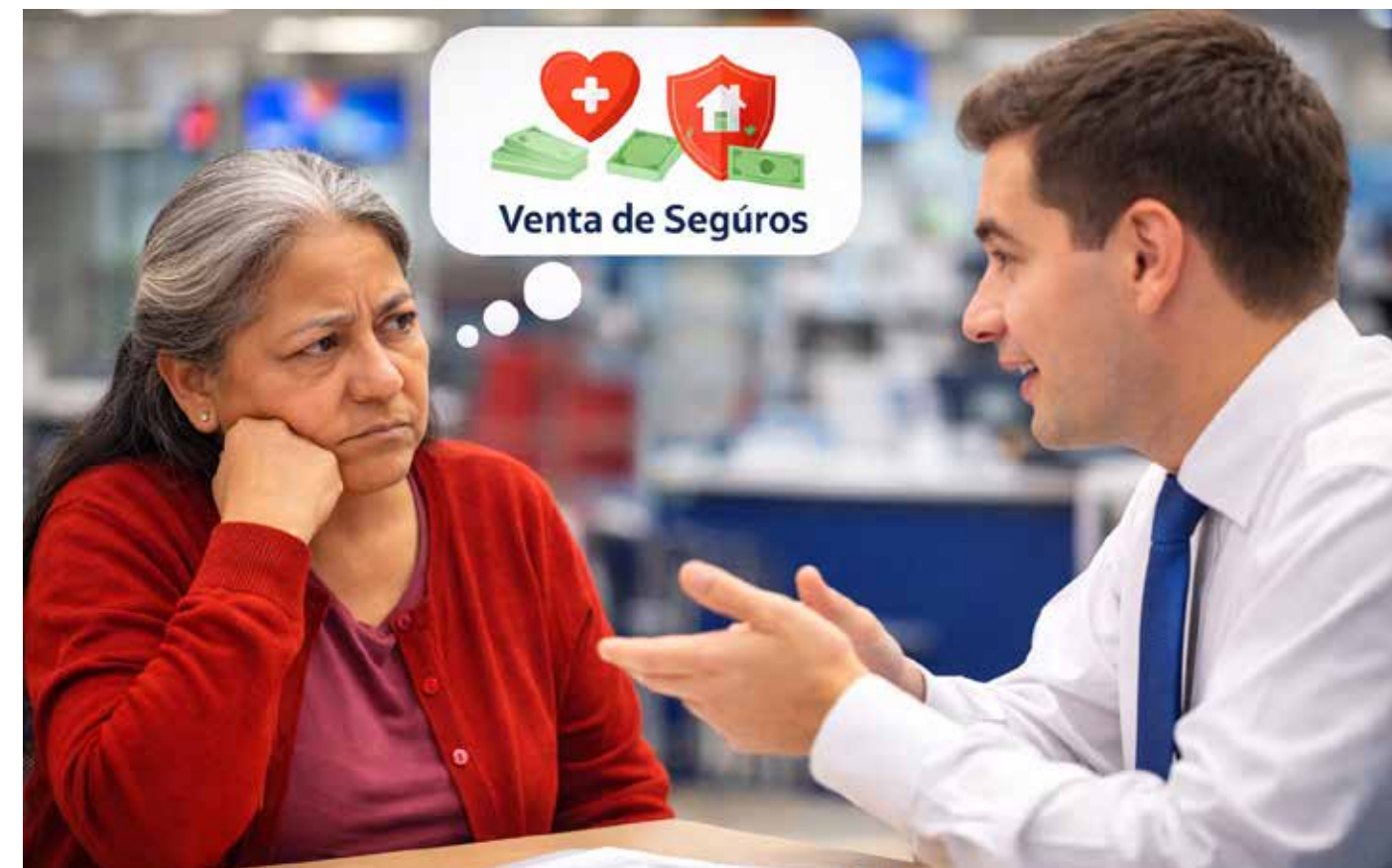
Un tema para la Condusef: bancos obligan a trabajadores que buscan jubilarse por el IMSS a comprar productos financieros, a cambio de expedir cuentas Nivel 4.

Para poder solicitar los pagos suspendidos, la persona pensionada debe cumplir con requisitos básicos: que su pensión esté vigente, que sea pagada a través del IMSS y, sobre todo, que pueda acreditar que no recibió el pago o que existe una diferencia. Este último punto abre una interrogante importante: ¿cuántas personas mayores tie-