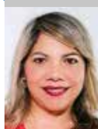
Por | Violeta Moreno Haro