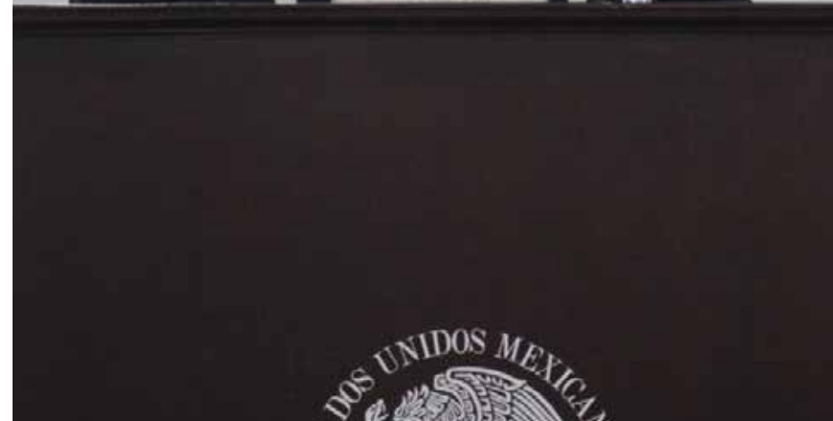
Maricela Morales Ibáñez, ex procuradora general de la República durante su conferencia magistral en la toma de protesta de la Delegación Jalisco de la CONCAAM, en el Tribunal Electoral del Poder Judicial del Estado de Jalisco.

abogacía y genera mayor confianza pública, protegiendo tanto al ciudadano como al propio abogado.”