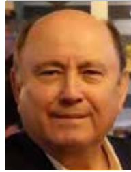
Por | Gabriel Ibarra Bourjac