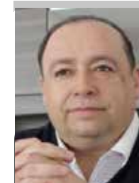
Por | Óscar Ábrego