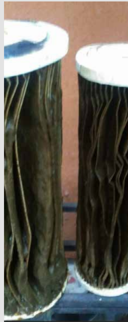
Filtros de una semana.