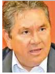
Por | Víctor Hugo Celaya