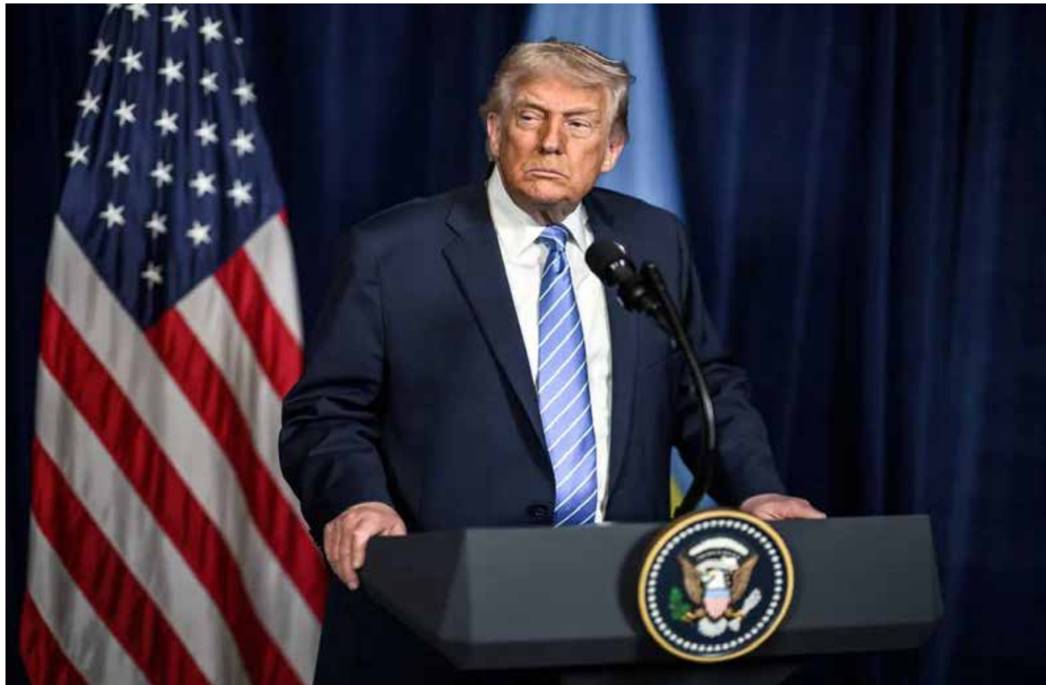
Liderazgos como el de Trump reflejan el alcance y la controversia del poder en el mundo actual.

Como ejemplo, podemos citar el caso del piloto británico Lando Norris, cuyo comentario lo compuso la empresaria, modelo, actriz, cantante, diseñadora y filántropa Paris Hilton. La afamada Hillary Clinton, ex primera dama gringa, que también fuera Secretaria de Estado y candidata presidencial -derrotada por Donald Trump, a pesar de que recibió más votos ciudadanos, en 2016- escribe sobre el Premio Nobel de la