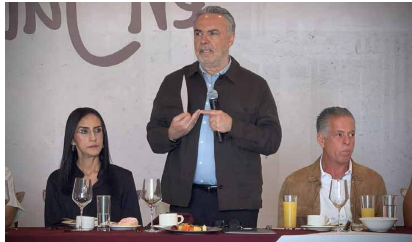
Alfonso Ramírez Cuéllar, vicecoordinador de los diputados de Morena en la Cámara de Diputados, durante su encuentro con el empresariado de San Pedro Tlaquepaque.

El legislador informó además que el próximo 22 de mayo se instalará la Mesa Estatal de Análisis para la Reforma al Código Fiscal Federal, con el objetivo de simplificar trámites, modernizar la banca de desarrollo y fortalecer la conectividad digital para 30 millones de personas en el país.