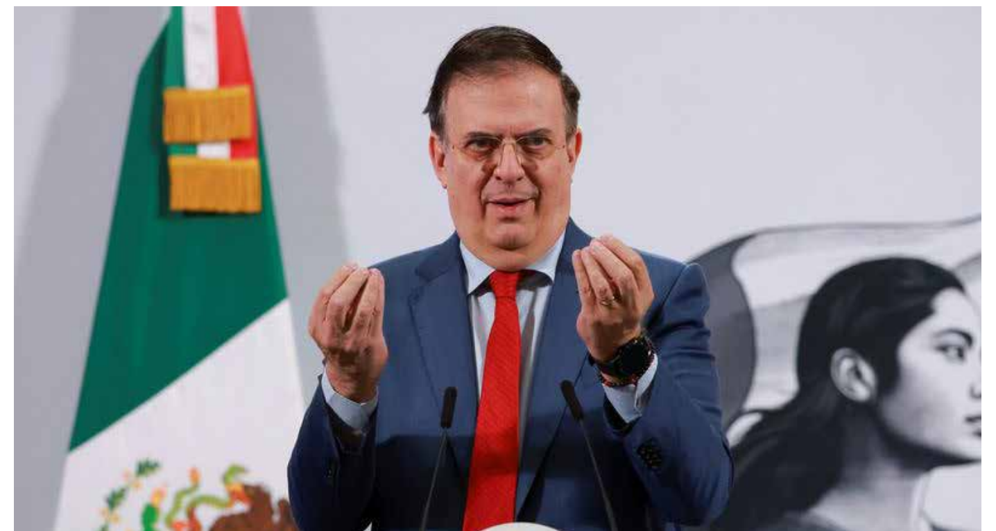
Marcelo Ebrard y la muestra que, desde el poder público, decisiones privadas vuelven a abrir el debate sobre sus límites.