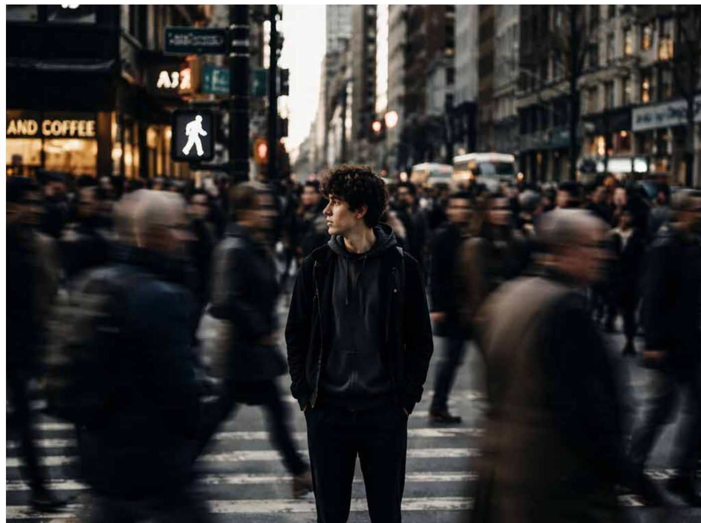
En la actualidad, el mundo cambia más rápido de lo que podemos entender.

Incluso el deporte, que durante mucho tiempo se percibió como un espacio relativamente estable en sus dinámicas, ha comenzado a transformarse con esta lógica.