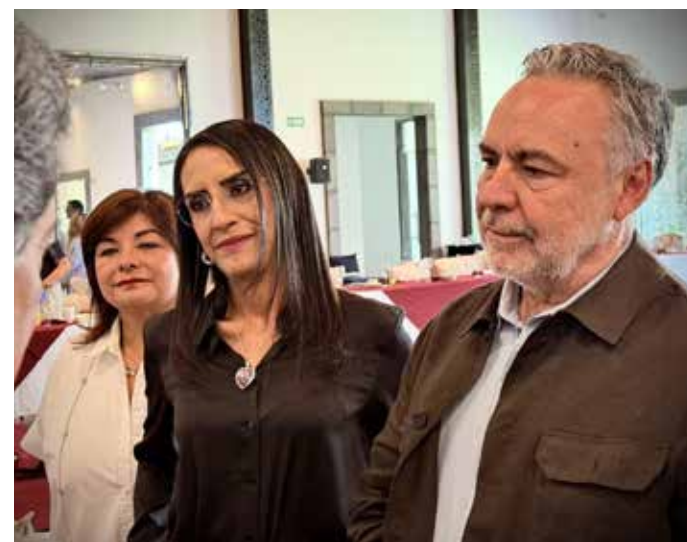
Alfonso Ramírez Cuéllar, vicecoordinador de los diputados de Morena en la Cámara de Diputados, durante su encuentro con el empresariado de San Pedro Tlaquepaque.