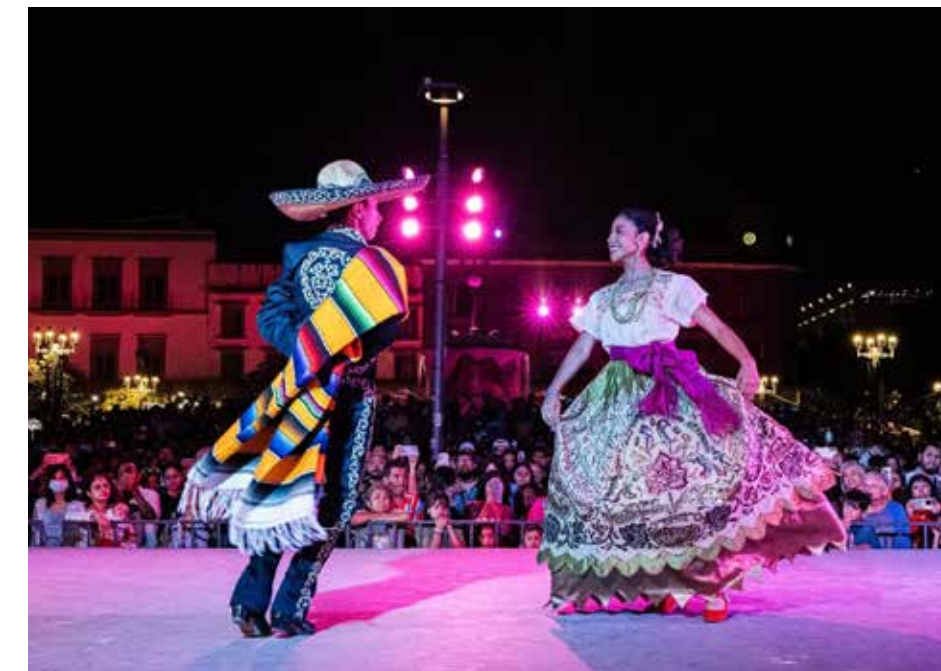
La tradición también se ilumina: espectáculos de danza folclórica acompañan las proyecciones y montajes del festival.