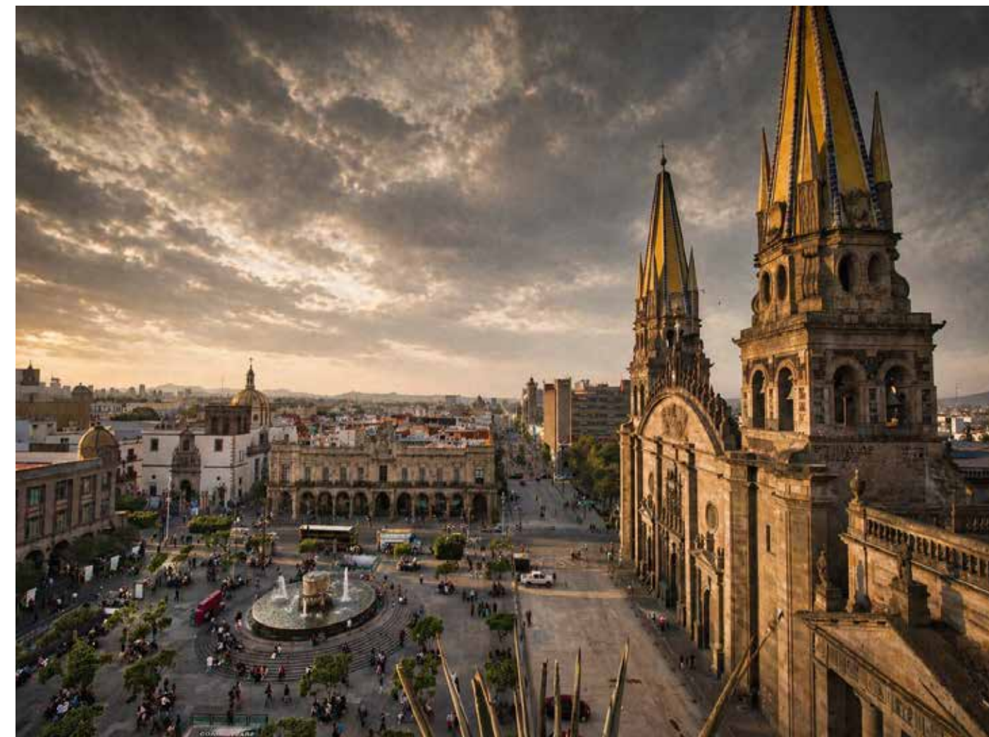
La ciudad sigue en marcha, pero las fallas en servicios básicos como el agua evidencian un deterioro que ya forma parte de la vida cotidiana.

GUADALAJARA HOY NO ES UNA CIUDAD DETENIDA. PERO TAMPOCO ES UNA CIUDAD QUE ESTÉ FUNCIONANDO COMO DEBERÍA. ES UNA CIUDAD QUE EMPIEZA A CONVIVIR CON FALLAS EN LO ESENCIAL, Y ESO CAMBIA LA FORMA EN QUE SE HABITA, SE PERCIBE Y SE PROYECTA.