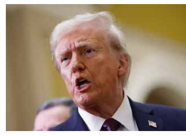
MENSAJE DE DONALD TRUMP EN TRUTH SOCIAL

“ ¡Demasiado tiempo malgastado viajando y mucho trabajo por hacer! La culpa es del régimen de los ayatolás y su caos interno. Nadie sabe quién manda. ¡Nosotros tenemos todas las cartas! Si quieren hablar, que llamen”.