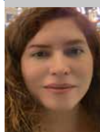
Por | Violeta Moreno Haro