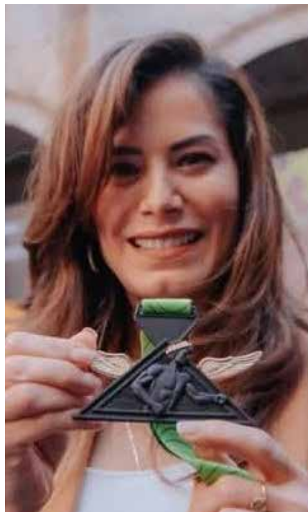
La alcaldesa Verónica Delgadillo tomó la decisión para que “Las Tres Gracias” sean conocidas y disfrutadas a plenitud, tanto por los tapatíos, como los miles de visitantes que recibe la ciudad. Un acto de reparación cultural y sensibilidad urbana.

sico y que componen “Las Tres Gracias” miden entre 7.5 y 9 metros y representan a las Cárites, diosas menores de la mitología griega, hijas de Zeus, que simbolizan lo que es digno de ser celebrado en la vida.