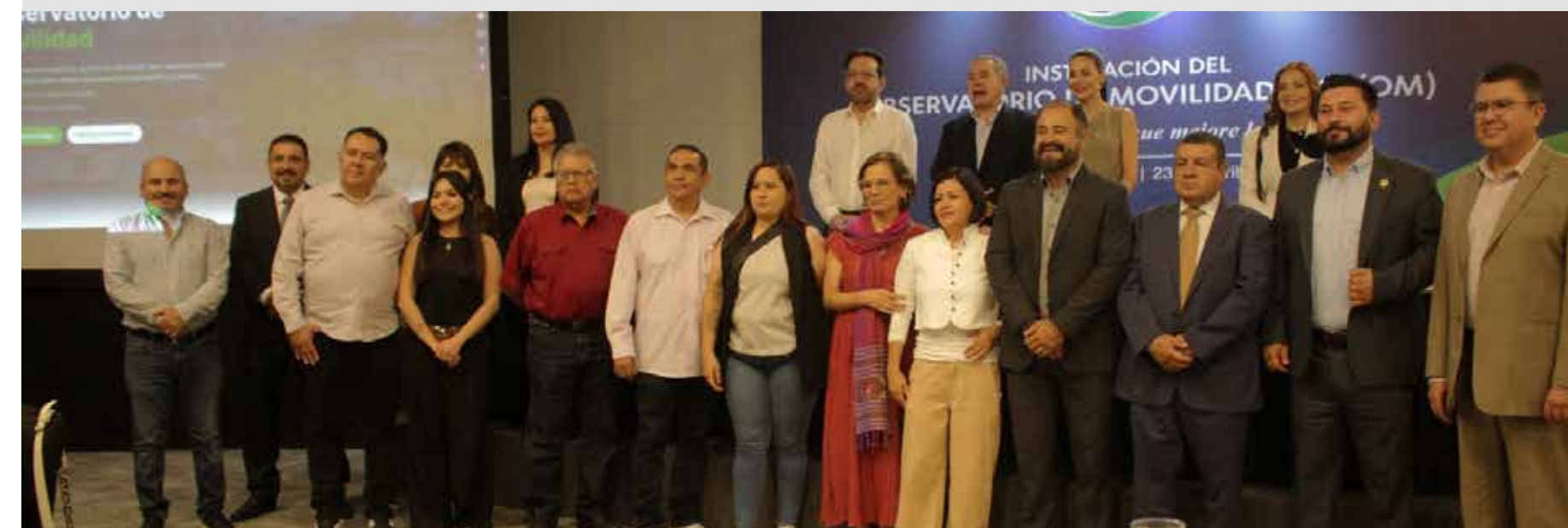
Entre las primeras siete recomendaciones al Gobernador Pablo Lemus destaca crear un Instituto de Movilidad autónomo, centrado en las personas, que diseñe, implemente y dé seguimiento a políticas para una movilidad integral, segura, eficiente y accesible.

1. Hacemos un llamado a garantizar el servicio de transporte público en zonas vulnerables, donde actualmente el servicio es limitado, irregular o inexistente. Por ello, se propone fortalecer la cobertura mediante esquemas que aseguren un servicio suficiente, revisando rutas existentes, identificando zonas con rezago y diseñando soluciones acordes a las necesidades de la población. Porque la movilidad no puede ser un privilegio, debe ser un derecho garantizado.