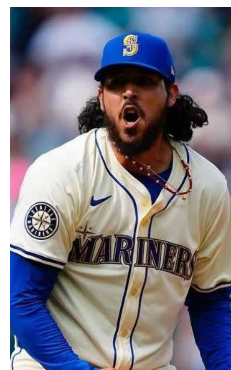
Andrés Muñoz. Tiene ya 5 rescates.

En su segunda temporada como titular con los Rays de Tampa Bay, Jonathan Aranda suma ya 6 jonrones y 21 carreras impulsadas, consolidándose como uno de los mejores productores ofensivos del equipo y de los mexicanos en Grandes Ligas.