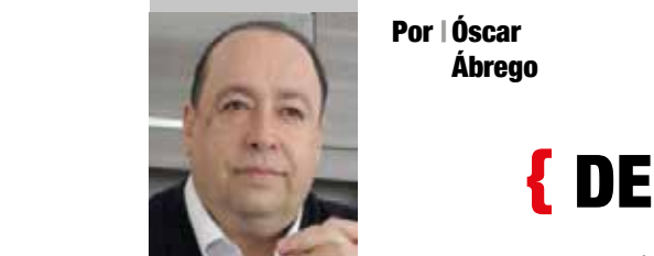
Por | Oscar Ábrego