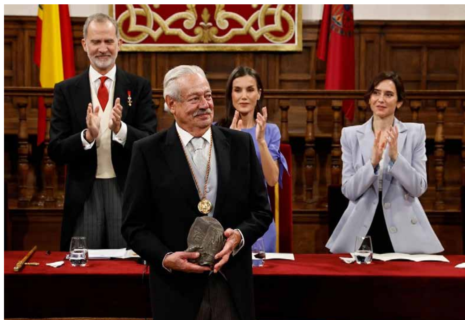
Gonzalo Celorio, con el Cervantes 2026 en sus manos: la consagración de una vida marcada por la memoria y la literatura.

Nacido en la Ciudad de México en 1948, Gonzalo Edmundo Celorio Blasco ha desarrollado una carrera multifacética como novelista, ensayista, académico, editor y promotor cultural. Doctor en Lengua y Literatura Hispánicas por la UNAM, ha sido profesor, secretario académico del Colegio de Letras, director de Literatura del INBA y director del Fondo de Cultura