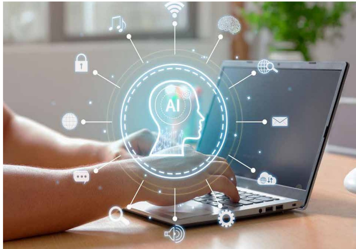
La inteligencia artificial se consolida como eje estratégico en las grandes tecnológicas, en medio de una ola de despidos que está redefiniendo el mercado laboral global.

Las cifras agregadas ofrecen una imagen aún más completa del fenómeno. Se