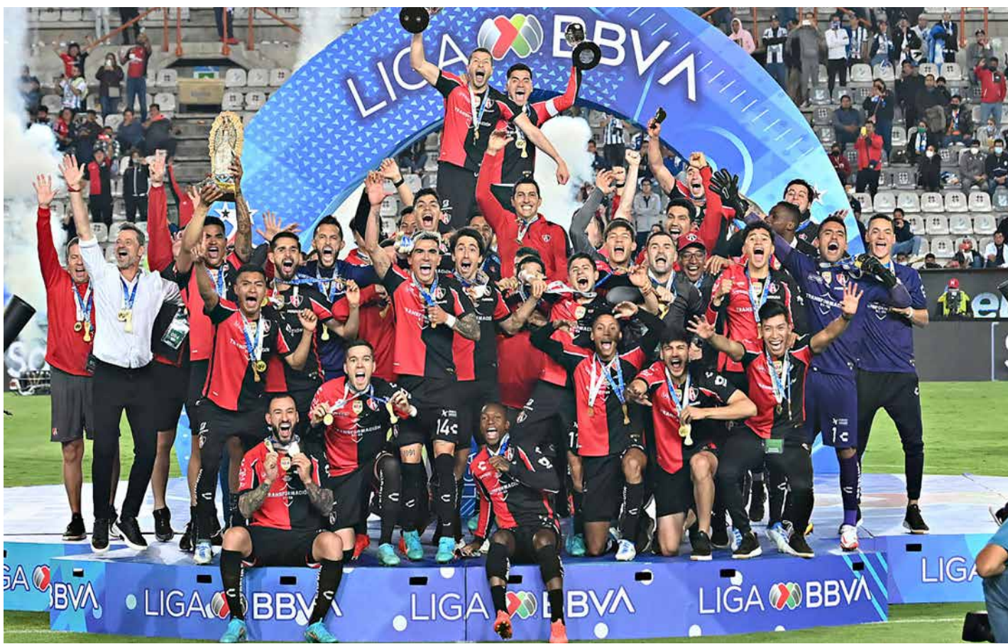
El bicampeonato marcó el momento más alto del Atlas bajo Orlegi; hoy, ese ciclo se cierra con la venta del club y abre una nueva etapa.

Sin embargo, del otro lado de la operación no hay títulos que defender, sino un discurso que construir. Grupo PRODI aterriza en el Atlas con una narrativa distinta. Su posicionamiento no se basa en logros dentro del fútbol de Primera División, sino en la promesa de desarrollo, crecimiento y visión a largo plazo. Su experiencia en el deporte proviene del beisbol, donde ya fue campeón con los Pericos de Puebla, y de su participación en proyectos de infraestructura a gran escala.