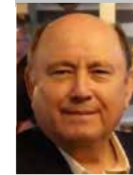
Por | Gabriel Ibarra Bourjac