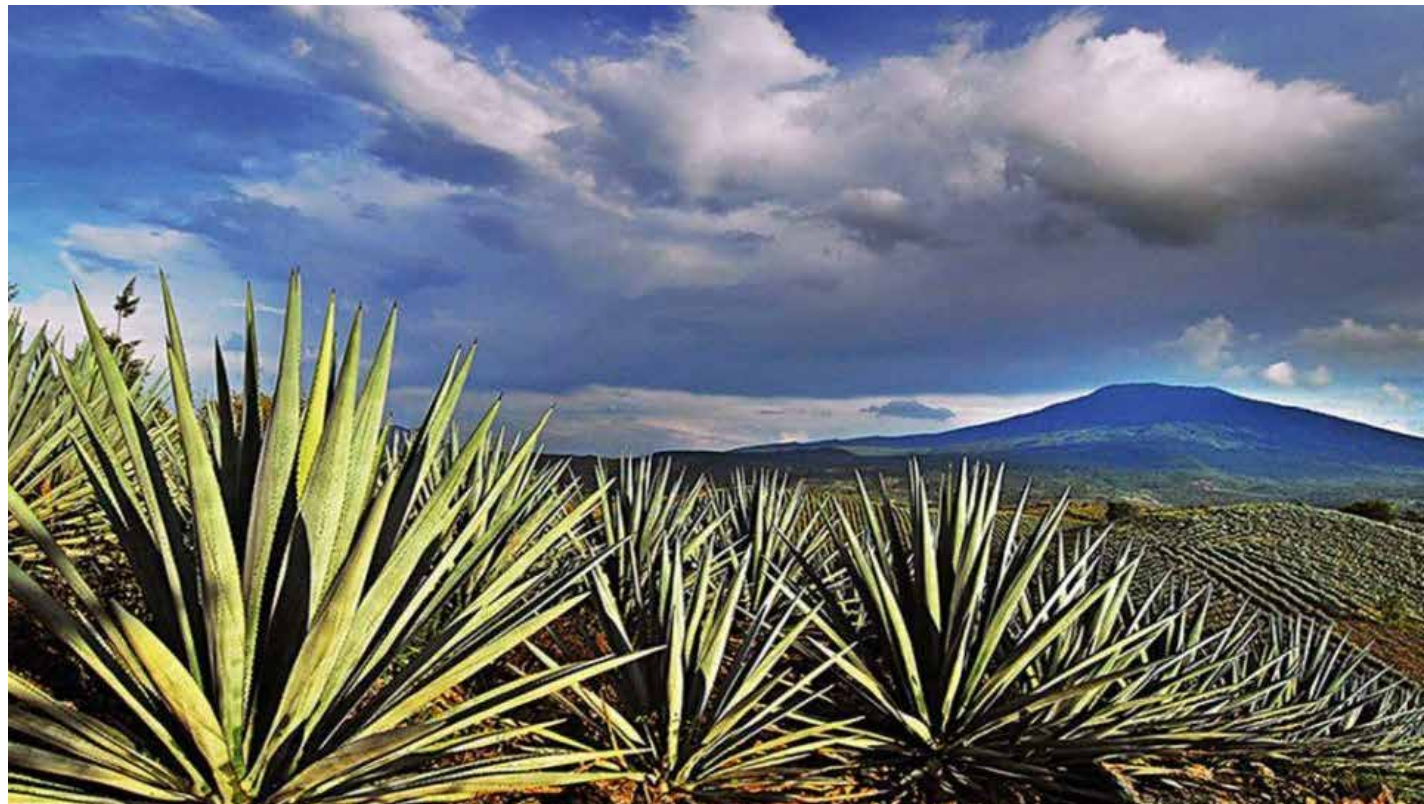
El paisaje agavero de Jalisco, cuna del tequila y símbolo vivo de la identidad mexicana.

La vida es mejor con bebida. De eso no cabe duda. Desde que el ser humano apareció sobre la tierra, algún líquido suele acompañarlo durante todas las facetas de su existencia. Alegrías y tristezas, son más llevaderas si se tiene un buen trago a la mano. En nuestra patria poseemos varios elixires que nos hacen más llevadera la existencia, de los cuales el más sobresaliente es el tequila, proveniente del agave azul y originario de Jalisco.