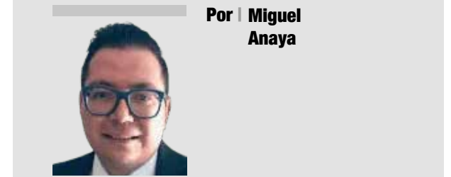
Por | Miguel Anaya