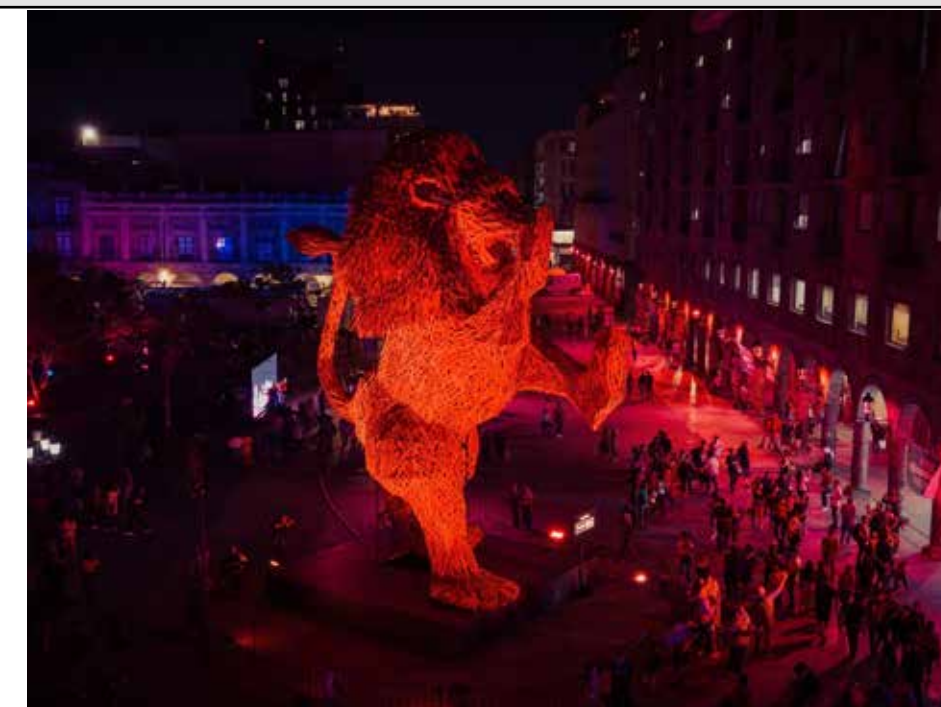
El público se convierte en parte del espectáculo, capturando cada momento del festival en el Centro Histórico.

Por unas horas, Guadalajara cambia de ritmo. Se desacelera para mirar, para escuchar, para caminar sin prisa. El espacio que durante el día es tránsito se convierte en experiencia. Y aunque todo termina a las 11 de la noche, lo que queda no es solo la imagen de las luces. Es la sensación de que la ciudad puede ser otra. GDLuz no solo ilumina Guadalajara, la redefine, aunque sea por unas horas.