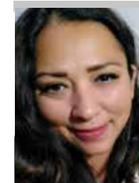
Por | Mónica Ortiz