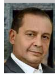
Por | Alejandro Rodríguez (*)