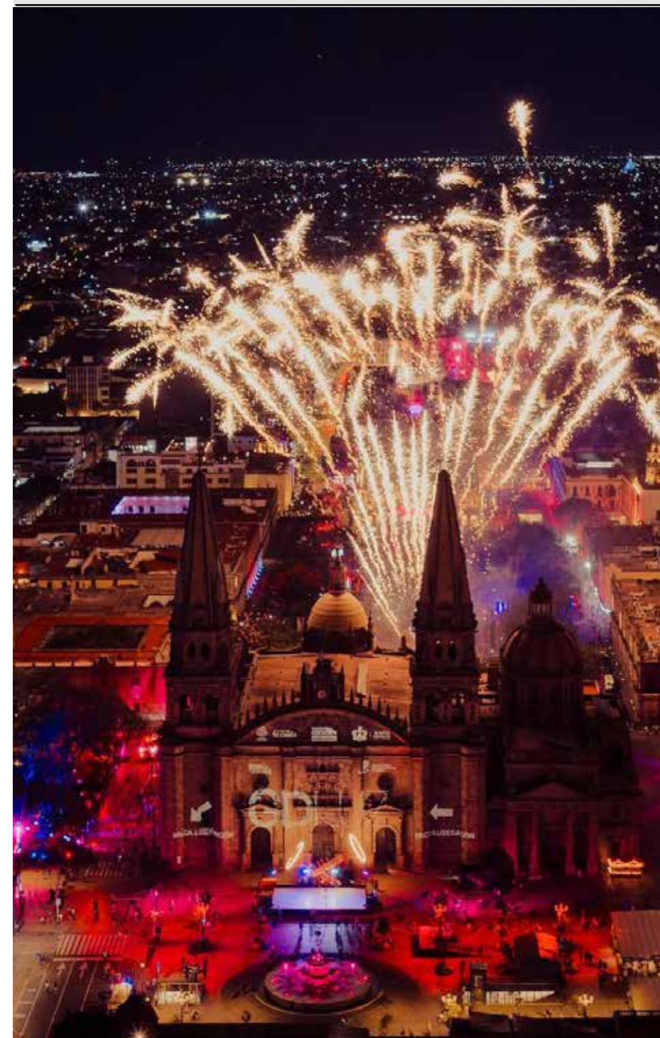
Instalaciones interactivas y esculturas luminosas forman parte del recorrido que transforma el espacio público durante GDLuz.

“Las áreas más votadas fueron Infraestructura Educativa y Sistemas Alternativos de Abastecimiento de Agua, porque ya habían sido priorizadas por la ciudadanía en la consulta del Plan Estatal de Desarrollo del año pasado. La gente votó por lo que más impacta su vida diaria: una educación digna para sus hijos y acceso confiable al agua”.