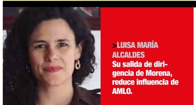
>LUISA MARÍA ALCALDE/ ALCALDES/ Su salida de dirigencia de Morena, reduce influencia de AMLO.

¿y Andy cuándo? La renuncia de Luisa María Alcalde a la dirigencia de Morena, para sumarse como Consejera Jurídica en el gabinete de Claudia Sheinbaum, se lee como un claro golpe de mano de la presidenta. Aunque se vende como “invitación honrosa”, refleja la voluntad de Sheinbaum por colocar leales en el partido y reducir la influencia directa de López Obrador. Sobre Andy López Beltrán, persisten rumores de su salida de la Secretaría de Organización, aunque Sheinbaum niega injerencia. Si, empieza el desprendimiento: la mandataria busca consolidar su propio control de Morena rumbo a 2027, marcando distancia del fundador sin confrontación abierta.