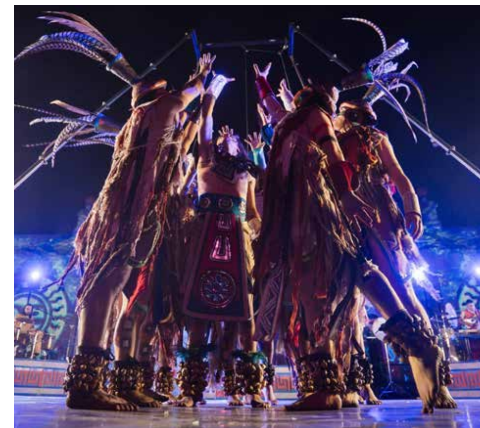
Propuestas escénicas inspiradas en la cultura mexicana integran la narrativa visual de GDLuz 2026.