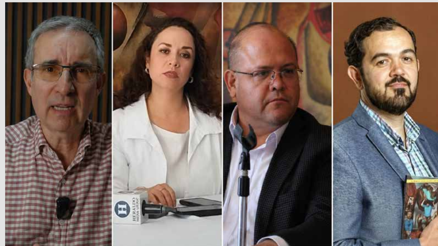
Representantes de organizaciones civiles fijaron postura ante la iniciativa en discusión en el Congreso de Jalisco.

"Están ignorando lo que realmente quiere en Jalisco", afirmó, al advertir que los