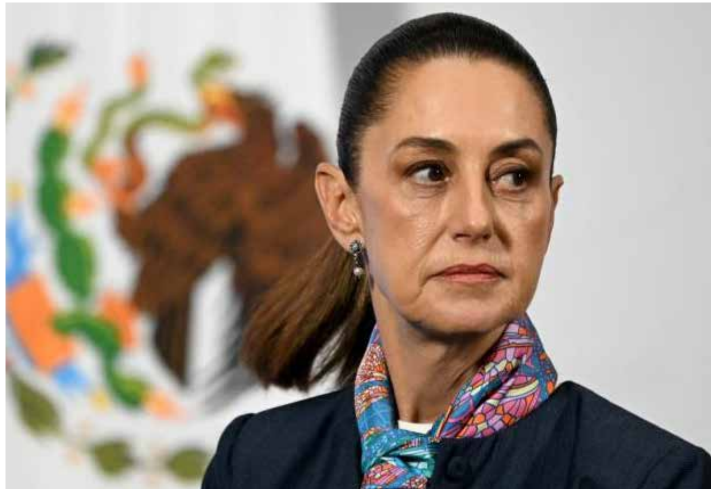
La presidenta Claudia Sheinbaum fijó postura ante las acusaciones de Estados Unidos, subrayando la defensa de la soberanía nacional y el debido proceso.

Los cargos para ambos políticos son delicados: a la exalcaldesa de Chihuahua, y ahora gobernadora de esa gran Entidad federativa, se le señala como principal responsable de una operación antinarcotráfico hecha por autoridades chihuahuenses -ayudadas por al menos cuatro elementos de la Agencia Central de Inteligencia 'CIA' o según alguna fuente, del FBI- entre el 16 y 19 de abril recientes, arrojando la muerte de dos de esos extranjeros, además del Director de la Agencia Estatal de Investigación y