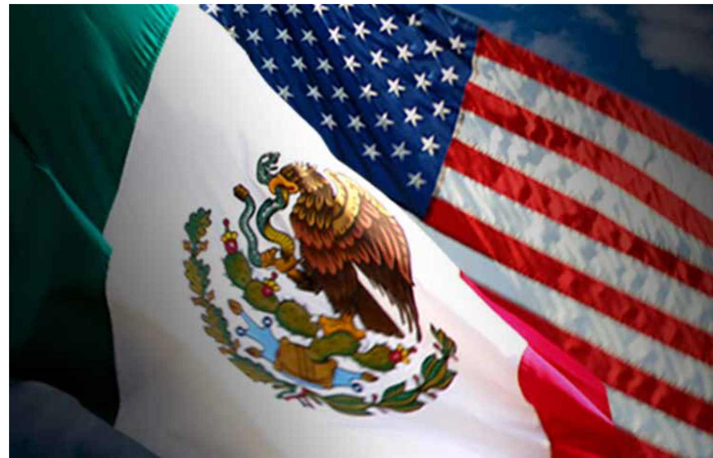
México y Estados Unidos, en una relación donde las decisiones judiciales también responden a contextos políticos y estratégicos.

Pero, por otro lado, esto no implica que los expedientes carezcan de sustento. Sería ingenuo asumir que una acusación de este calibre se construye sin elementos mínimos. Pero tampoco sería correcto ignorar que el momento en que se hace pública responde a una lógica que trasciende lo jurídico. En el derecho internacional contem-