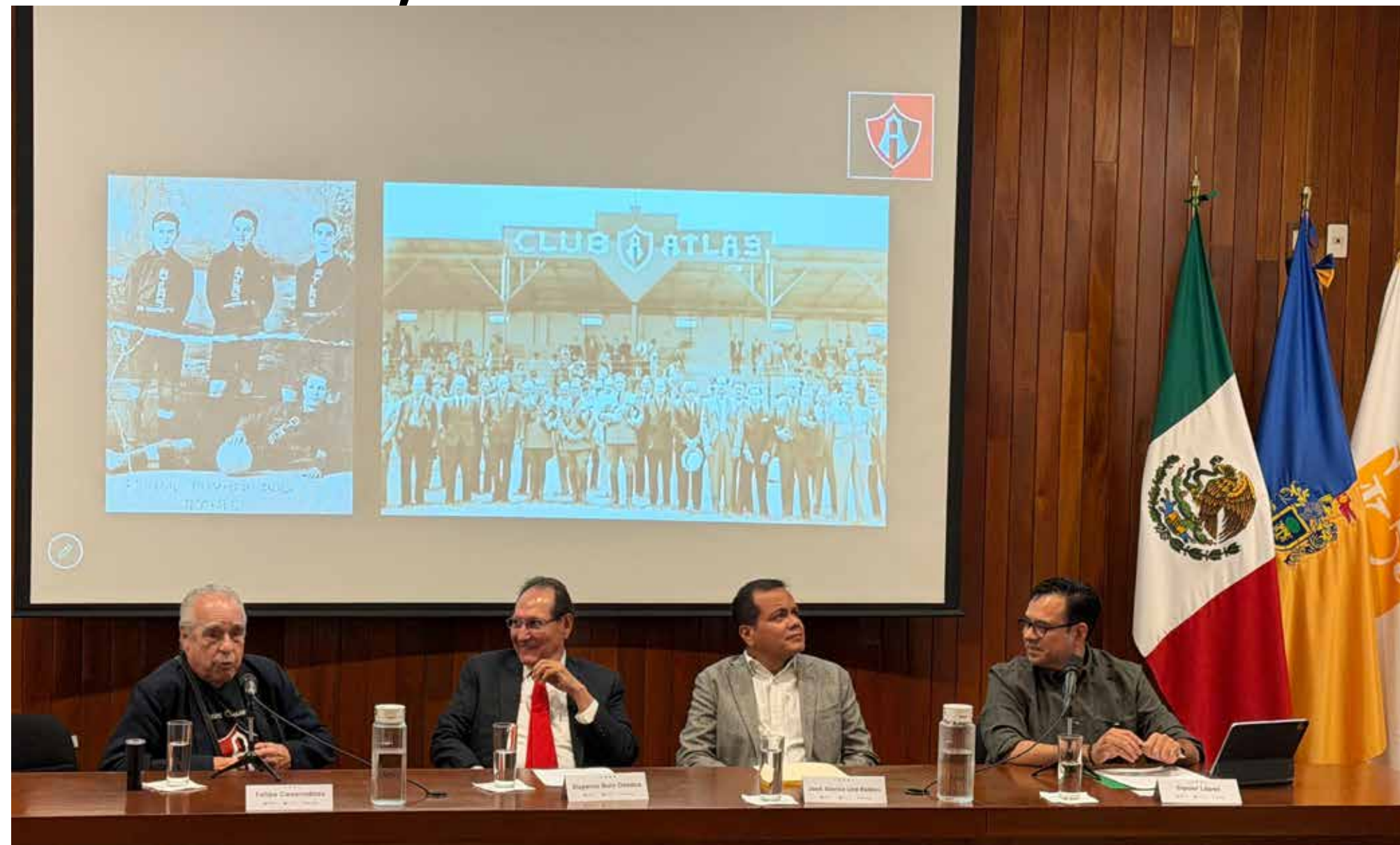
Desde El Colegio de Jalisco, especialistas reflexionaron sobre el Atlas como un fenómeno que trasciende el fútbol y se convierte en identidad y tejido social en Guadalajara.