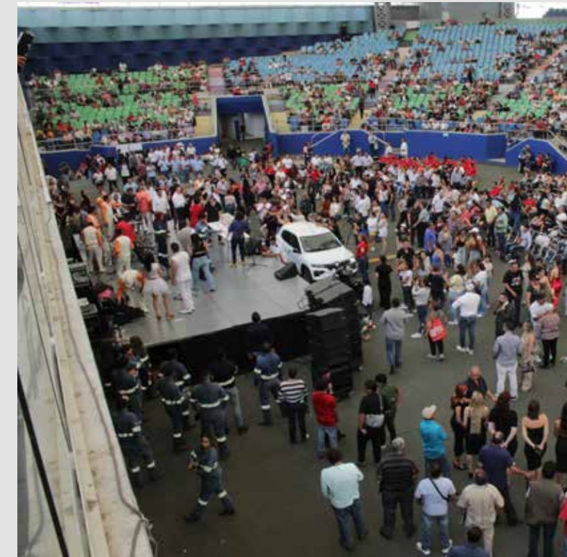
Miles de trabajadores disfrutaron la Feria Familiar Cetemista realizada en el ágora de PALCCO en Zapopan.