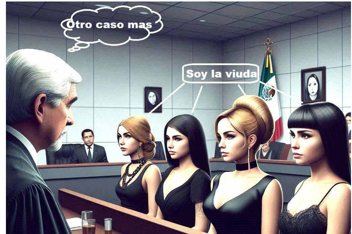
Es mejor jubilarse ante el IMSS con pareja, para obtener una asignación familiar que aumenta la pensión. El dilema, ¿matrimonio o concubinato? Un juez deberá reconocer la relación, fundamental para la pensión de viudez.

Previamente a tu jubilación, calcula medio año para tramitar el acta de concubinato, deberás presentar una demanda ante juzgado familiar y esa resolución es la que acepta el IMSS en todos sus trámites como