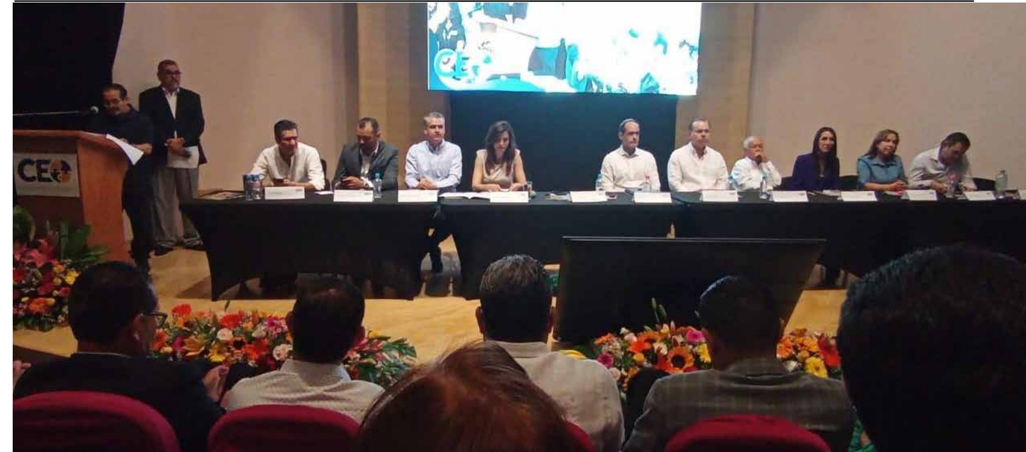
Celebración del Día del Trabajo en PALCCO, Jalisco donde se dieron los posicionamientos sindicales, políticos y económicos sobre la situación del empleo en Jalisco.

A este panorama se suma un problema estructural a nivel nacional, la informalidad, donde 56 de cada 100 personas económicamente activas carecen de seguridad social y prestaciones, de acuerdo con el secretario del Trabajo, Ricardo Barbosa Asensio, quien advirtió que este fenómeno sigue siendo uno de los principales obstáculos para garantizar condiciones laborales dignas en el país.