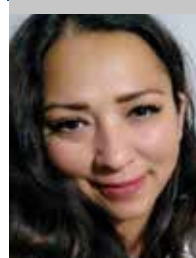
Por | Mónica Ortiz