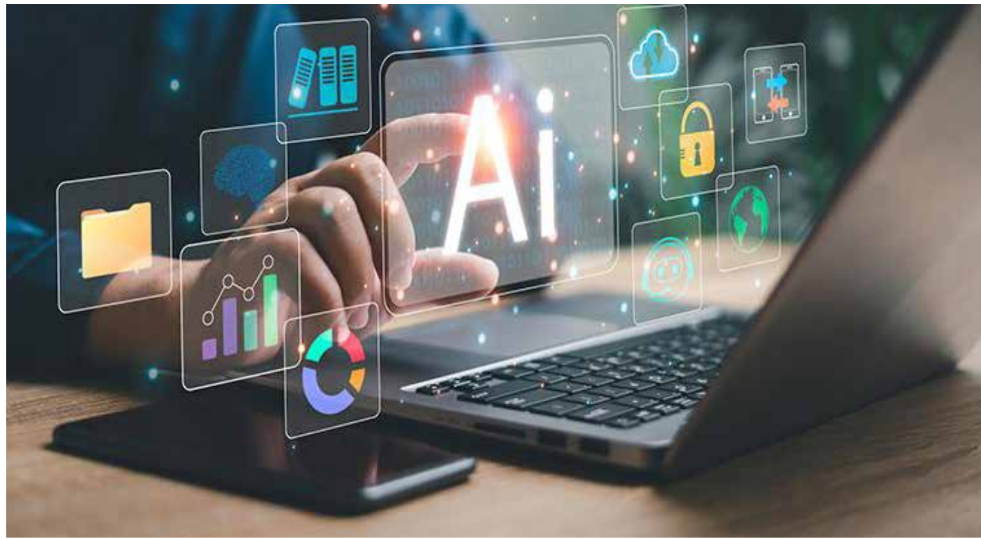
La inteligencia artificial ya forma parte del trabajo cotidiano y está transformando la contratación, especialmente en puestos de nivel inicial.

Apple ha definido su hoja de ruta para la próxima década en torno a la "inteligencia espacial" de Tim Cook. La compañía busca