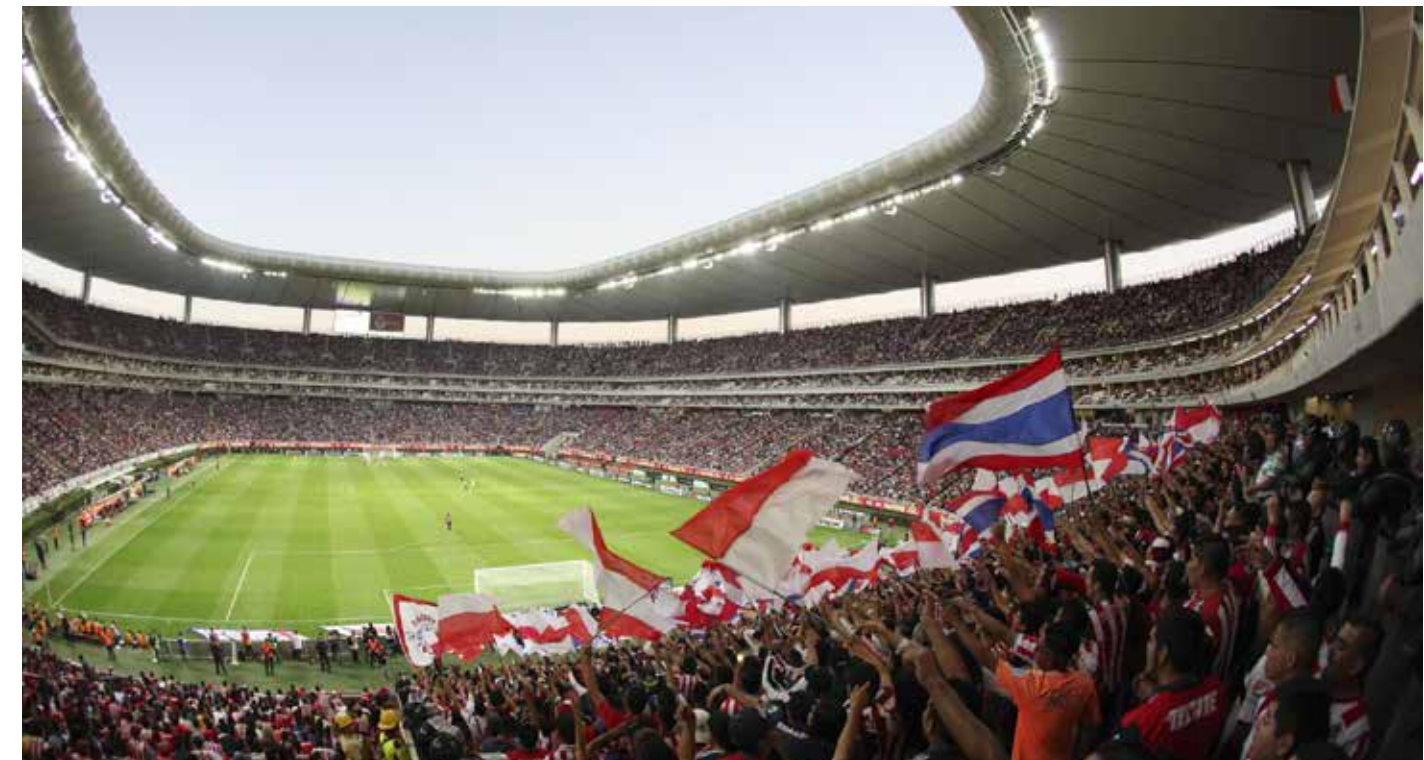
El espectáculo de la liguilla llena los estadios, mientras el poder y los intereses siguen marcando el rumbo del fútbol mexicano.

Como siempre sucede en cualquier ámbito de la vida, la historia la forjan y escriben los ganadores y quedan ahí para la posteridad, ese legado tangible para la humanidad particularmente para pueblos en desarrollo como nuestro México querido.