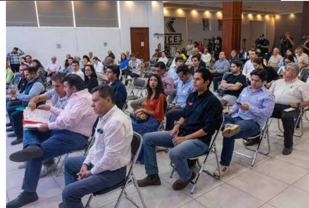
Voces diversas de la academia, sociedad civil y personas interesadas y preocupadas por la problemática hídrica de la metrópoli y del lago de Chapala, se expresaron con absoluta libertad en las Jornadas de Gestión Hídrica Metropolitana 2026.

de mejor calidad, avanzar hacia el tratamiento total de aguas residuales y promover una economía circular del agua.