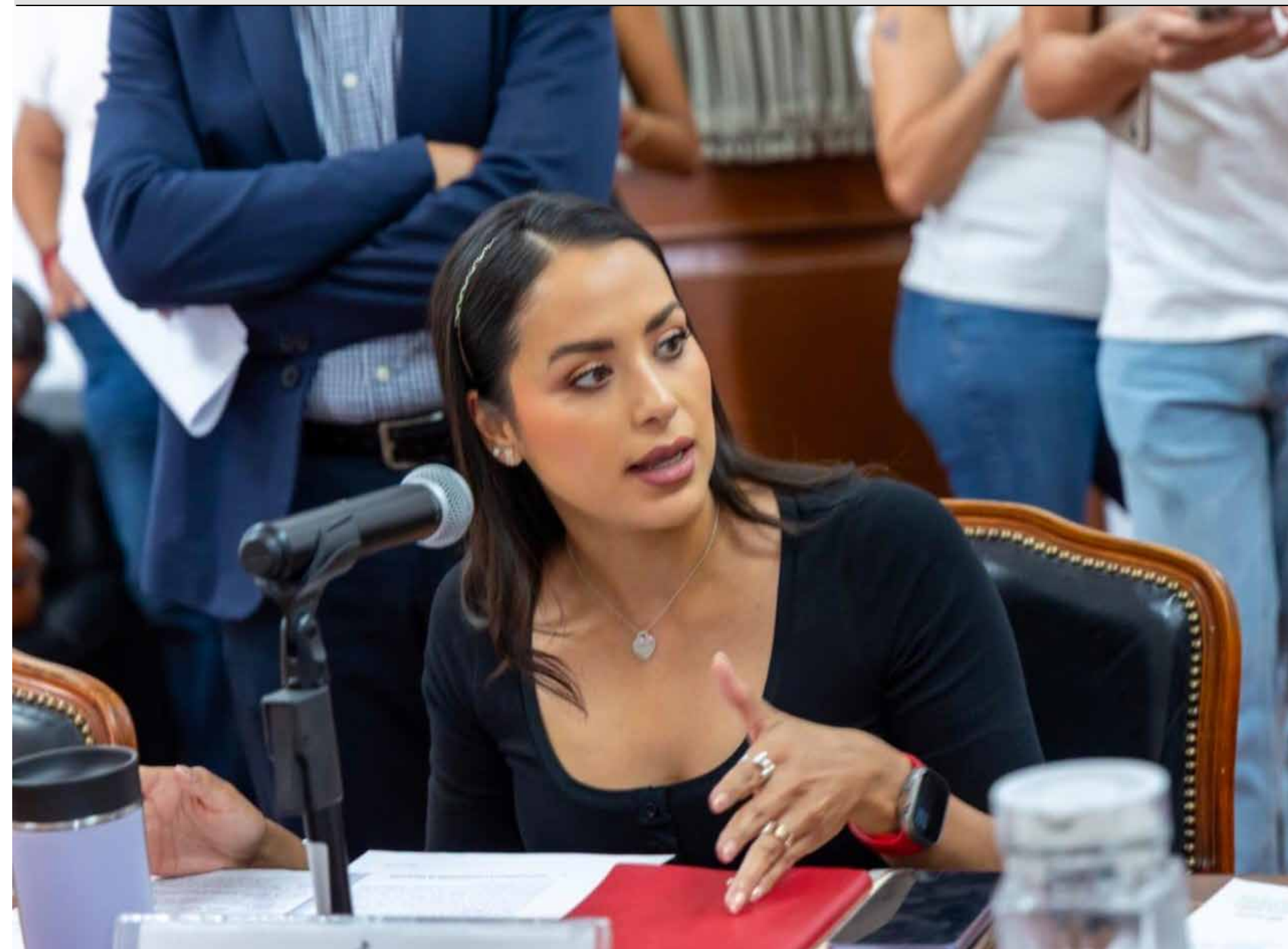
En entrevista con Conciencia Pública, la diputada reconoció el desgaste de su partido, pero defendió su llegada al cargo como resultado de un camino construido con esfuerzo, desde su candidatura en el complicado Distrito 10 hasta su paso por el Congreso de la Unión.

Sobre la agenda que impulsará, expresa: “Hay temas relevantes, por ejemplo, está la Reforma Judicial, el llamado Plan B, y leyes en materia de transparencia. Más que impulsar ideologías, se debe garantizar que las agendas de todos los partidos lleguen a votación del Pleno. La clave será el diálogo y la coordinación con la Junta de Coordinación Política (JUCOPO)”.