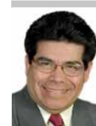
Por | Francisco Javier Ruiz Quirrin