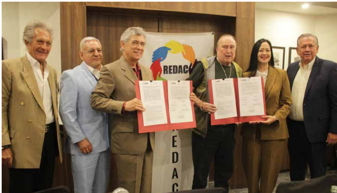
El convenio representa un importante ejemplo de colaboración entre sociedad civil, iniciativa privada y gobierno para atender una necesidad crítica en el sector salud.

El empresario también se comprometió a mejorar la atención a los donadores. “El donador es un héroe humanitario. No encontramos explicación a la mala atención