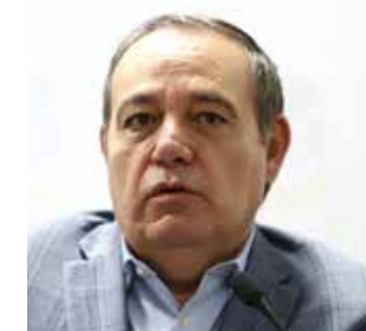
Disminución de homicidios en 44% en Jalisco.