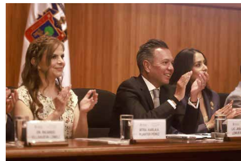
Pablo Lemus durante su intervención destacó que la relación entre el Gobierno de Jalisco y la Universidad de Guadalajara se basa actualmente en el diálogo y los acuerdos institucionales, a diferencia de los años de confrontación política en administraciones anteriores.