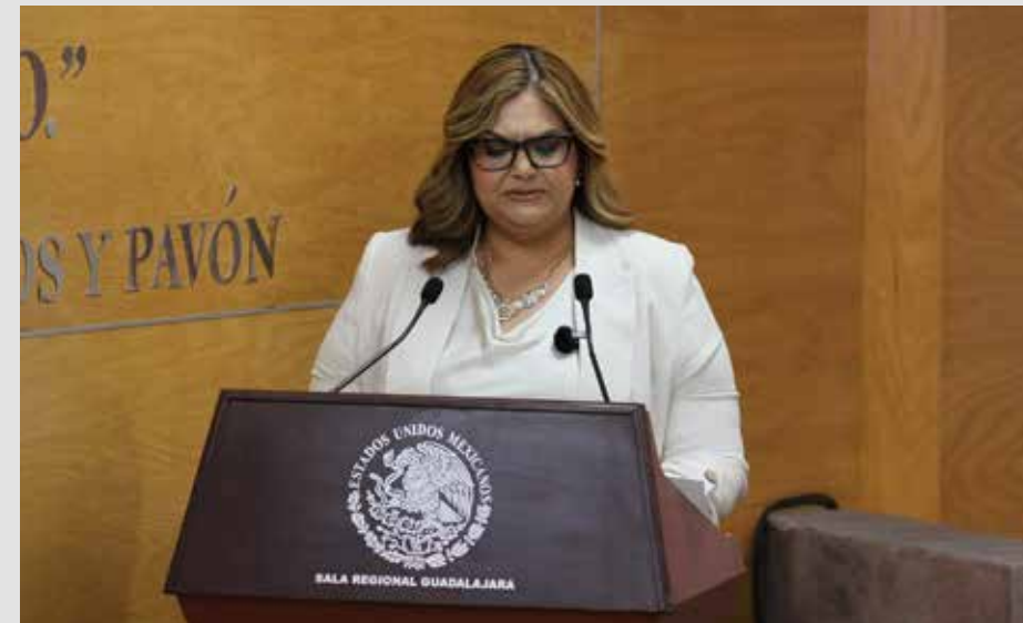
La magistrada Rebeca Amador, presidenta de la Sala Regional Guadalajara del TEPJF, defiende el proyecto que limita las candidaturas a la alcaldía de Zapopan solo a mujeres indígenas, con discapacidad o de la comunidad LGBT.

versidad en el poder público”, señalando que se trata de una restricción temporal y proporcional frente a grupos históricamente excluidos.