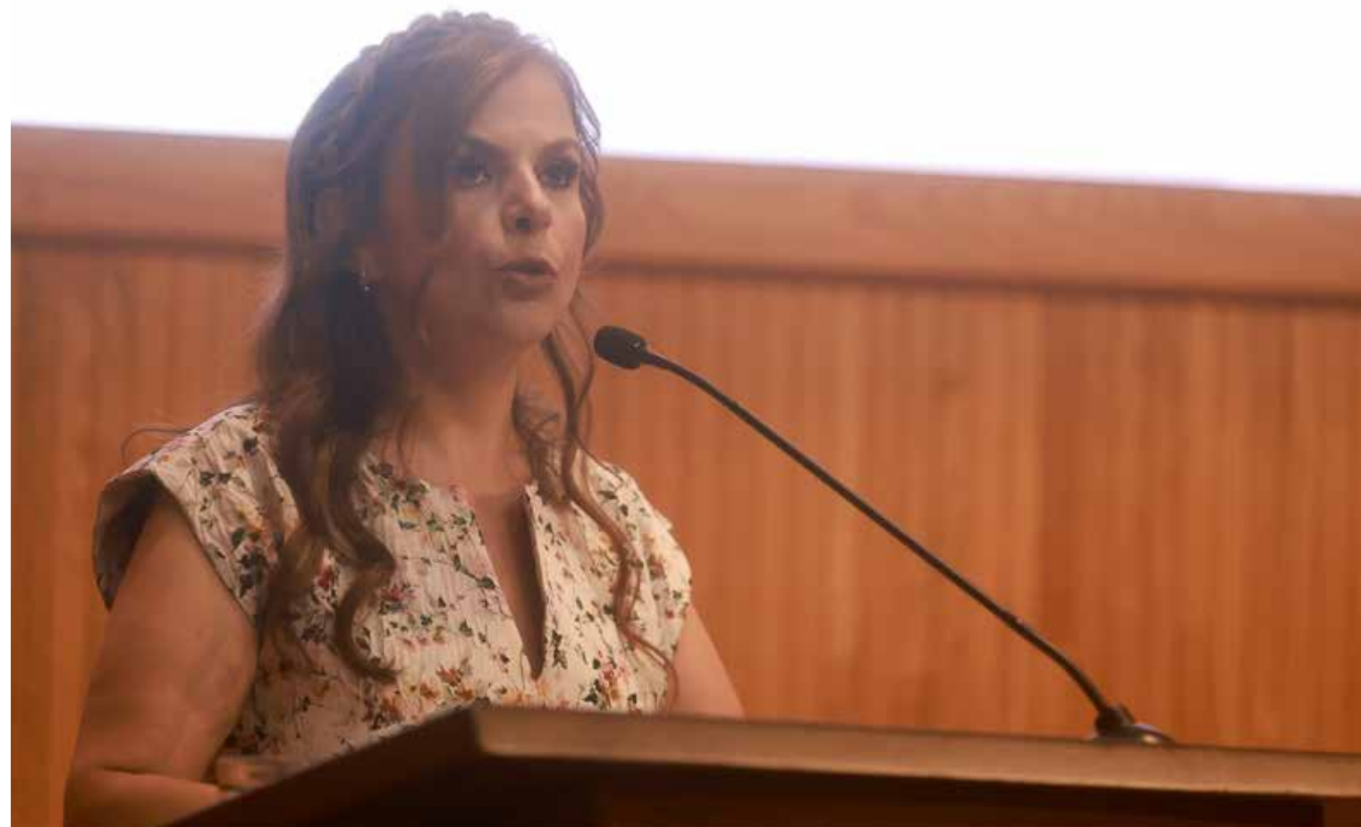
“Este proyecto tiene como propósito construir en toda la red universitaria hospitales-escuela, el mejor modelo de formación y atención a la salud”, destacó Karla Planter durante la presentación de su primer informe como rectora general de la UdeG.

Uno de los principales ejes del informe fue el fortalecimiento de la Red de Hospitales Civiles y Hospitales-Escuela, un proyecto que la Universidad de Guadalajara impulsa en coordinación con el Gobierno de Jalisco y que busca ampliar tanto la cobertura médica como la formación académica de estudiantes del área de la salud en distintas regiones del estado.