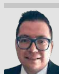
Por | Miguel Anaya