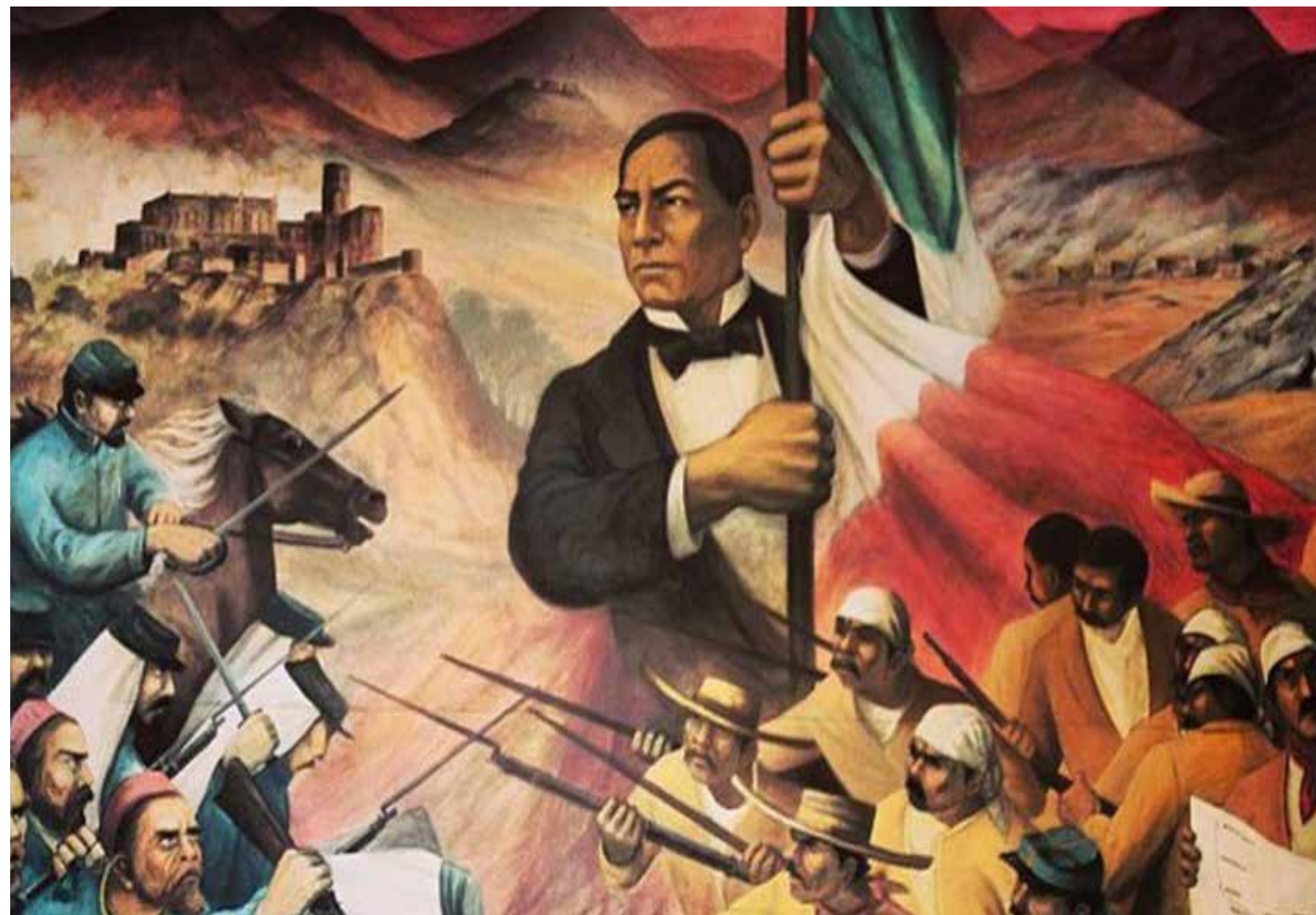
La Batalla de Puebla permanece como uno de los símbolos históricos de soberanía, resistencia y unidad nacional en México.

Sin embargo, la situación que vivimos los mexicanos -y en general el planeta- en la actualidad, cuando el derecho internacional es a cada rato vulnerado y los conflictos de todo tipo ponen en jaque la paz y el progre-