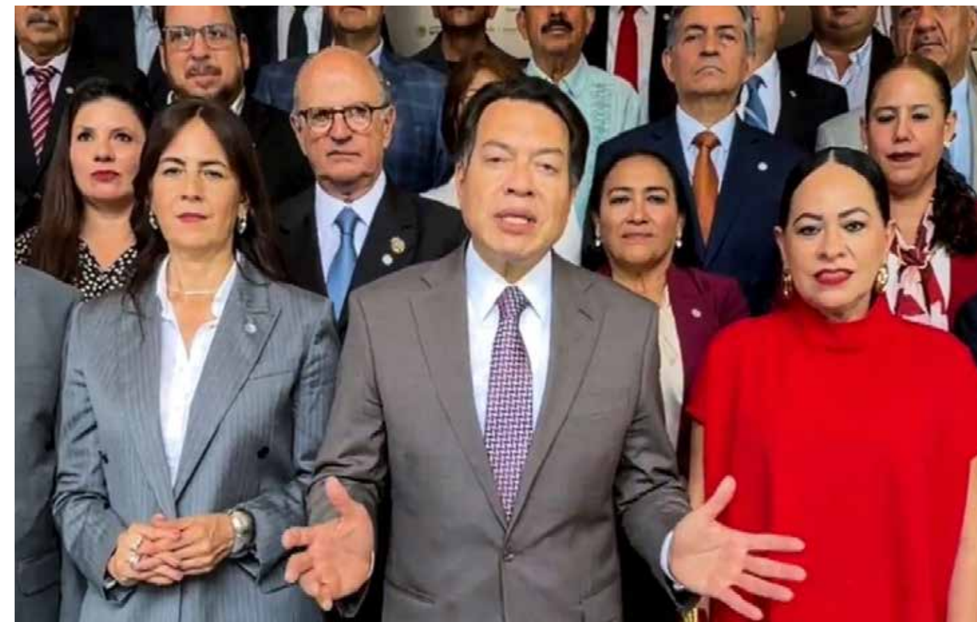
Mario Delgado anunció el adelanto del cierre del ciclo escolar 2025-2026 en medio de críticas por el impacto educativo y social de la medida.