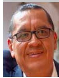
Por | Gerardo Rico