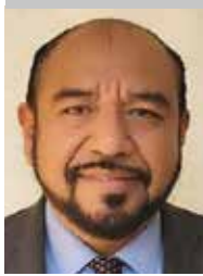
Por | Iván Arrazola Cortés