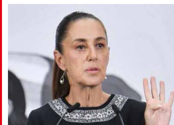
CLAUDIA SHEINBAUM/ PRESIDENTA DE MÉXICO

“Esto lo ha dicho varias veces Trump, no es la primera vez, pero nosotros estamos actuando (...) hemos reducido 50% de homicidios, 2,500 laboratorios deshabilitados, personas detenidas y reducción de paso de fentanilo”.