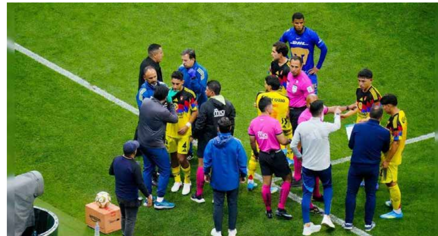
Jugadores, cuerpo arbitral y auxiliares protagonizaron momentos de tensión durante la serie entre América y Pumas, en medio de nuevas polémicas reglamentarias.

En este caso de América - UNAM los "Pumas" protestaron oficialmente ante la FMF, tratándose de los "cremosos" solo sufrieron una fuerte "multa económica",