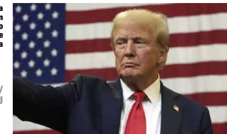
DONALD TRUMP/ PRESIDENTE DE EEUU

“El ingreso de drogas por vía marítima ha disminuido 97%, y ahora hemos puesto en marcha la fuerza terrestre, lo cual es mucho más sencillo. Oírán algunas quejas de gente en México y otros lugares, pero si no van a hacer su trabajo, nosotros lo haremos”.