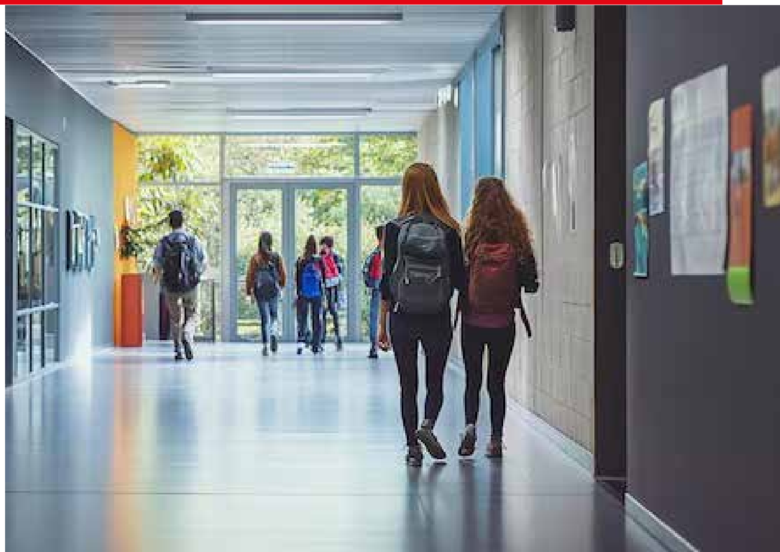
Después de más de dos décadas impartiendo clases, siendo consultor, columnista y mercadólogo, decidí que era momento de escribir sobre un tema que he postergado por mucho tiempo: la importancia de la atención oportuna en la salud mental de los universitarios.

Como bien dice mi comadre “Oly”, la salud mental es “canasta básica”. No podemos ser omisos: ni como padres con