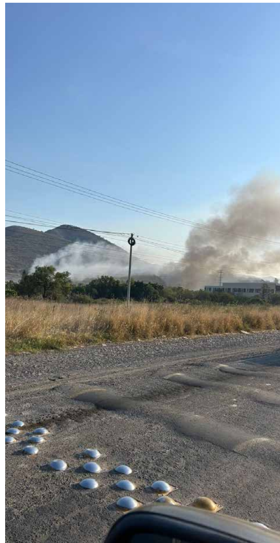
Predio la Rosita, encendido desde hace diez días. Lo usan como vertedero sin permisos pese a que contamina mantos freáticos de Tlajomulco.

Tiempo después, hicieron caso omiso de la clausura y hoy continúa funcionando como vertedero de basura, “le meten de lo que sea, escombros, basura, vienen de otros municipios a tirar basura, carretones de recolección de basura repletos y eso obviamente provoca la contaminación de los mantos freáticos”, dijo un vecino de la zona.