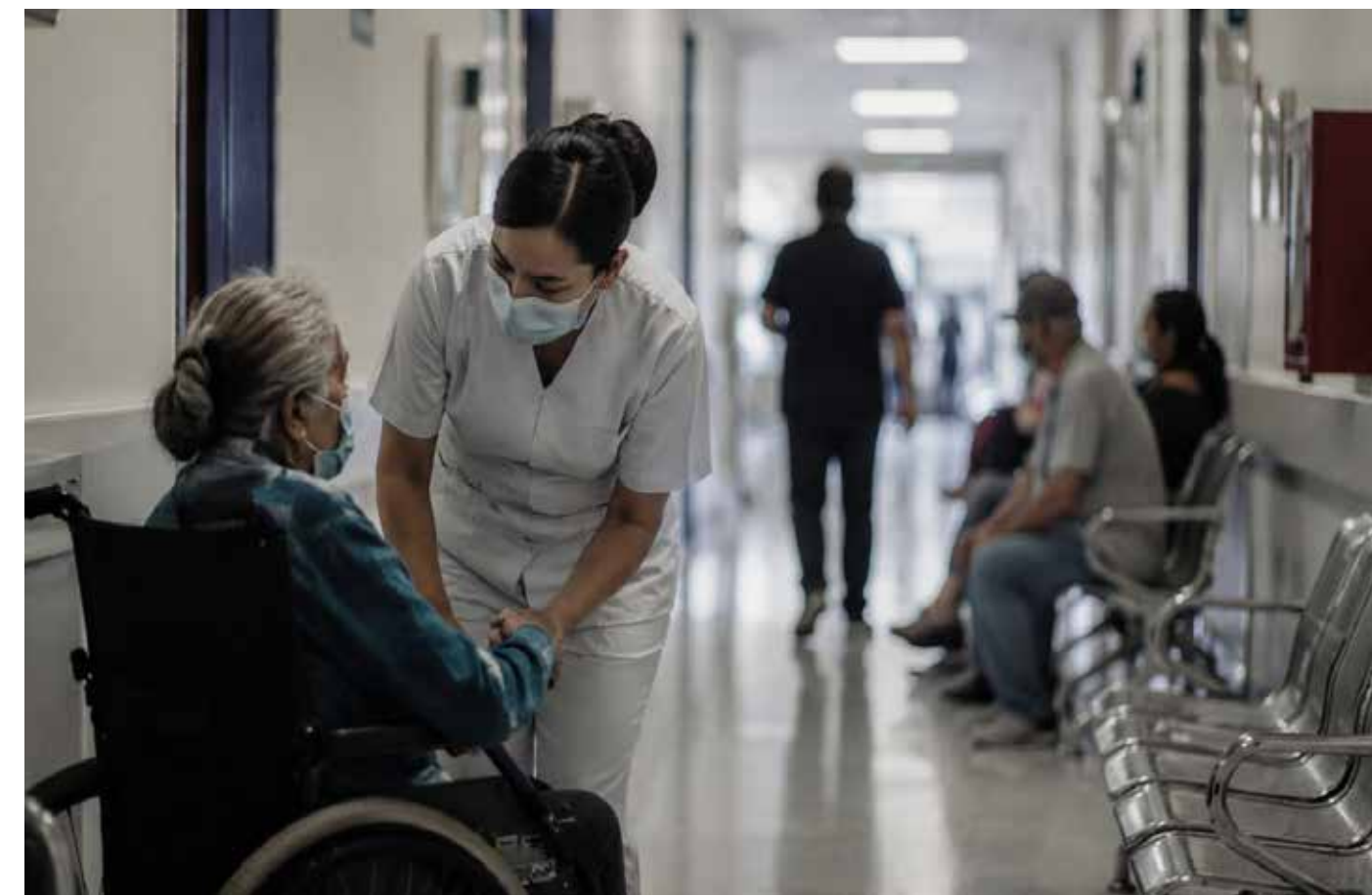
La seguridad social enfrenta desgaste, saturación y retos estructurales, pero sigue siendo la red que sostiene a millones de personas frente a la enfermedad, la vejez y la vulnerabilidad social.

No puede sostenerse únicamente desde el gobierno. Pero tampoco puede abando-