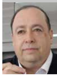
Por Oscar Ábrego