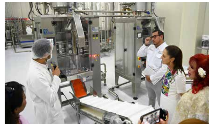
LA PRESIDENTA CLAUDIA SHEINBAUM PARDO inauguró el pasado viernes en Campeche la nueva Planta Pasteurizadora “Leche para el Bienestar”, obra que forma parte del programa que ya cuenta con 11 plantas y una producción de 750 millones de litros en el país.