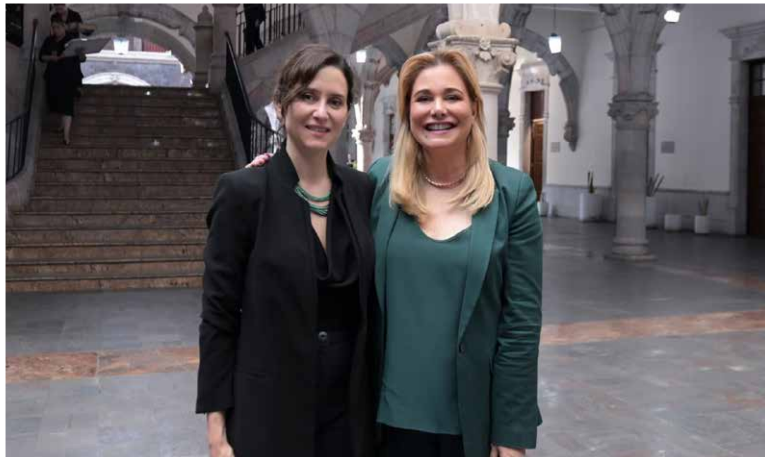
Maru Campos e Isabel Díaz Ayuso, dos figuras políticas marcadas recientemente por la polémica y la confrontación pública.

El segundo asunto sonado, fue el de la “mansión dorada”, consistente en que la casa propiedad de la ahora gobernadora, de 1,800 metros cuadrados y cuyo valor solo del terreno es de 31 millones de pesos, tiene acabados de alto costo, descollando un candil con 400 hojas de oro, mármol traído de distintas partes, obras de arte valoradas en casi un millón de pesos y detalles con equipamientos onerosos. Además, tiene vigilancia permanente de agentes estatales y se