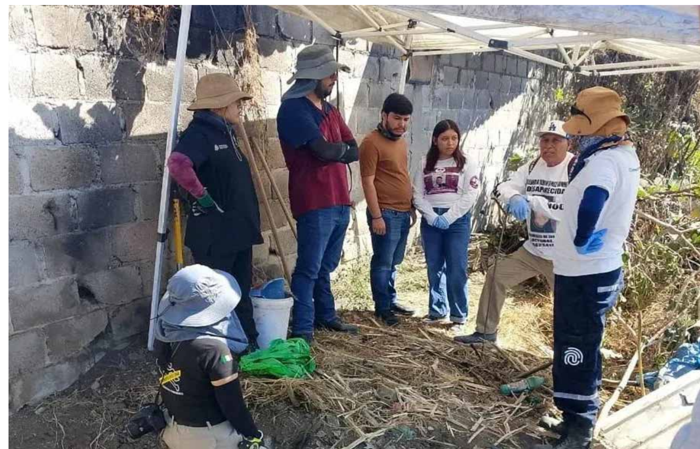
Integrantes de Madres Buscadoras de Jalisco encabezaron las labores de búsqueda en Las Pintitas, convertido ya en uno de los símbolos recientes de la crisis de desapariciones en el estado.

Debemos saber que, el sábado 25 de abril, el colectivo Madres Buscadoras —ese cuerpo civil al que la desgracia obligó a hacer de policía, de perito y de sepulturero— halló otra fosa clandestina.