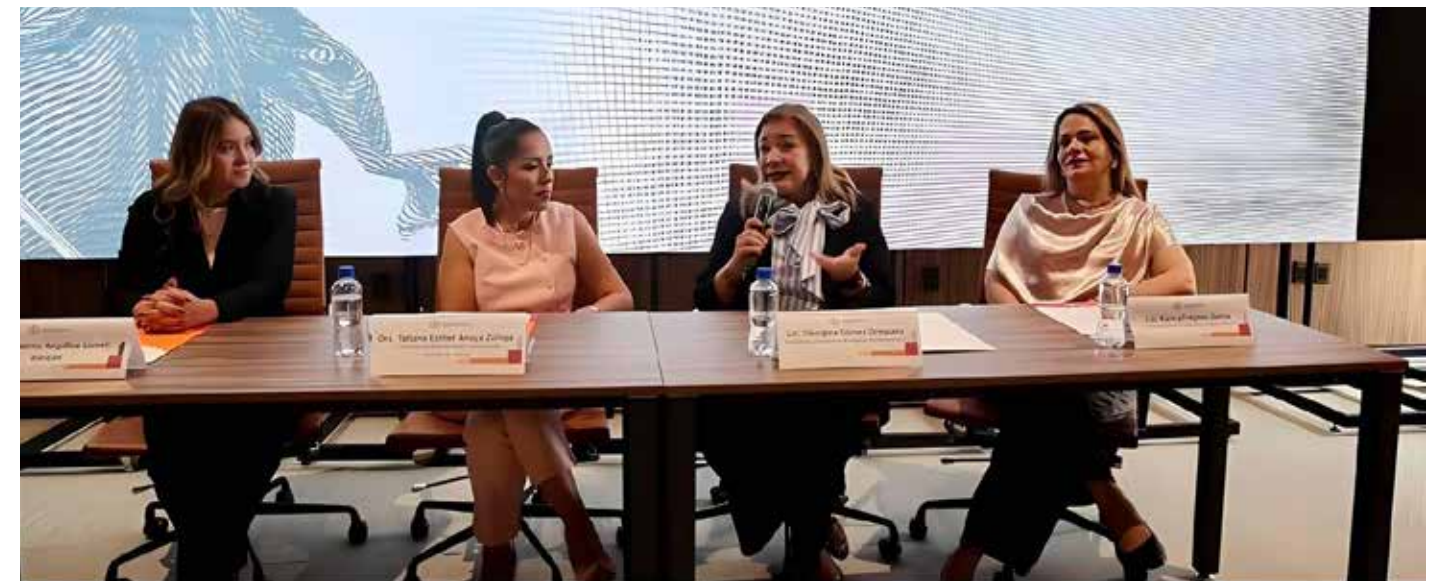
Especialistas del Poder Judicial y del Gobierno de Jalisco participaron en el seminario "Construyendo tu legado", enfocado en prevención de fraudes y protección patrimonial para empresarias.

entre las asistentes fue el relacionado con el phishing y la suplantación de identidad. La jueza detalló cómo delincuentes utilizan mensajes falsos, aparentando ser instituciones bancarias o proveedores de servicios, para obtener contraseñas, accesos remotos o datos financieros sensibles.