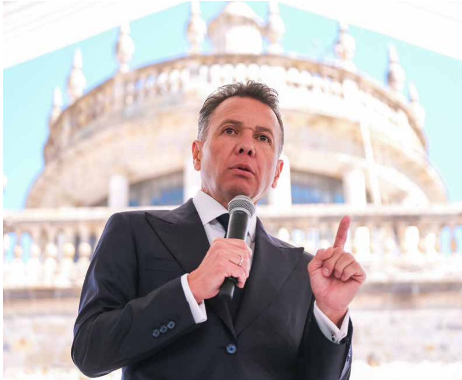
Pablo Lemus es la clave para una posible alianza anti-Morena en Jalisco 2027. Deberá convencer a Dante Delgado —principal opositor a pactar con el PRI y señalado por su cercanía a Morena— y a Jorge Máynez. El éxito dependerá de su capacidad para construir acuerdos en la dirigencia nacional de MC