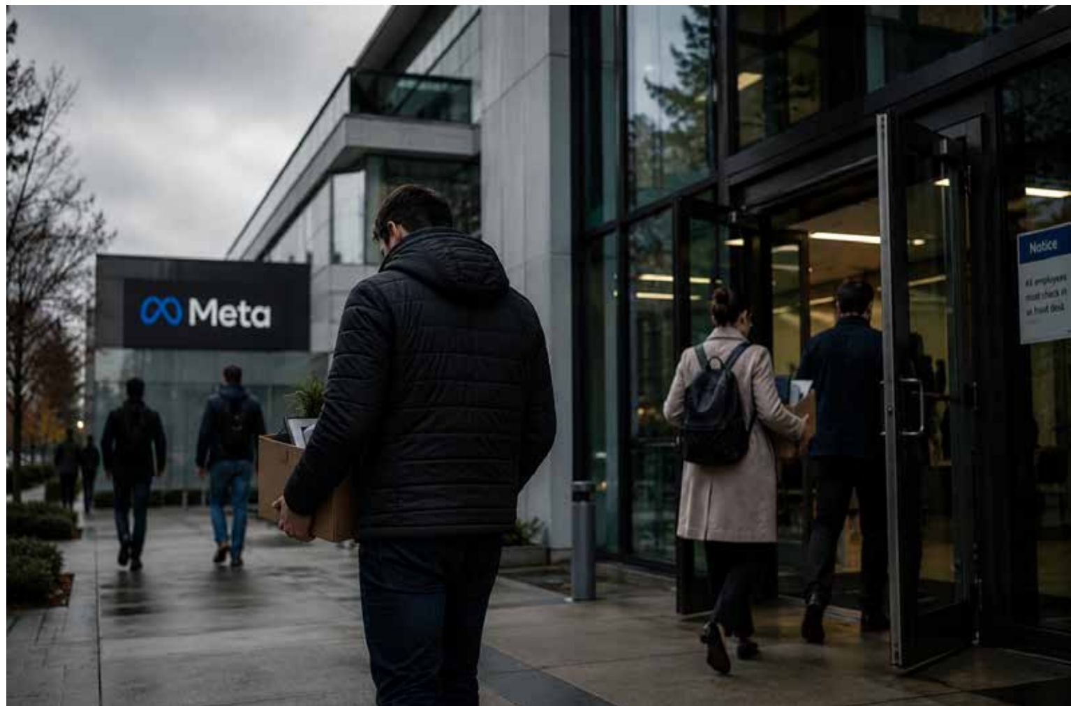
Los despidos masivos en las grandes tecnológicas reflejan la transición acelerada hacia modelos de negocio centrados en inteligencia artificial y automatización.

ejecutivos tecnológicos para justificar estos despidos masivos ha sido, casi sin excepción, la inteligencia artificial. Mark Zuckerberg, consejero delegado de Meta, declaró en enero de 2026 que “2026 será el año en que la IA comience a cambiar fundamentalmente la forma en que trabajamos”. Desde entonces, la compañía ha ido recortando posiciones en varias oleadas. Sin embargo, atribuir exclusivamente a la IA esta vorágine de despidos sería simplificar en exceso una realidad mucho más compleja (nasdaq.com).