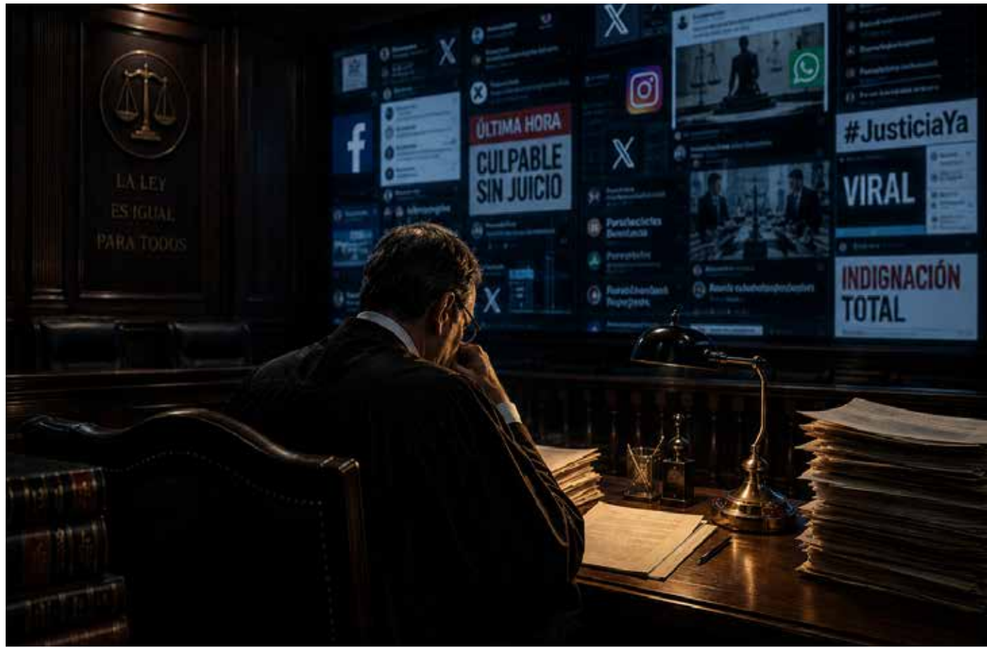
La inteligencia artificial y las redes sociales han transformado la manera en que se construyen las percepciones públicas sobre la justicia y la verdad.

Y ahí aparece una pregunta incómoda: ¿qué pasa cuando empezamos a delegar decisiones humanas a sistemas que ni siquiera