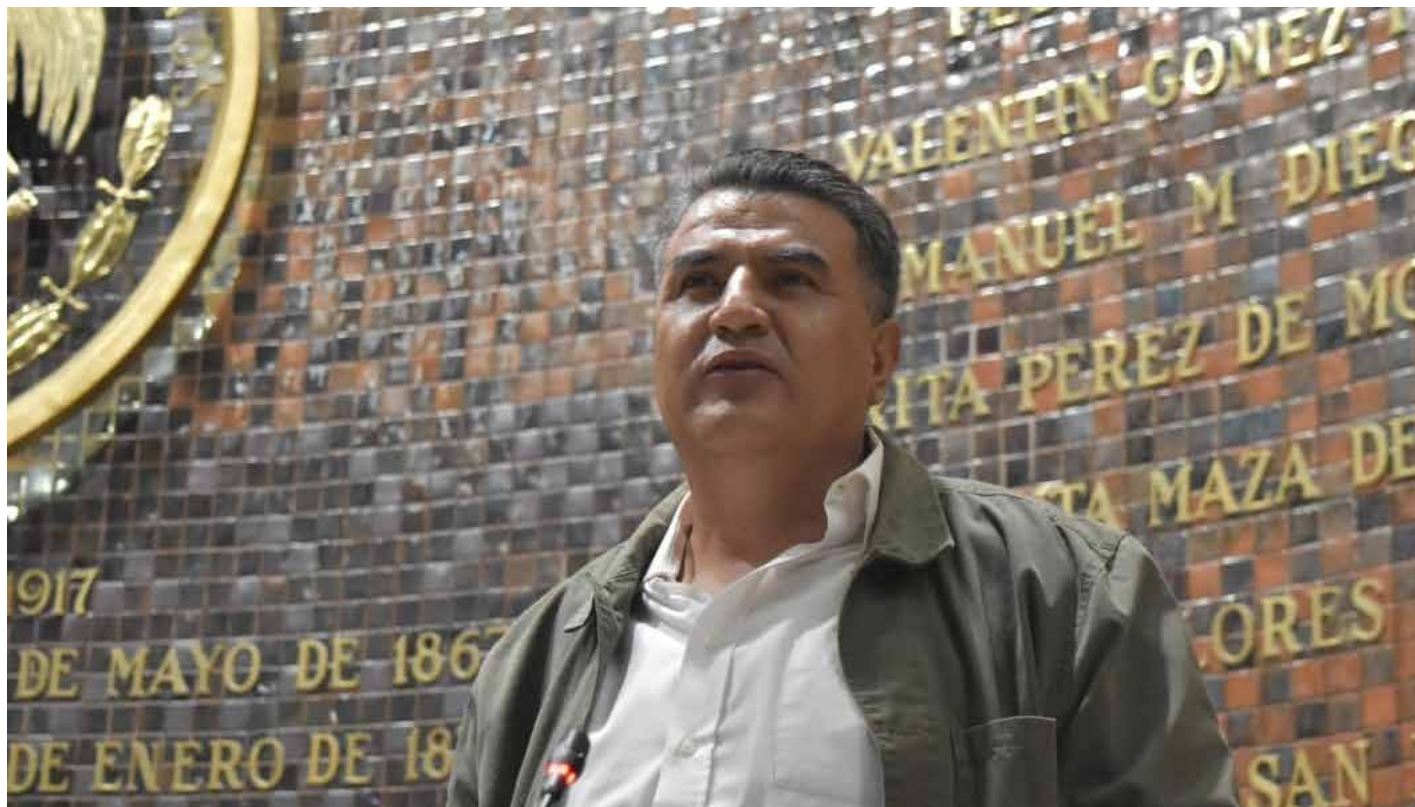
El coordinador de la fracción de Morena en el Congreso del Estado refiere la traición de diputados del PVEM al votar en el Congreso del Estado con Movimiento Ciudadano, recordándoles que llegaron con los votos de los ciudadanos que les dio por la coalición con Morena.