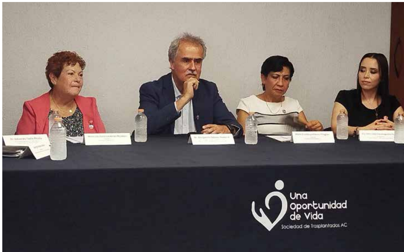
Integrantes de asociaciones civiles, especialistas y activistas participaron en una rueda de prensa para alertar sobre el crecimiento de las enfermedades renales en Jalisco.

De ahí que lanzaron un llamado para revisar las políticas públicas en salud renal, para consolidar acciones de estructuras eficientes y expusieron: “Las asociaciones civiles no podemos combatir este gran problema, si no nos sumamos con la autoridad, empresas y sociedad civil; pedimos que retomen la modificación de la ley sobre La donación de Órganos en 2013, donde se dice que se consolida el consentimiento