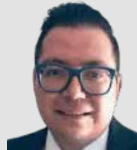
Por | Miguel Anaya