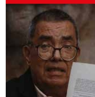
>RAÚL MUÑOZ/ Critican construcción de plantas de trata- miento en Río Santiago.

Aunque se dice que Jalisco es un bastión impenetrable para Morena, el gobernador Pablo Lemus no se confía. Consciente del desgaste de su partido, convocó a la dirigencia naranja y a sus cuadros en el gobierno para apretar tuercas, cerrar filas y superar las divisiones entre “alfaristas” y “lemusistas”. El objetivo es claro: evitar una sorpresa desagradable en 2027. El resultado: la designación de comisiones políticas en municipios y distritos para mantener el control del territorio. Vamos a ver si esa unidad tan complicada en estos tiempos con Lemus de líder se logra.