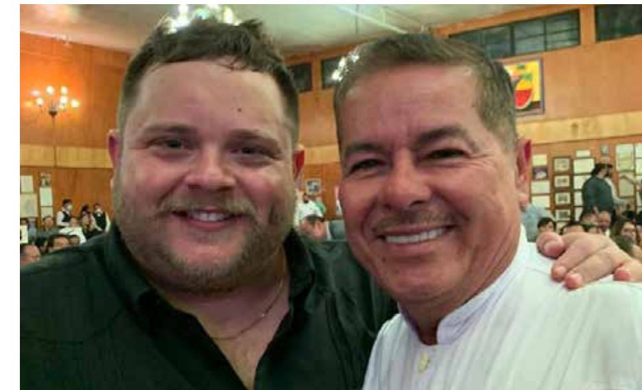
Con Rodrigo de la Cadena, cantante, pianista, compositor y productor mexicano.

GIB: ¿Cuáles son tus canciones favoritas para interpretar?