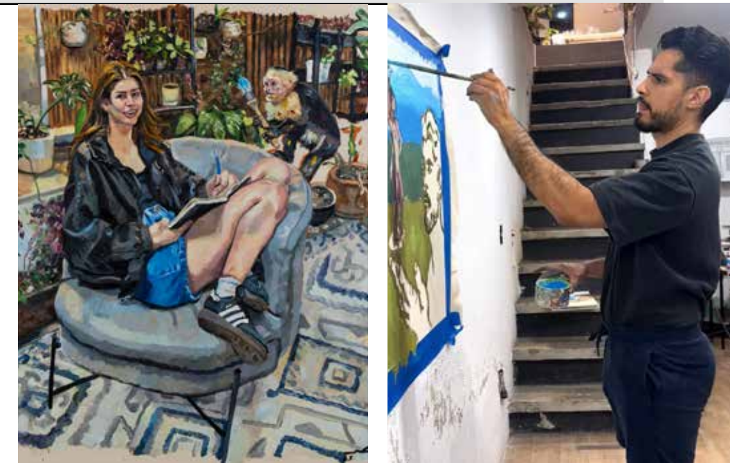
La pintura de David Becerra es de fuerte carga expresionista, dialoga abiertamente con la tradición y la contemporaneidad a través de la textura y la figura humana.

“Estudio obras, tomo lo que me gusta y lo aplico. Mantengo curiosidad y humildad de alumno. Creo que el arte requiere una actitud casi infantil de libertad y pincelada suelta”