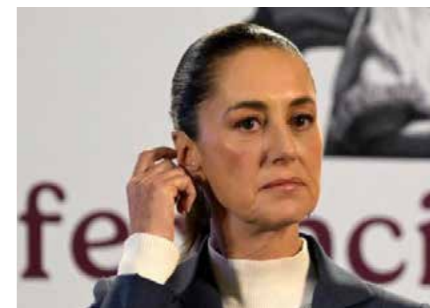
CLAUDIA SHEINBAUM/ PRESIDENTA DE MÉXICO

“ Tuve una cordial y excelente conversación con el presidente Trump, reafirmamos el trabajo que estamos haciendo en seguridad y las pláticas sobre comercio. Acordamos hablar nuevamente y continuar el diálogo con algunos de sus colaboradores que, en fecha próxima, visitarán nuestro país”.