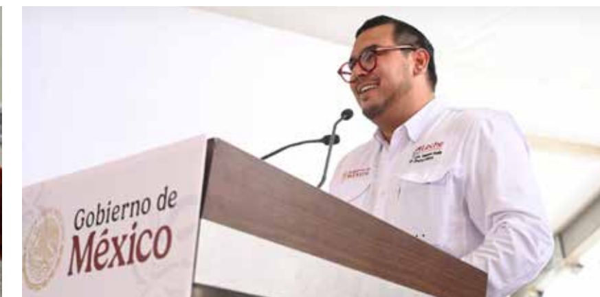
EL DIRECTOR GENERAL DE LECHE PARA EL BIENESTAR, Antonio Talamantes Geraldo, durante la inauguración de la nueva Planta Pasteurizadora “Leche para el Bienestar”, ubicada en el Parque Bicentenario de San Francisco, Campeche, que operará con tecnología de última generación y suministrará leche fortificada a más de 200 mil derechohabientes en Campeche, Yucatán y Quintana Roo.