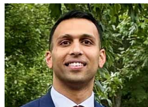
AAKASH SINGH/ SUBPROCURADOR GENERAL ADJUNTO DE JUSTICIA DEL GOBIERNO DE EEUU

“ Debemos triplicar el número de acusaciones contra funcionarios gubernamentales corruptos en México que utilizan su poder y sus cargos para encubrir a terroristas y monstruos que trafican con miseria y veneno”, dijo en una llamada a 99 fiscales federales de EU.