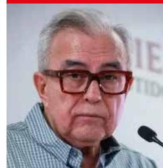
>RUBÉN ROCHA MOYA/ ¿Hasta dónde llegará la FGR? ¿Lo detendrán o lo exonerarán?

El diputado Alberto Maldonado reafirma su compromiso inquebrantable con los sectores vulnerables al presentar, ante el pleno de la Comisión Permanente del Congreso de la Unión, un enérgico llamado de atención por el cierre del Tribunal Agrario No. 15 de Guadalajara.