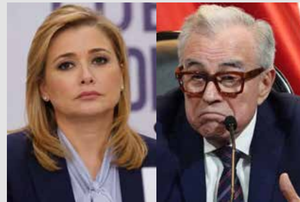
MARU CAMPOS/ GOBERNADORA DE CHIHUAHUA (PAN)

Hoy, en horas de la mañana, recibí citatorio para comparecer ante la Fiscalía General de la República. Le digo a las y los sinaloenses, a las y los integrantes de nuestro movimiento de transformación, a nuestra líder y Jefa del Estado mexicano: soy un hombre probo y que no tiene nada que temer (...)