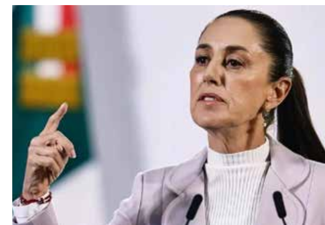
PRESIDENTA CLAUDIA SHEINBAUM/ PRESIDENTA DE MÉXICO

La relación es reciproca, hay casos gravísimos para México. No hay entrega de ninguno de estos presuntos delincuentes a México (...)