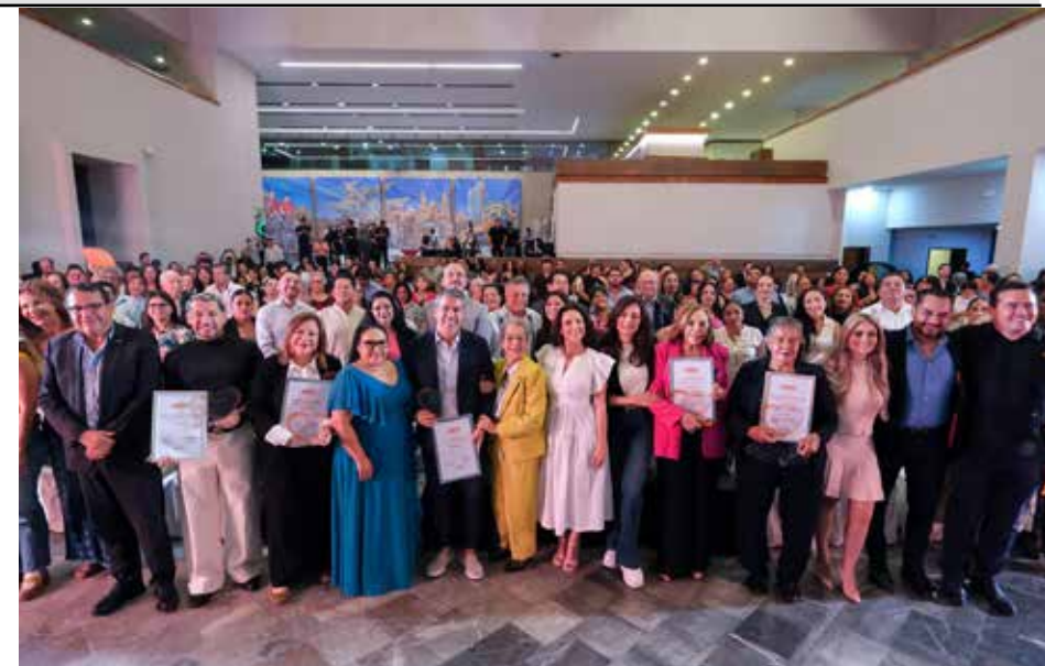
Aquí la foto del recuerdo después de la entrega del reconocimiento “De Corazón Naranja”, organizada por la Fundación México con Valores en Jalisco, realizado en el patio central de la Cámara de Comercio de Guadalajara.