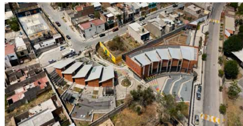
Con esta apertura, Zapopan suma ya cinco Colmenas dentro de su red comunitaria, además de diversos espacios públicos rehabilitados y denominados “Enjambres”.