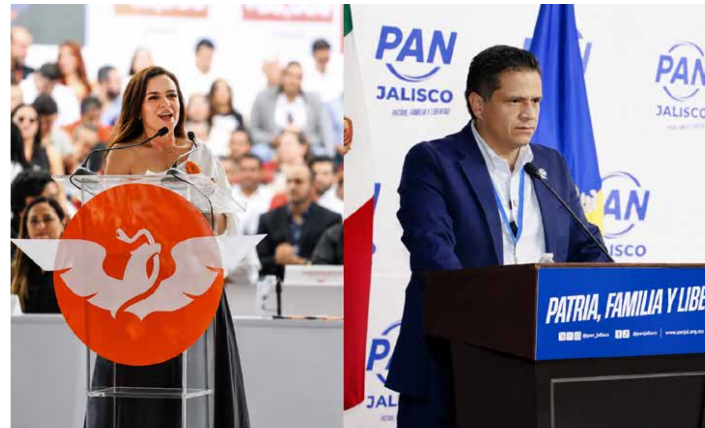
La batalla por Jalisco ya comenzó entre partidos que hoy se niegan públicamente cualquier alianza.