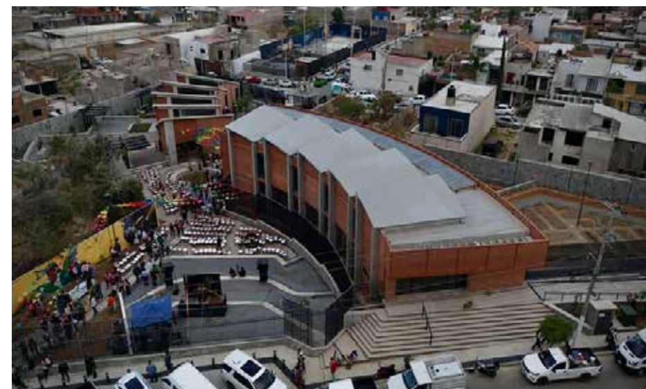
Las colmenas permiten la convivencia vecinal y recuperar el sentido de comunidad.