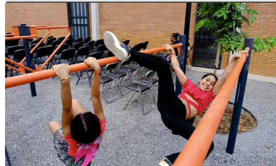
Niños, jóvenes y adultos pueden participar en las diversas actividades que se realizan en las colmenas.

La Colmena El Centinela contará con aulas de usos múltiples, consultorios, ludoteca, talleres de oficios, comedor comunitario, área de cómputo, espacios para música, huertos urbanos y zonas de activación física al aire libre. La apuesta es que el recinto funcione como un centro de convivencia permanente y accesible para toda la comunidad.