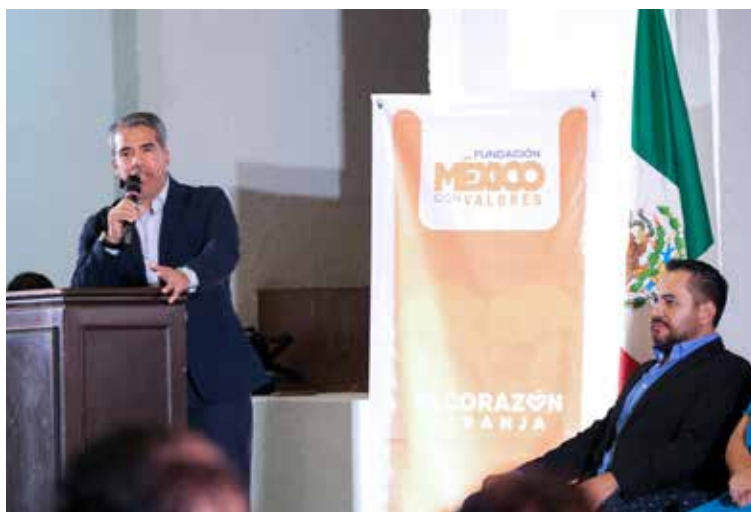
El ex futbolista jalisciense Pavel Pardo recibió el galardón y habló menos de títulos y más de valores y recibió la gran ovación de la noche.