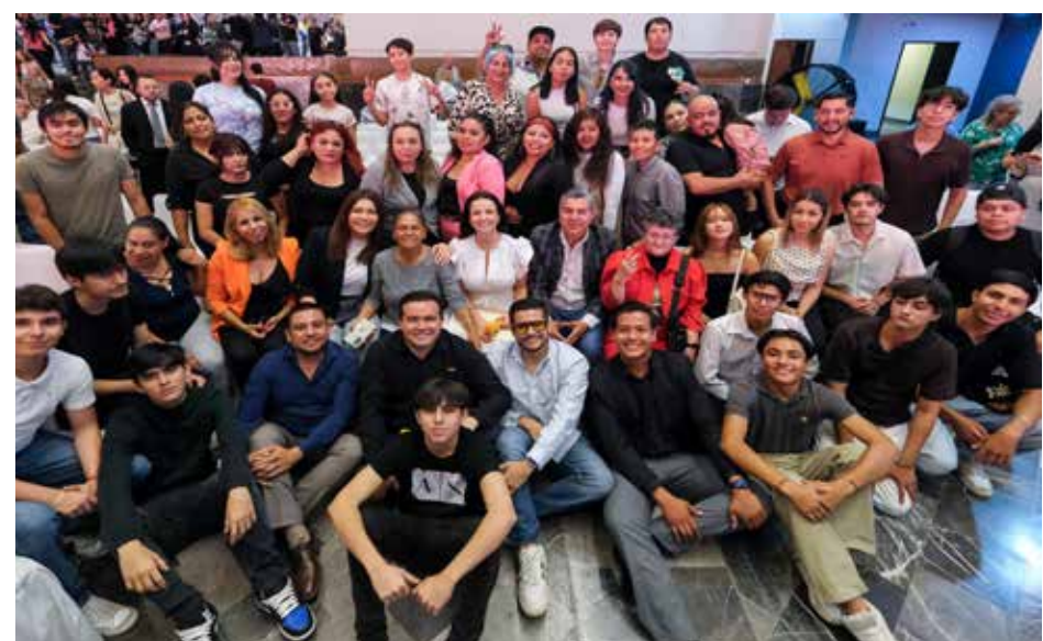
Ambiente emotivo y cercano en el salón: líderes políticos, activistas, empresarios y vecinos de colonias populares compartieron abrazos, lágrimas y orgullo familiar durante la emotiva ceremonia de reconocimientos.

“Las grandes transformaciones no siempre comienzan en los grandes escenarios. Muchas veces comienzan en silencio, en una colonia, en una cancha, en una pequeña