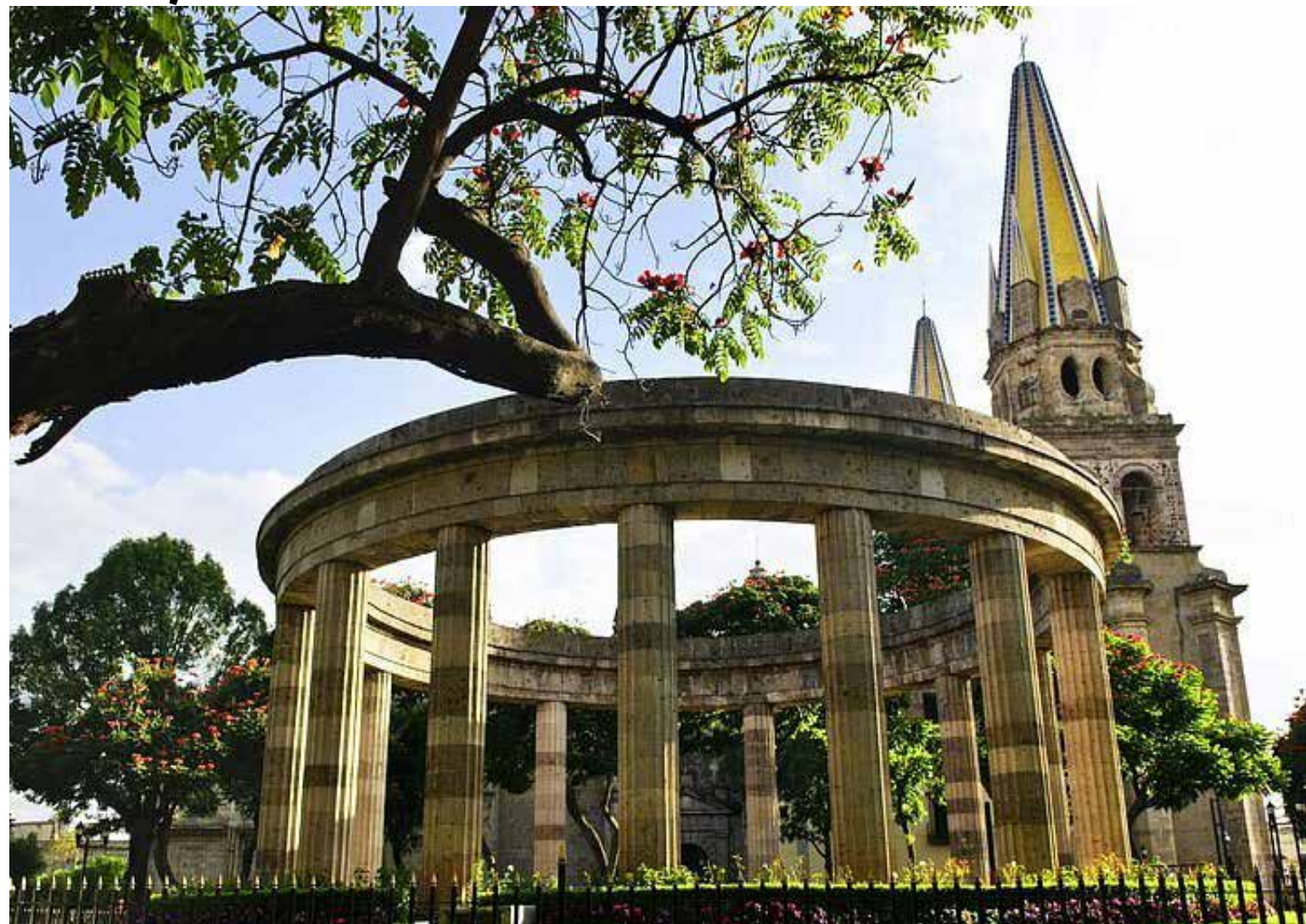
La Rotonda de los Jaliscienses Ilustres resguarda la memoria de personajes que marcaron la historia cultural, artística y patriótica de Jalisco.

Ahora pasemos a la heroicidad. El 23 de mayo recordamos el sacrificio -en 1812- de Don José Antonio "el Amo" Torres, libertador de Nueva Galicia tras su esplendoroso