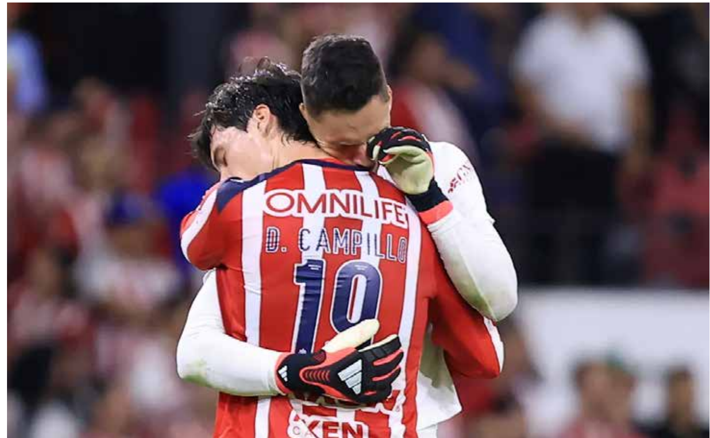
La eliminación rojiblanca dejó imágenes de frustración tras un torneo marcado por la polémica y el desgaste competitivo.

La exageración que se deservían en elogios para UNAM que hicieron los mismos puntos que el "Chiverío" y lo tienen como