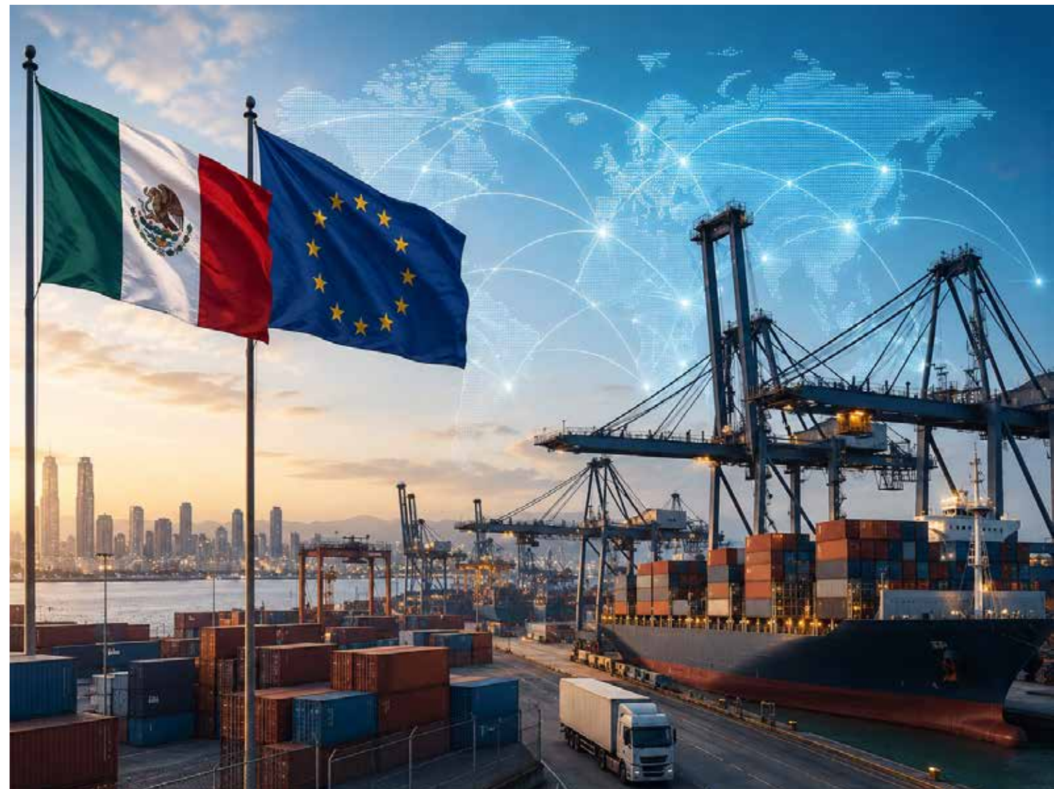
El nuevo acuerdo entre México y la Unión Europea busca fortalecer cadenas comerciales y reducir la dependencia frente al proteccionismo global.

Esta infraestructura legal ha sido la columna vertebral de su modelo de desarrollo orientado a la exportación, posicionándolo