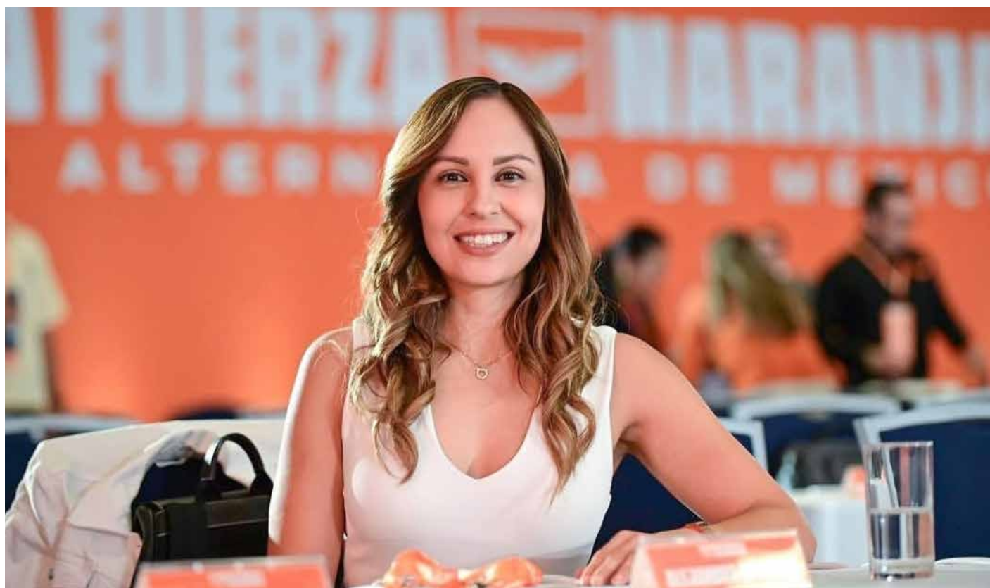
La diputada Alejandra Giadans, presidenta de la Comisión de Movilidad y Transporte del Congreso del Estado, impulsa la iniciativa "Cero sustancias al volante" para incorporar pruebas de detección de drogas en los operativos Salvando Vidas en Jalisco.

"Va a ser en caso de que las personas que operan el dispositivo vean que es necesario, ya sea por la actitud, por la agresividad o por el estado de ánimo de la persona. Primero se le hace la prueba de alcohol y posteriormente la