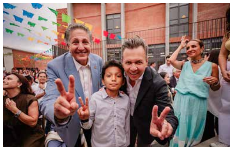
El gobernador Pablo Lemus, fue el que inició en Zapopan el modelo de las colmenas para aminorar la desigualdad en las zonas con grandes carencias en todos los órdenes y al hacer uso de la palabra, dijo que se han construido en Jalisco 11 colmenas, considerando la de El Centinela, de las cuales 5 en Zapopan y 6 en Guadalajara.