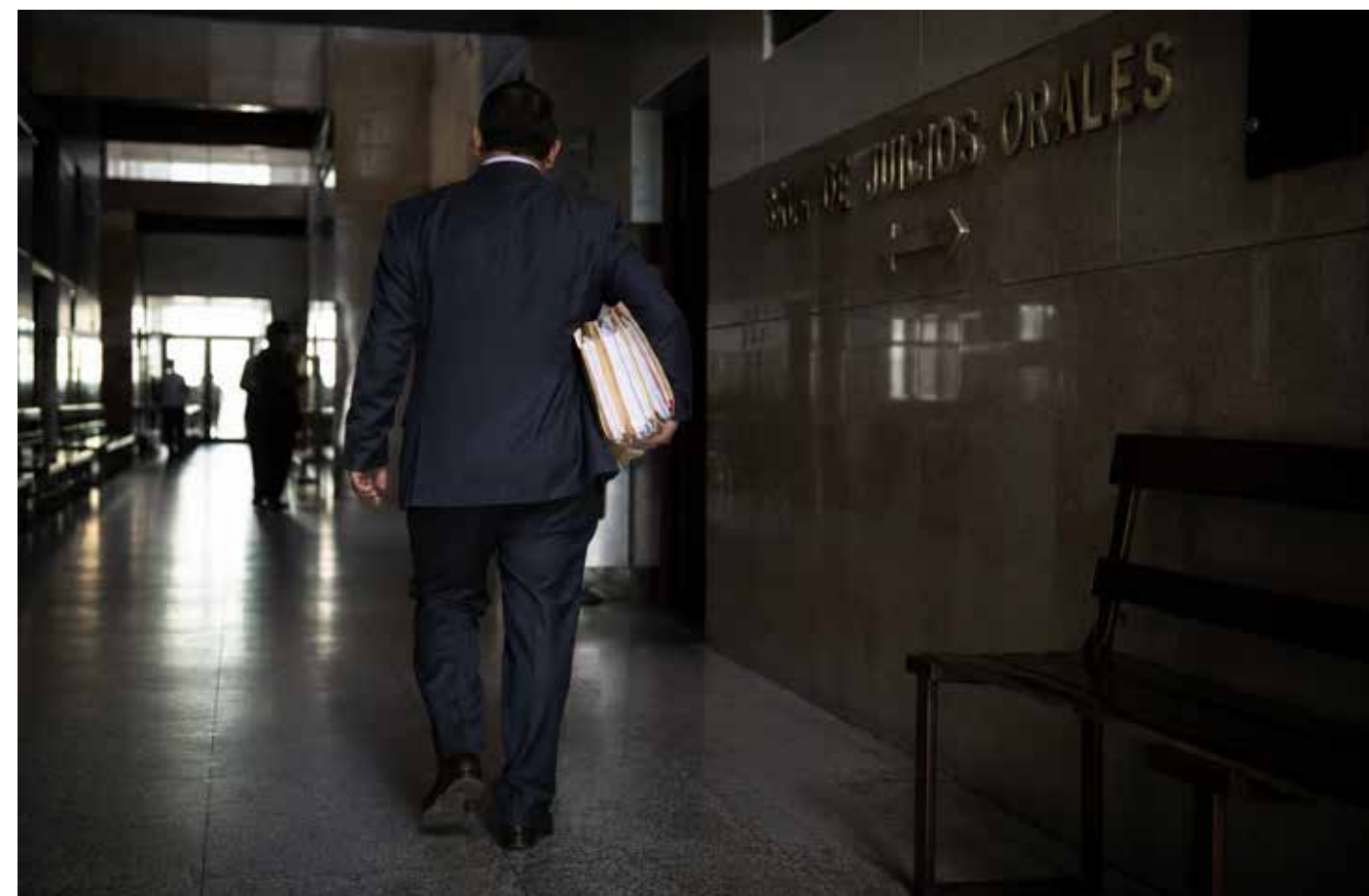
Detrás de cada expediente existe una carga humana que rara vez alcanza a verse dentro del sistema de justicia.

Un expediente no avanza solo porque exista una sentencia al final del camino. Avanza porque existe una enorme cadena