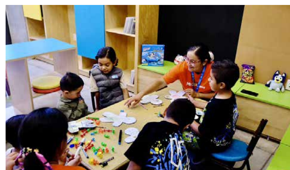
Son muy diversas las actividades que se pueden realizar en una colmena con talleres, actividades culturales, espacios deportivos, capacitación para el empleo y servicios comunitarios dirigidos a personas de todas las edades.