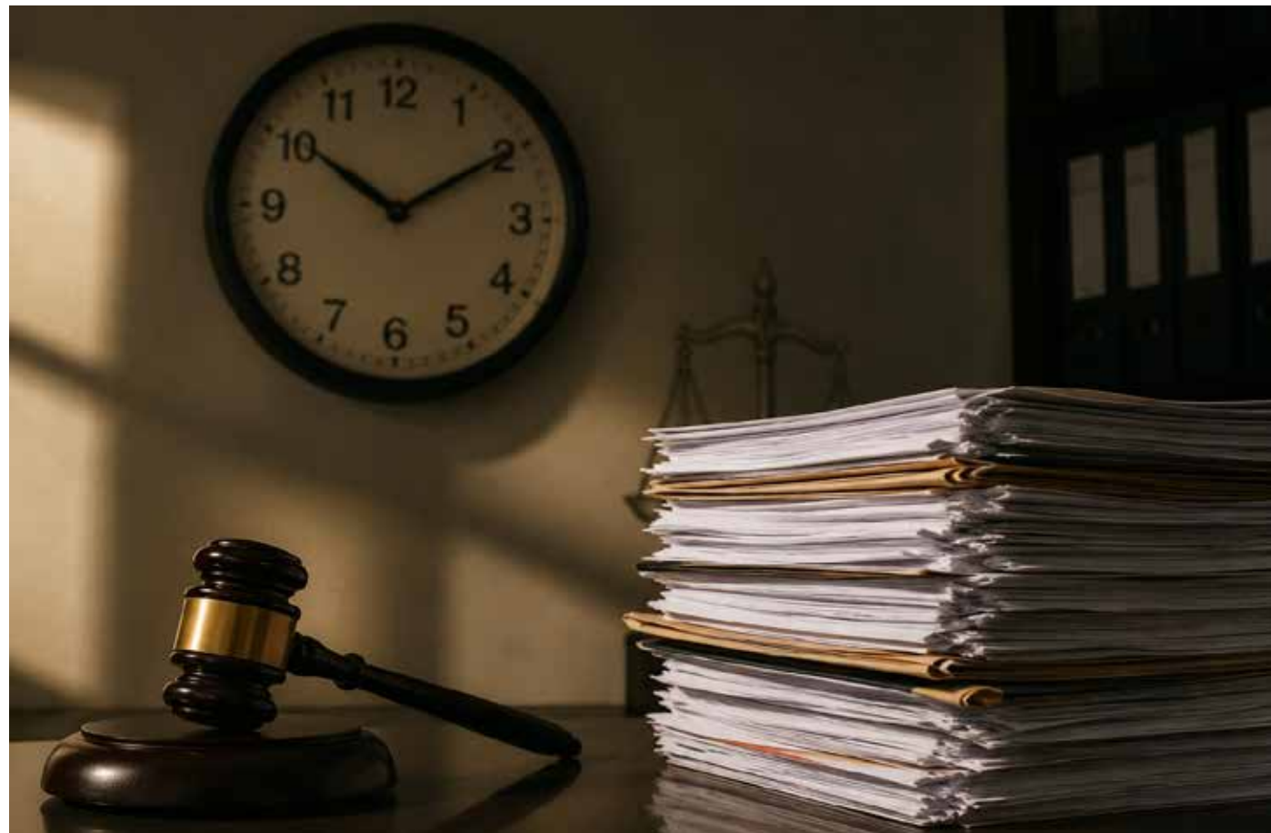
La nueva reforma al procedimiento contencioso administrativo apuesta por acelerar la resolución de conflictos y fortalecer la eficacia institucional.

Durante mucho tiempo, la discusión jurídica mexicana se concentró en los límites del poder público, la cual sigue siendo una preocupación legítima, sobre todo cuando recordaremos que la historia demuestra que