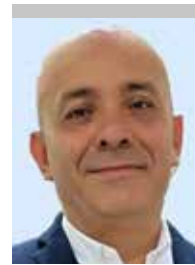
Por | Rocco Palomera