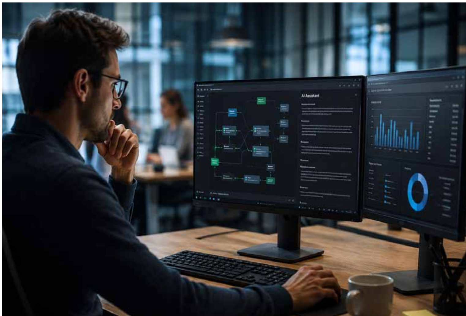
La IA está transformando el mercado laboral, pero la creatividad, el juicio crítico y la capacidad de relacionarse siguen siendo ventajas exclusivamente humanas.

Más allá de los títulos universitarios o los oficios específicos, los profesionistas que logren navegar con éxito la transformación en curso serán aquellos que cultiven un conjunto de habilidades duras y blandas que las máquinas, al menos por ahora, no pueden replicar. El Foro Económico Mundial, en su Future of Jobs Report