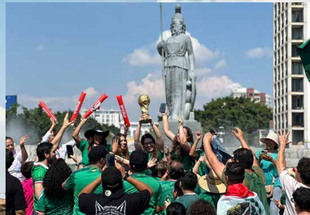
Los aficionados mexicanos celebrando la victoria en las inmediaciones de la Minerva.