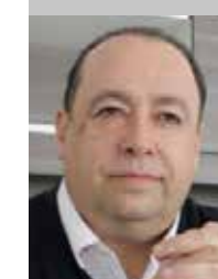
Por Oscar Abrego