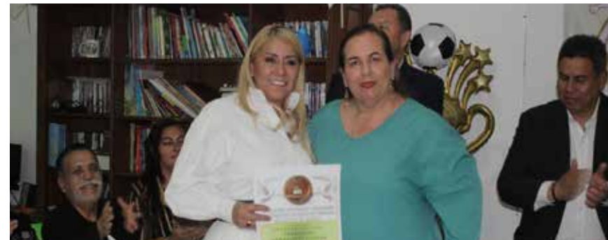
TITULAR DE LA COMISIÓN EJECUTIVA ESTATAL DE ATENCIÓN a Víctimas de Jalisco (CEEAVJ), reconocida por su compromiso con la atención y acompañamiento de personas víctimas de delitos y violaciones a derechos humanos, particularmente en casos relacionados con desapariciones.