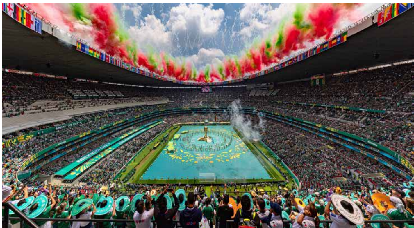
La inauguración del Mundial 2026 convirtió al Estadio Azteca en una vitrina de la identidad mexicana ante millones de espectadores alrededor del mundo.

Ahora bien, en el mundial del balompié que nos ocupa, las fuerzas que se agitan en la República, marchan, protestan y formulan exigencias a la 4T (los maestros de la CNTE, las madres buscadoras de hijos desaparecidos, supuestos representantes de la sociedad civil que con la iniciativa "Saca el Pañuelo Blanco" buscan exhibir internacionalmente al gobierno federal y ciertos grupos de universitarios inconformes con el trato que reciben, etc.) o de plano, los miembros de las oposiciones que dicen sufrir persecuciones y padecer dizeq presiones a su libre expresión, aprovechan el magno torneo futbolístico para lograr respuestas o simplemente exhibir al lopezobradorismo