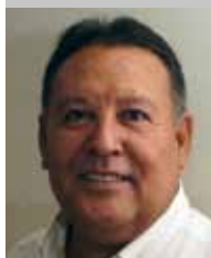
Por Jesús Alberto Rubio