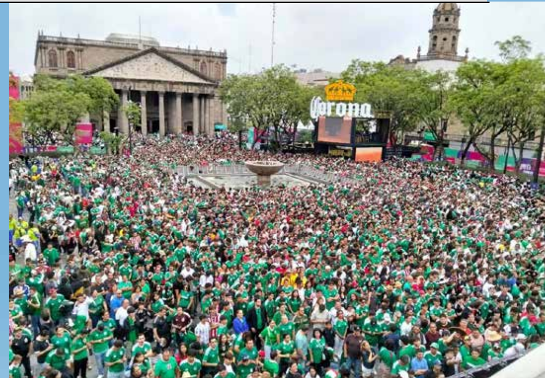
Los edificios históricos del Centro de Guadalajara se iluminaron con los colores nacionales durante la inauguración mundialista.

Si algo dejó claro el arranque de la Copa del Mundo es que la afición tapatía está lista para asumir su papel como anfitriona. Las largas filas, las plazas repletas, las celebraciones en la Minerva y las calles teñidas de verde fueron apenas una muestra de lo que está por venir. El Mundial ya comenzó, y Guadalajara parece dispuesta a vivirlo hasta el último minuto.