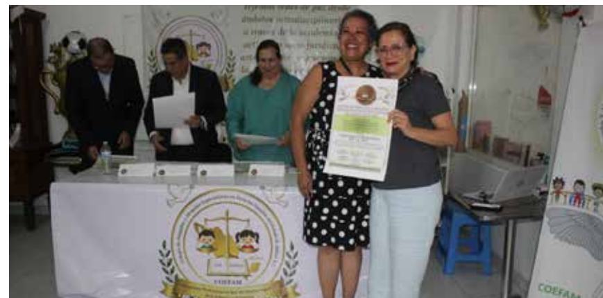
PRESIDENTA DE VÍCTIMAS DE VIOLENCIA VIAL A.C., reconocida por su activismo en la defensa de los derechos humanos y su trabajo para prevenir y erradicar las violencias viales. Su labor ha dado voz a las víctimas y a sus familias bajo la convicción de que "tu voz es la de quienes ya no están".