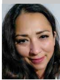
Por | Mónica Ortiz