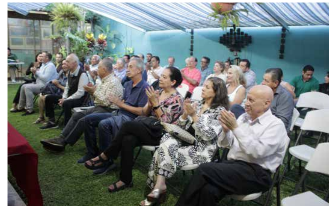
Decenas de amigos presenciaron la presentación del libro Culpa Fabricada , la verdadera historia de una trampa y de un hombre que luchó contra ella, para quien el llamado “sueño americano” se convirtió en la gran pesadilla de su vida.

Hoy comparto esta historia con humildad, pero también con la frente en alto. No me avergüenzo de nada, porque siempre actué defendiendo a mi empresa, a mi jefe y a mis principios. Que Dios los bendiga a todos. Muchas gracias”.