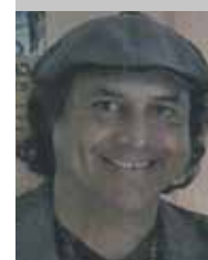
Por Esteban Trelles Meza