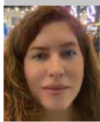
Por | Violeta Moreno Haro