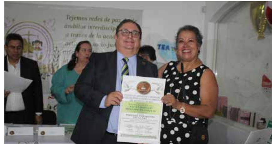
SECRETARIO TÉCNICO DEL INSTITUTO DE JUSTICIA ALTERNATIVA, distinguido por impulsar desde el servicio público la cultura de paz, la unidad familiar y la prevención de conflictos mediante el diálogo y los mecanismos alternativos de solución de controversias.