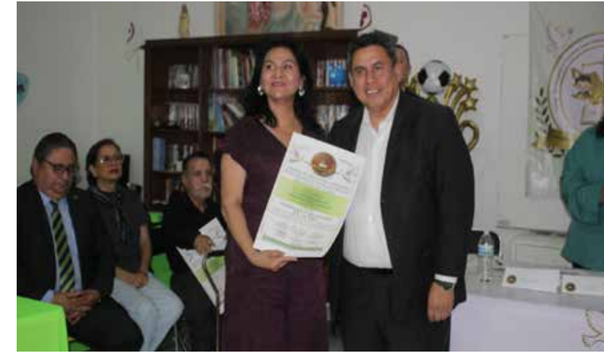
DIRECTORA DE MEDIOS ALTERNATIVOS de Solución de Controversias y Validación del Instituto de Justicia Alternativa, reconocida por promover métodos de resolución pacífica de conflictos sustentados en la empatía, la dignidad humana y la armonía social.