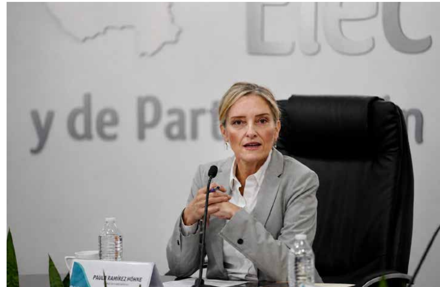
La salida de la presidenta del IEPC abre una nueva etapa para la autoridad electoral jalisciense en vísperas de uno de los procesos más relevantes de los últimos años.

Pero el PREP fue solo la punta del iceberg. Lo que vino después es más grave porque involucra la integridad misma de los votos. Los paquetes electorales fueron trasladados en condiciones que no resisten el más elemental análisis de cadena de custodia. Hay señalamientos documentados sobre rupturas en ese eslabón fundamental del proceso. Las inconsistencias estadísticas entre los resultados de elecciones federales y locales nunca fueron explicadas con suficiencia por la autoridad. Y para rematar el cuadro, se cuestionó la designación de funcionarios electorales en órganos distritales y municipales: en más de