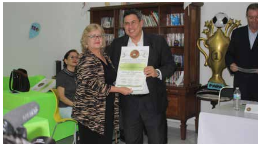
RECONOCIDA POR SU TRAYECTORIA PROFESIONAL y por convertirse en la primera mujer en presidir un colegio de abogacía en Jalisco, abriendo camino para nuevas generaciones de mujeres en el ámbito jurídico.