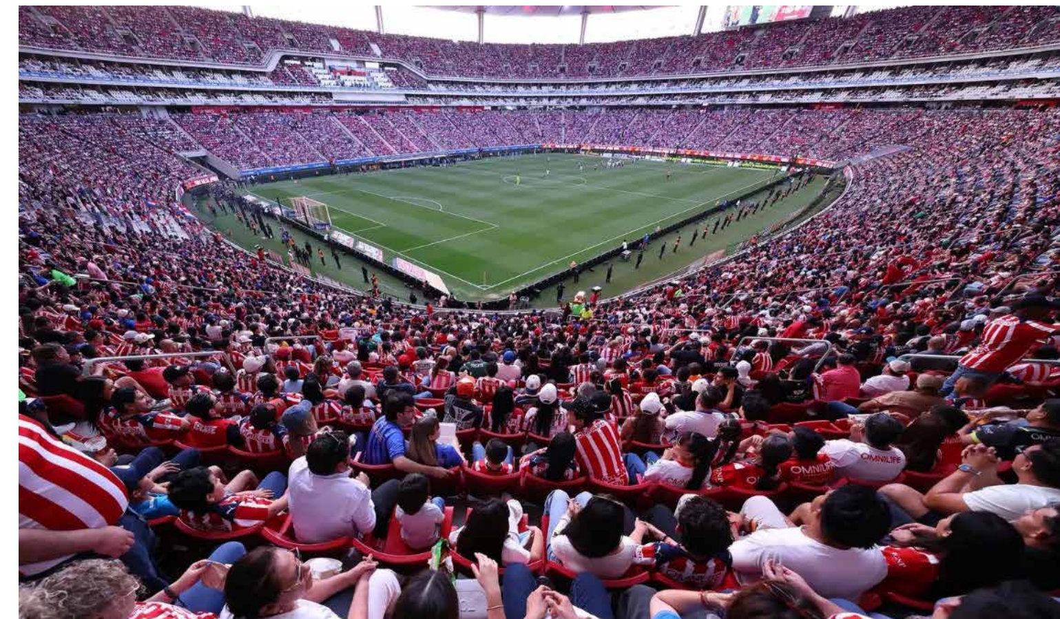
Del Estadio Jalisco al Akron, la evolución de Chivas refleja también la transformación del fútbol mexicano: de símbolo popular a una de las marcas deportivas más valiosas del país.

Muchas familias subsisten precariamente y el receptor casero es insuficiente, puesto que el ambiente en un mundial es único e incluso en nuestro torneo casero de la Liga MX dejan prácticamente un padre de familia sin su salario, pero con la “satisfacción” de asistir al estadio para ver en vivo a sus equipos favoritos.