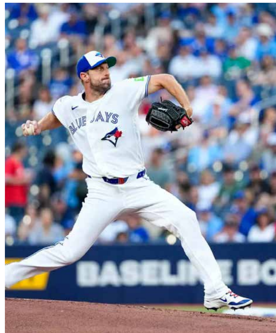
Max Scherzer. Logró 3,500 ponches.

En 1959, con Chihuahua en la Liga Nacional (9); el mismo año en Acámbaro, Liga del Bajío (16); 1960-1961, con San Luis Potosí, Liga Central (28); 1964, Jacksonville, Liga Internacional Triple A (3); 1960-1961, Cd. Obregón, Liga Invernal de Sonora (1); 1960-1984, con Hermosillo, LMP (268), y 1962-1984, con varios equipos de la LMB (453). Total, 808.