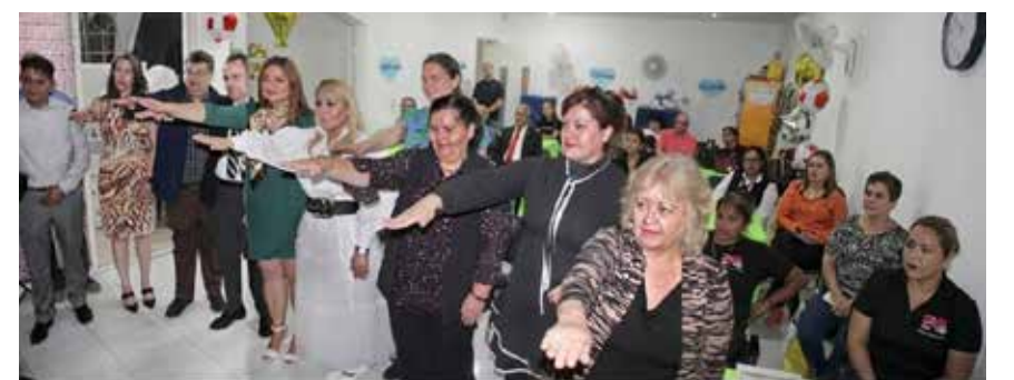
CON LA FIRME CONVICCIÓN, A TRAVÉS DE LA ACEPTACIÓN JURÍDICA, formal y solemne, de decir ¡Si protesto! aseveran con firmeza el compromiso de cumplir con el sentido de pertenencia, es trabajo en equipo, fortalecernos para lograr en unidad nuestra misión, visión, fin, como lo reza nuestro lema: Integridad profesional en pro del interés superior de la infancia y las familias.