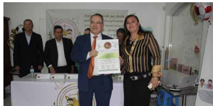
FILÁNTROPA Y DIRECTORA DE TEQUILA CONDESA DEL RÍO, distinguida por su labor como promotora de la paz, el humanismo y la responsabilidad social, así como por su apoyo a causas relacionadas con la protección animal, el derecho a la vida y el impulso de liderazgos juveniles.