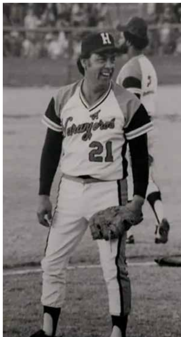
Héctor Espino. El mejor bateador mexicano de todos los tiempos.

En 1976, se bautizó con su ilustre nombre al estadio, llamado desde 1972 como “El Gigante” o “El Coloso” del Choyal,