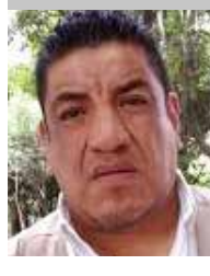
Por | Daniel Emilio Pacheco