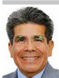
Por | Francisco Javier Ruiz Quirín