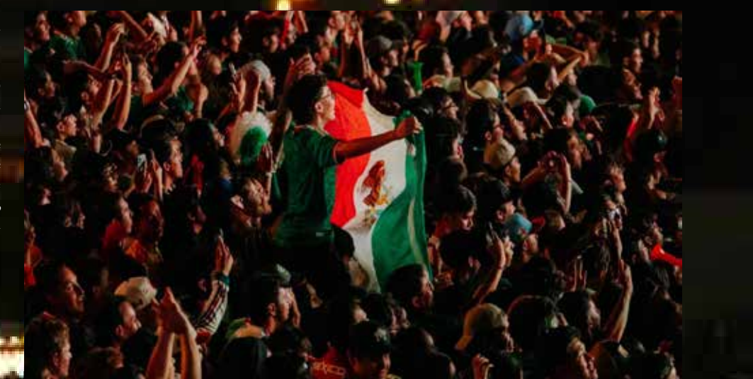
Brazos al cielo, sonrisas y cánticos acompañaron una jornada en la que Guadalajara volvió a vivir el fútbol como una auténtica fiesta colectiva.