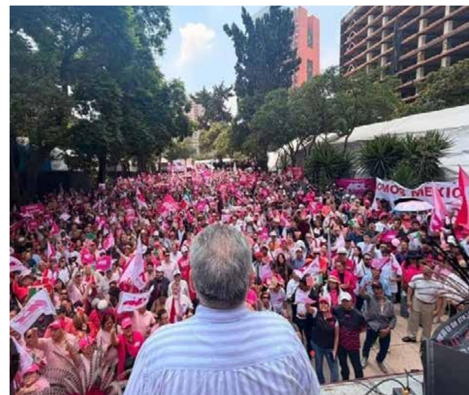
La génesis de Somos México fueron las marchas de la Marea Rosa en defensa del INE y la democracia en México.

No podemos vivir con tantas fobias; la radicalización es tal que ya no se puede tener una plática en cualquier mesa. Llevamos años divididos entre “chairros” y “fifis”.