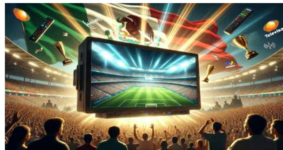
tales demuestran que la convergencia entre televisión, radio, streaming y redes sociales ha transformado la forma en que millones de personas viven el deporte. Las cifras pre-