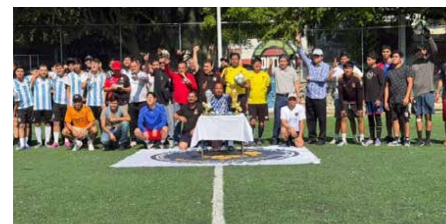
LA PROMOCIÓN DEL DEPORTE Y LA CULTURA es otra de las actividades que impulsa la Fundación "Somos Manos Tapatías" con eventos en las colonias de Guadalajara.