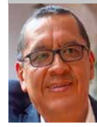
Por | Gerardo Rico