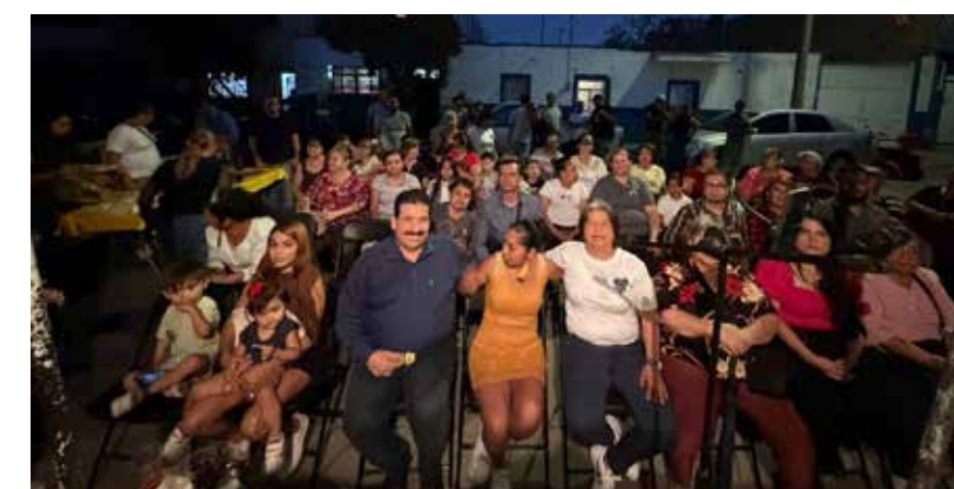
ASAMBLEA DE VECINOS en la Colonia Lagos de Oriente en Guadalajara.