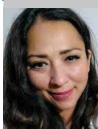
Por | Mónica Ortiz