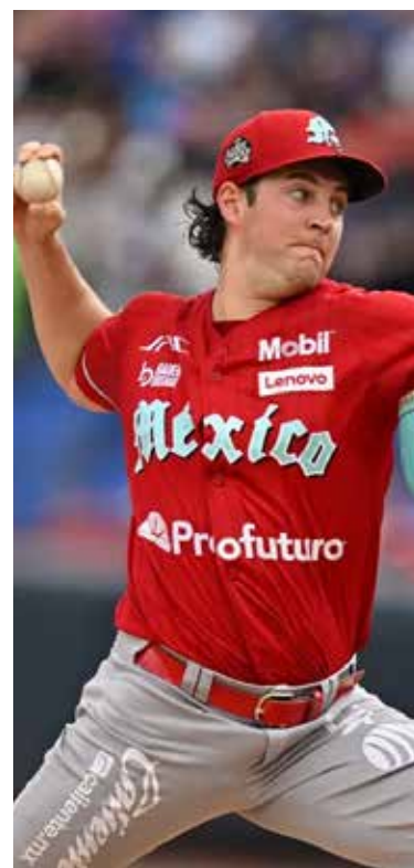
Trevor Bauer regresó al roster de Diablos Rojos.