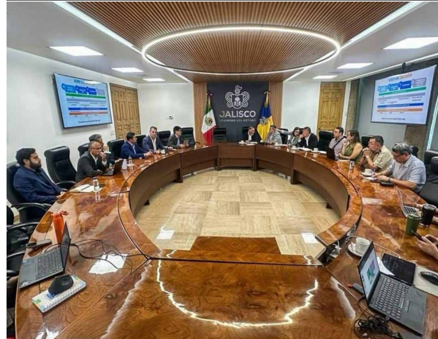
Autoridades estatales detallaron más de 30 acciones de corto, mediano y largo plazo para modernizar la infraestructura hidráulica, mejorar la potabilización y resolver el rezago histórico que afecta a miles de familias en el área metropolitana.

Como parte del arranque del programa, el Gobierno de Jalisco creó un fondo inmediato superior a los 5 mil millones de pesos, con recursos exclusivamente estatales, para financiar las primeras intervenciones prioritarias. Este recurso ya está en operación y permitirá iniciar obras sin depender de esquemas de financiamiento adicionales en la etapa inicial