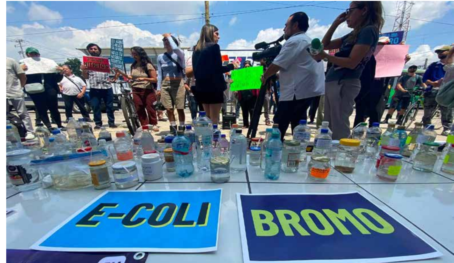
Botellas con muestras de agua de distintas colonias fueron colocadas frente a la COPRISJAL como evidencia de la contaminación denunciada por organizaciones civiles.