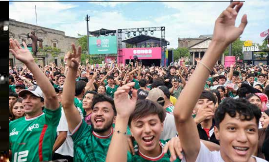
Miles de personas abarrotaron el FIFA Fan Fest del Centro Histórico de Guadalajara, donde el Mundial convirtió una plaza pública en el punto de encuentro de una afición que volvió a creer.

Esa victoria no aparecerá en las estadísticas. Pero quizá sea una de las más importantes que el fútbol mexicano ha conseguido en muchos años.