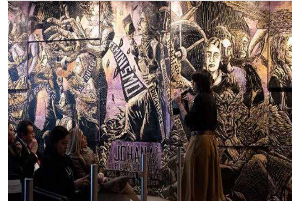
Las históricas y el presente, es el mural de Johana Plascencia que está en el Tribunal Electoral de Jalisco inaugurado en 20205 y es recorrido visual por las luchas de mujeres que, como bien señala la artista, no siempre han sido visibilizadas, pero que han abierto camino para

“El muralismo evolucionó hacia lo comercial y perdió su sentido crítico. La función inicial, con el plan de Vasconcelos, era alfabetizar y despertar conciencia. Hoy, el muralismo ha dejado las formas figurativas por abstracciones y texturas que generan un desapego en el espectador, sumergiéndose en una dinámica de mercantilismo donde importa la producción y no el contenido”.