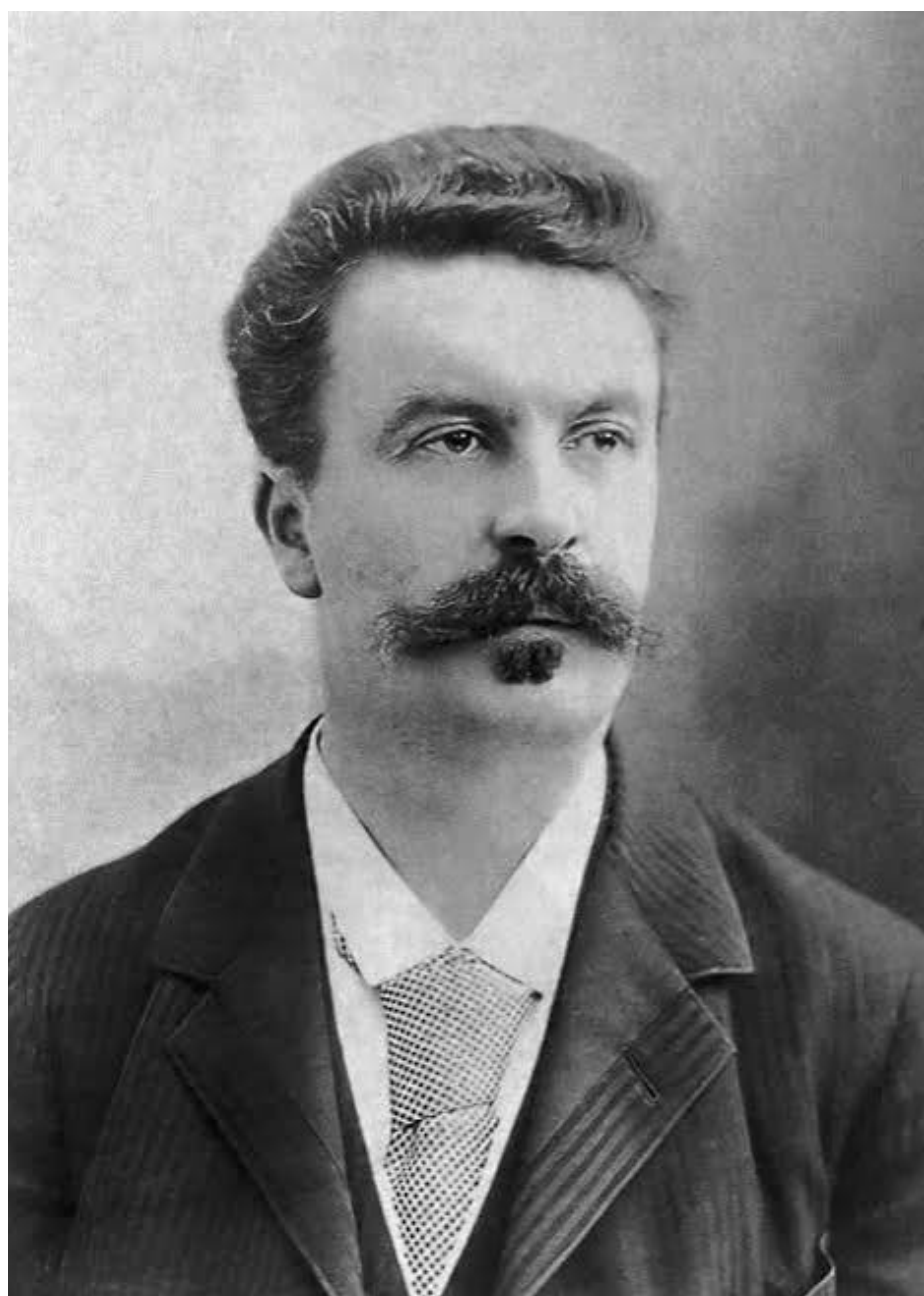
La obra de Guy de Maupassant continúa influyendo en generaciones de escritores más de un siglo después de su muerte.

Aunque escribió novelas tan importantes como Bel-Ami, Pierre y Jean y Una vida, fue el cuento el género donde alcanzó