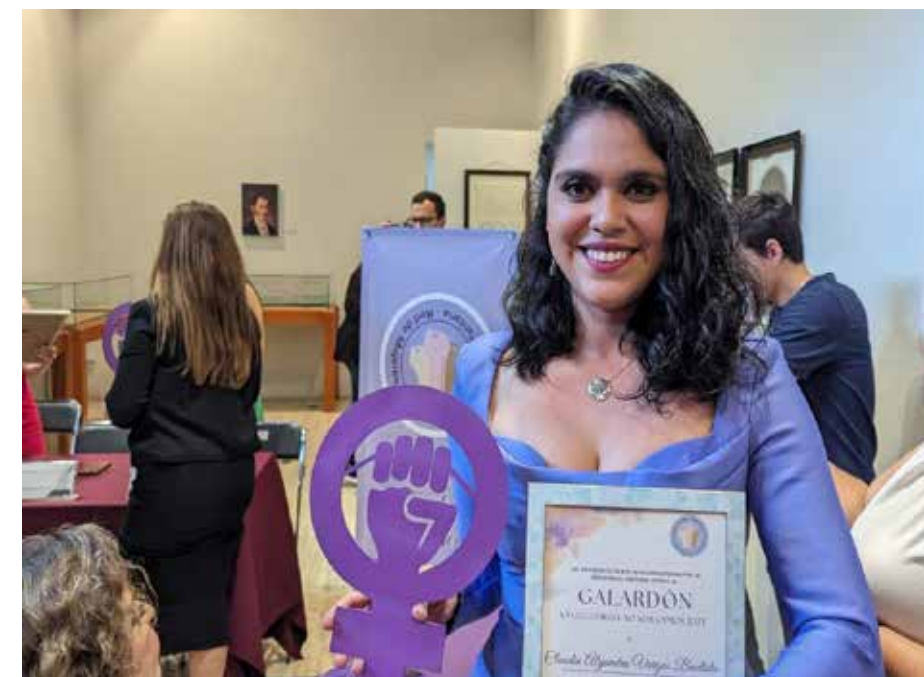
La presidenta provisional del IEPCJ ha participado en misiones internacionales de observación electoral y en proyectos relacionados con inclusión, paridad, participación ciudadana, educación cívica, gobierno abierto, innovación tecnológica y el voto de las y los jaliscienses residentes en el extranjero.

electoral, así como en Mecanismos Alternativos de Solución de Controversias (MASC) y Cultura de Paz.