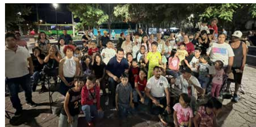
ASAMBLEA DE VECINOS en la colonia el Zalate en Guadalajara.