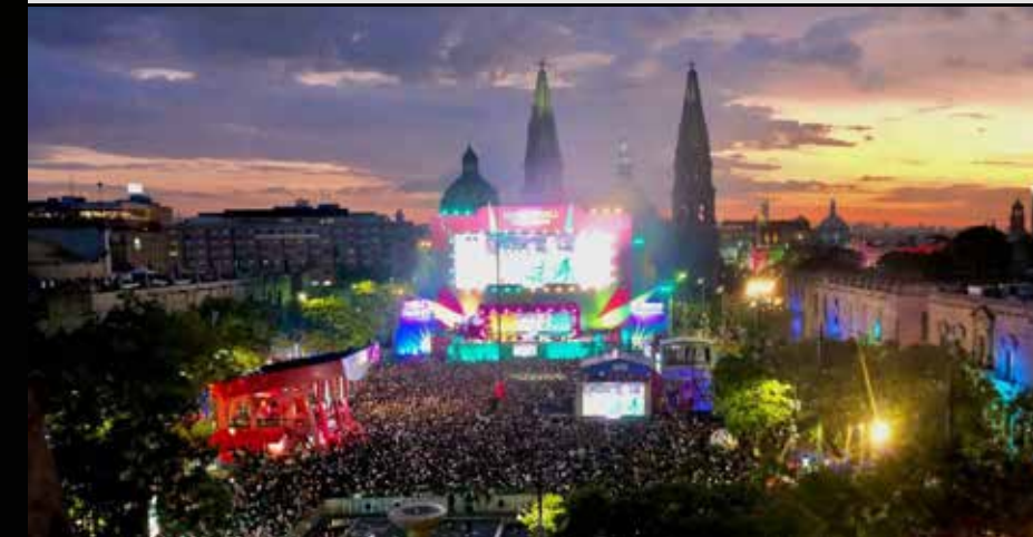
Entre banderas, cánticos y miles de voces, la afición mexicana volvió a abrazar una pregunta que parecía olvidada: ¿y si sí?

Pero hay algo que este Mundial ya consiguió. Logró que un país acostumbrado a despedirse demasiado pronto volviera a permitirse el lujo de soñar. Logró que desconocidos se abrazaran en las calles, que las familias salieran juntas a festejar, que los niños vieran a sus padres emocionarse y que una generación entera recuperara, aunque fuera por una noche, la fe en una camiseta.