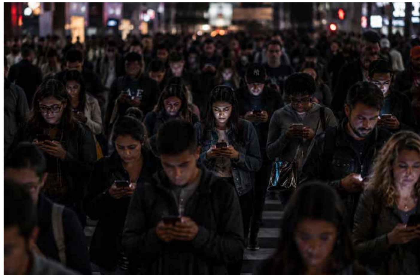
La atención se ha convertido en uno de los recursos más valiosos de la era digital, redefiniendo aquello que como sociedad decidimos admirar.

Sin embargo, sería injusto responsabilizar exclusivamente a las plataformas. Al final, los algoritmos no hacen otra cosa que amplificar nuestras propias preferencias. Si el contenido basado en la ostentación, el escándalo o el exceso alcanza millones de reproducciones, es porque millones de