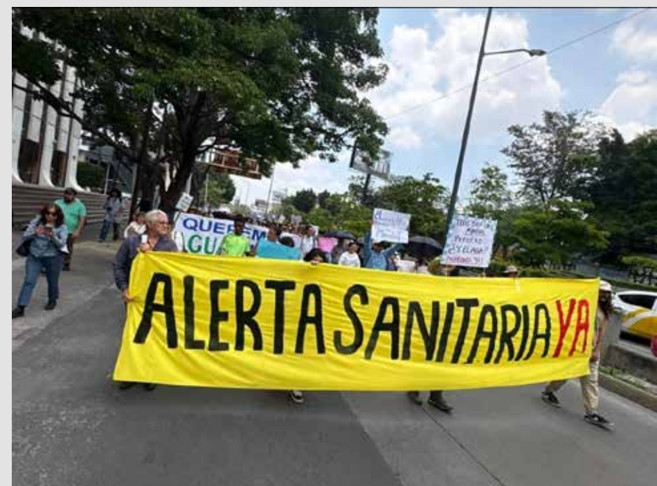
Colectivos y organizaciones sociales exigen soluciones ante la mala calidad del agua del SIAPA y el pasado sábado protestaron ante las puertas de Casa Jalisco.

Defendió la inversión superior a los 20 mil millones de pesos y obras como la