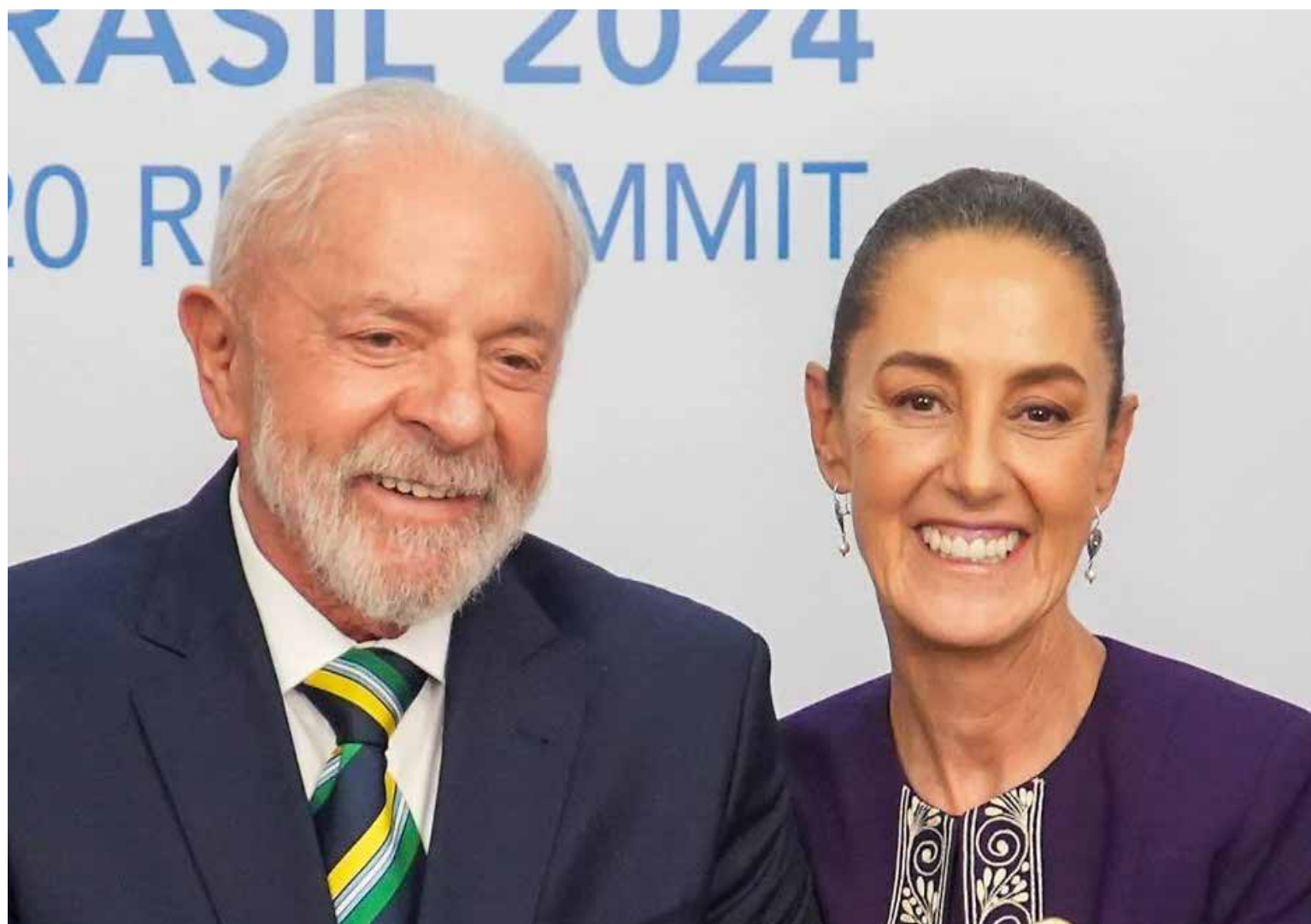
México y Brasil son presentados como los principales contrapesos políticos frente al avance de la ultraderecha en la región.

A los acontecimientos electorales anteriores, habremos de sumar lo registrado anteriormente en Argentina, Bolivia, Ecuador y Chile donde triunfaron los aspirantes presidenciales que se alinearon con los injerencismos trumpistas. En el caso del "che" Javier Milei, ya sabemos lo desafortado que